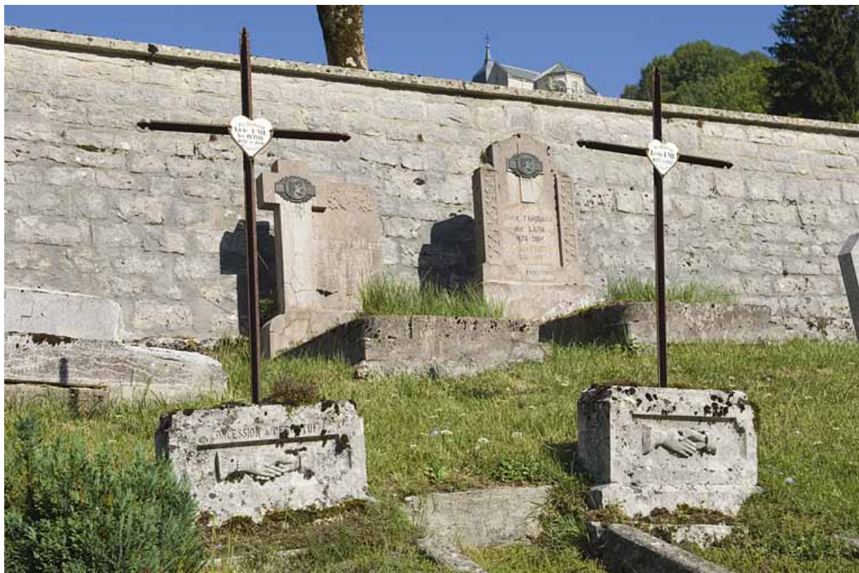
Vue d'ensemble des tombeaux d'Adèle Eme et de Léon Eme.

25, Jougne 15e tombeau, lieudit : la Ferrière