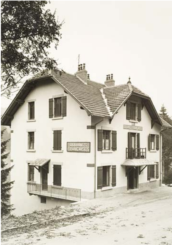
Vue du bureau de douane.