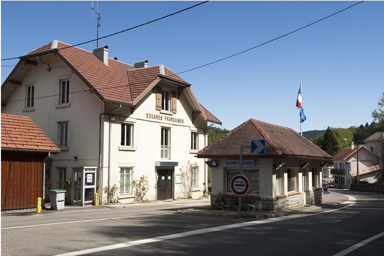
Vue du bureau des douanes et du poste de surveillance.