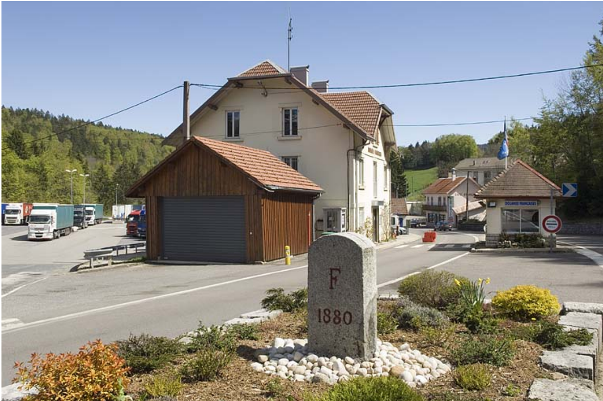
Vue d'ensemble des bâtiments de la douane.