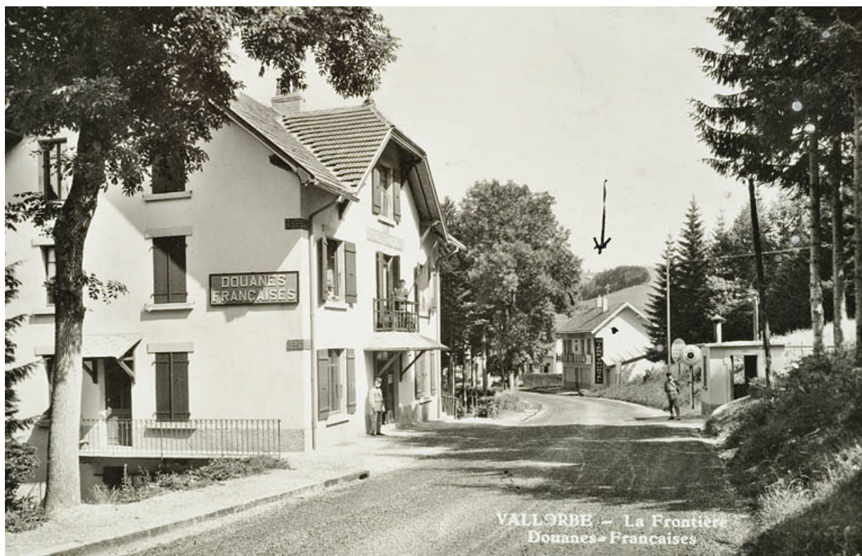
VALLORBE-La Frontière-Douanes Françaises.