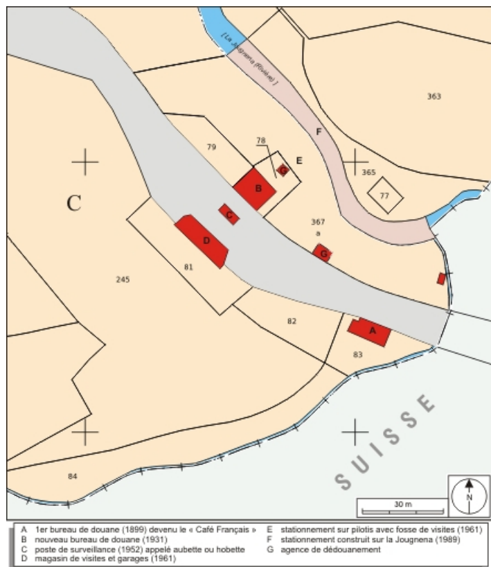
Plan masse et de situation. Extrait du plan cadastral, 2008, section C, échelle 1/1 000. 25, Jougne, lieudit : la Ferrière