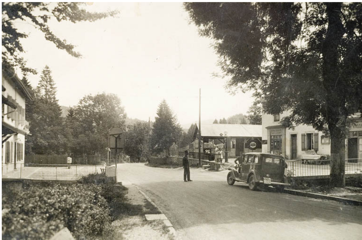
Café du Vallon. E. Maeder- Chocolats et Tabacs- Vallorbe- Frontière [Vue générale en direction de la douane suisse] 25, Jougne, lieudit : la Ferrière

Carte postale, 1936 [cachet de la poste], Edition Art Perriochet-Matile, S.A. Lausanne. Lieu de conservation : collection particulière