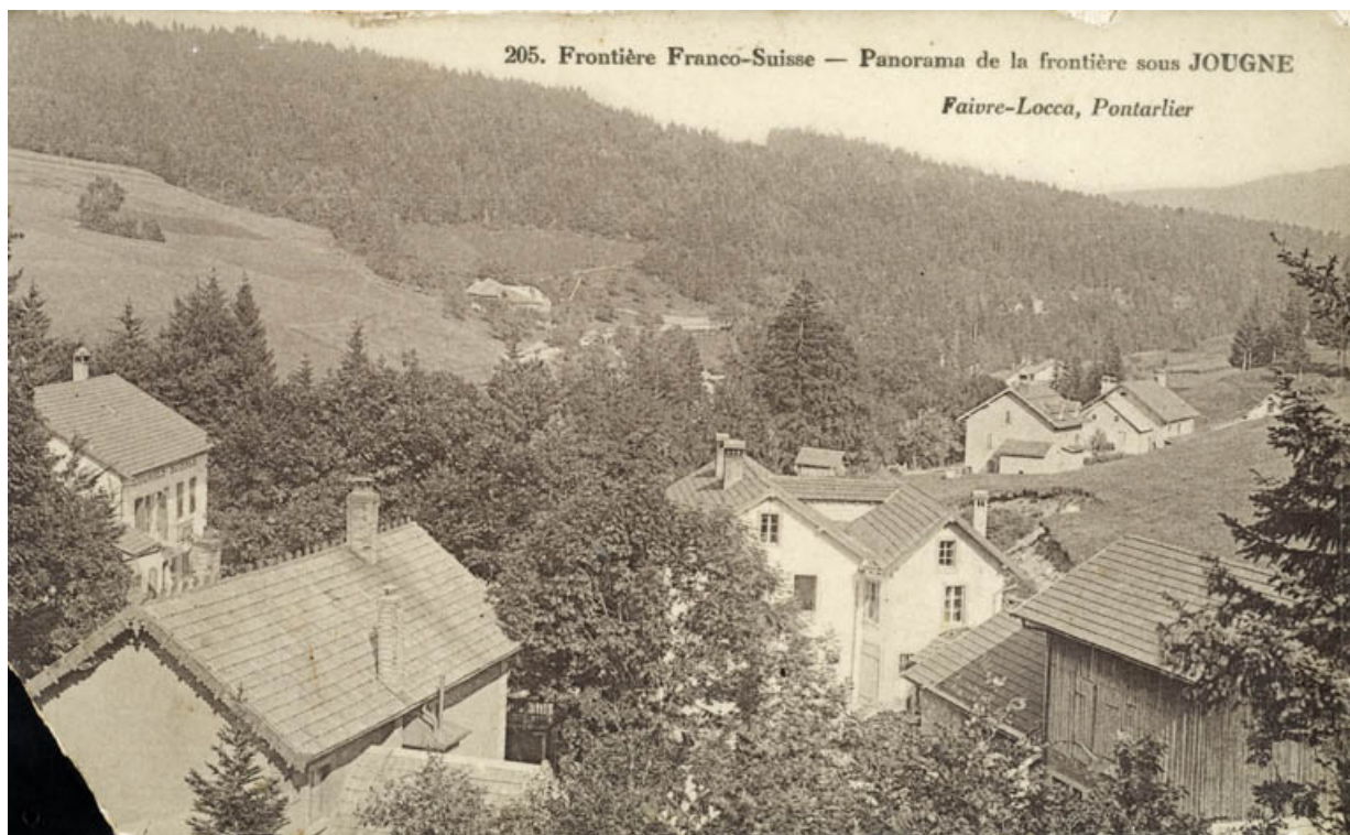
205. Frontière Franco-Suisse - Panorama de la frontière sous Jougne, [1ère moitié 20e siècle]. 25, Jougne, lieudit : la Ferrière