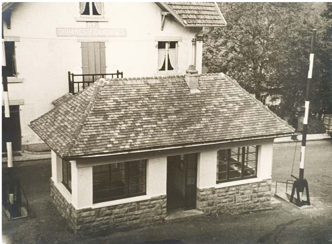
Poste de surveillance dit "aubette" ou "hobette".