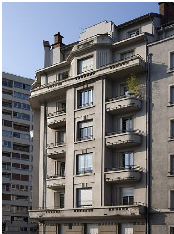
Façade située rue de la Mouillère.

25, Besançon avenue Edouard Droz, lieudit : îlot Casino