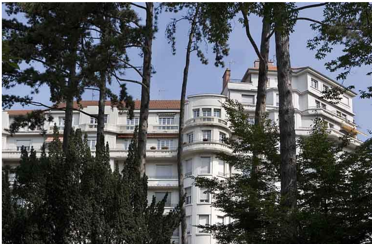
Vue des façades depuis la promenade Micaud.

25, Besançon avenue Edouard Droz, lieudit : îlot Casino