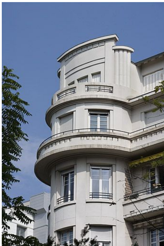
Détail de l'avant corps arrondi : partie supérieure, de trois quarts droit.

25, Besançon avenue Edouard Droz, lieudit : îlot Casino