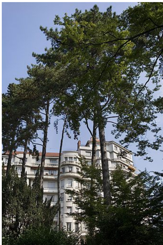
Vue des façades depuis la promenade Micaud.

25, Besançon avenue Edouard Droz, lieudit : îlot Casino