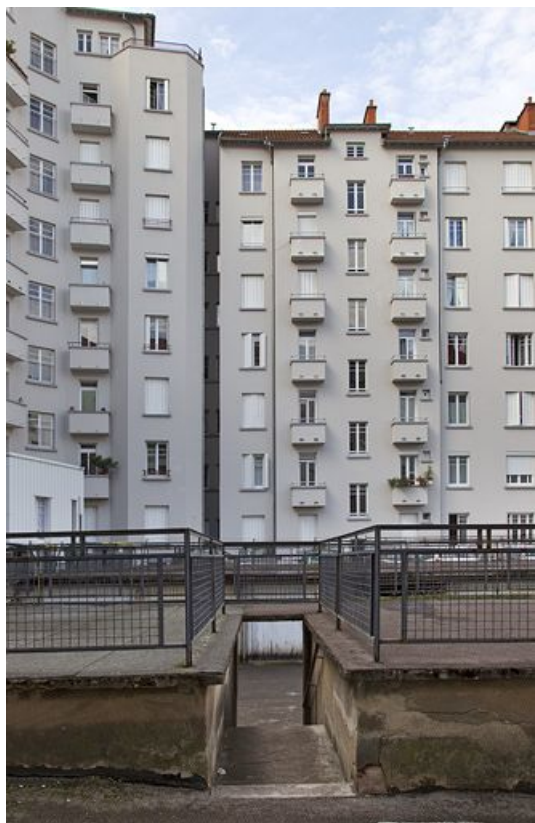
Cour des garages, vue latérale rapprochée.

25, Besançon avenue Edouard Droz, lieudit : îlot Casino