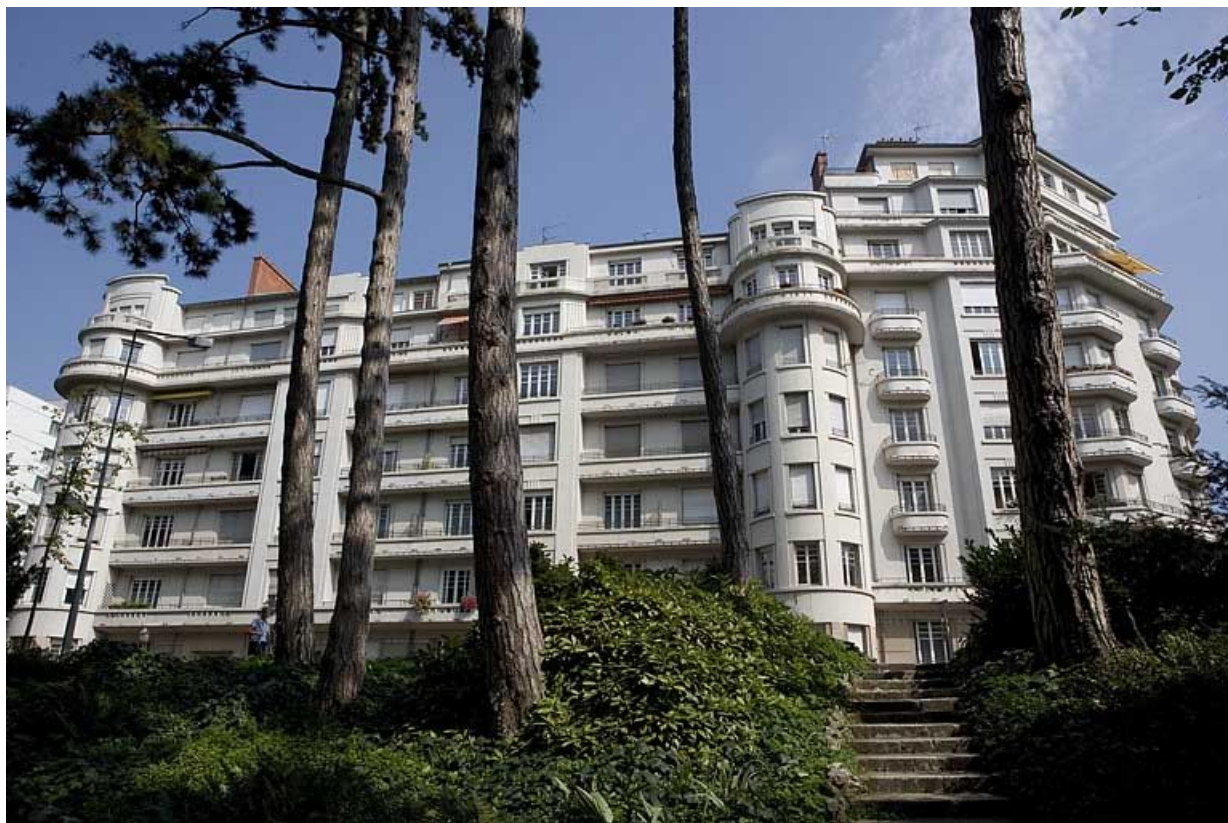
Vue d'ensemble depuis la promenade Micaud.

25, Besançon avenue Edouard Droz, lieudit : îlot Casino