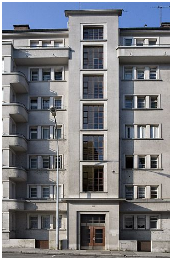
Détail d'une façade sur cour.

25, Besançon avenue Edouard Droz, lieudit : îlot Casino