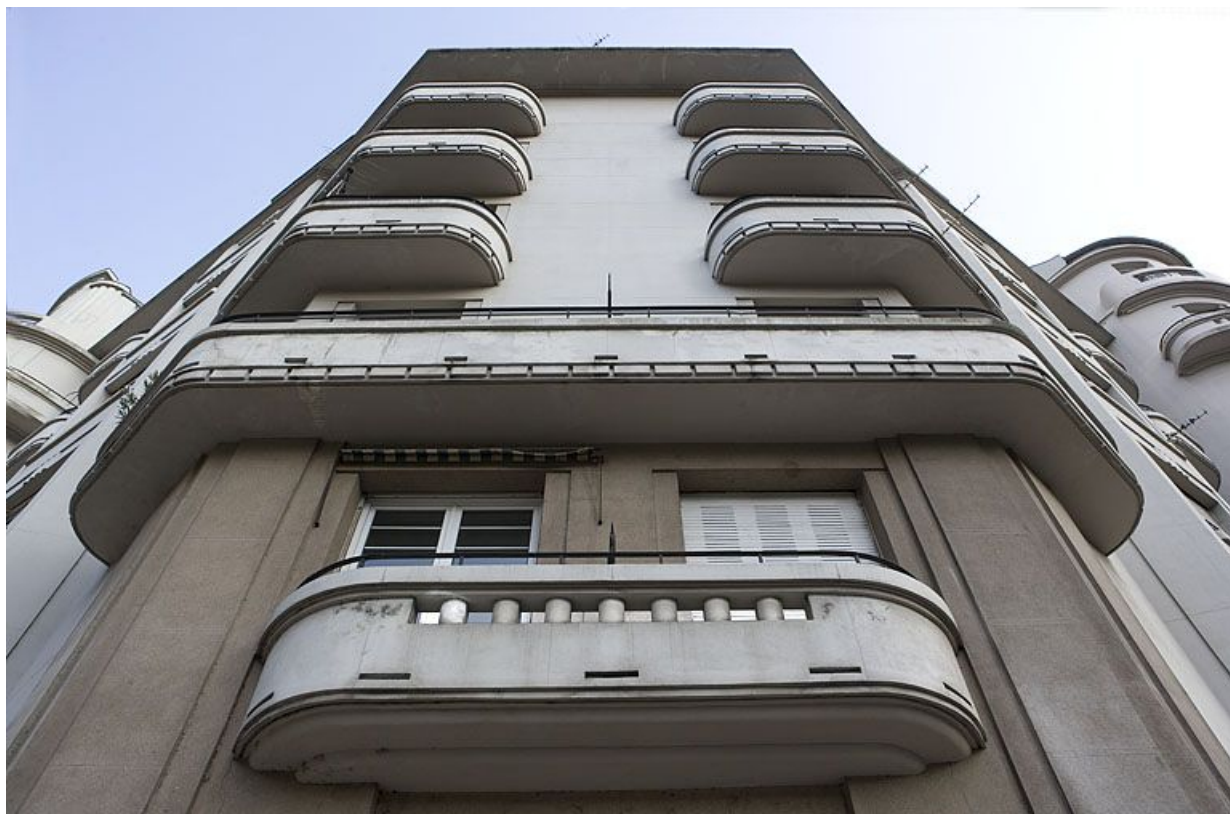
Pan coupé : vue des balcons en contre-plongée.

25, Besançon avenue Edouard Droz, lieudit : îlot Casino