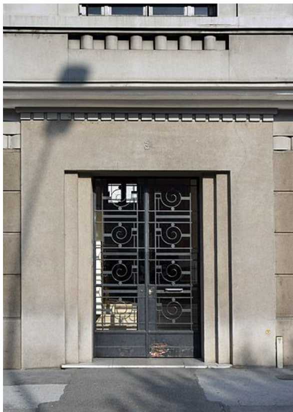
Porte d'entrée d'un immeuble.

25, Besançon avenue Edouard Droz, lieudit : îlot Casino