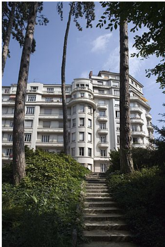
Vue d'ensemble depuis la promenade Micaud.

25, Besançon avenue Edouard Droz, lieudit : îlot Casino