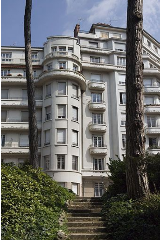
Façades depuis la promenade Micaud : vue partielle. 25, Besançon avenue Edouard Droz, lieudit : îlot Casino