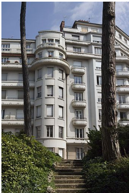
Façades depuis la promenade Micaud : vue partielle. 25, Besançon avenue Edouard Droz, lieudit : îlot Casino