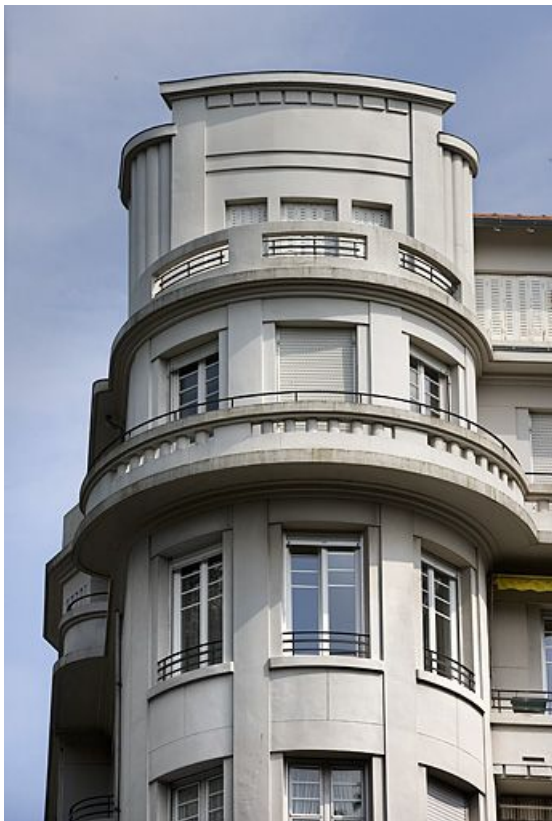
Détail de l'avant-corps arrondi, côté hôtel Mercure. 25, Besançon avenue Edouard Droz, lieudit : îlot Casino