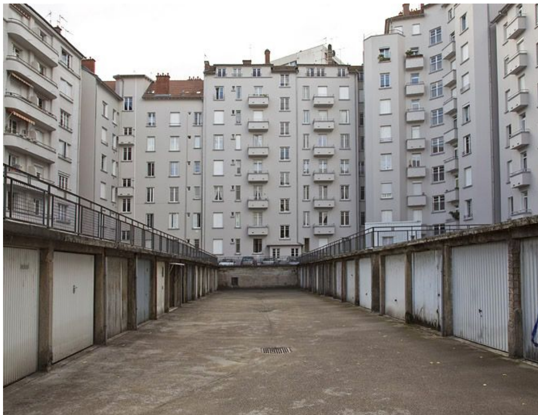
Cour des garages, de face.

25, Besançon avenue Edouard Droz, lieudit : îlot Casino