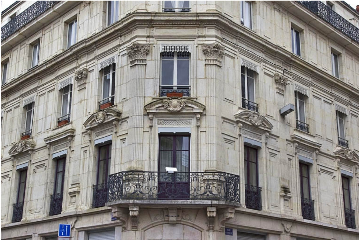
Vue d'ensemble de l'angle à pan coupé à partir du premier étage.

25, Besançon, 12 rue Proudhon, lieudit : îlot Saint-Amour