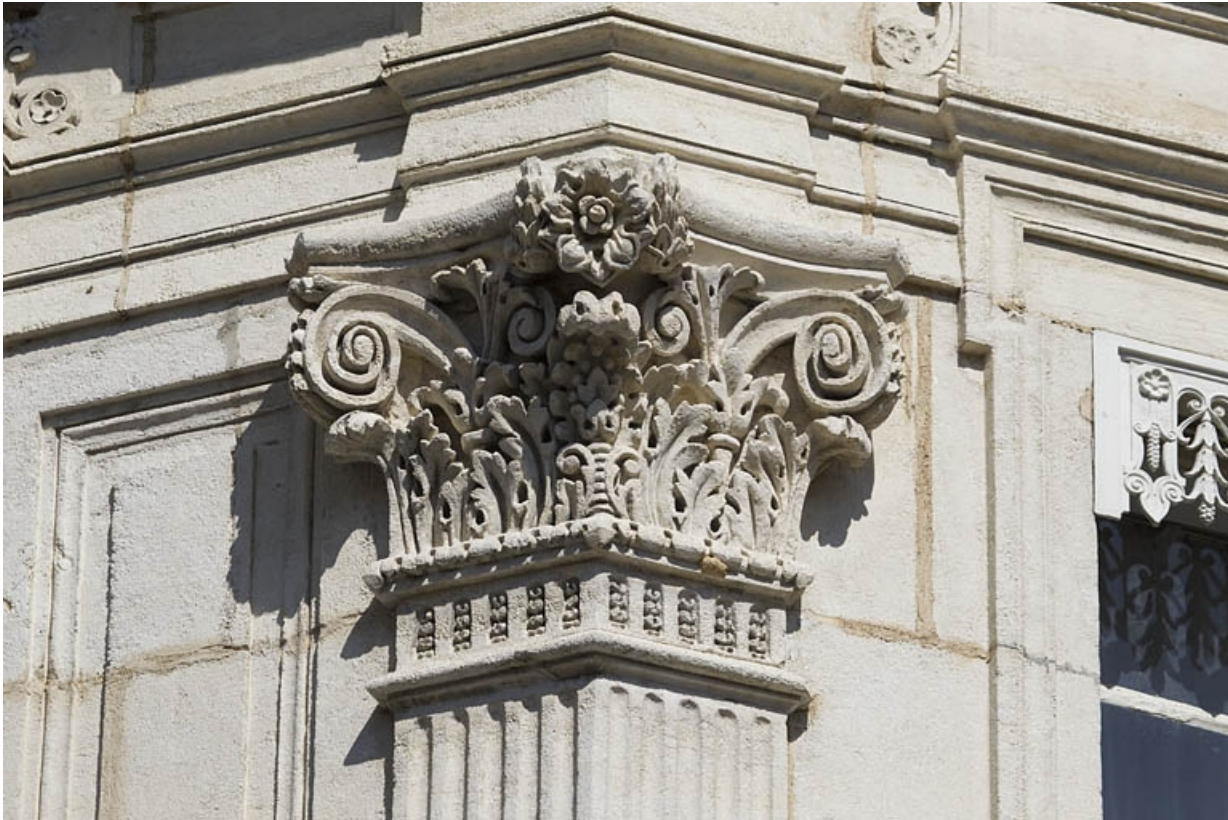
Façade antérieure, décor, pilastre d'angle : détail d'un chapiteau corinthien.

25, Besançon, 12 rue Proudhon, lieudit : îlot Saint-Amour