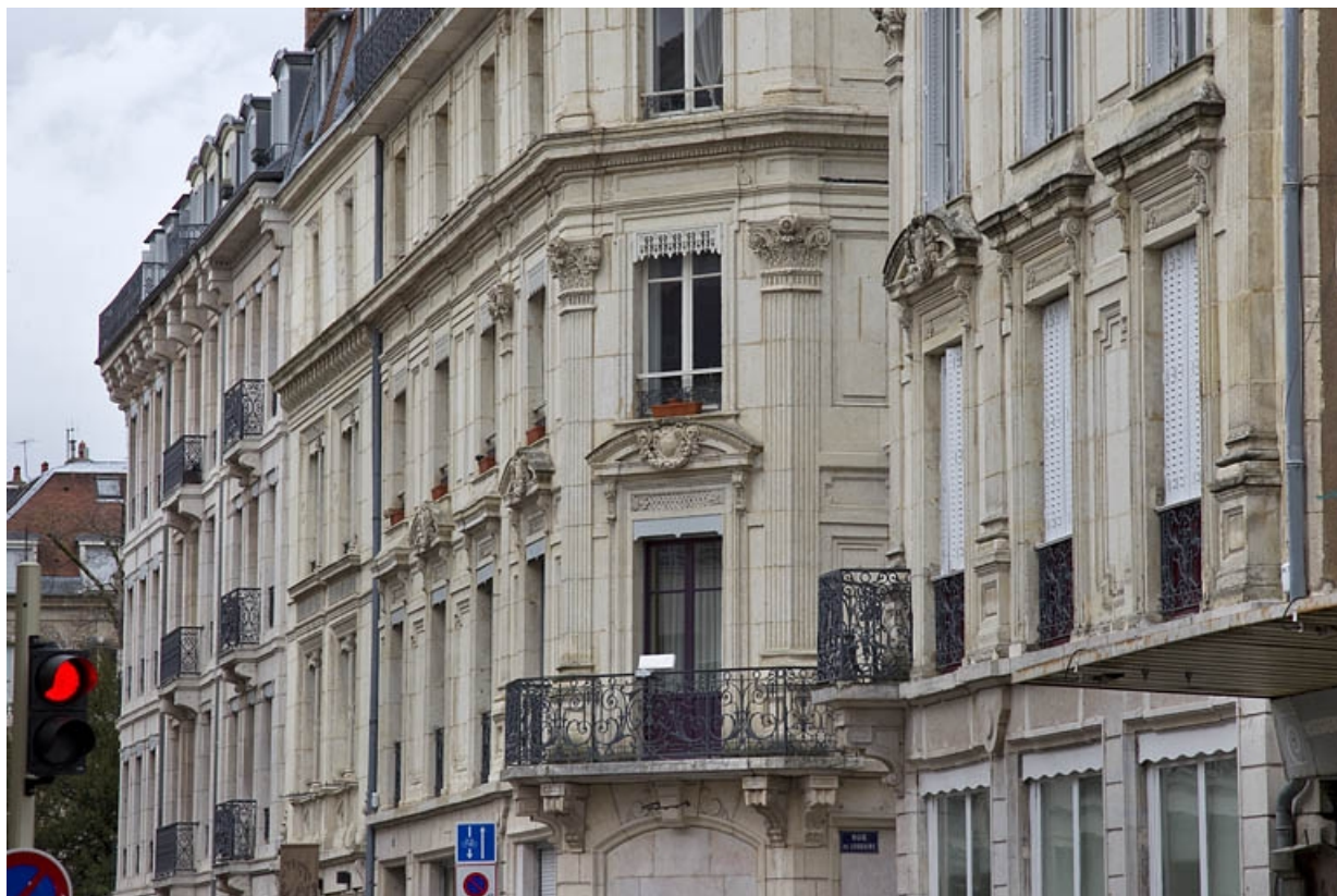
Vue d'ensemble du pan coupé et de la façade sur la rue Proudhon à partir du premier étage, de trois quarts droit. 25, Besançon, 12 rue Proudhon, lieudit : îlot Saint-Amour