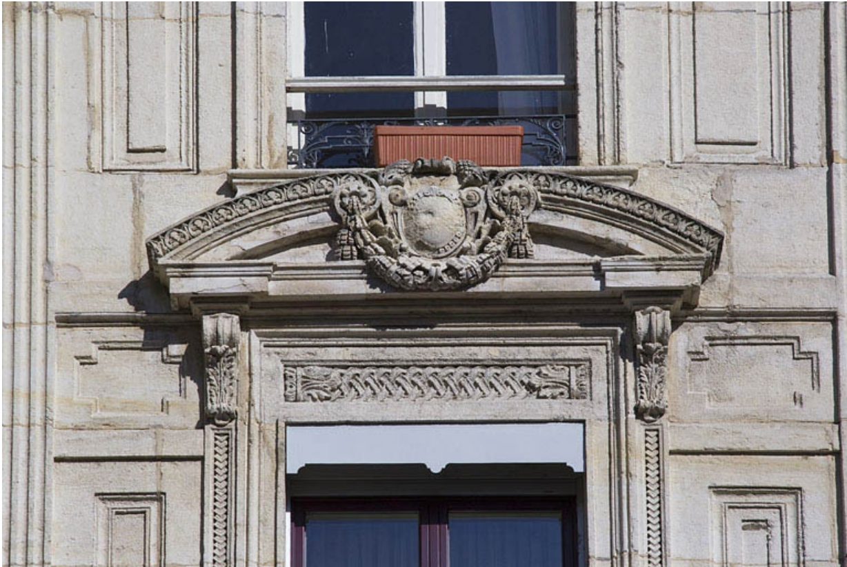
Façade antérieure, angle à pan coupé : détail du fronton cintré ornant la baie du premier étage.

25, Besançon, 12 rue Proudhon, lieudit : îlot Saint-Amour