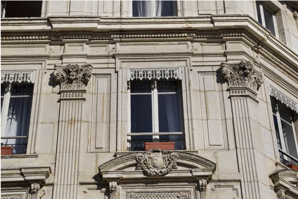
Façade antérieure, décor : détail de deux pilastres cannelés à chapiteaux corinthiens.

25, Besançon, 12 rue Proudhon, lieudit : îlot Saint-Amour