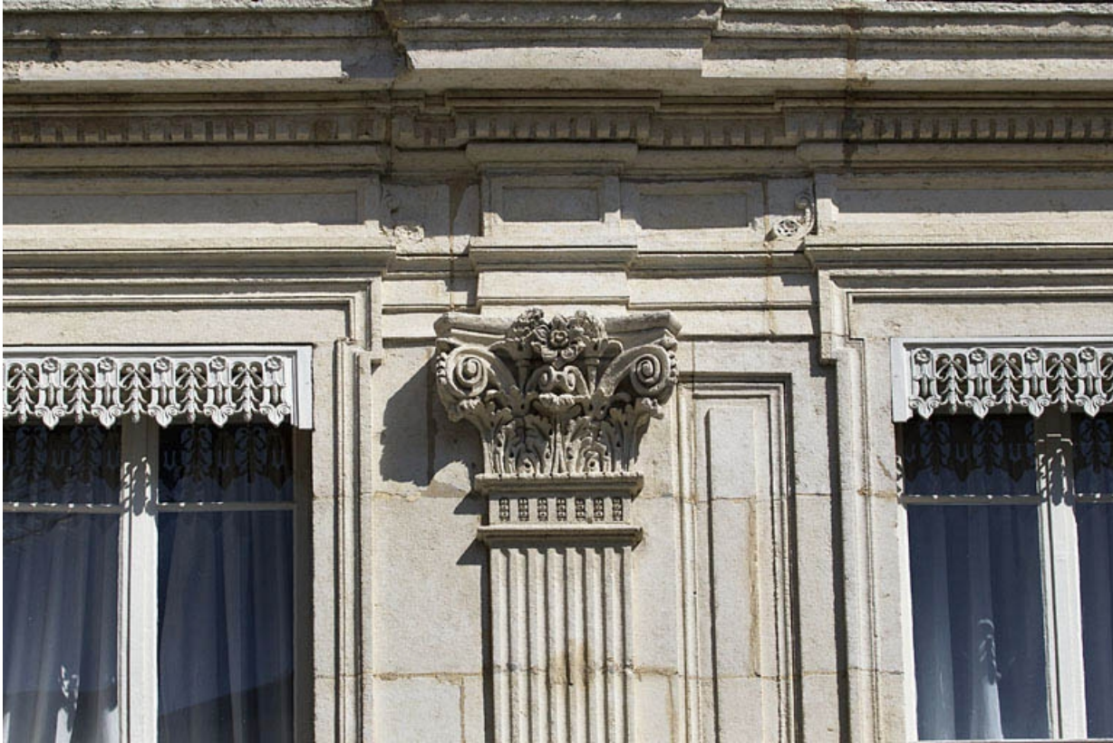
Façade antérieure, décor : détail d'un chapiteau corinthien.

25, Besançon, 12 rue Proudhon, lieudit : îlot Saint-Amour