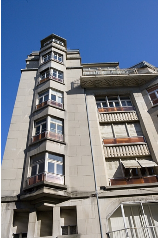
Façade antérieure : détail de la partie gauche.

25, Besançon, 26 rue Proudhon, lieudit : îlot Pierre Bayle