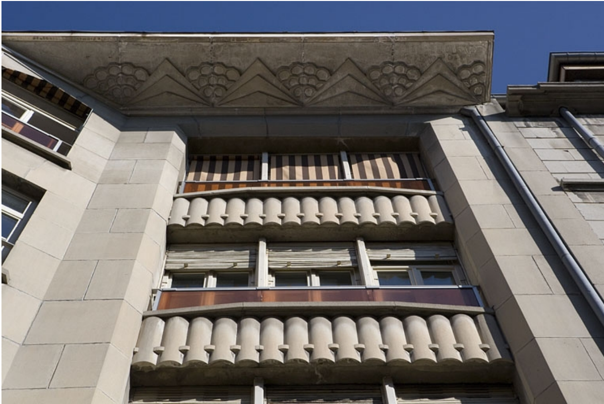
Partie gauche : détail du décor du dessous du balcon et des fenêtres.

25, Besançon, 26 rue Proudhon, lieudit : îlot Pierre Bayle