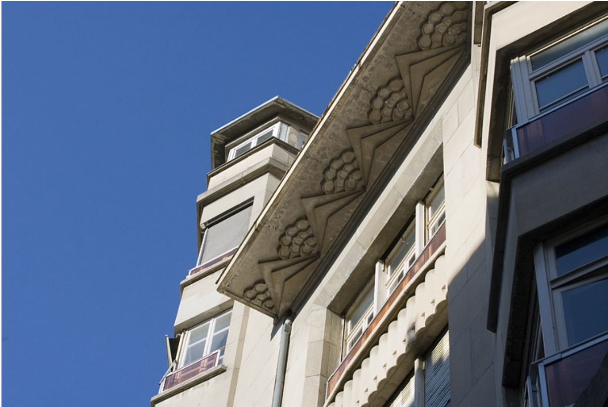
Balcon, partie gauche : détail du décor de la dalle.

25, Besançon, 26 rue Proudhon, lieudit : îlot Pierre Bayle