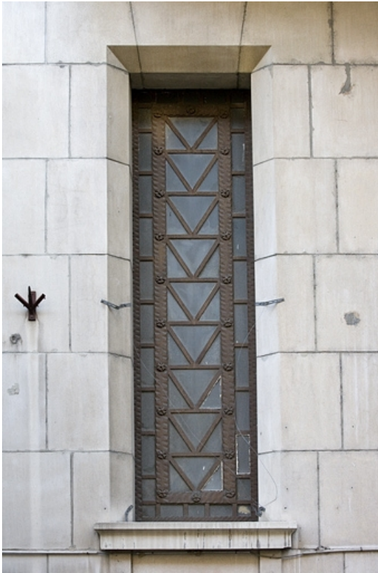
Détail d'une fenêtre à gauche du portail d'entrée.

25, Besançon, 26 rue Proudhon, lieudit : îlot Pierre Bayle