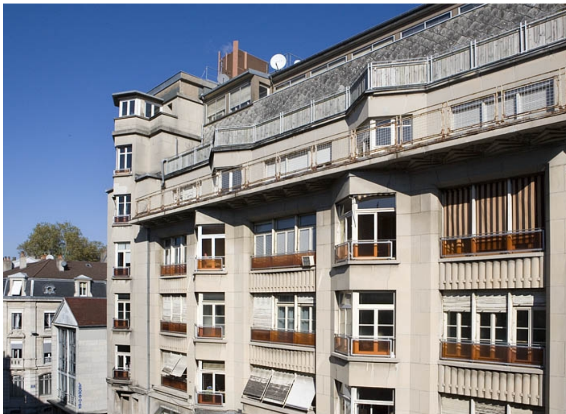
Façade antérieure : détail des étages supérieurs.

25, Besançon, 26 rue Proudhon, lieudit : îlot Pierre Bayle