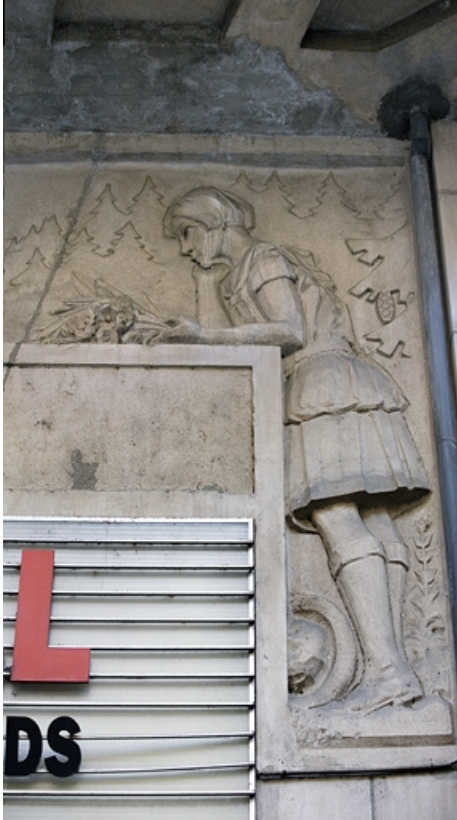
Portail d'entrée, décor en bas-relief : la jeune fille.

25, Besançon, 26 rue Proudhon, lieudit : îlot Pierre Bayle