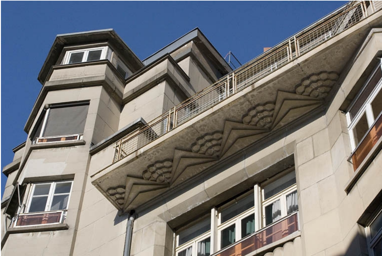
Balcon, partie gauche : détail du décor de la dalle.

25, Besançon, 26 rue Proudhon, lieudit : îlot Pierre Bayle