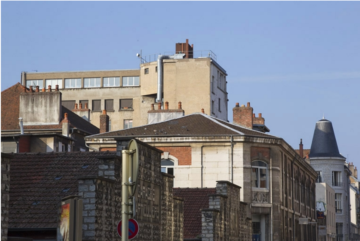
Façade postérieure : vue éloignée.

25, Besançon, 26 rue Proudhon, lieudit : îlot Pierre Bayle