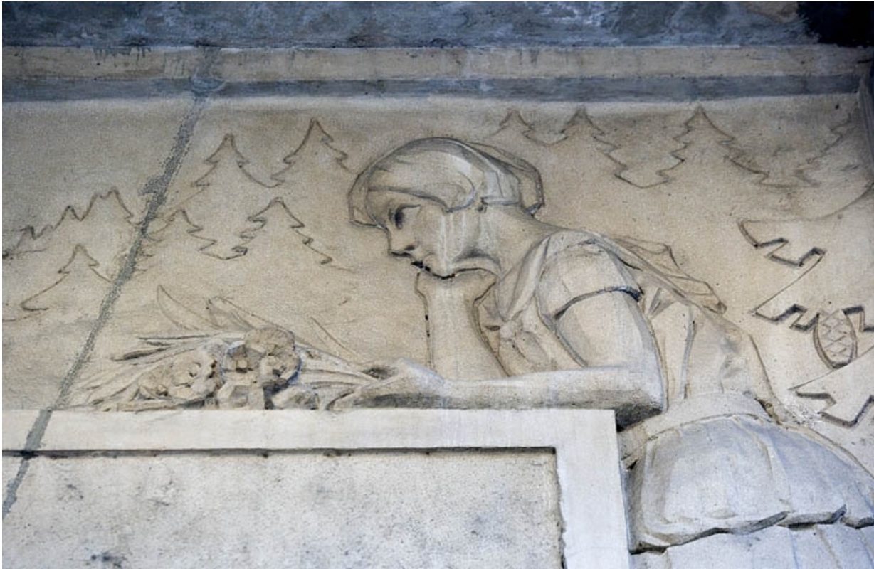
Portail d'entrée : détail du bas-relief droit, buste de la jeune fille.

25, Besançon, 26 rue Proudhon, lieudit : îlot Pierre Bayle