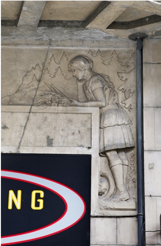
Détail du décor de l'entrée en bas-relief : la jeune fille.

25, Besançon, 26 rue Proudhon, lieudit : îlot Pierre Bayle