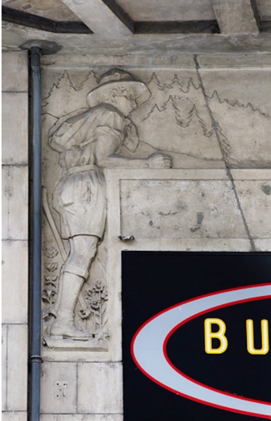
Détail du décor de l'entrée en bas-relief : le montagnard.

25, Besançon, 26 rue Proudhon, lieudit : îlot Pierre Bayle