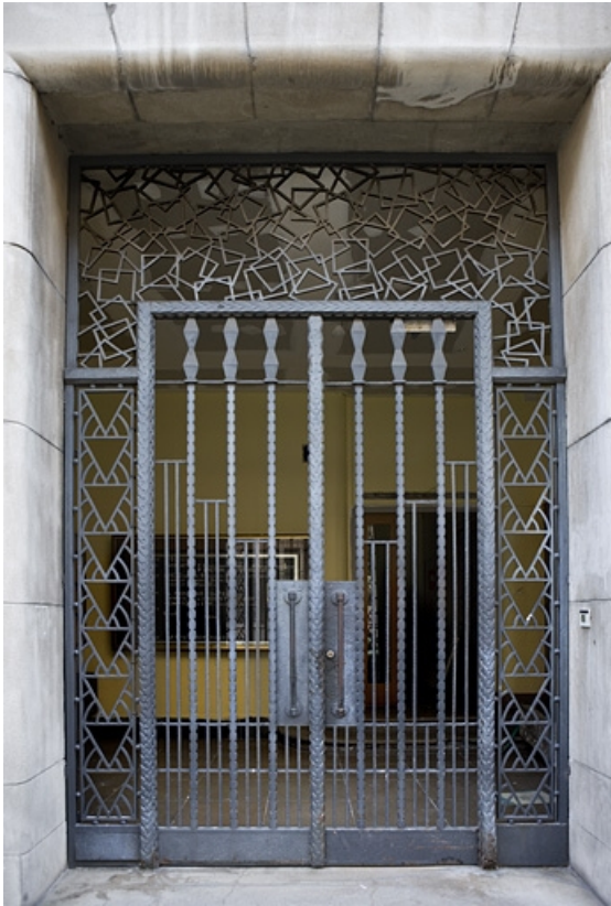
Portail d'entrée : détail de la grille.

25, Besançon, 26 rue Proudhon, lieudit : îlot Pierre Bayle