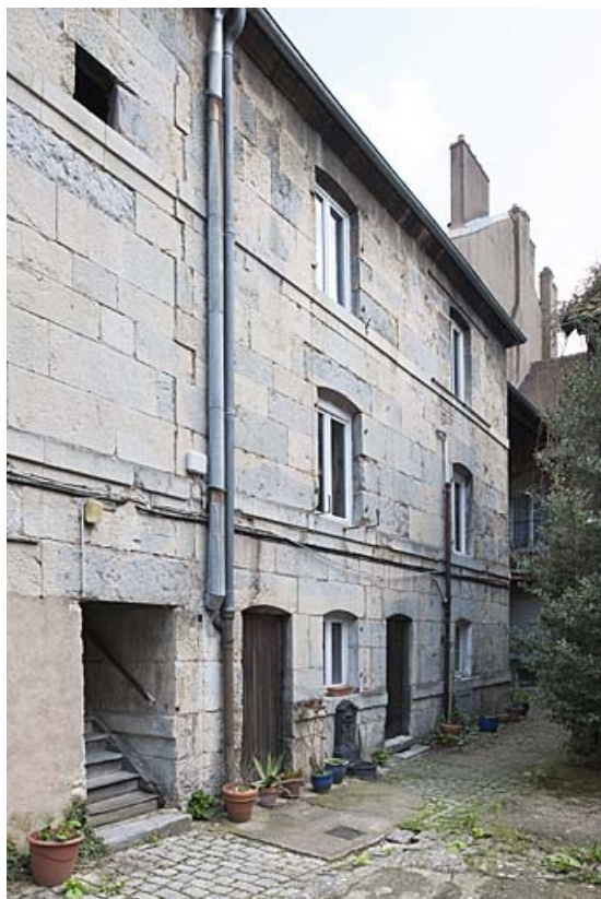
Vue d'ensemble du premier logis secondaire de trois quarts gauche.

25, Besançon, 47 rue Bersot, lieudit : îlot Lorraine