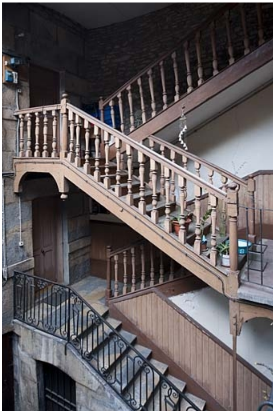
Détail de l'escalier à cage ouverte de trois quarts droit.

25, Besançon, 47 rue Bersot, lieudit : îlot Lorraine