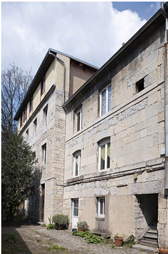
Logis secondaires : vue d'ensemble de trois quarts droit.

25, Besançon, 47 rue Bersot, lieudit : îlot Lorraine