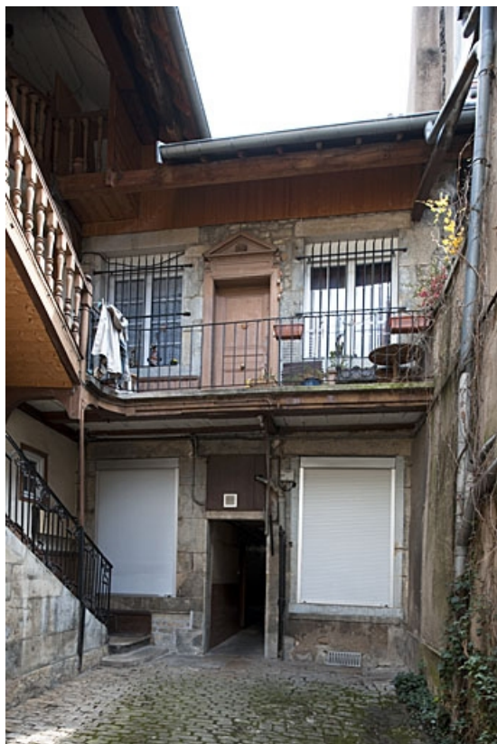
Vue d'ensemble de la façade postérieure du logis principal.

25, Besançon, 47 rue Bersot, lieudit : îlot Lorraine