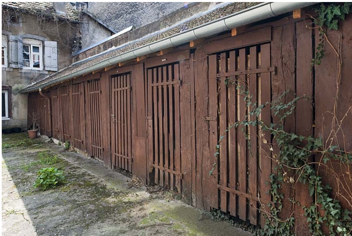
Vue d'ensemble des bûchers de trois quarts droit.

25, Besançon, 47 rue Bersot, lieudit : îlot Lorraine