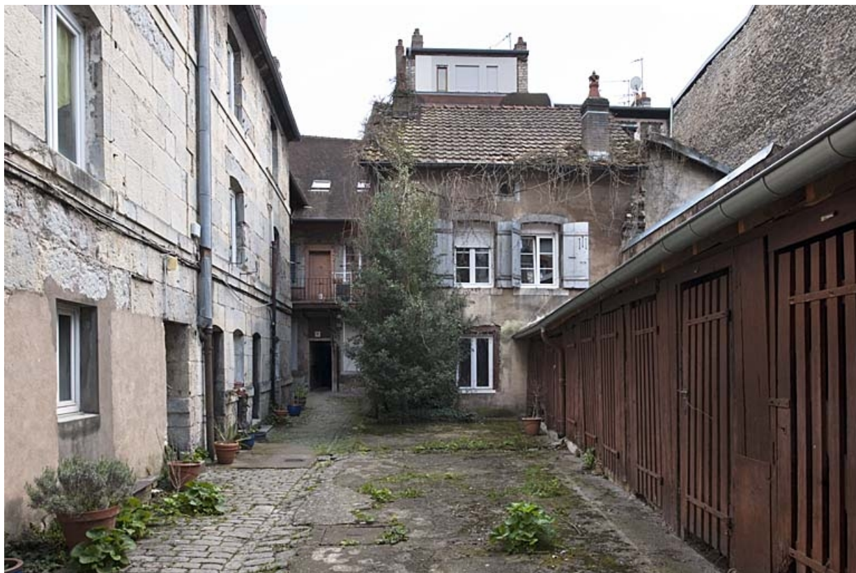
Vue d'ensemble des logis et des bûchers depuis le fond de la cour.

25, Besançon, 47 rue Bersot, lieudit : îlot Lorraine