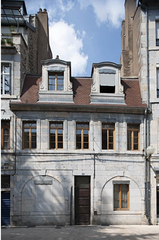
Façade antérieure : vue d'ensemble de face.

25, Besançon, 47 rue Bersot, lieudit : îlot Lorraine