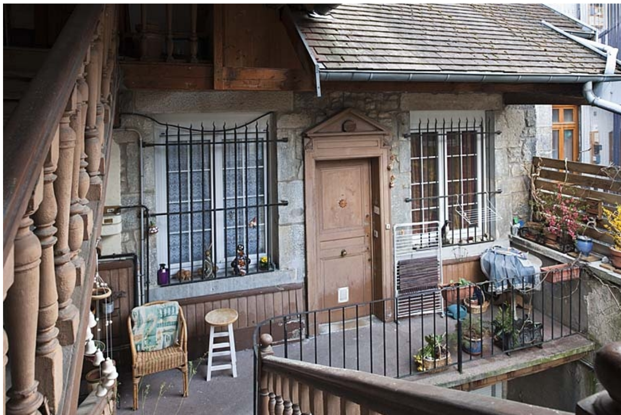
Façade postérieure du logis principal : détail du premier étage depuis l'escalier à cage ouverte.

25, Besançon, 47 rue Bersot, lieudit : îlot Lorraine