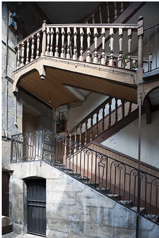
Vue d'ensemble de l'escalier à cage ouverte de trois quarts droit.

25, Besançon, 47 rue Bersot, lieudit : îlot Lorraine