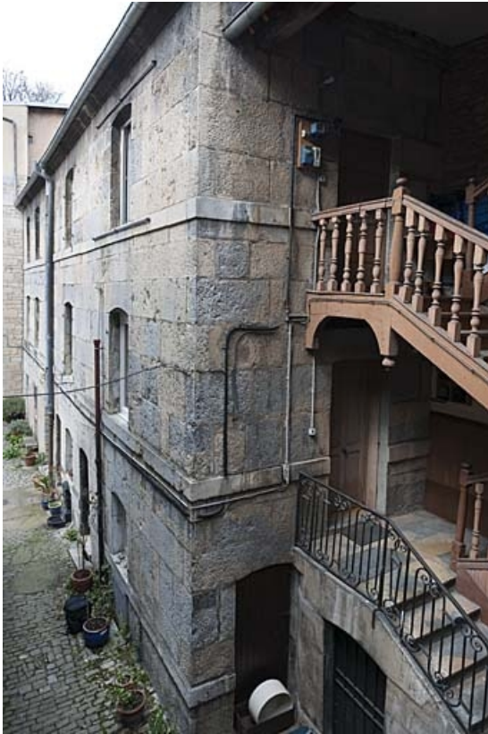
Vue d'ensemble de l'escalier à cage ouverte et du premier logis secondaire de trois quarts droit.

25, Besançon, 47 rue Bersot, lieudit : îlot Lorraine