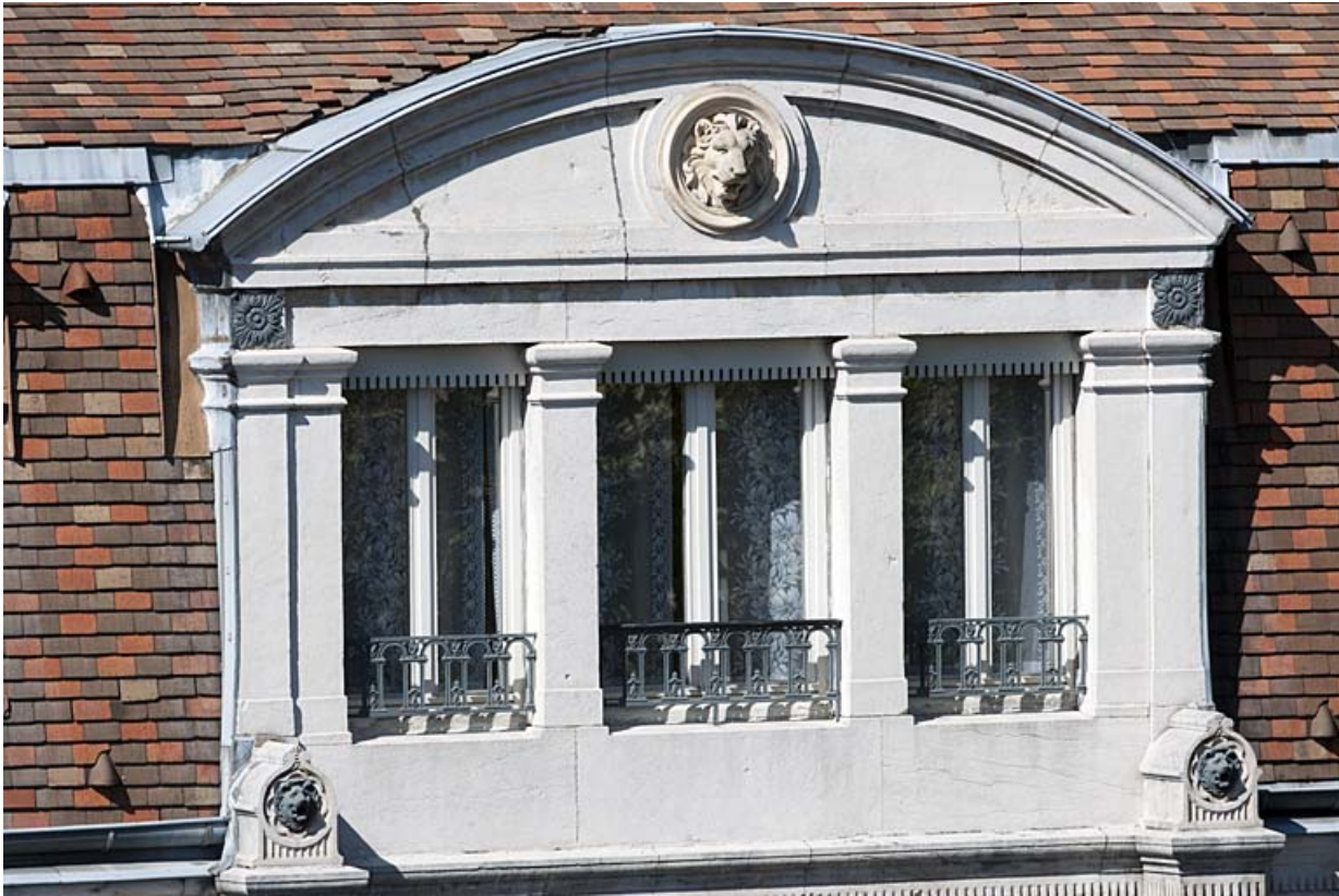
Façade sur rue : détail de la baie centrale du comble.

25, Besançon, 11 rue Gustave Courbet, lieudit : îlot Courbet