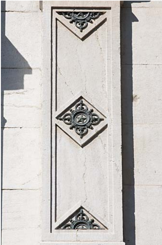
Façade sur rue : détail du décor d'un pilastre du deuxième étage.

25, Besançon, 11 rue Gustave Courbet, lieudit : îlot Courbet