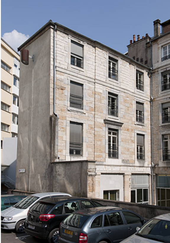
Vue d'ensemble de l'aile gauche sur cour.

25, Besançon, 11 rue Gustave Courbet, lieudit : îlot Courbet