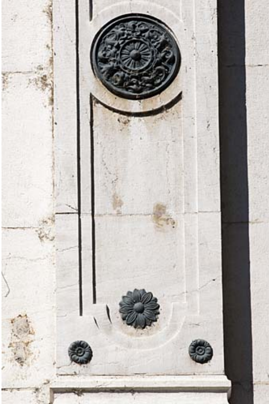
Façade sur rue : détail du décor d'un pilastre du premier étage.

25, Besançon, 11 rue Gustave Courbet, lieudit : îlot Courbet