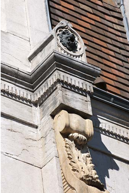
Façade sur rue : détail de la tête de lion à gauche de la baie centrale du comble.

25, Besançon, 11 rue Gustave Courbet, lieudit : îlot Courbet