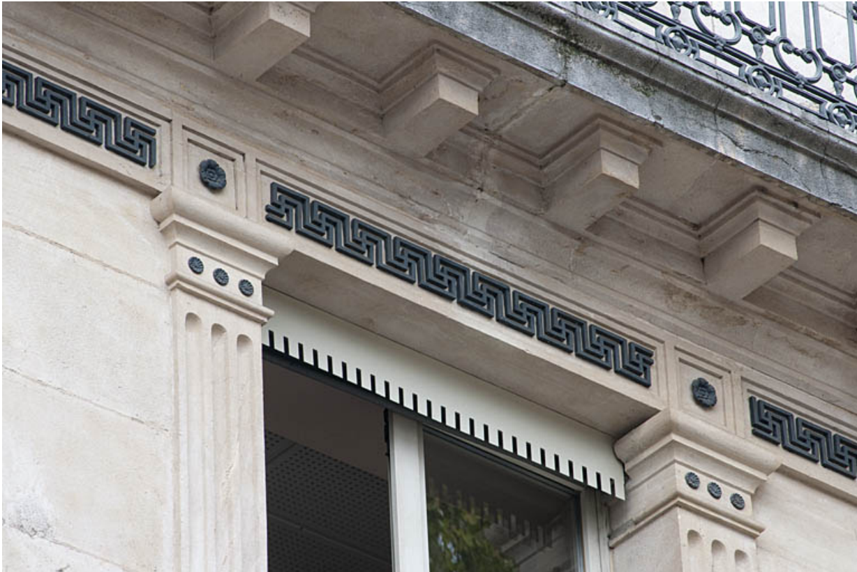
Façade sur rue : détail de la frise de grecques sous le balcon filant.

25, Besançon, 11 rue Gustave Courbet, lieudit : îlot Courbet