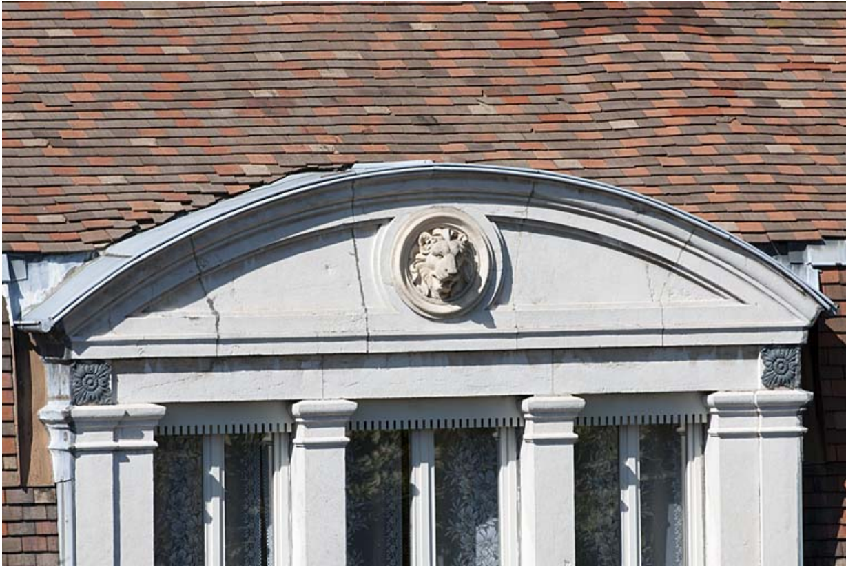
Façade sur rue : détail du fronton cintré de la baie centrale du comble décoré d'une tête de lion.

25, Besançon, 11 rue Gustave Courbet, lieudit : îlot Courbet