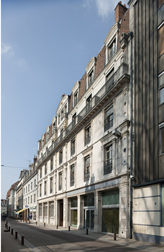
Vue d'ensemble depuis la rue de trois quarts droit.

25, Besançon, 11 rue Gustave Courbet, lieudit : îlot Courbet