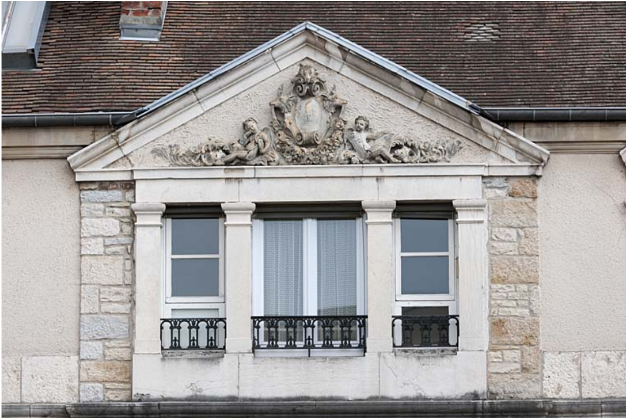
Façade postérieure : détail de la baie en triplet surmontée d'un fronton triangulaire.

25, Besançon, 11 rue Gustave Courbet, lieudit : îlot Courbet