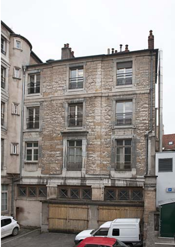
Détail de l'aile droite sur cour.

25, Besançon, 11 rue Gustave Courbet, lieudit : îlot Courbet