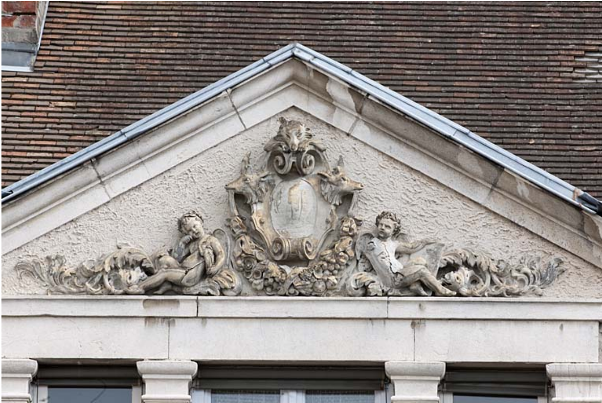
Façade postérieure : détail des sculptures dans le fronton triangulaire surmontant la baie en triplet.

25, Besançon, 11 rue Gustave Courbet, lieudit : îlot Courbet