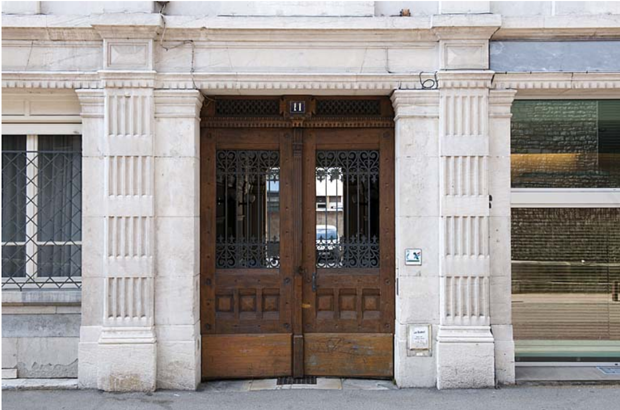
Façade sur rue : détail de l'entrée cochère.

25, Besançon, 11 rue Gustave Courbet, lieudit : îlot Courbet