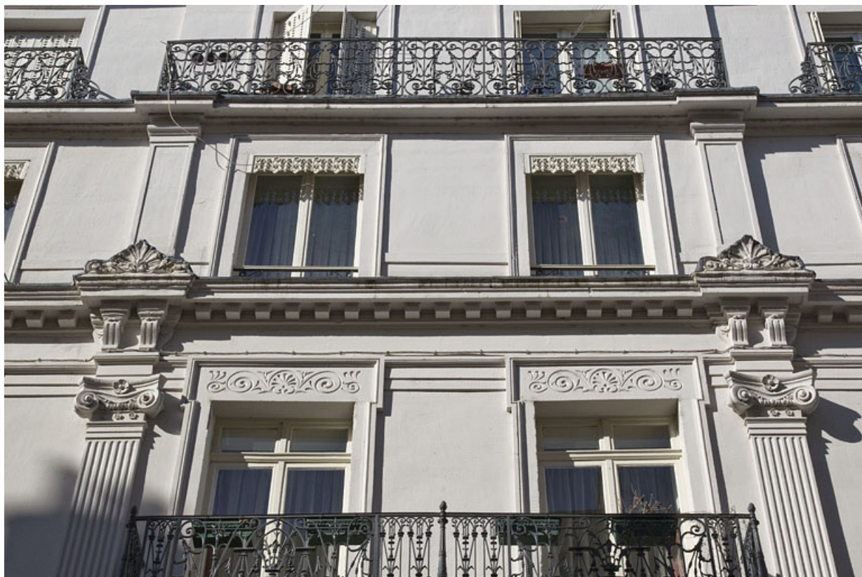
Façade antérieure : vue des deuxième et troisième balcons.

25, Besançon, 3 rue Lorraine, lieudit : îlot Saint-Amour