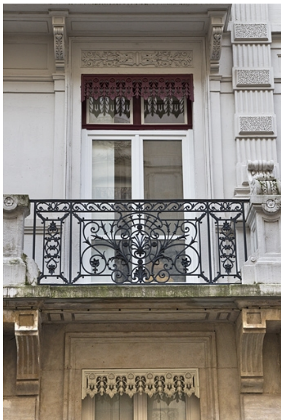
Façade antérieure : balcon du premier étage, détail d'un garde-corps.

25, Besançon, 3 rue Lorraine, lieudit : îlot Saint-Amour