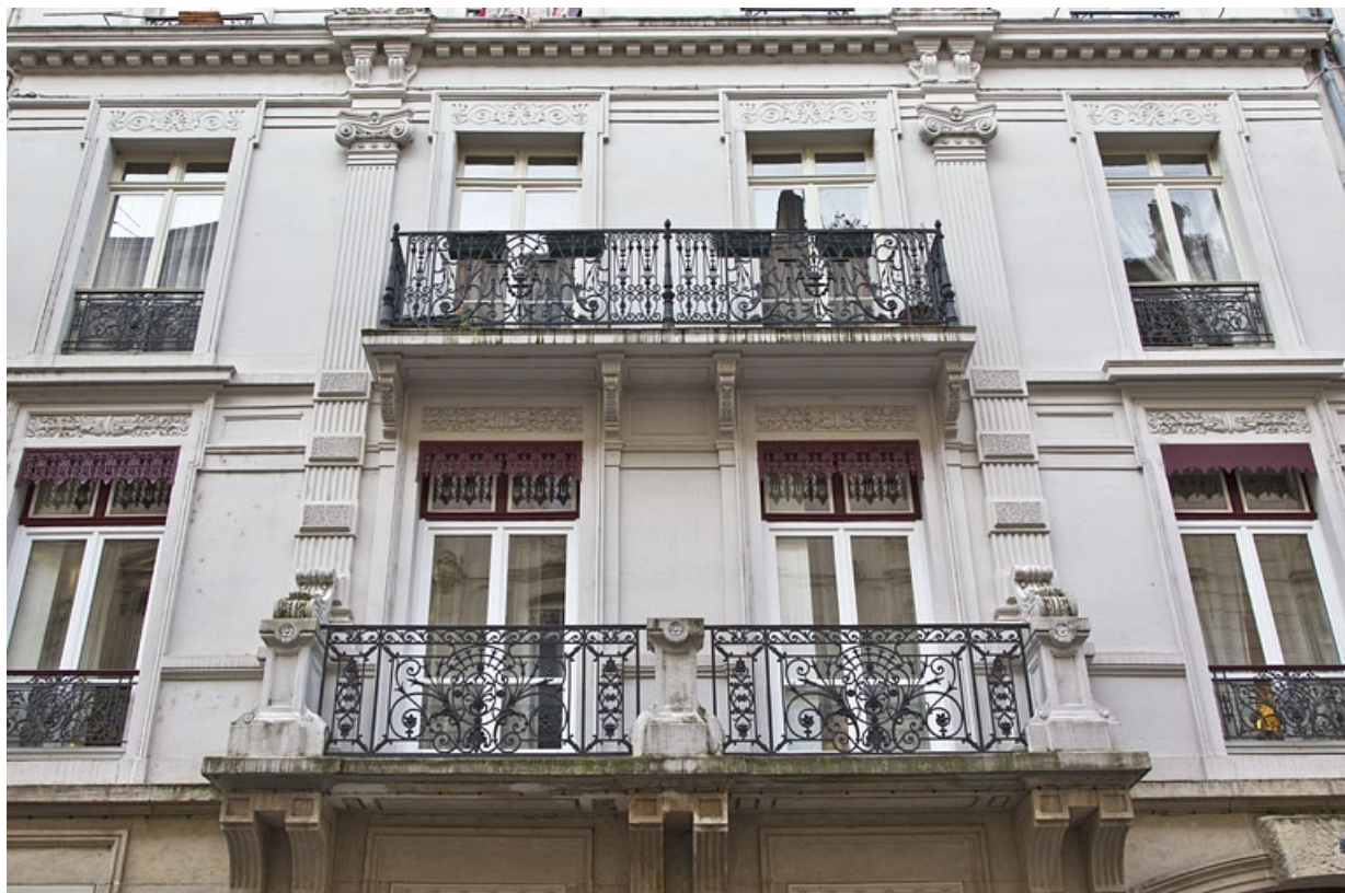
Façade antérieure : vue des balcons des premier et deuxième étages.

25, Besançon, 3 rue Lorraine, lieudit : îlot Saint-Amour