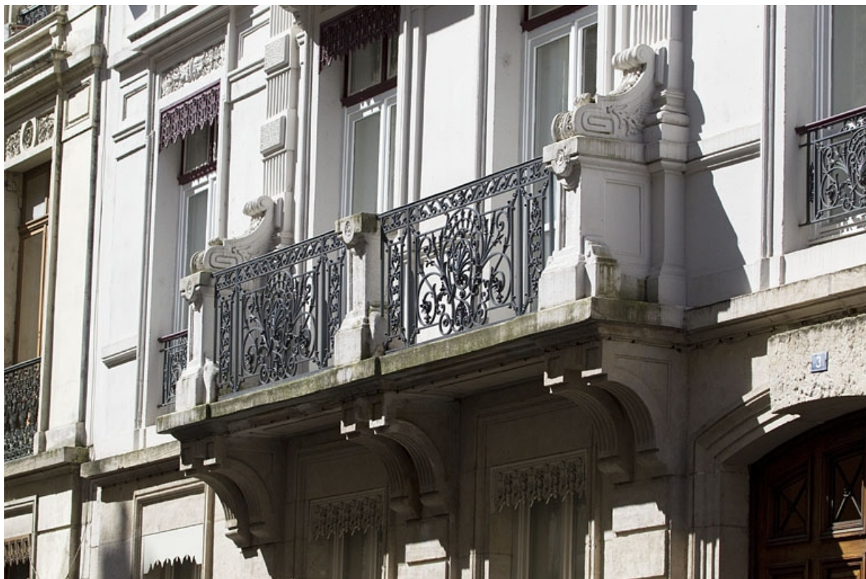
Façade antérieure : détail du balcon du premier étage, de trois quarts droit. 25, Besançon, 3 rue Lorraine, lieudit : îlot Saint-Amour