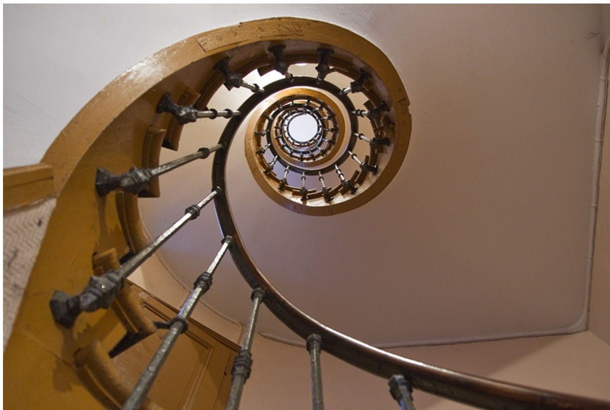
Intérieur : vue d'ensemble de l'escalier secondaire depuis le bas.

25, Besançon, 3 rue Lorraine, lieudit : îlot Saint-Amour