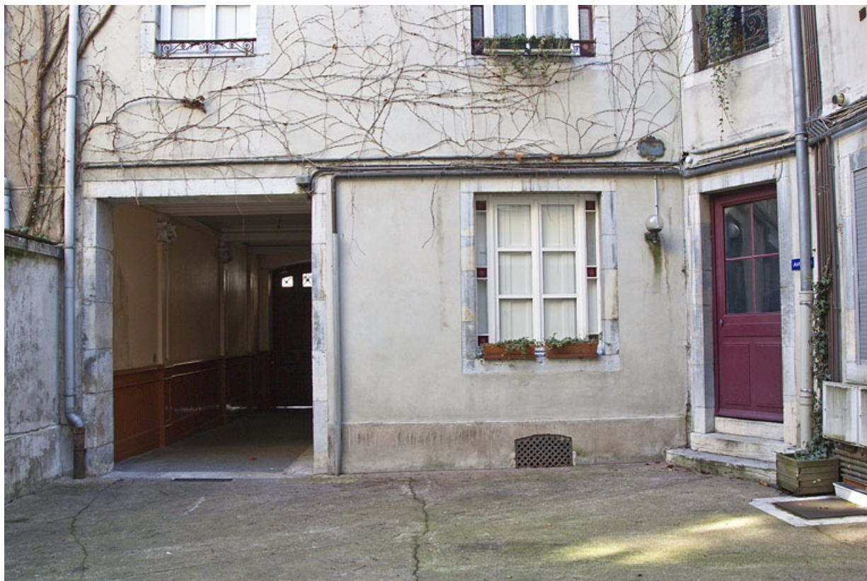
Façades sur cour : détail du passage cocher et de l'entrée du premier escalier.

25, Besançon, 3 rue Lorraine, lieudit : îlot Saint-Amour