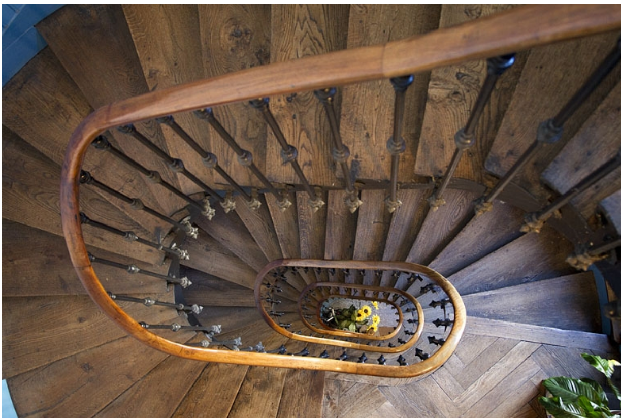
Intérieur : vue d'ensemble de l'escalier principal depuis le haut.

25, Besançon, 3 rue Lorraine, lieudit : îlot Saint-Amour