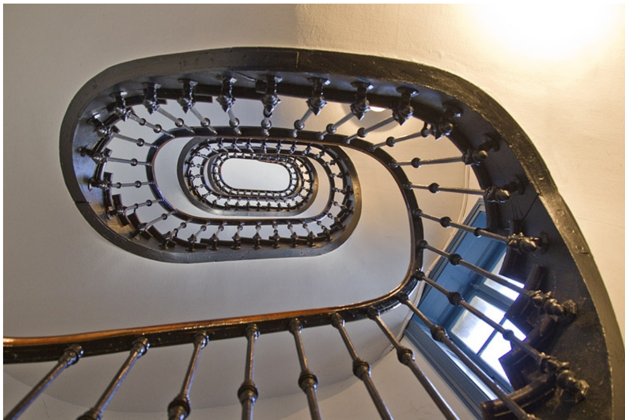
Intérieur : vue d'ensemble de l'escalier principal depuis le bas.

25, Besançon, 3 rue Lorraine, lieudit : îlot Saint-Amour