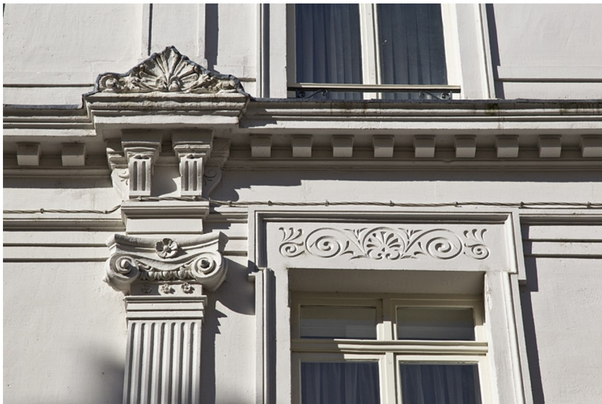
Façade antérieure : détail d'un chapiteau ionique et de son couronnement.

25, Besançon, 3 rue Lorraine, lieudit : îlot Saint-Amour