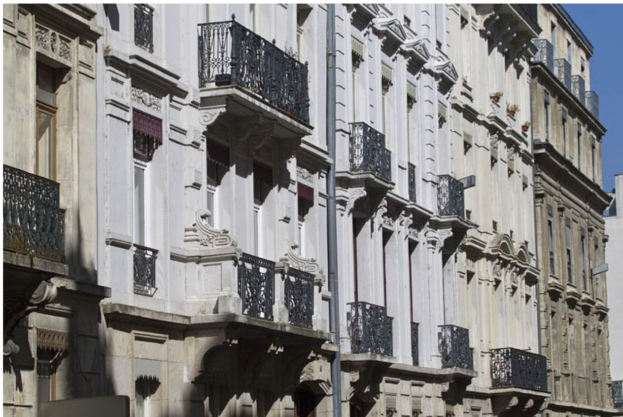
Façade antérieure : détail des balcons des premier et deuxième étages, de trois quarts gauche.

25, Besançon, 3 rue Lorraine, lieudit : îlot Saint-Amour