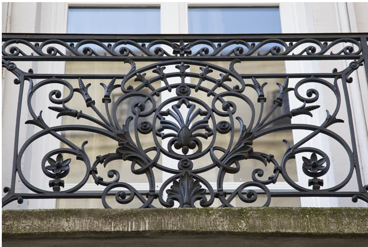
Façade antérieure : détail d'un garde-corps du balcon du premier étage : vue rapprochée.

25, Besançon, 3 rue Lorraine, lieudit : îlot Saint-Amour