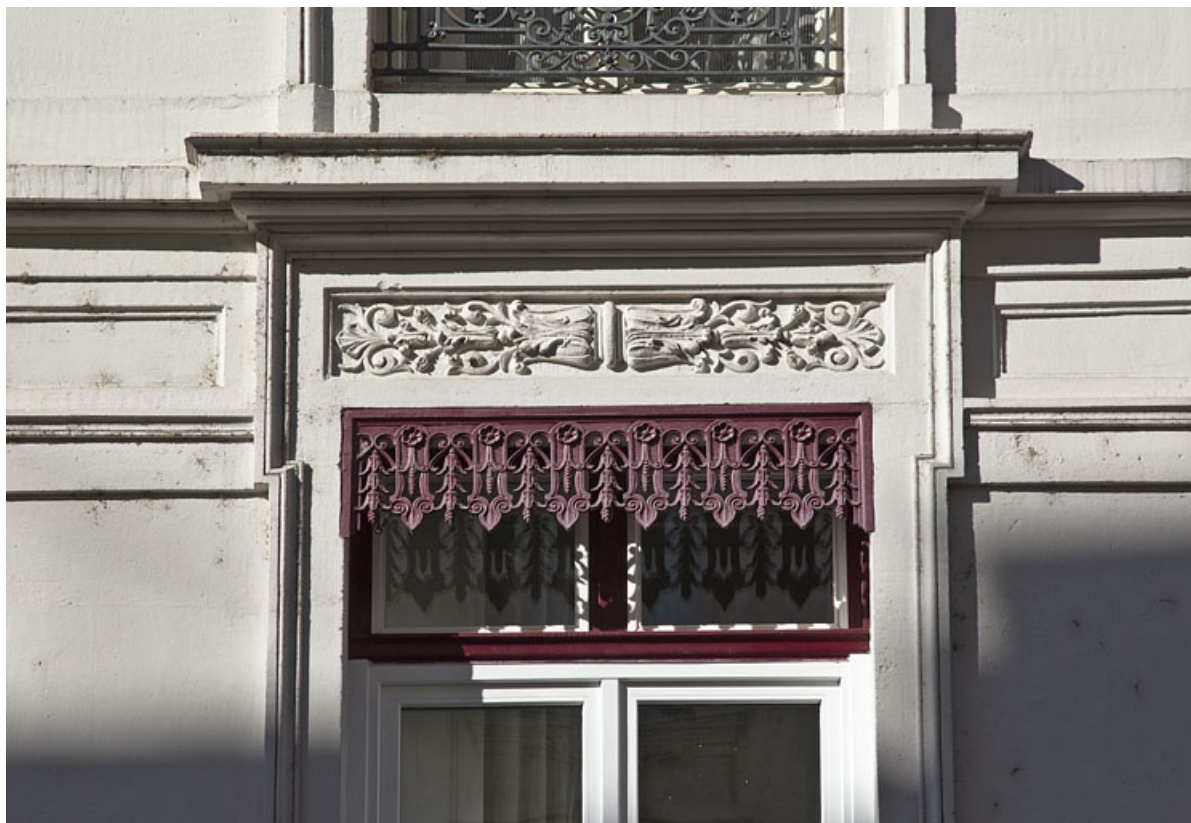
Façade antérieure : détail d'un linteau et du lambrequin de store d'une fenêtre.

25, Besançon, 3 rue Lorraine, lieudit : îlot Saint-Amour