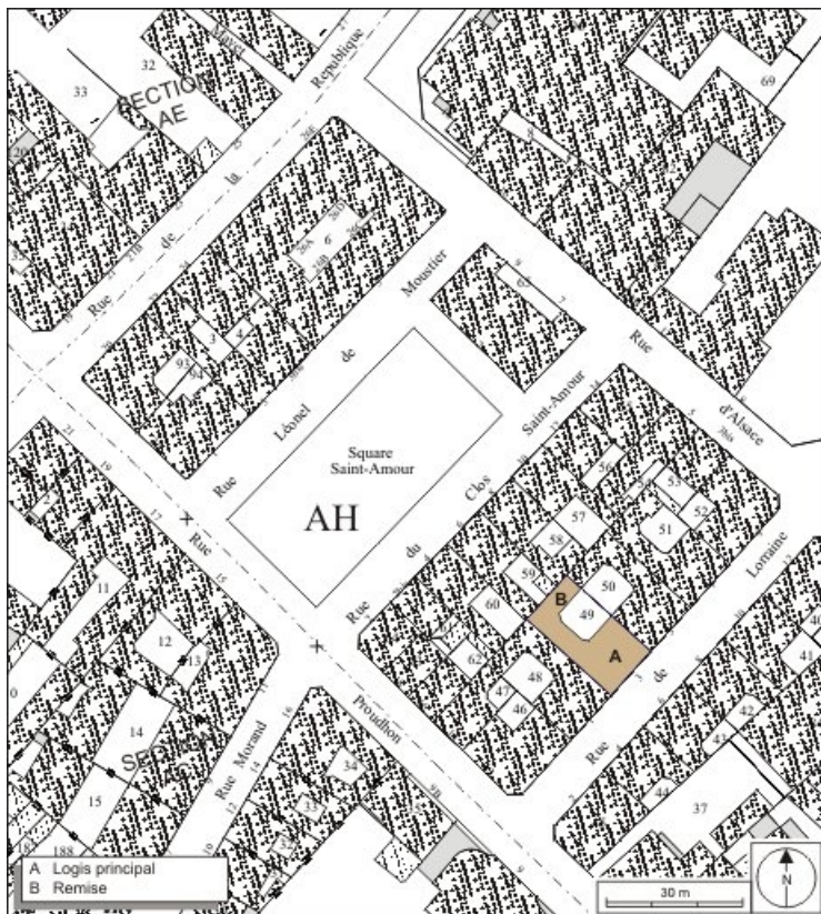
Plan masse et de situation. Extrait du plan cadastral, 1974, section AH. 25, Besançon, 3 rue Lorraine, lieudit : îlot Saint-Amour