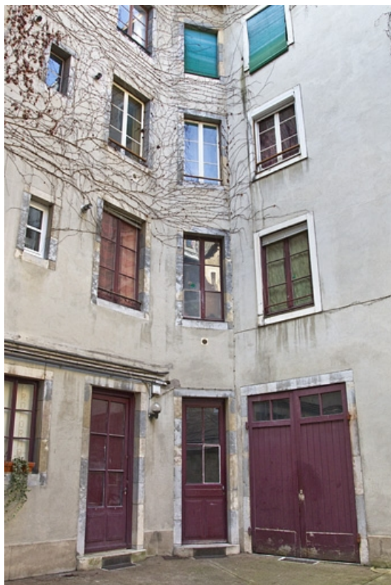
Façades sur cour : détail de l'angle coupé au fond de la cour.

25, Besançon, 3 rue Lorraine, lieudit : îlot Saint-Amour