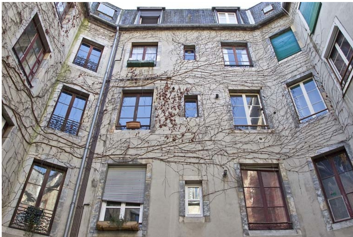
Façades sur cour : vue d'ensemble à partir du premier étage.

25, Besançon, 3 rue Lorraine, lieudit : îlot Saint-Amour