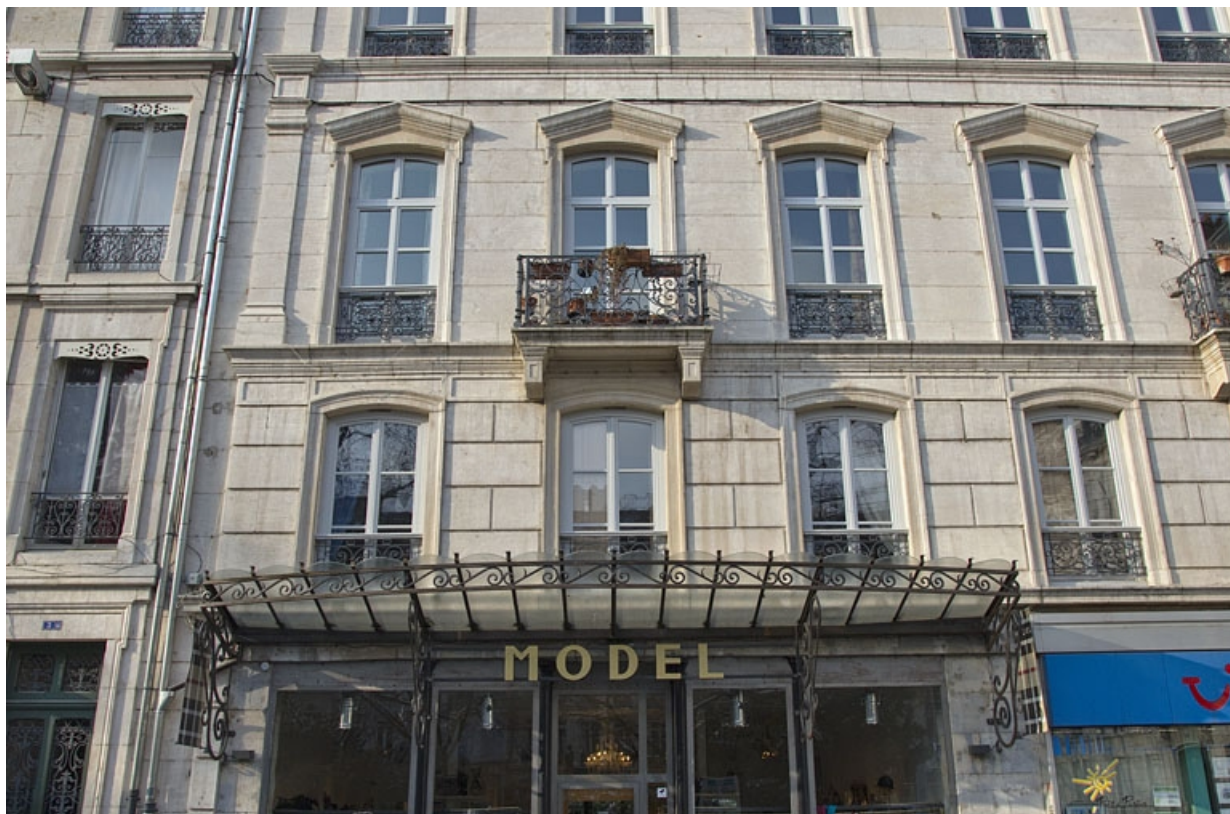
Façade antérieure, rue Léonel de Moustier : détail de la partie gauche jusqu'au deuxième étage, de face. 25, Besançon, 26 rue de la République, lieudit : îlot Saint-Amour