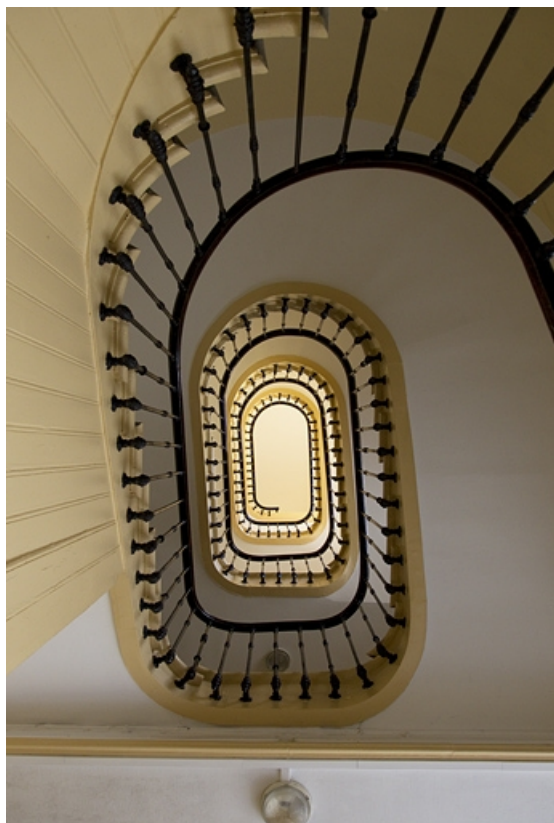
Vue d'ensemble du premier escalier depuis le bas.

25, Besançon, 26 rue de la République, lieudit : îlot Saint-Amour