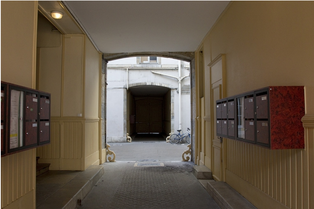
Vue d'ensemble des passages cochers en enfilade.

25, Besançon, 26 rue de la République, lieudit : îlot Saint-Amour