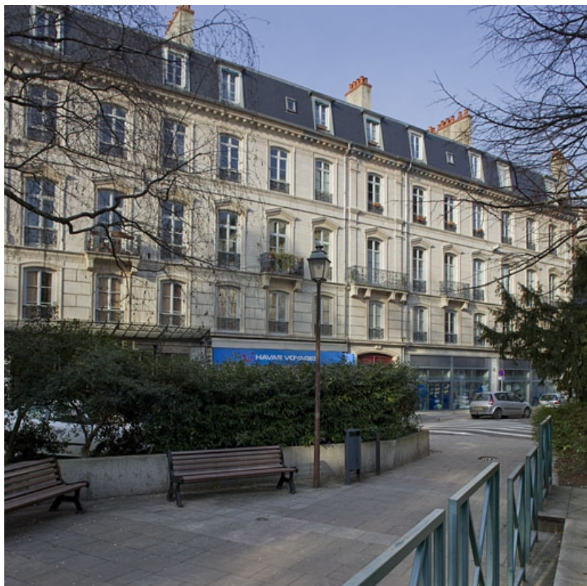
Vue d'ensemble dans l'alignement de la rue, depuis le square Saint-Amour.

25, Besançon, 26 rue de la République, lieudit : îlot Saint-Amour