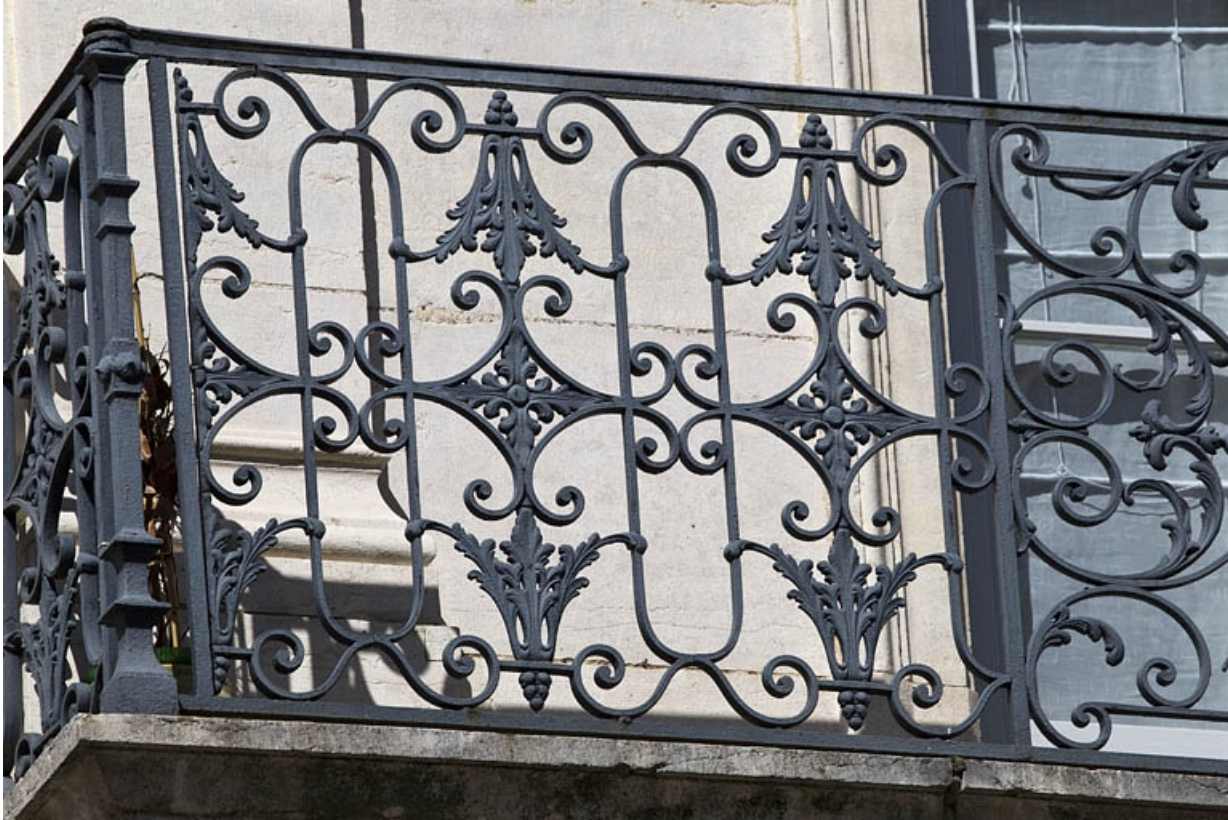
Façade antérieure, rue Léonel de Moustier, balcon du deuxième étage au-dessus du portail d'entrée : détail du garde-corps. 25, Besançon, 26 rue de la République, lieudit : îlot Saint-Amour