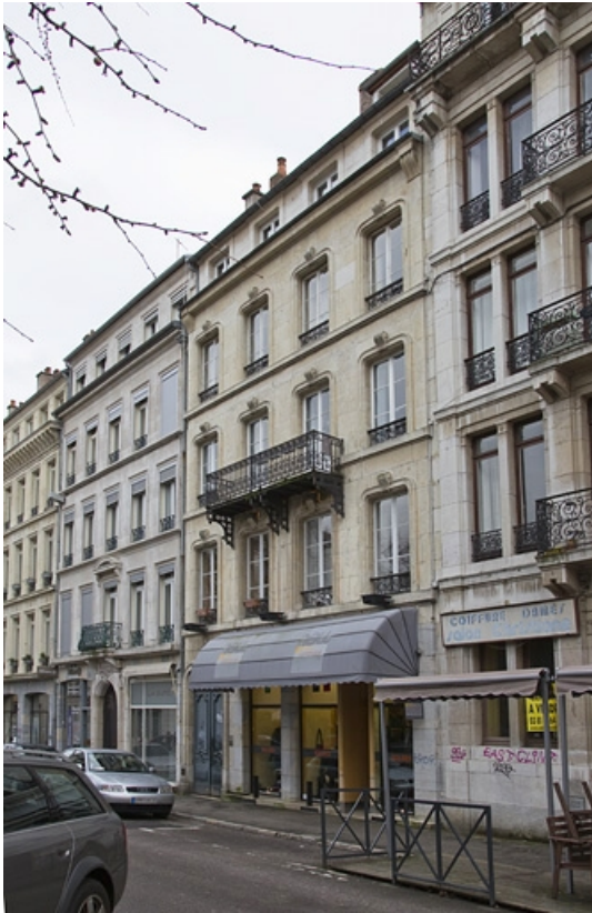
Vue d'ensemble depuis la rue, de trois quarts droit.

25, Besançon, 4 rue du Clos Saint-Amour, lieudit : îlot Saint-Amour