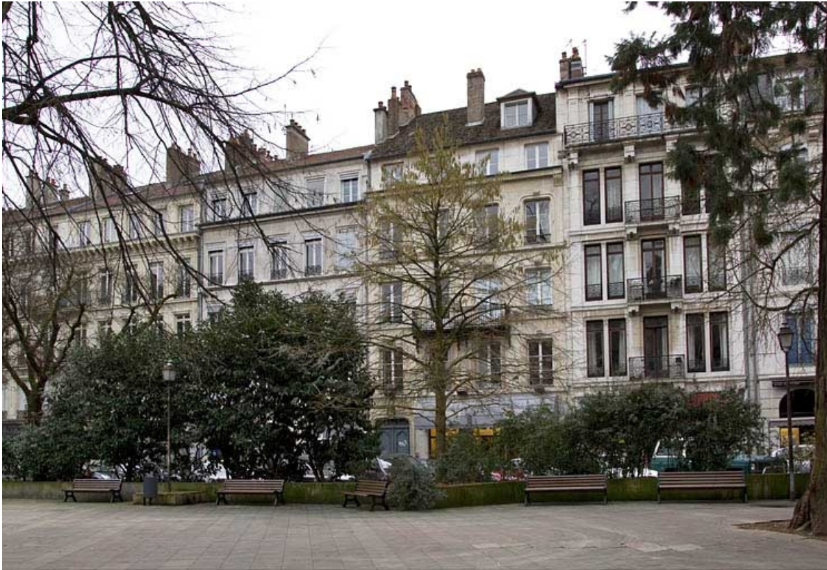
Vue d'ensemble dans l'alignement de la rue depuis le square Saint-Amour.

25, Besançon, 4 rue du Clos Saint-Amour, lieudit : îlot Saint-Amour