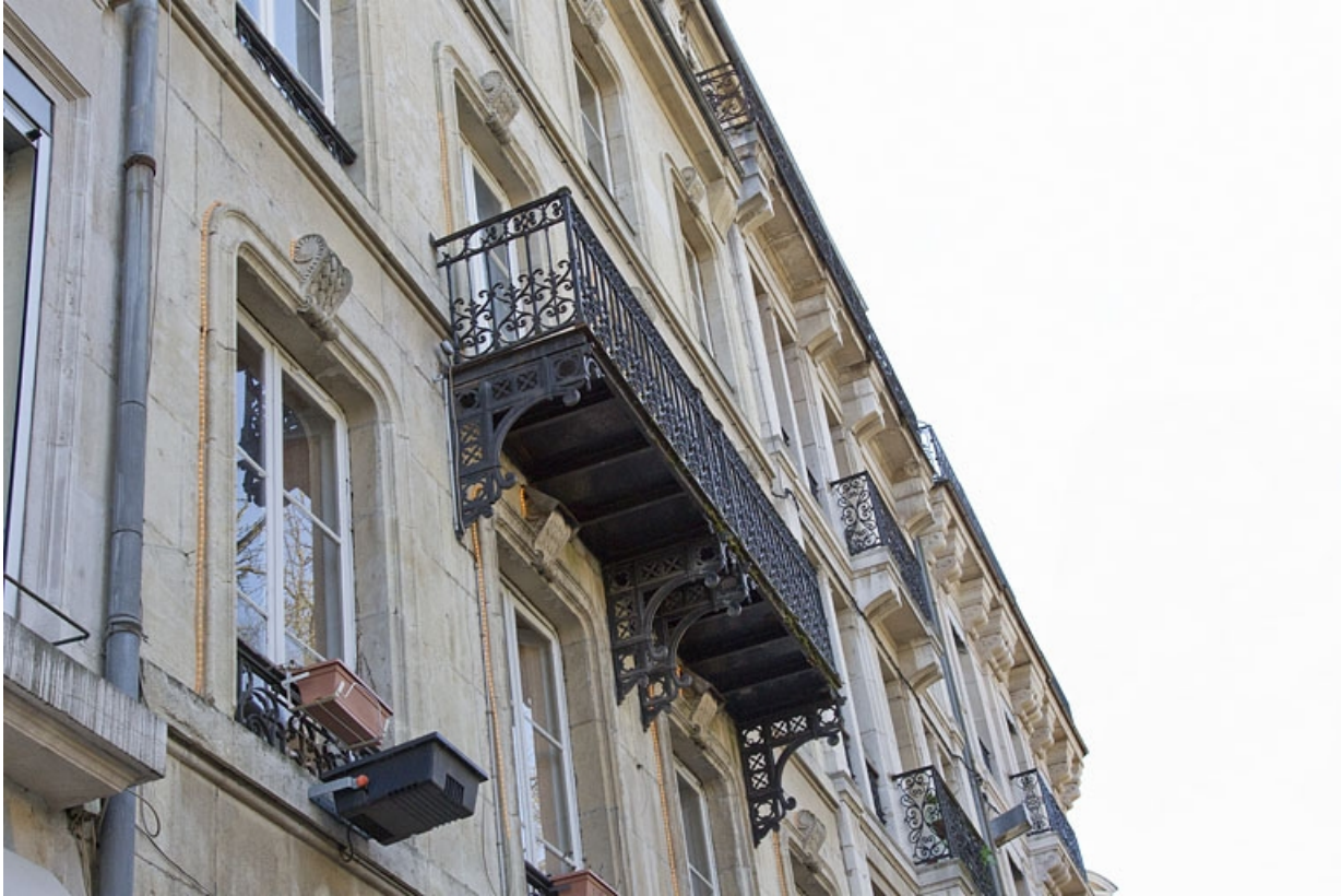
Façade antérieure : détail du balcon du deuxième étage, de trois quarts gauche.

25, Besançon, 4 rue du Clos Saint-Amour, lieudit : îlot Saint-Amour