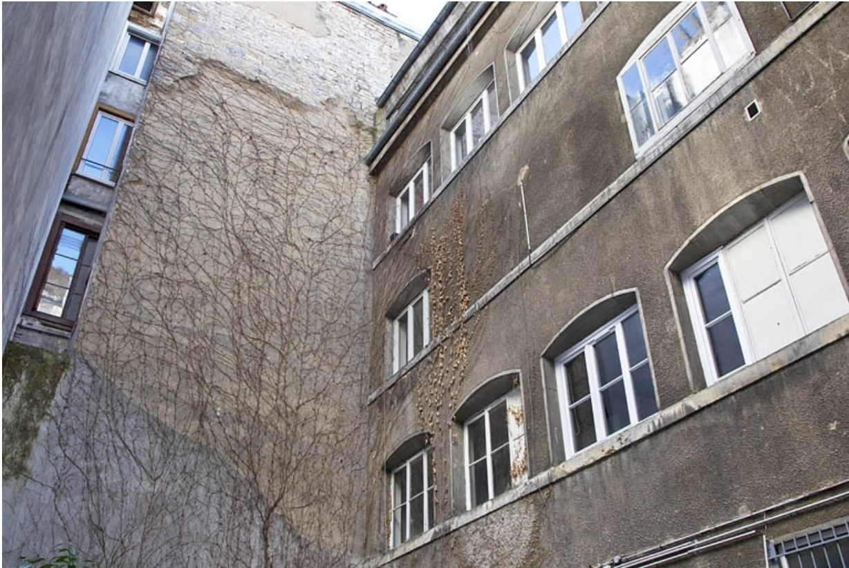
Vue de l'atelier d'horlogerie de trois quarts droit.

25, Besançon, 4 rue du Clos Saint-Amour, lieudit : îlot Saint-Amour