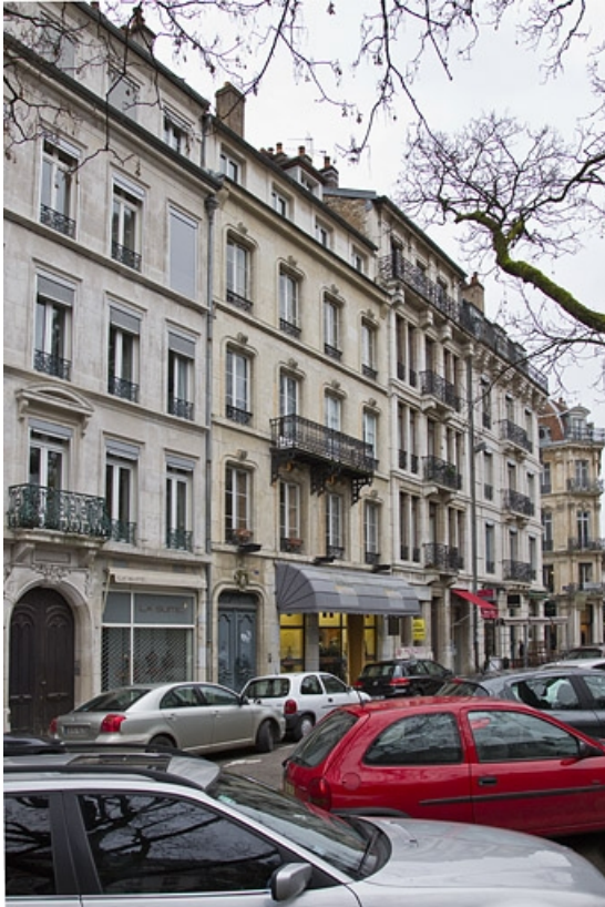
Vue d'ensemble depuis la rue, de trois quarts gauche.

25, Besançon, 4 rue du Clos Saint-Amour, lieudit : îlot Saint-Amour