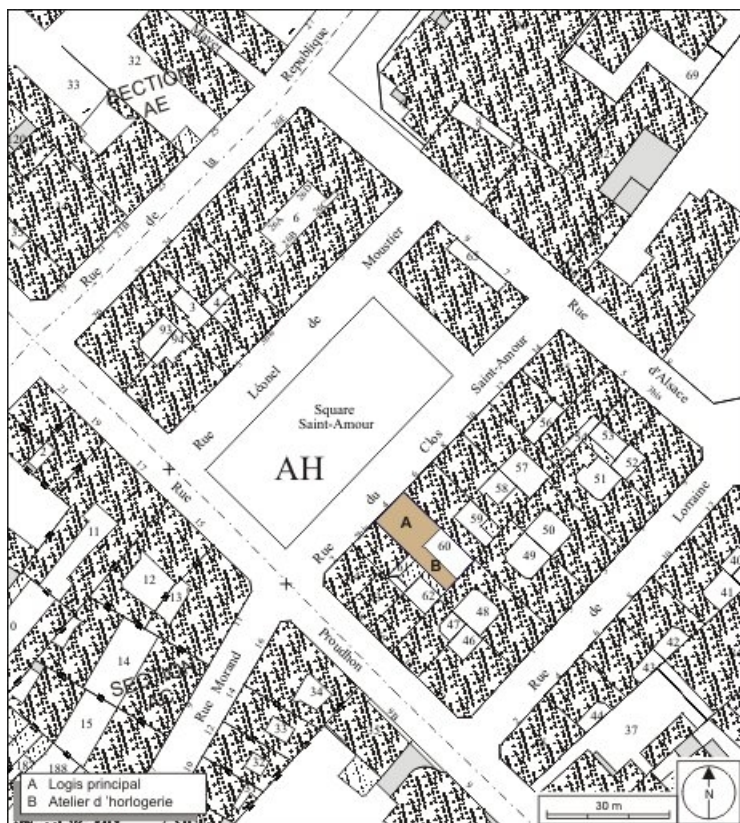
Plan masse et de situation. Extrait du plan cadastral, 1974, section AH. 25, Besançon, 4 rue du Clos Saint-Amour, lieudit : îlot Saint-Amour