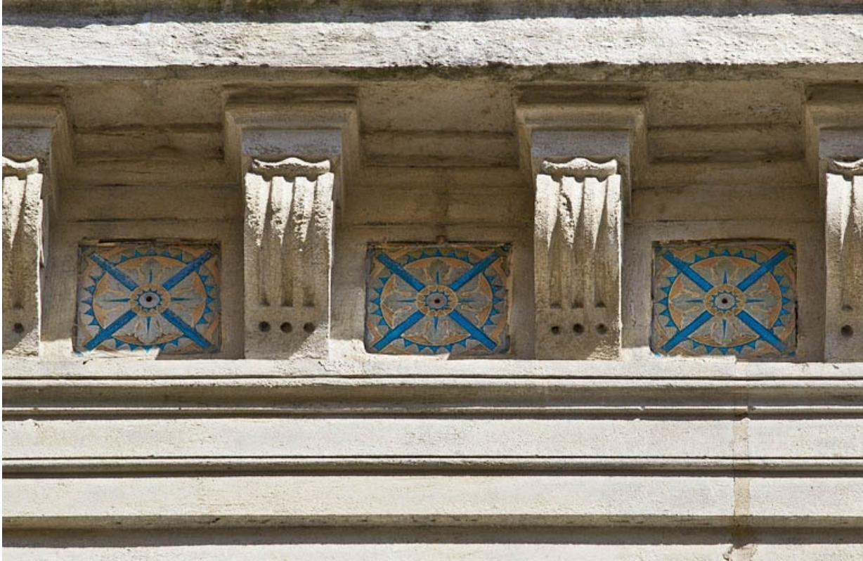
Façade antérieure : détail du décor en céramique de la corniche.

25, Besançon, 14 rue Proudhon, lieudit : îlot Saint-Amour