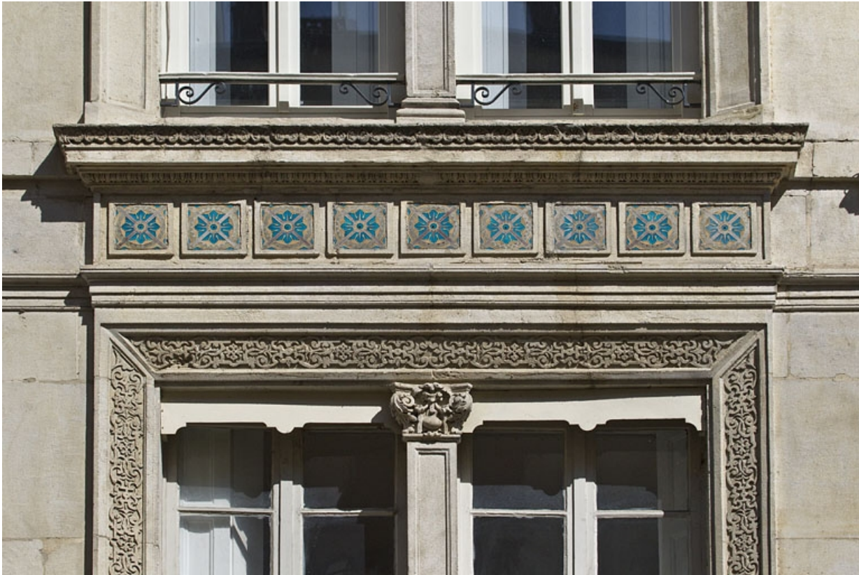
Façade antérieure : détail du décor en céramique au-dessus des fenêtres du premier étage.

25, Besançon, 14 rue Proudhon, lieudit : îlot Saint-Amour