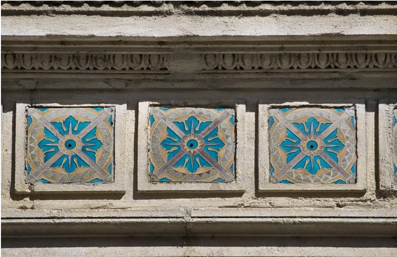
Façade antérieure : détail du décor en céramique au-dessus des fenêtres du premier étage, vue rapprochée.

25, Besançon, 14 rue Proudhon, lieudit : îlot Saint-Amour