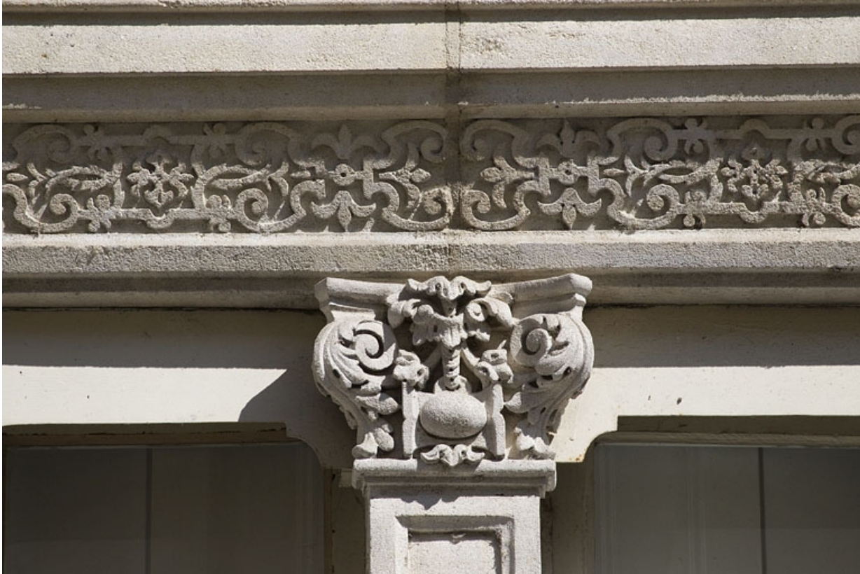
Façade antérieure, fenêtre du premier étage : détail d'un chapiteau composé couronnant le meneau.

25, Besançon, 14 rue Proudhon, lieudit : îlot Saint-Amour