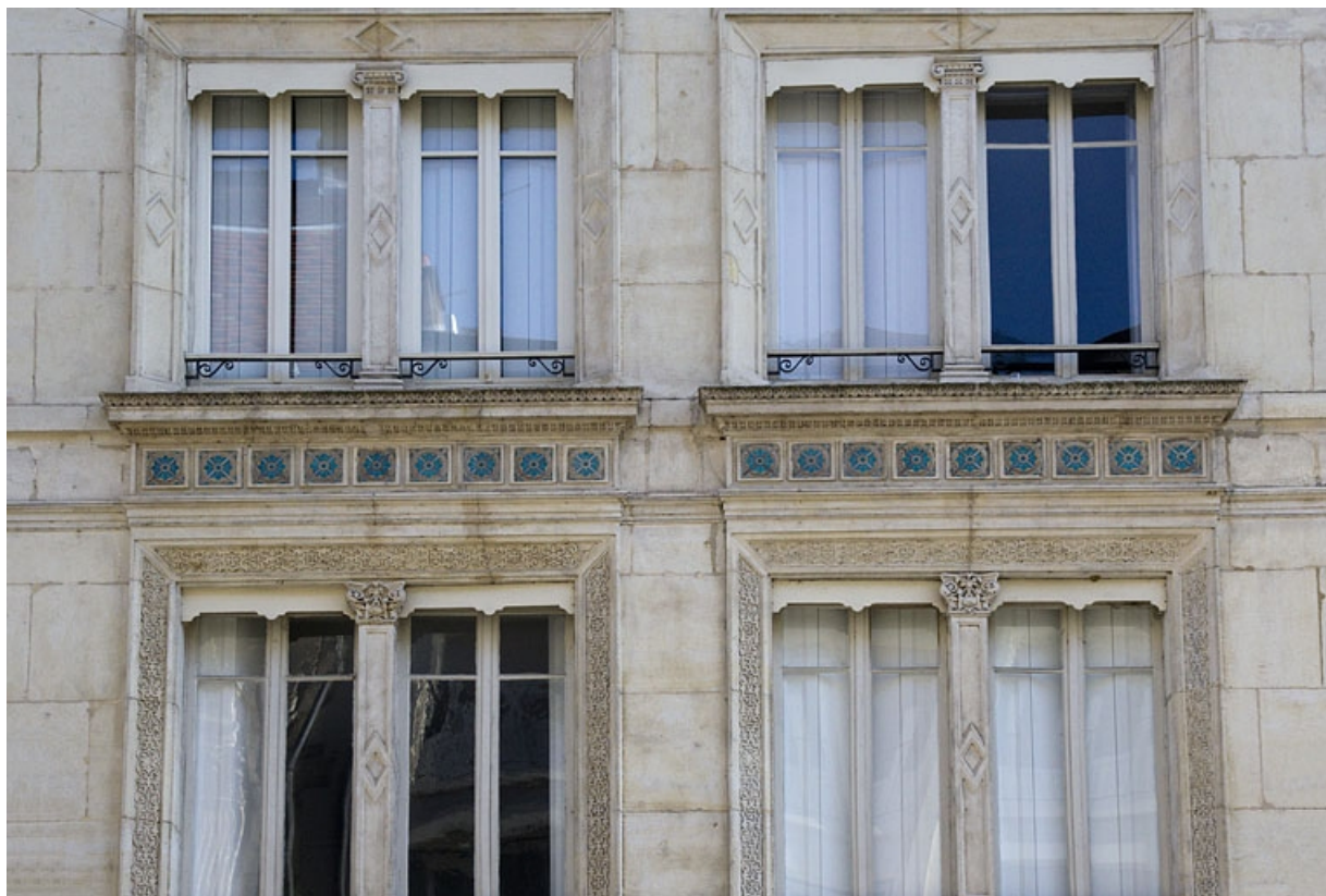
Façade antérieure : détail du décor des fenêtres des premier et deuxième étages : de face.

25, Besançon, 14 rue Proudhon, lieudit : îlot Saint-Amour