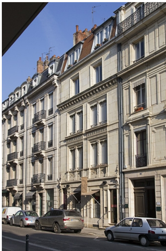
Vue d'ensemble dans l'alignement de la rue, de trois quarts droit.

25, Besançon, 14 rue Proudhon, lieudit : îlot Saint-Amour