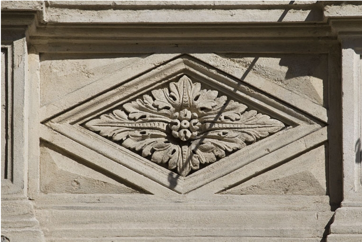
Façade antérieure, fenêtres du premier étage : détail d'un motif en losange sous une fenêtre.

25, Besançon, 14 rue Proudhon, lieudit : îlot Saint-Amour