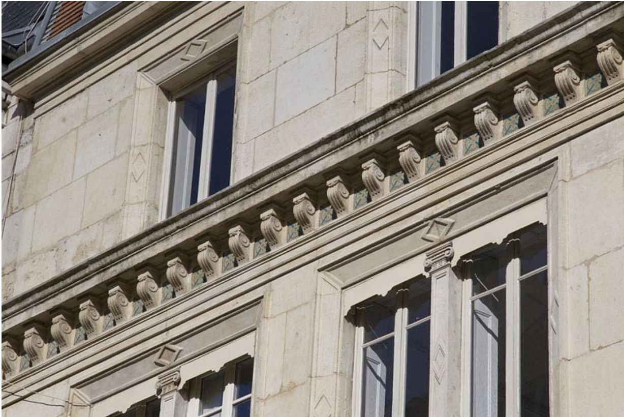
Façade antérieure : détail de la corniche entre les deuxième et troisième étages : de trois quarts droit.

25, Besançon, 14 rue Proudhon, lieudit : îlot Saint-Amour