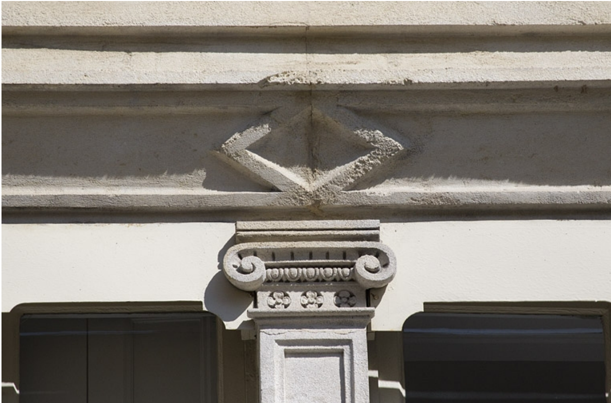
Façade antérieure, fenêtre du deuxième étage : détail d'un chapiteau ionique couronnant le meneau.

25, Besançon, 14 rue Proudhon, lieudit : îlot Saint-Amour