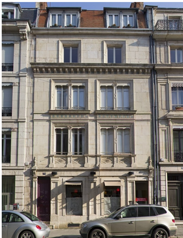
Façade antérieure, de face.

25, Besançon, 14 rue Proudhon, lieudit : îlot Saint-Amour