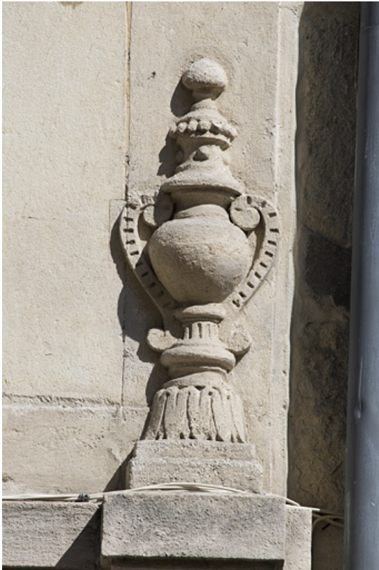
Façade antérieure : détail du décor en urne cantonnant la façade au-dessus du premier étage. 25, Besançon, 14 rue Proudhon, lieudit : îlot Saint-Amour