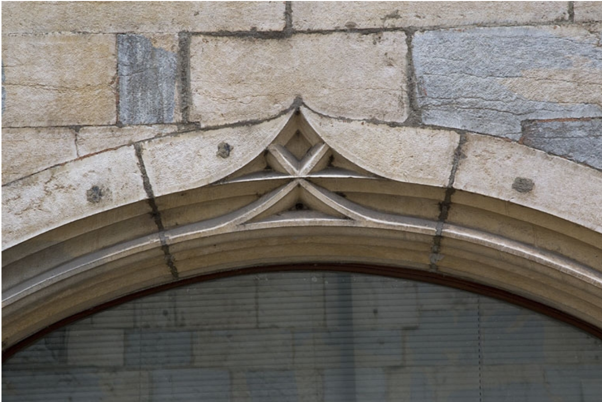
Façade antérieure : détail de l'arc en accolade de l'ancienne arcade boutiquière. 25, Besançon, 19 rue Rivotte, lieudit : îlot Porte Rivotte