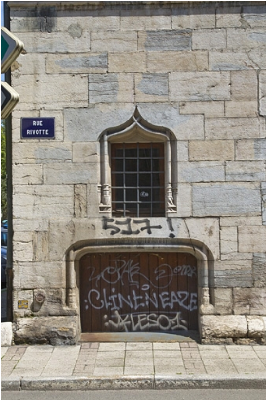
Façade antérieure, vue de l'entrée de cave.

25, Besançon, 19 rue Rivotte, lieudit : îlot Porte Rivotte