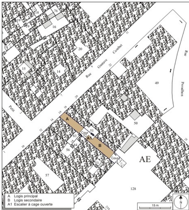
Plan masse et de situation. Extrait du plan cadastral, 1974, section AE. 25, Besançon, 16 rue Courbet, lieudit : îlot Carmélites