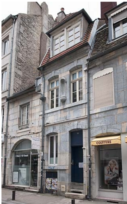
Façade sur rue de trois quarts droit.

25, Besançon, 16 rue Courbet, lieudit : îlot Carmélites