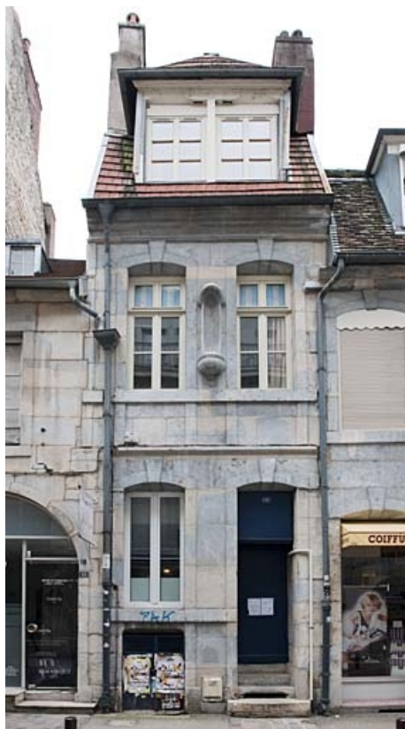
Façade sur rue de face.

25, Besançon, 16 rue Courbet, lieudit : îlot Carmélites