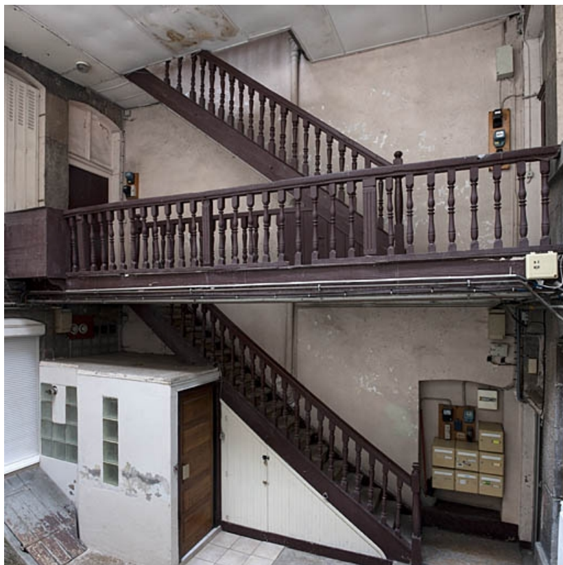
Vue d'ensemble de l'escalier à cage ouverte.

25, Besançon, 16 rue Courbet, lieudit : îlot Carmélites