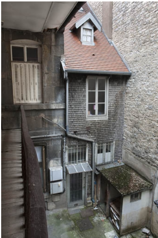
Façade sur cour du logis principal depuis l'escalier, avec la façade de la maison voisine couverte en tavaillons. 25, Besançon, 16 rue Courbet, lieudit : îlot Carmélites