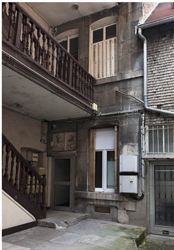
Façade sur cour du logis principal depuis la cour. 25, Besançon, 16 rue Courbet, lieudit : îlot Carmélites