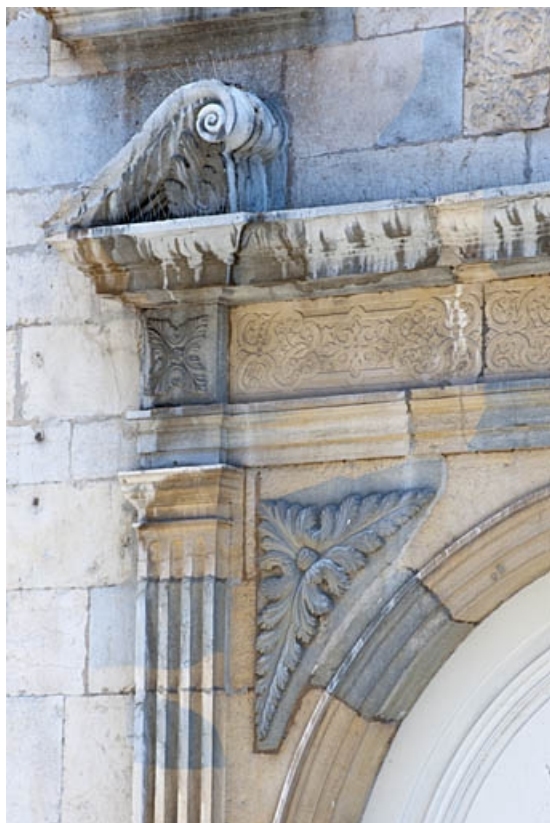
Façade sur rue : détail de l'angle supérieur gauche de l'entrée cochère. 25, Besançon, 3bis, 5 rue des Granges, lieudit : îlot Carmélites