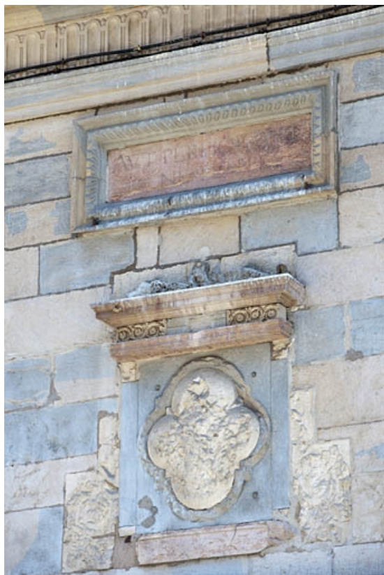
Façade sur rue : détail rapproché des décors au-dessus de la porte cochère.

25, Besançon, 3bis, 5 rue des Granges, lieudit : îlot Carmélites