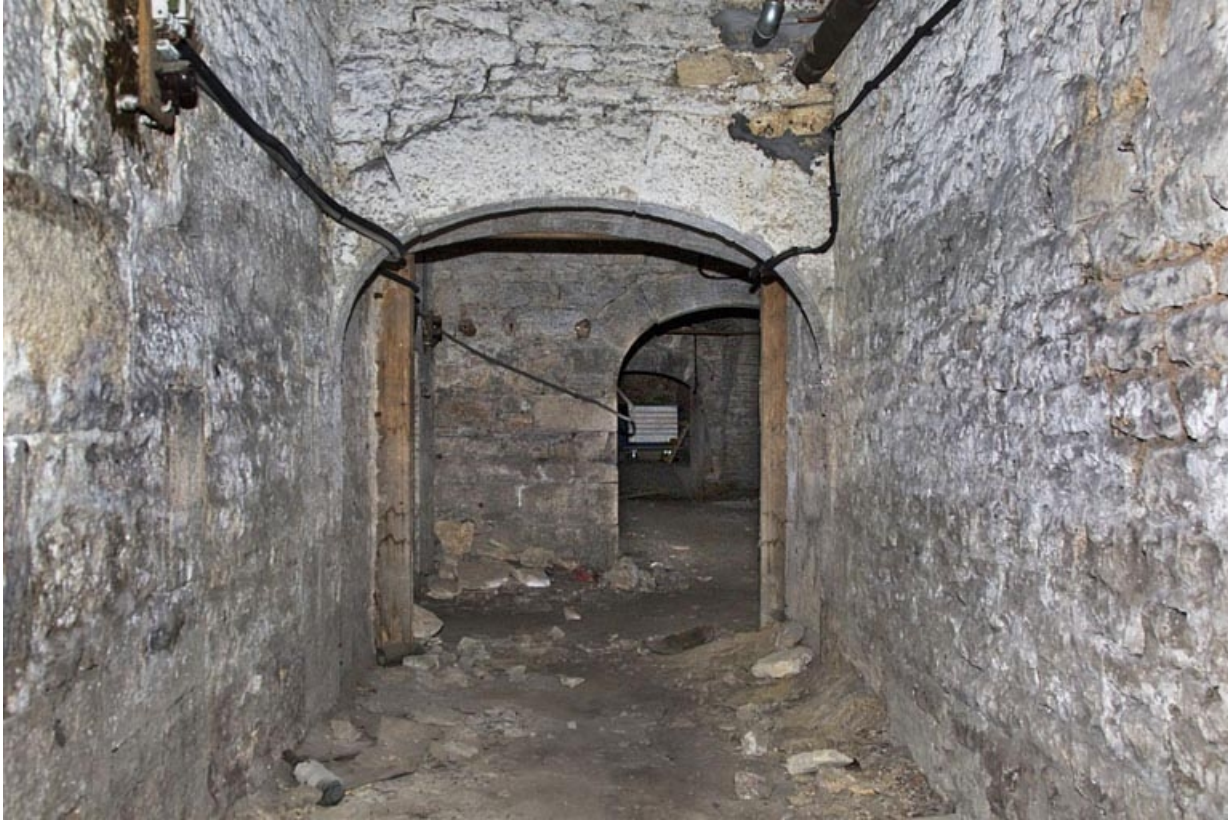
Sous-sol : détail d'un passage.

25, Besançon, 12 rue de l' Orme de Chamars, lieudit : îlot Saint-Jacques