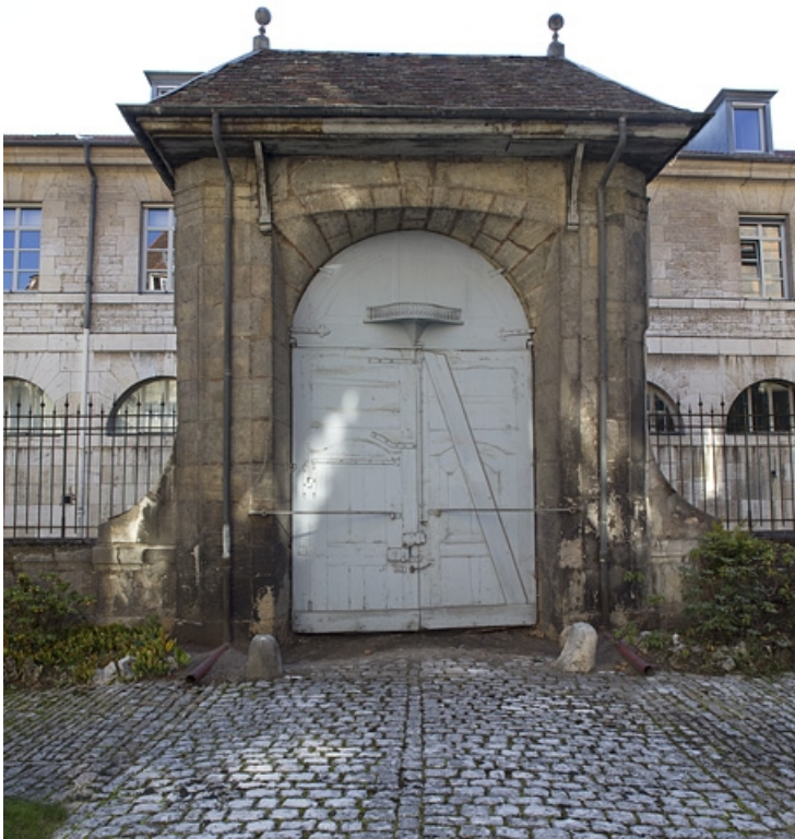
Vue du portail d'entrée depuis la cour, de face.

25, Besançon, 12 rue de l' Orme de Chamars, lieudit : îlot Saint-Jacques