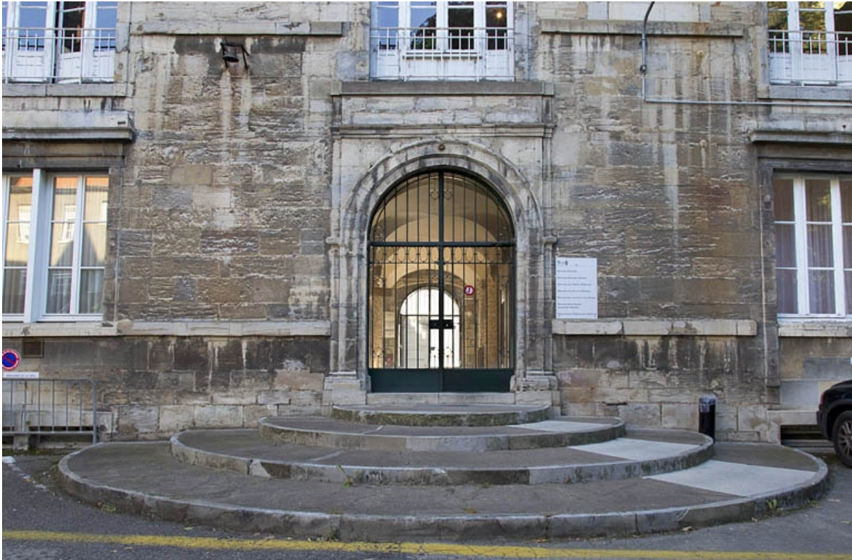
Façade postérieure : détail du portail d'entrée, de face.

25, Besançon, 12 rue de l' Orme de Chamars, lieudit : îlot Saint-Jacques