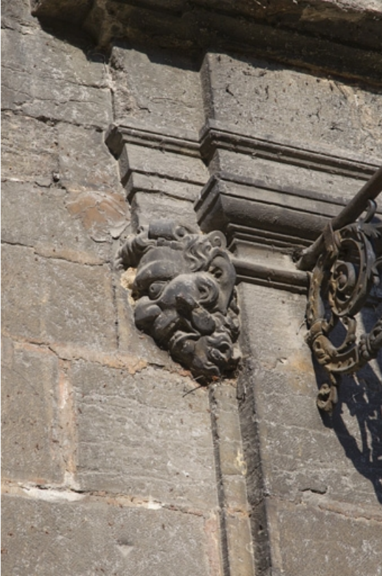
Façade antérieure, portail d'entrée : détail du mascaron gauche.

25, Besançon, 12 rue de l' Orme de Chamars, lieudit : îlot Saint-Jacques