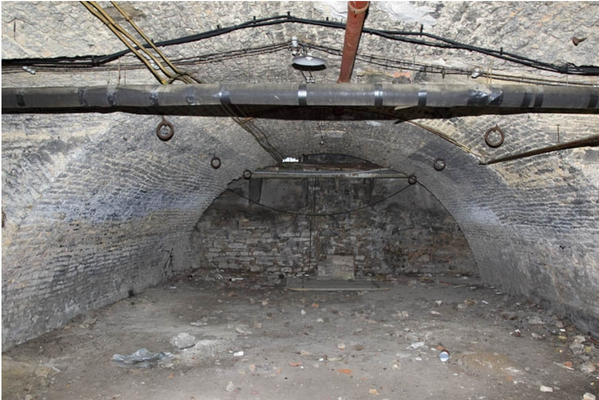
Sous-sol : détail d'une cave voûtée en berceau.

25, Besançon, 12 rue de l' Orme de Chamars, lieudit : îlot Saint-Jacques