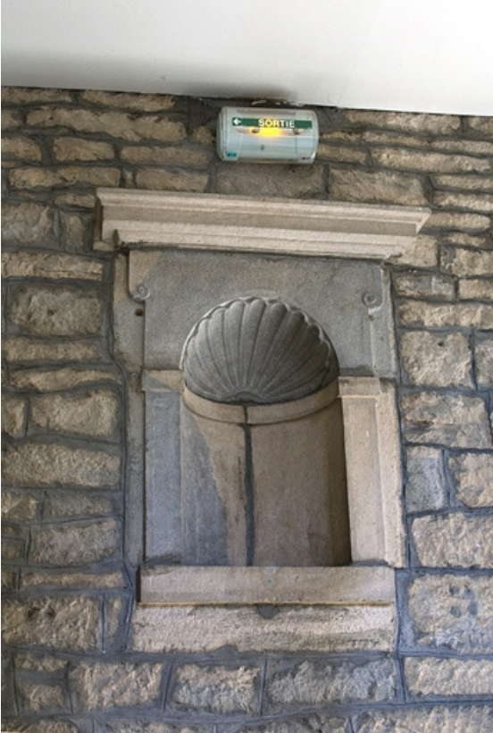
Intérieur : détail d'une niche à coquille décorant la cage de l'escalier.

25, Besançon, 12 rue de l' Orme de Chamars, lieudit : îlot Saint-Jacques