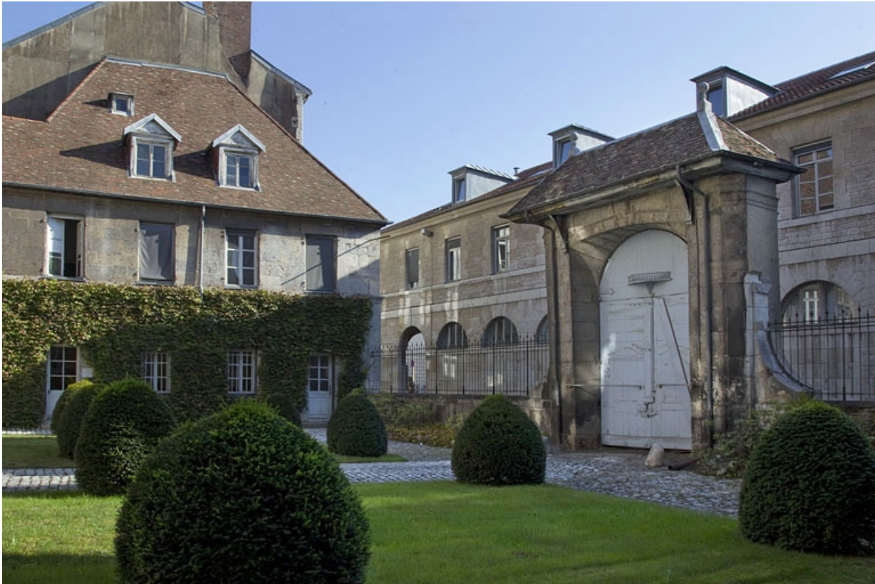
Aile droite et portail d'entrée sur cour : de trois quarts droit.

25, Besançon, 12 rue de l' Orme de Chamars, lieudit : îlot Saint-Jacques