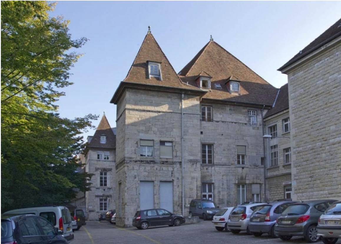
Façades postérieure et latérale gauche : de trois quarts droit.

25, Besançon, 12 rue de l' Orme de Chamars, lieudit : îlot Saint-Jacques