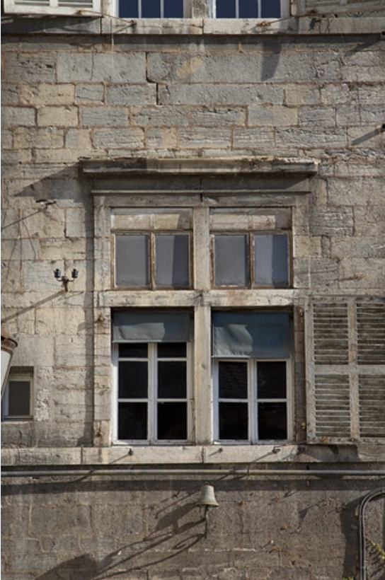
Façade antérieure, tour droite : détail d'une fenêtre du premier étage.

25, Besançon, 12 rue de l' Orme de Chamars, lieudit : îlot Saint-Jacques