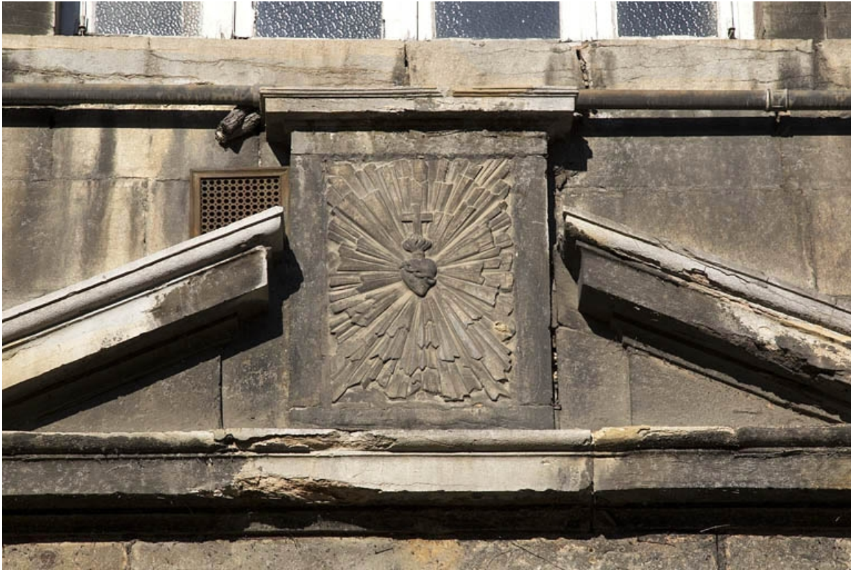
Façade antérieure, portail d'entrée : détail du décor du tabernacle du fronton.

25, Besançon, 12 rue de l' Orme de Chamars, lieudit : îlot Saint-Jacques