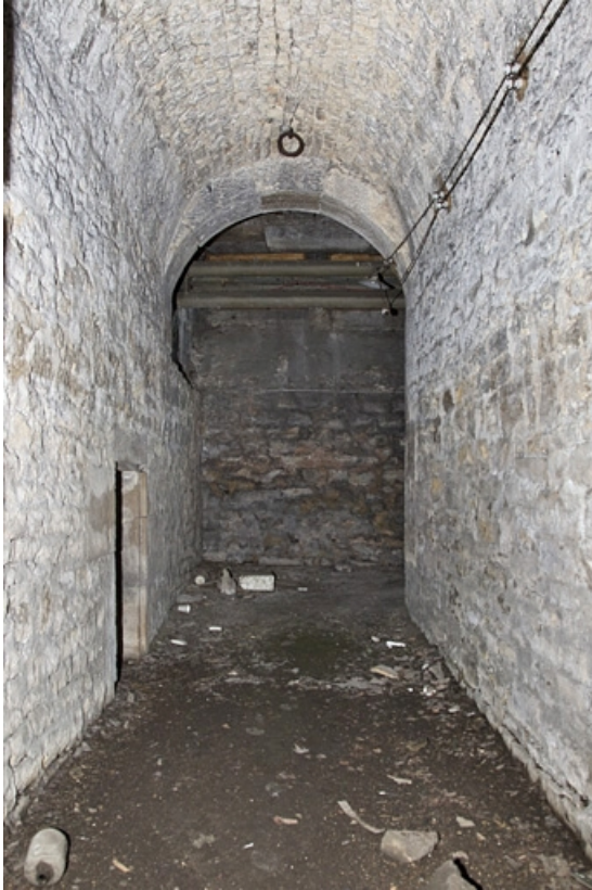
Sous-sol : détail d'un couloir voûté en berceau.

25, Besançon, 12 rue de l' Orme de Chamars, lieudit : îlot Saint-Jacques