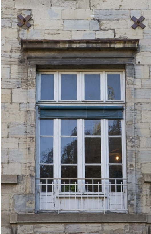
Façade postérieure : détail d'une fenêtre du premier étage.

25, Besançon, 12 rue de l' Orme de Chamars, lieudit : îlot Saint-Jacques