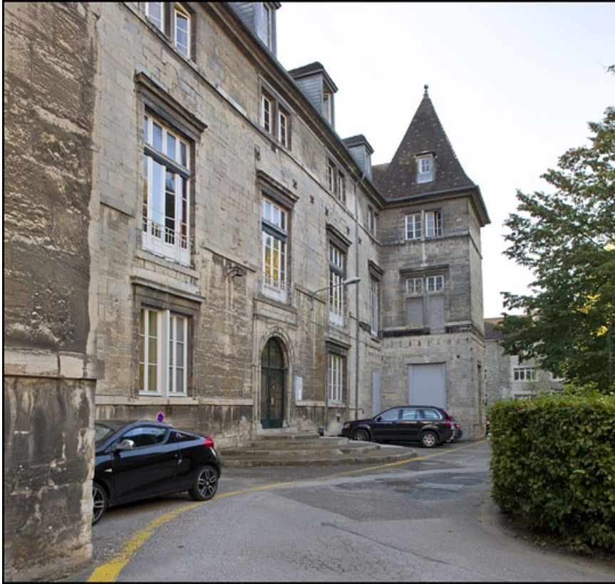
Vue d'ensemble de la façade postérieure, de trois quarts gauche.

25, Besançon, 12 rue de l' Orme de Chamars, lieudit : îlot Saint-Jacques