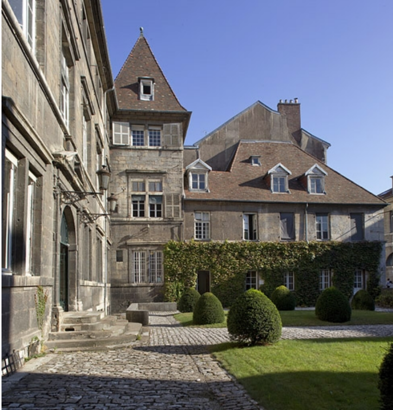
Aile droite sur cour : de face.

25, Besançon, 12 rue de l' Orme de Chamars, lieudit : îlot Saint-Jacques