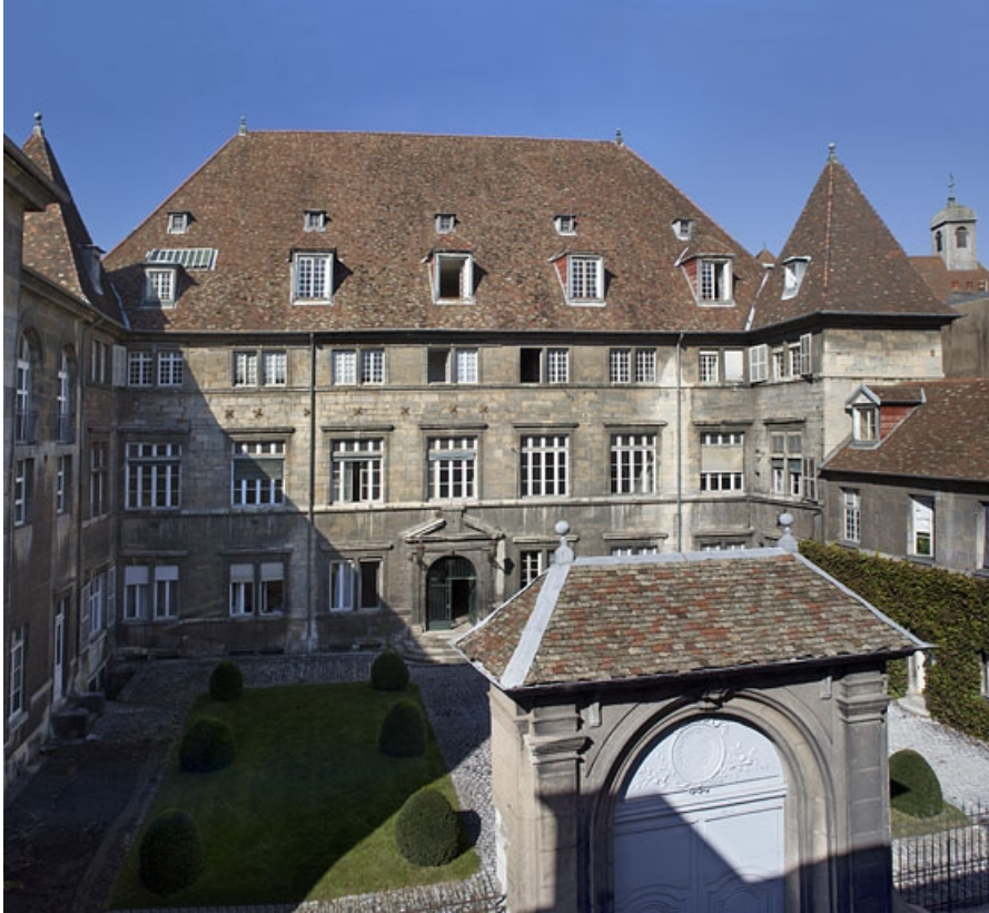
Vue d'ensemble de l'hôtel et de la cour, de face.

25, Besançon, 12 rue de l' Orme de Chamars, lieudit : îlot Saint-Jacques