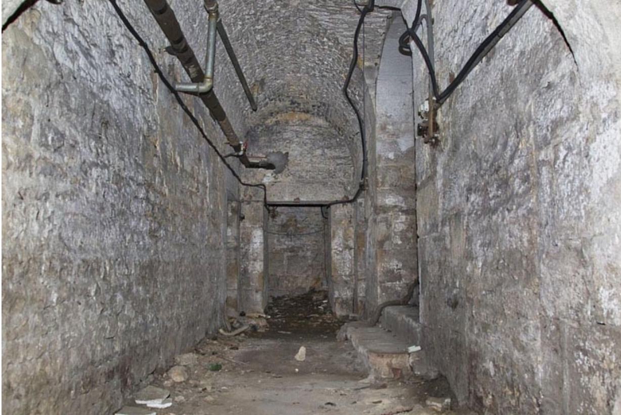
Sous-sol : détail d'un passage donnant sur un escalier de cave.

25, Besançon, 12 rue de l' Orme de Chamars, lieudit : îlot Saint-Jacques