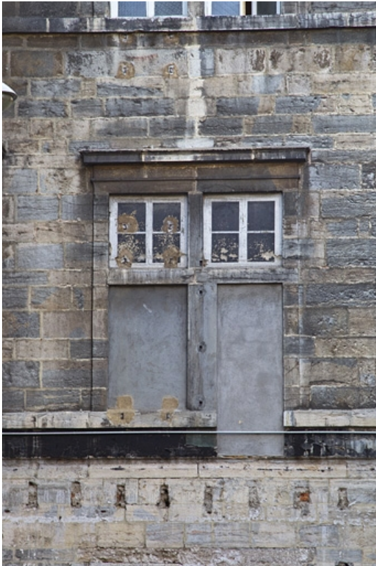
Façade postérieure, tour droite : détail d'une fenêtre du premier étage.

25, Besançon, 12 rue de l' Orme de Chamars, lieudit : îlot Saint-Jacques