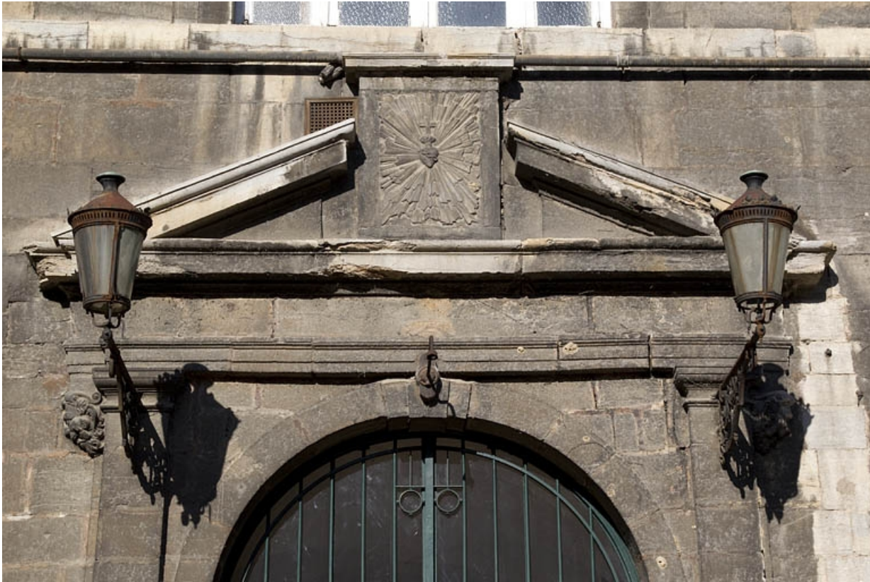
Façade antérieure, portail d'entrée : détail du fronton.

25, Besançon, 12 rue de l' Orme de Chamars, lieudit : îlot Saint-Jacques