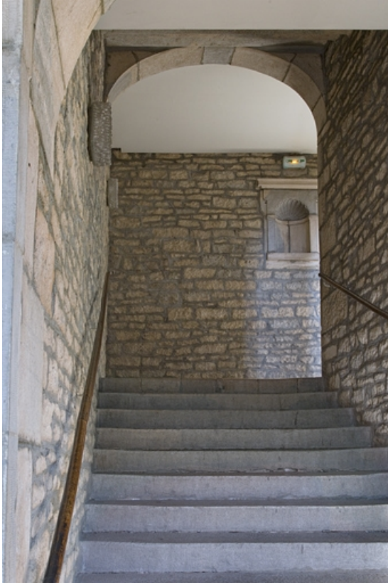
Intérieur : détail de la première volée de l'escalier.

25, Besançon, 12 rue de l' Orme de Chamars, lieudit : îlot Saint-Jacques