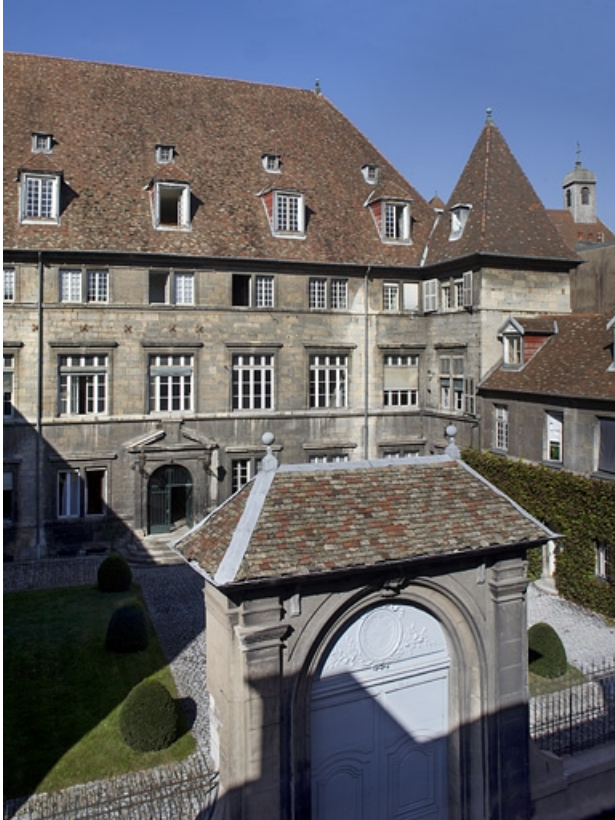
Vue d'ensemble de l'hôtel et de la cour, de trois quarts gauche.

25, Besançon, 12 rue de l' Orme de Chamars, lieudit : îlot Saint-Jacques