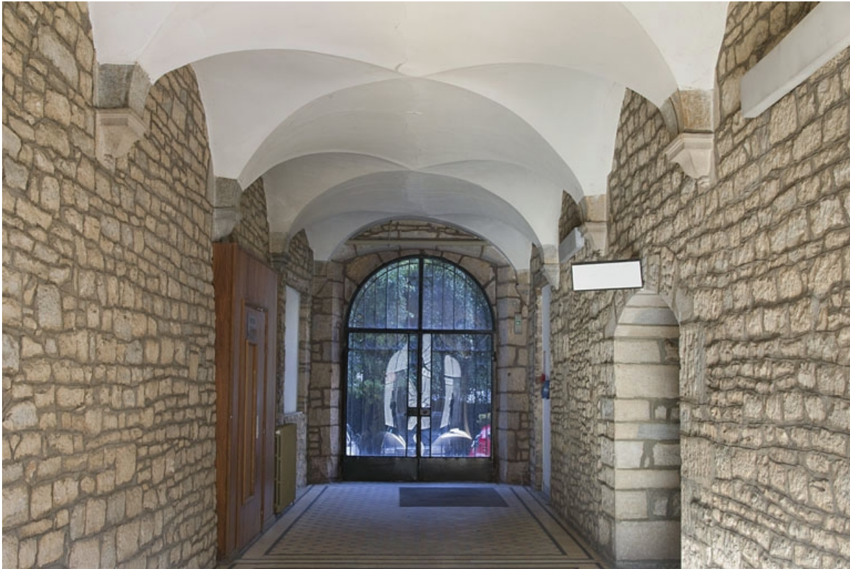
Intérieur : vue d'ensemble du couloir depuis l'entrée.

25, Besançon, 12 rue de l' Orme de Chamars, lieudit : îlot Saint-Jacques