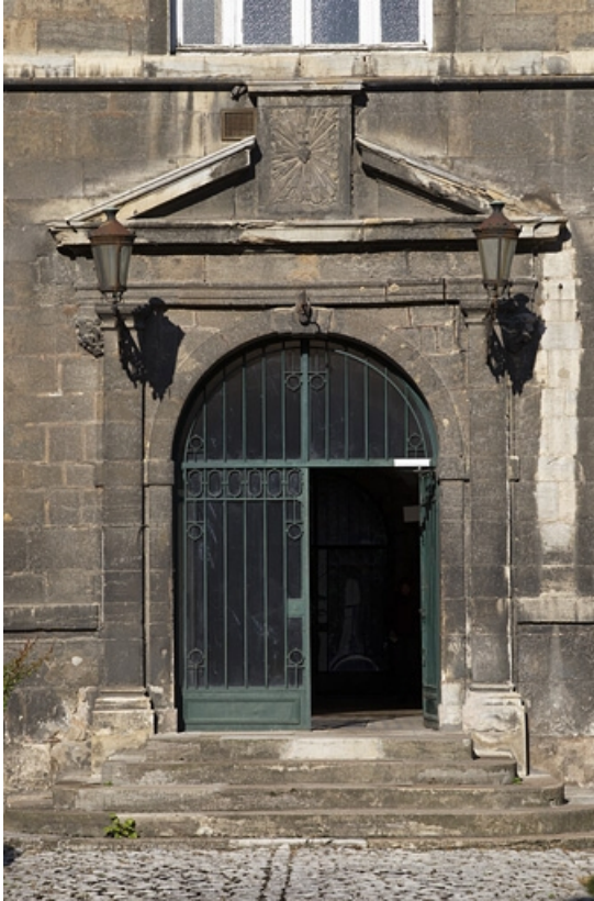
Façade antérieure : détail du portail d'entrée, de face.

25, Besançon, 12 rue de l' Orme de Chamars, lieudit : îlot Saint-Jacques