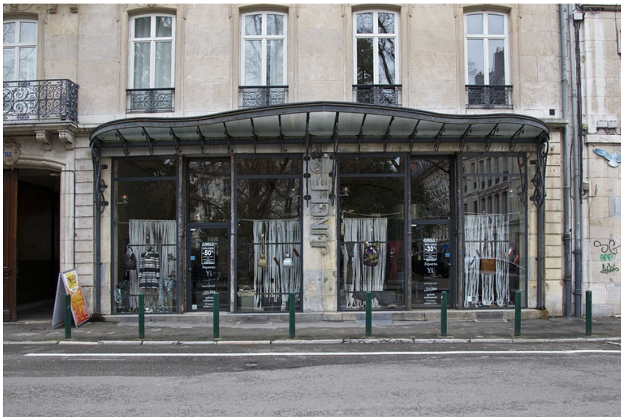
Logis principal, façade antérieure : détail de la boutique, côté rue Proudhon.

25, Besançon, 15 rue Proudhon, lieudit : îlot Morand