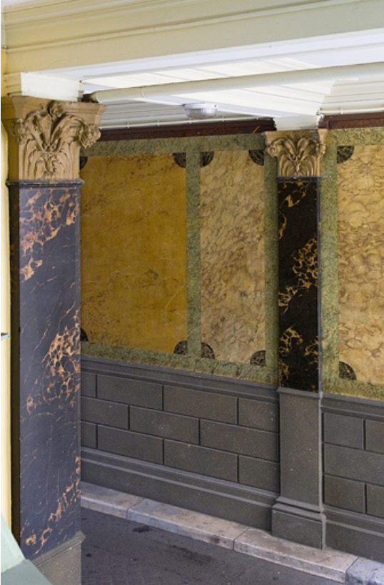
Logis principal, passage cocher côté rue Proudhon : détail du décor en faux marbre, vue rapprochée.

25, Besançon, 15 rue Proudhon, lieudit : îlot Morand