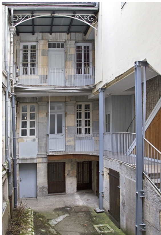
Logis secondaire, deuxième cour, vue d'ensemble de la façade en fond de cour. 25, Besançon, 49 rue des Granges, lieudit : îlot Morand