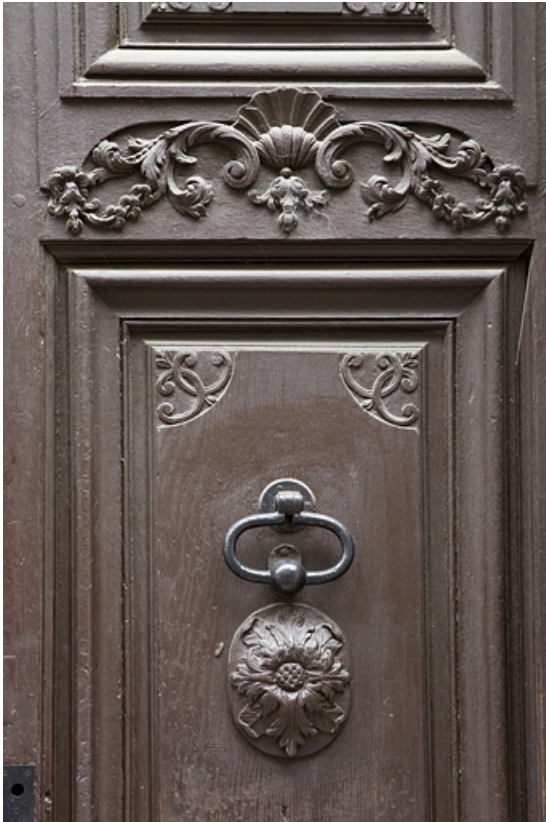
Façade antérieure, porte d'entrée : détail du décor. 25, Besançon, 6 rue du Lycée, lieudit : îlot Saint-Jacques