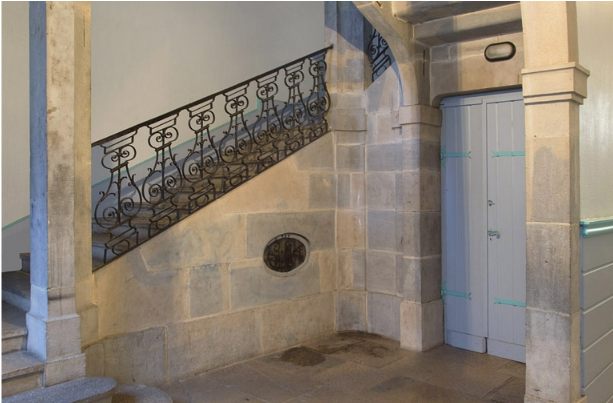
Intérieur, escalier : détail de la rampe en ferronnerie. 25, Besançon, 6 rue du Lycée, lieudit : îlot Saint-Jacques