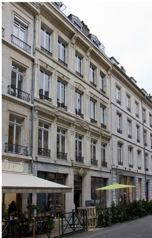
Vue d'ensemble de trois quarts gauche.

25, Besançon, 8 rue Morand, lieudit : îlot Proudhon