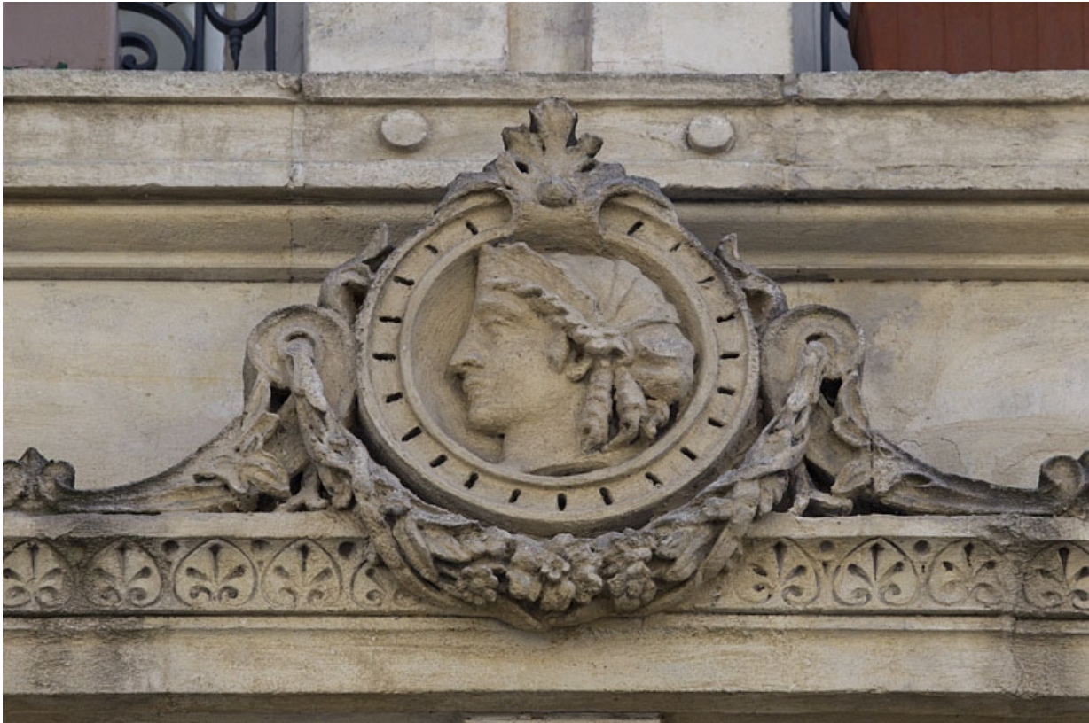
Façade antérieure, premier étage : détail rapproché du décor de la frise droite.

25, Besançon, 8 rue Morand, lieudit : îlot Proudhon