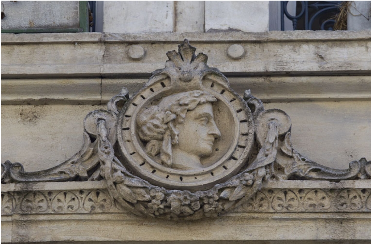
Façade antérieure, premier étage : détail rapproché du décor de la frise gauche.

25, Besançon, 8 rue Morand, lieudit : îlot Proudhon