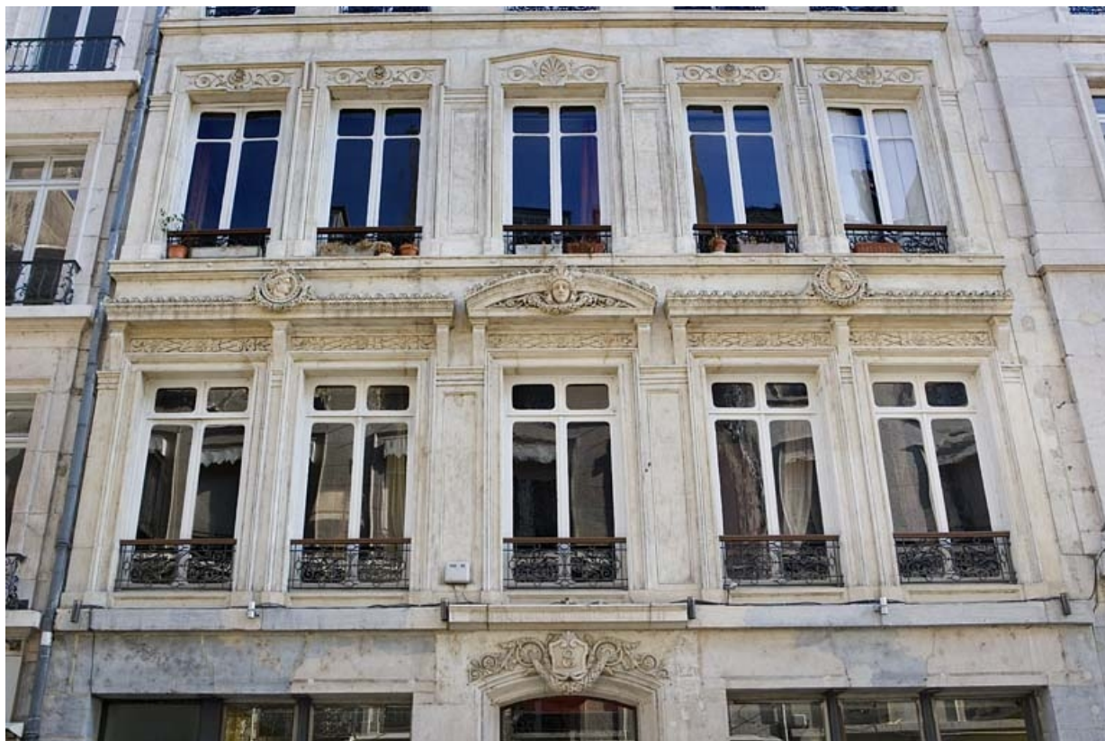
Vue d'ensemble de la façade sur rue, de face.

25, Besançon, 8 rue Morand, lieudit : îlot Proudhon