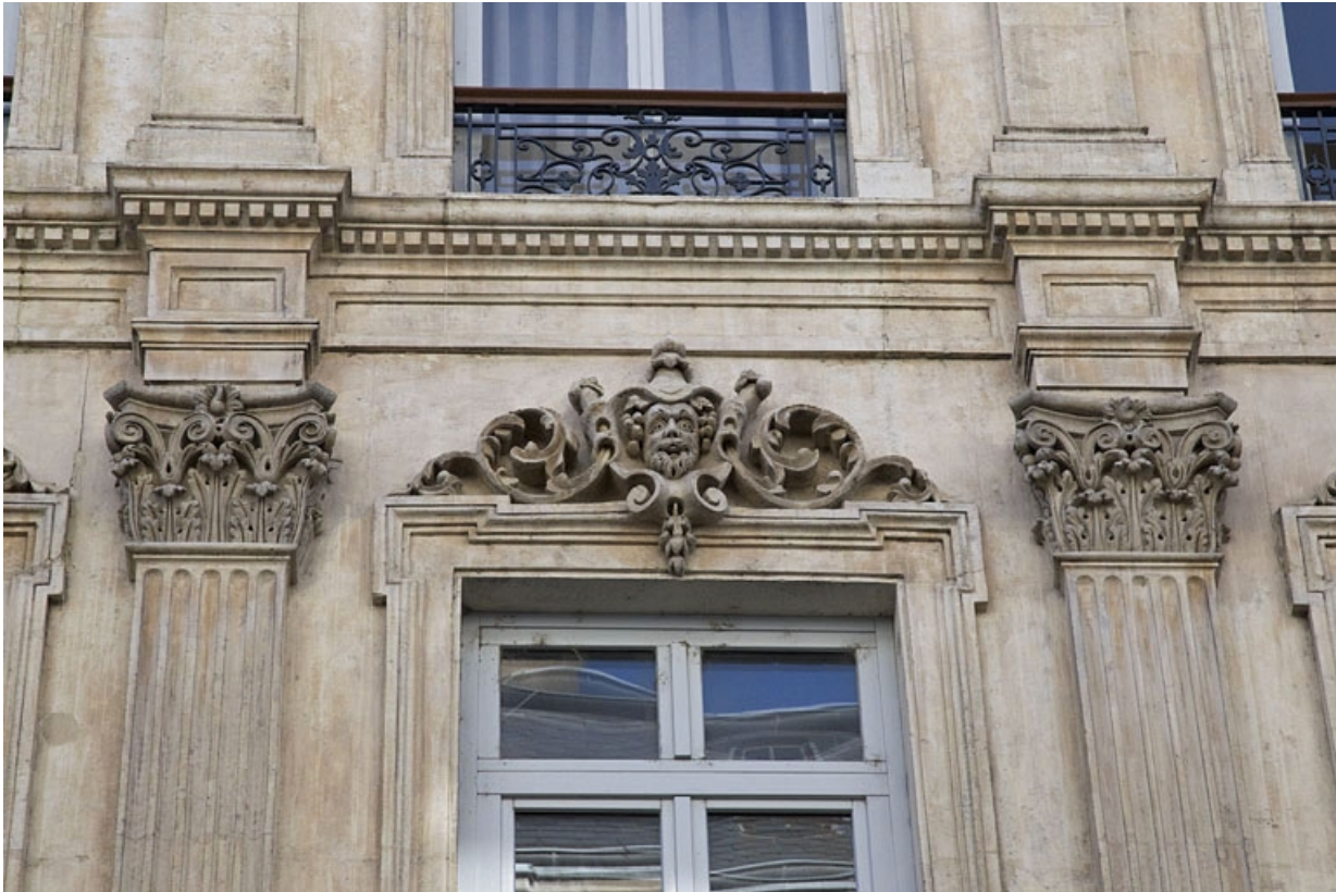
Façade antérieure : détail d'un mascaron sur le linteau d'une fenêtre du deuxième étage.

25, Besançon, 16 rue Morand, lieudit : îlot Proudhon