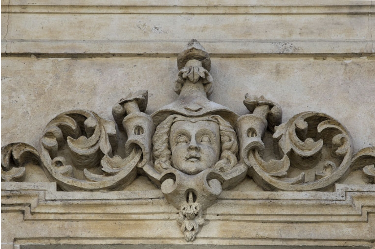
Façade antérieure, vue rapprochée d'un mascaron sur une fenêtre du deuxième étage : personnage féminin. 25, Besançon, 16 rue Morand, lieudit : îlot Proudhon