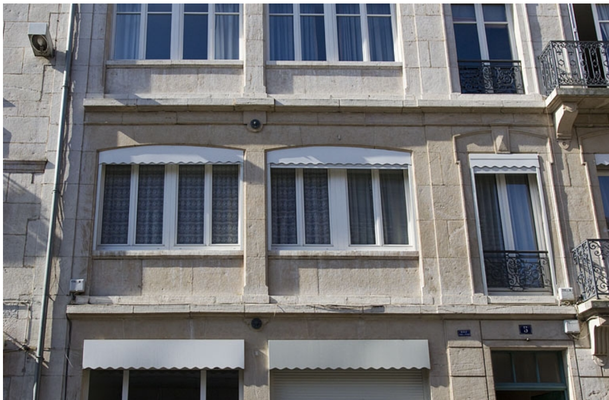
Détail de deux baies horlogères du premier étage.

25, Besançon, 5 rue Proudhon, lieudit : îlot Proudhon