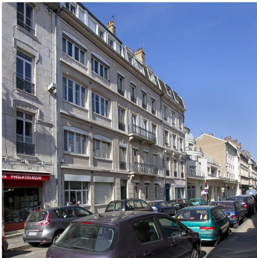
Vue d'ensemble, de trois quarts gauche.

25, Besançon, 5 rue Proudhon, lieudit : îlot Proudhon