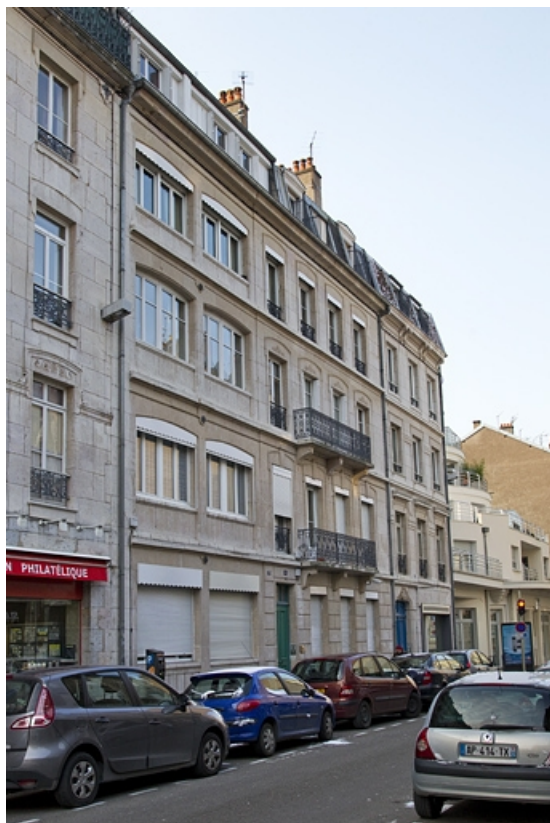
Vue d'ensemble rapprochée, de trois quarts gauche. 25, Besançon