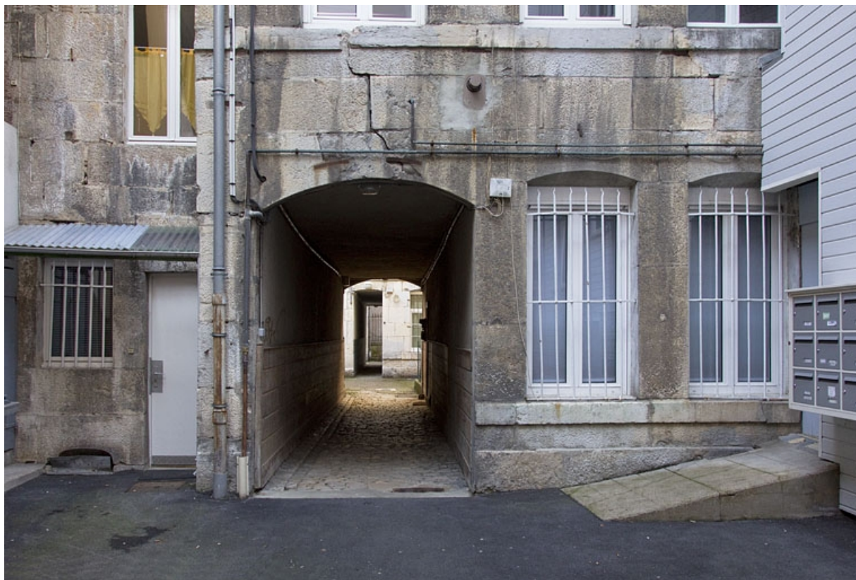
Premier logis secondaire : détail du passage cocher.

25, Besançon, 33 rue Bersot, lieudit : îlot Proudhon