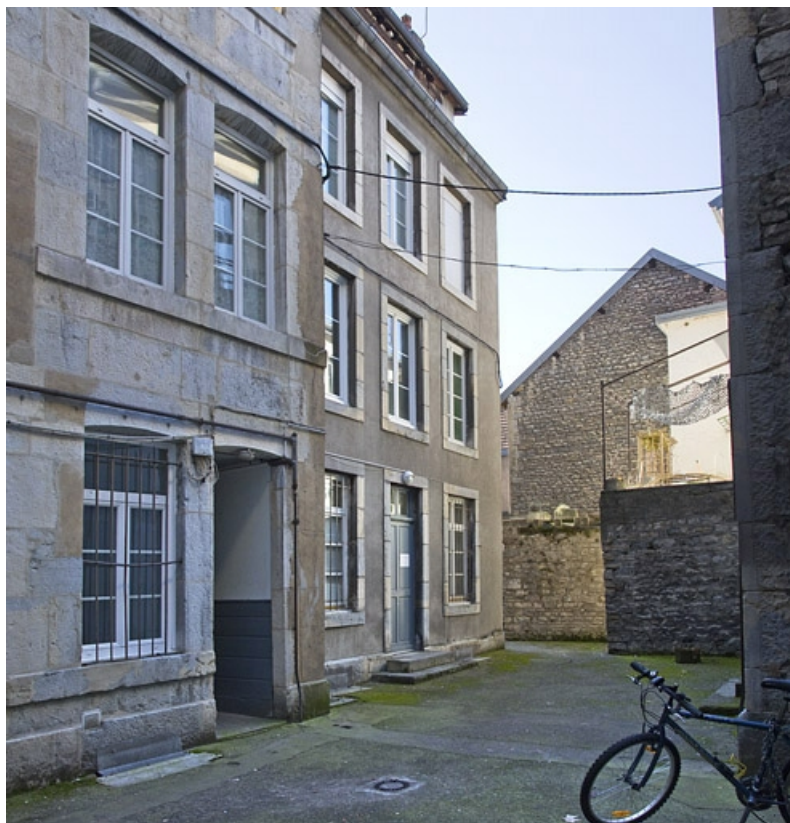
Vue de la troisième cour.

25, Besançon, 33 rue Bersot, lieudit : îlot Proudhon