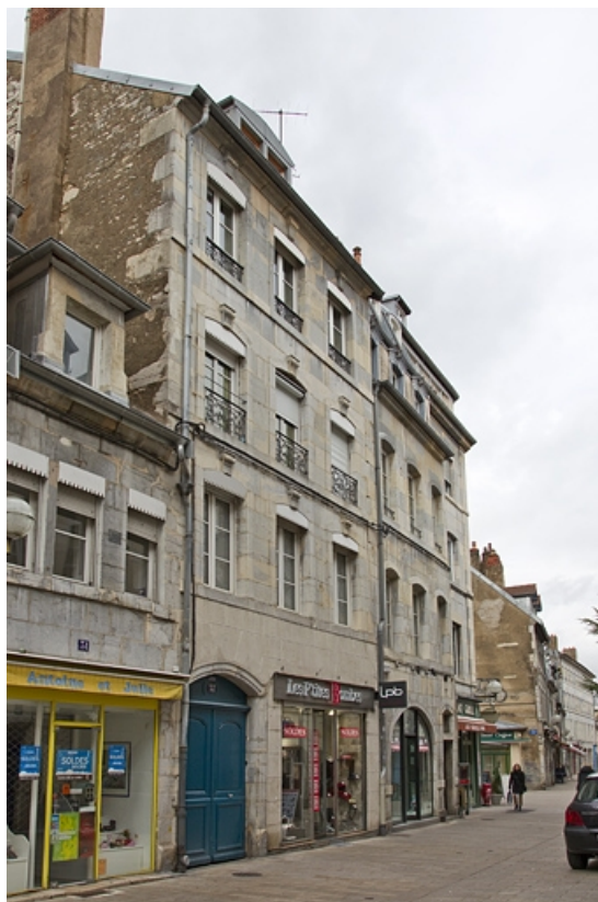
Vue d'ensemble du logis principal de trois quarts gauche.

25, Besançon, 33 rue Bersot, lieudit : îlot Proudhon