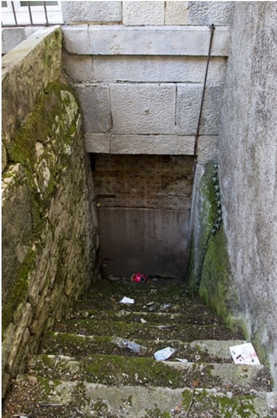
Détail de l'entrée de cave du deuxième logis secondaire.

25, Besançon, 33 rue Bersot, lieudit : îlot Proudhon