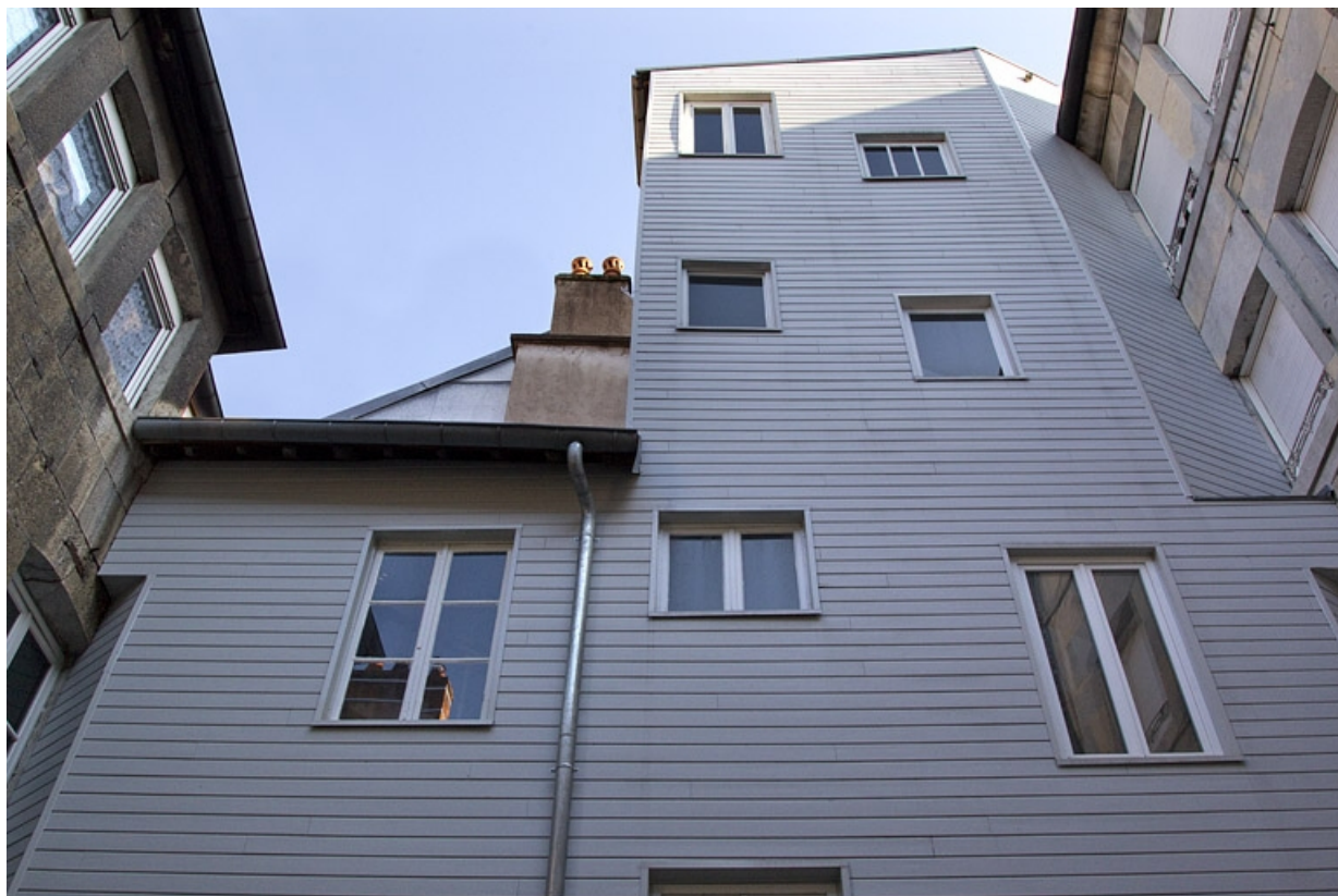
Détail de la paroi extérieure de la cage d'escalier.

25, Besançon, 33 rue Bersot, lieudit : îlot Proudhon