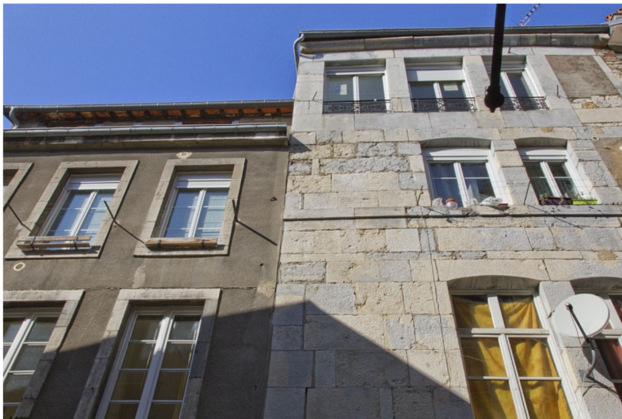
Deuxième logis secondaire : détail de la partie supérieure de la façade postérieure.

25, Besançon, 33 rue Bersot, lieudit : îlot Proudhon