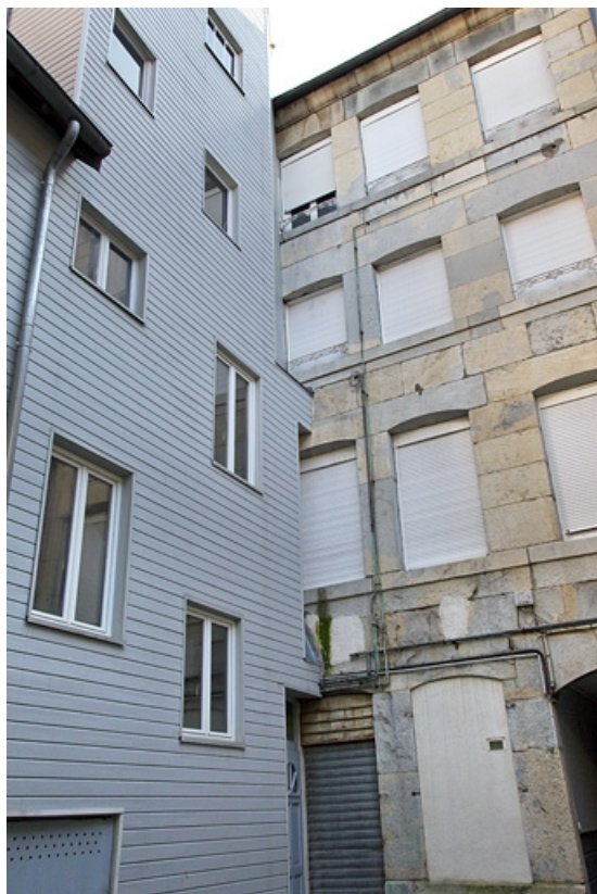
Détail de la façade postérieure du logis principal et de la paroi extérieure de la cage d'escalier.

25, Besançon, 33 rue Bersot, lieudit : îlot Proudhon