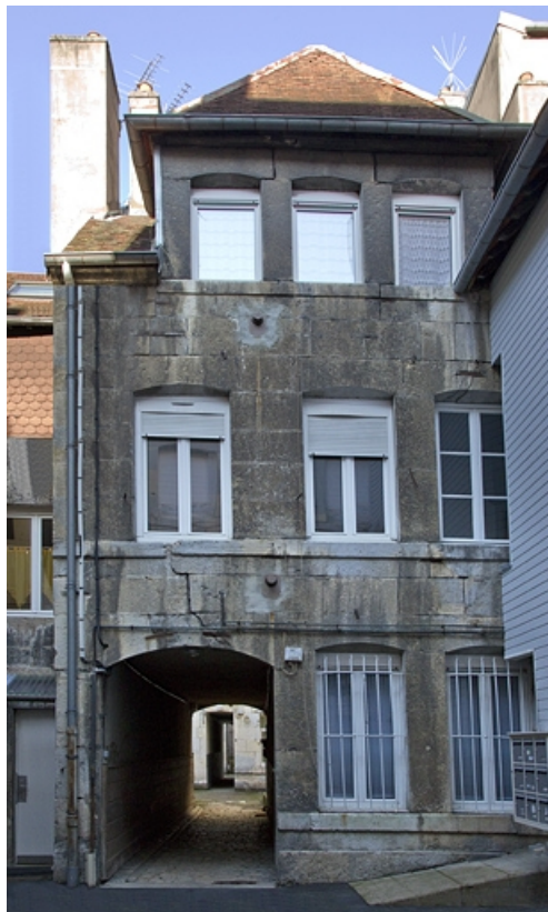
Vue d'ensemble de la façade antérieure du premier logis secondaire.

25, Besançon, 33 rue Bersot, lieudit : îlot Proudhon