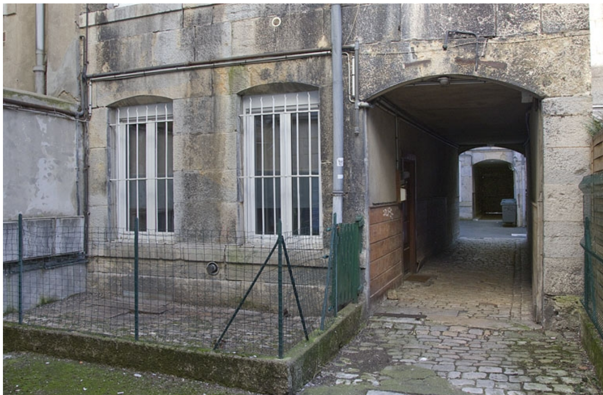
Deuxième cour, façade postérieure du premier logis secondaire : détail du rez-de-chaussée.

25, Besançon, 33 rue Bersot, lieudit : îlot Proudhon