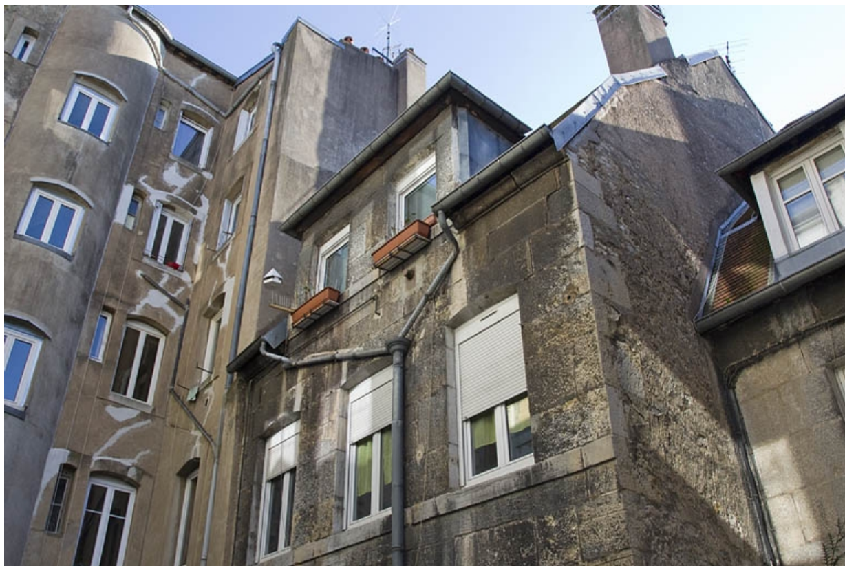
Deuxième cour : façade postérieure du premier logis secondaire.

25, Besançon, 33 rue Bersot, lieudit : îlot Proudhon