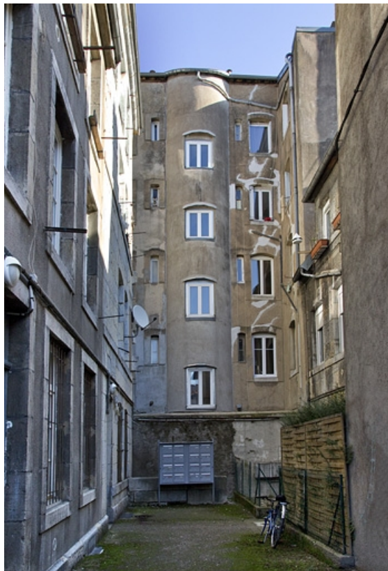
Vue de la deuxième cour.

25, Besançon, 33 rue Bersot, lieudit : îlot Proudhon