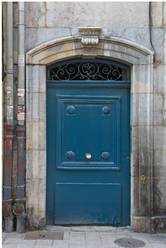
Façade sur rue : détail de la porte du couloir.

25, Besançon, 3 rue Bersot, lieudit : îlot Proudhon