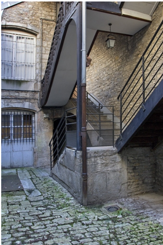
Vue d'ensemble de l'escalier à cage ouverte sur cour.

25, Besançon, 3 rue Bersot, lieudit : îlot Proudhon