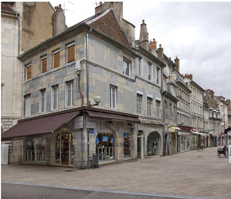
Vue d'ensemble depuis l'angle de la rue Bersot.

25, Besançon, 3 rue Bersot, lieudit : îlot Proudhon