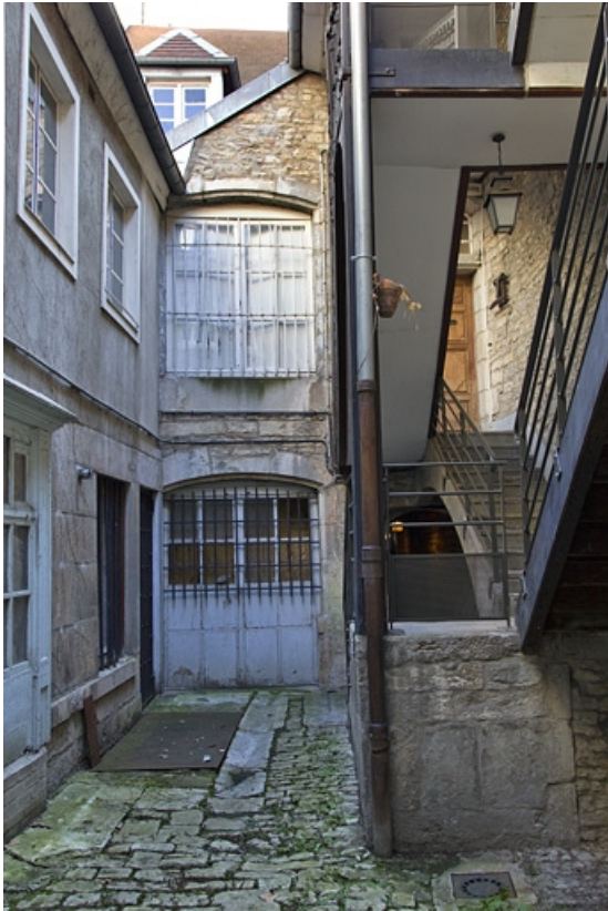
Vue d'ensemble de la façade postérieure du logis principal et de l'aile, depuis le fond de la cour.

25, Besançon, 3 rue Bersot, lieudit : îlot Proudhon