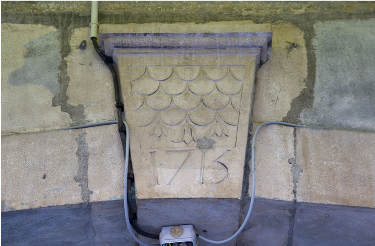
Façade sur rue : détail de la clé de l'arcade boutiquière.

25, Besançon, 3 rue Bersot, lieudit : îlot Proudhon