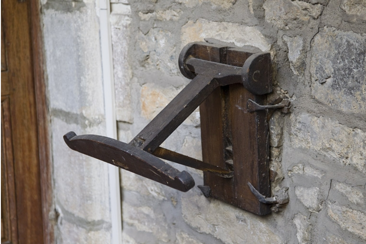
Logis principal, façade sur cour : détail d'un objet en bois non identifié (lutrín ?) situé à côté de la porte d'entrée de l'appartement du premier étage.

25, Besançon, 3 rue Bersot, lieudit : îlot Proudhon