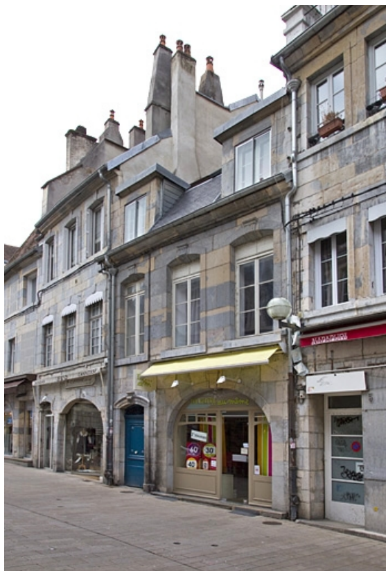
Façade sur rue, de trois quarts droit.

25, Besançon, 3 rue Bersot, lieudit : îlot Proudhon