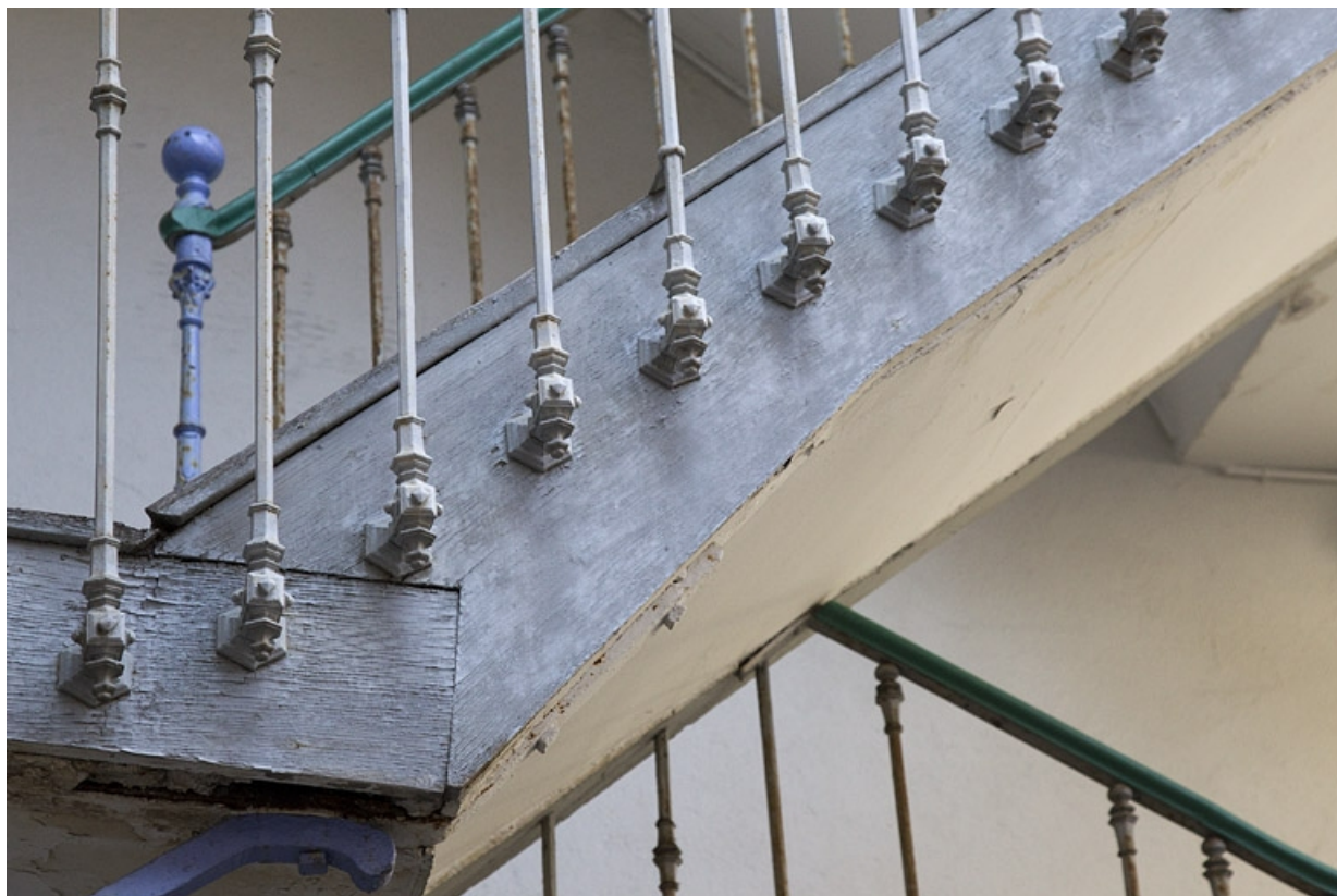
Escalier à cage ouverte dans la deuxième cour : détail de la rampe.

25, Besançon, 73 rue des Granges, lieudit : îlot Proudhon