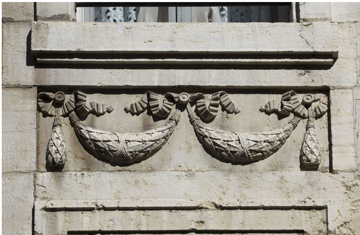
Logis principal, façade antérieure, détail du décor d'une table rentrante : festons.

25, Besançon, 73 rue des Granges, lieudit : îlot Proudhon