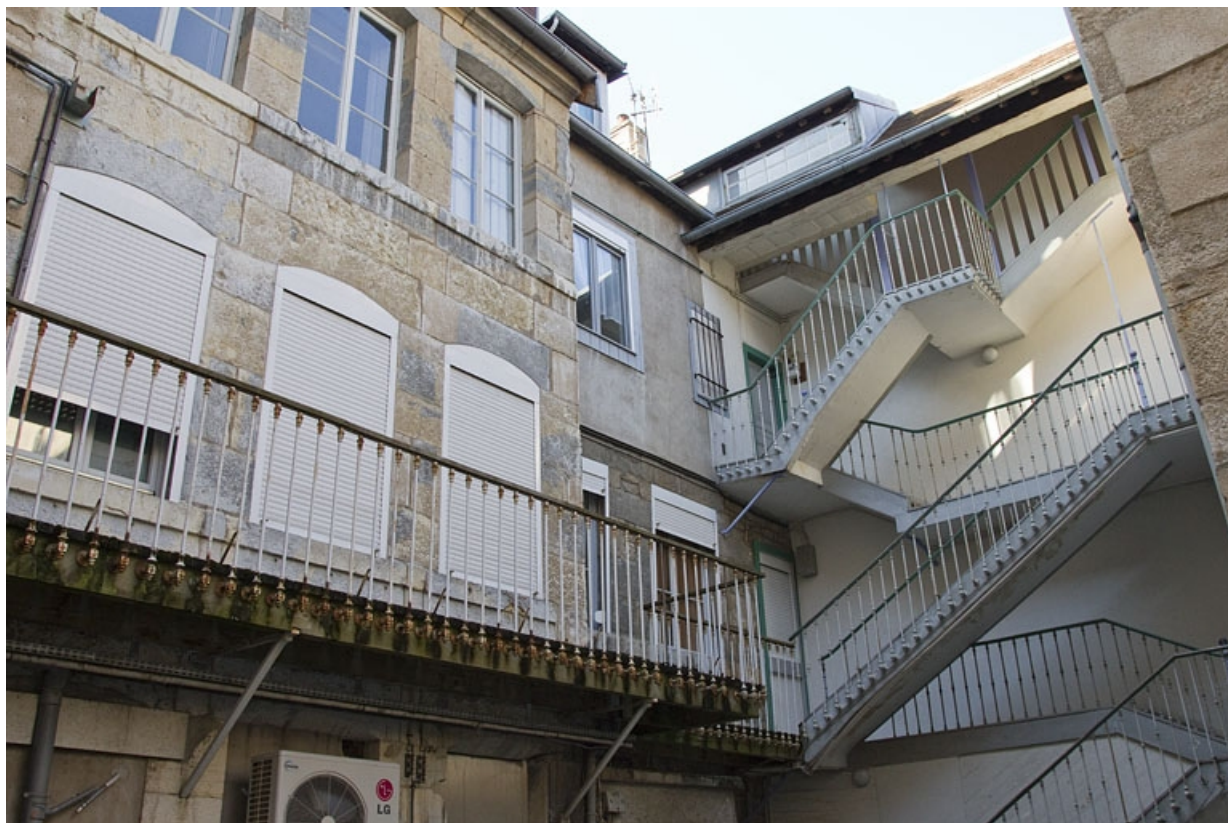
Vue de l'escalier à cage ouverte dans la deuxième cour : partie haute.

25, Besançon, 73 rue des Granges, lieudit : îlot Proudhon