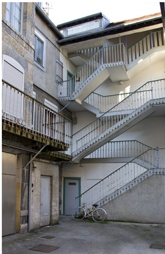
Vue de l'escalier à cage ouverte dans la deuxième cour.

25, Besançon, 73 rue des Granges, lieudit : îlot Proudhon