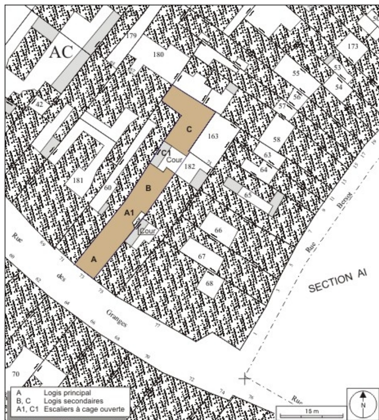
Plan masse et de situation. Extrait du plan cadastral, 1974, section AC. 25, Besançon, 73 rue des Granges, lieudit : îlot Proudhon