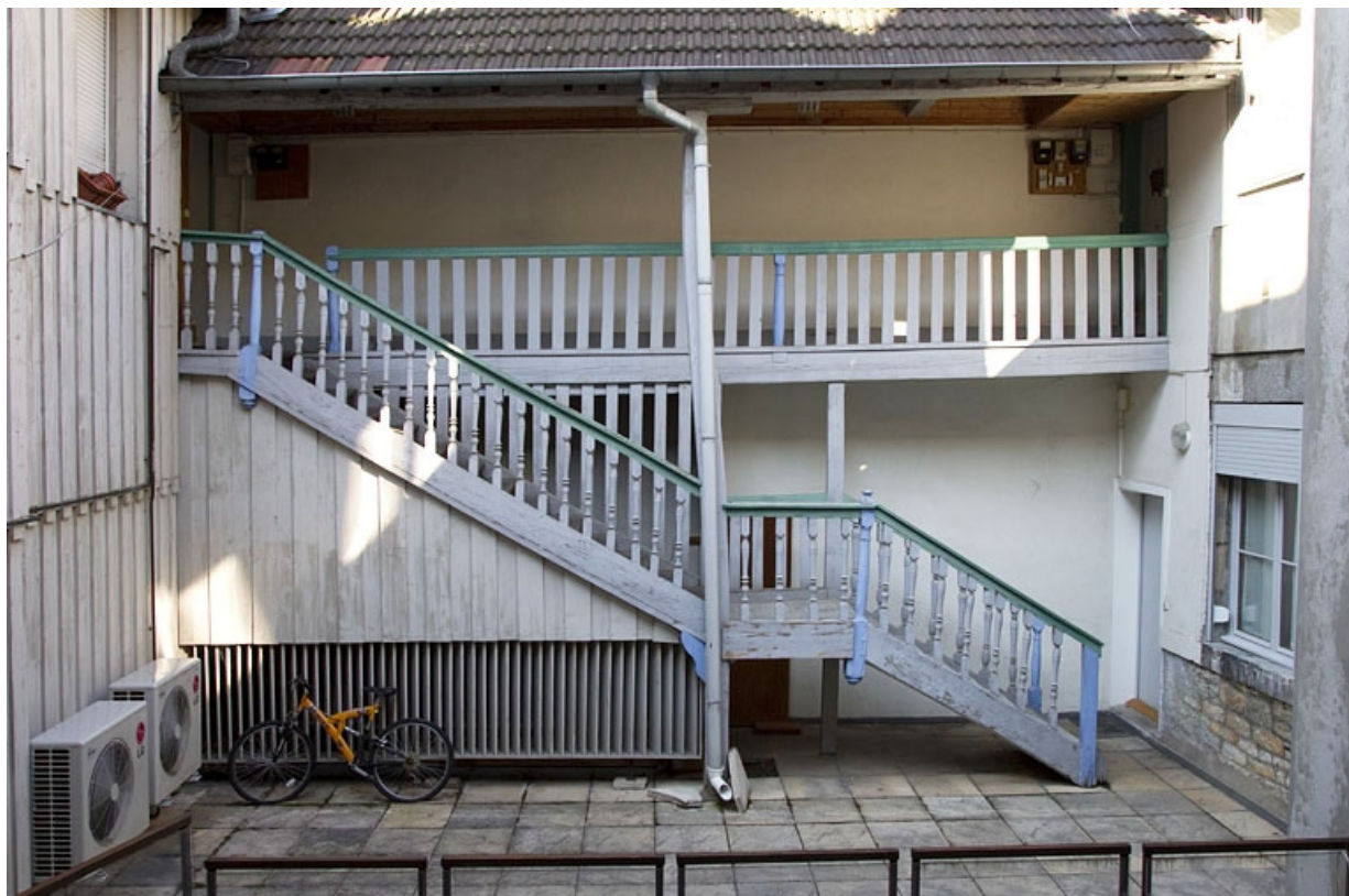
Première cour (couverte) : vue de l'escalier à cage ouverte.

25, Besançon, 73 rue des Granges, lieudit : îlot Proudhon