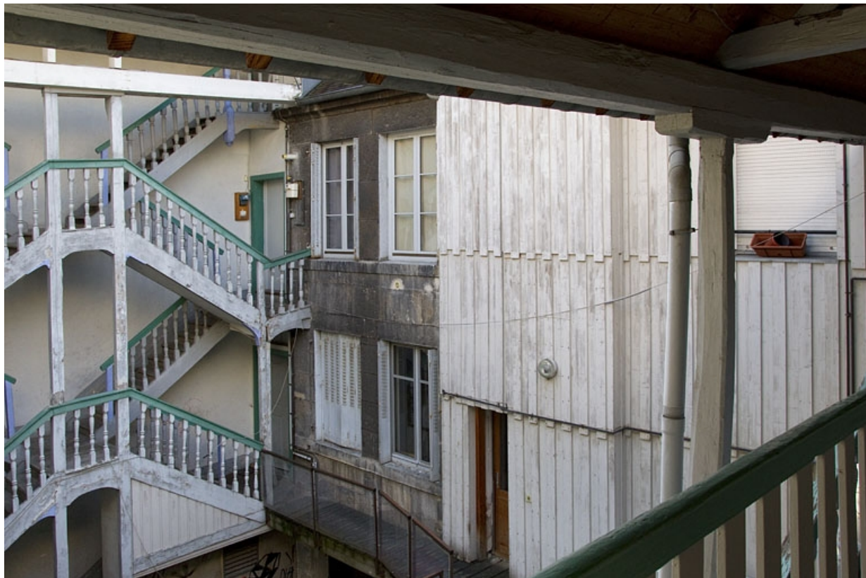
Logis principal : façade postérieure depuis l'escalier à cage ouverte, avec vue sur l'escalier du n° 75 rue des Granges. 25, Besançon, 73 rue des Granges, lieudit : îlot Proudhon