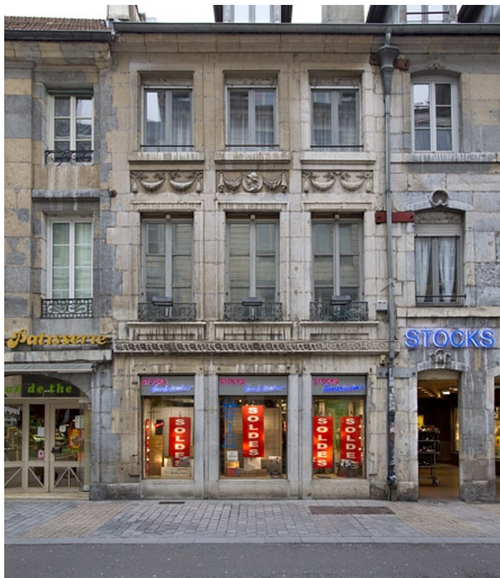
Logis principal : vue d'ensemble de la façade antérieure, de face.

25, Besançon, 73 rue des Granges, lieudit : îlot Proudhon