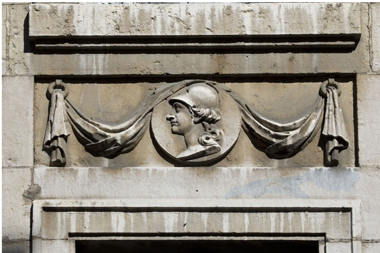
Logis principal, façade antérieure, détail du décor d'une table rentrante : tête d'homme casqué. 25, Besançon, 73 rue des Granges, lieudit : îlot Proudhon