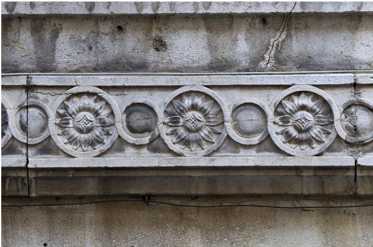
Logis principal, façade antérieure, détail du décor de la frise.

25, Besançon, 73 rue des Granges, lieudit : îlot Proudhon