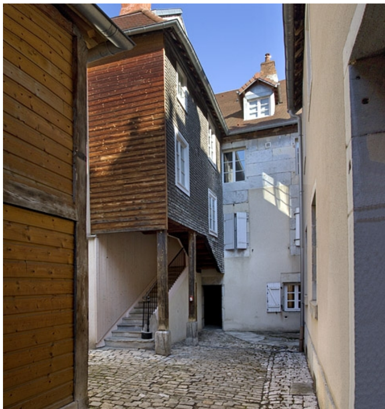
Logis secondaire : détail de l'escalier à cage ouverte.

25, Besançon, 69 rue des Granges, lieudit : îlot Proudhon