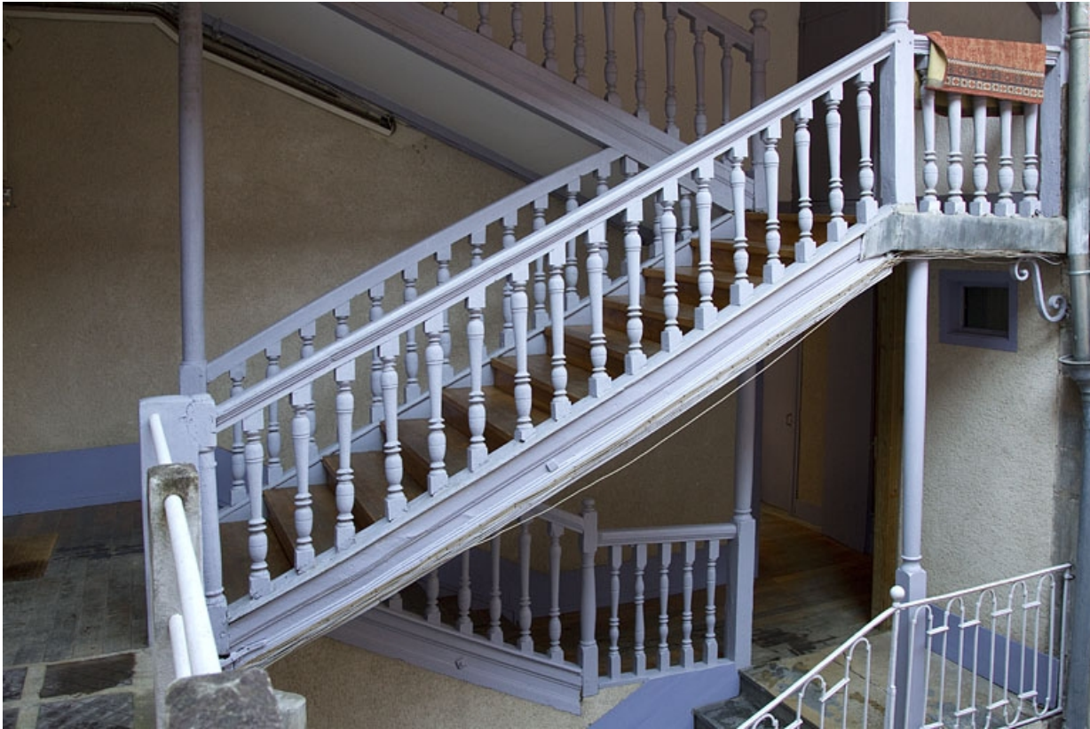
Détail de l'escalier à cage ouverte dans la première cour.

25, Besançon, 69 rue des Granges, lieudit : îlot Proudhon