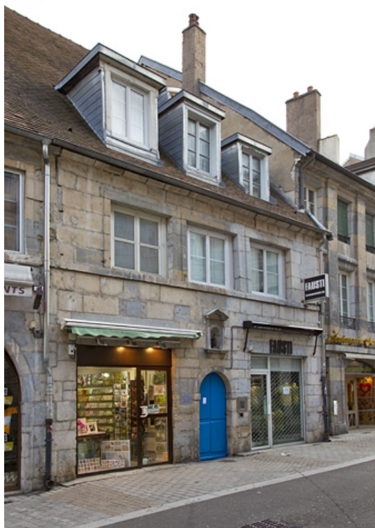
Vue d'ensemble du logis principal, de trois quarts gauche.

25, Besançon, 69 rue des Granges, lieudit : îlot Proudhon