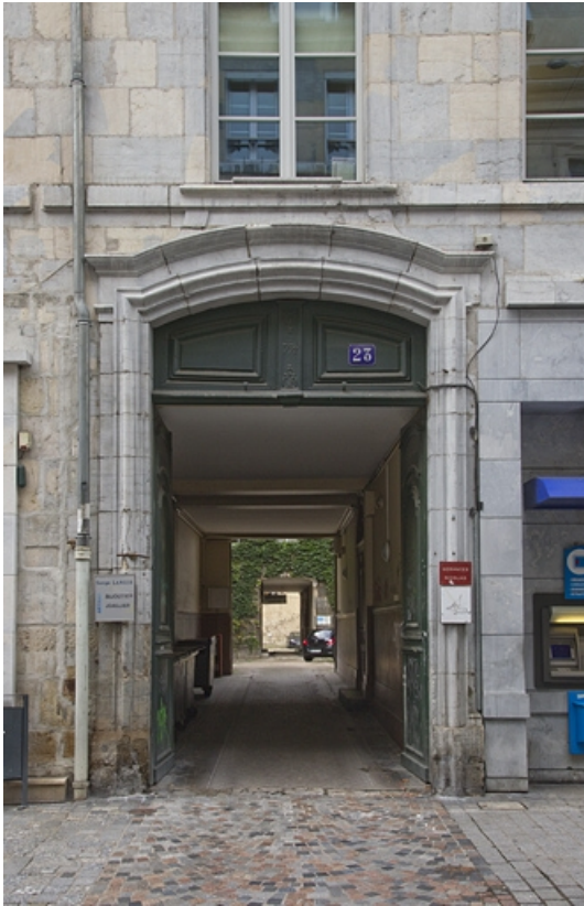
Logis principal, façade antérieure : détail du portail d'entrée.

25, Besançon, 23 rue des Granges, lieudit : îlot Poste