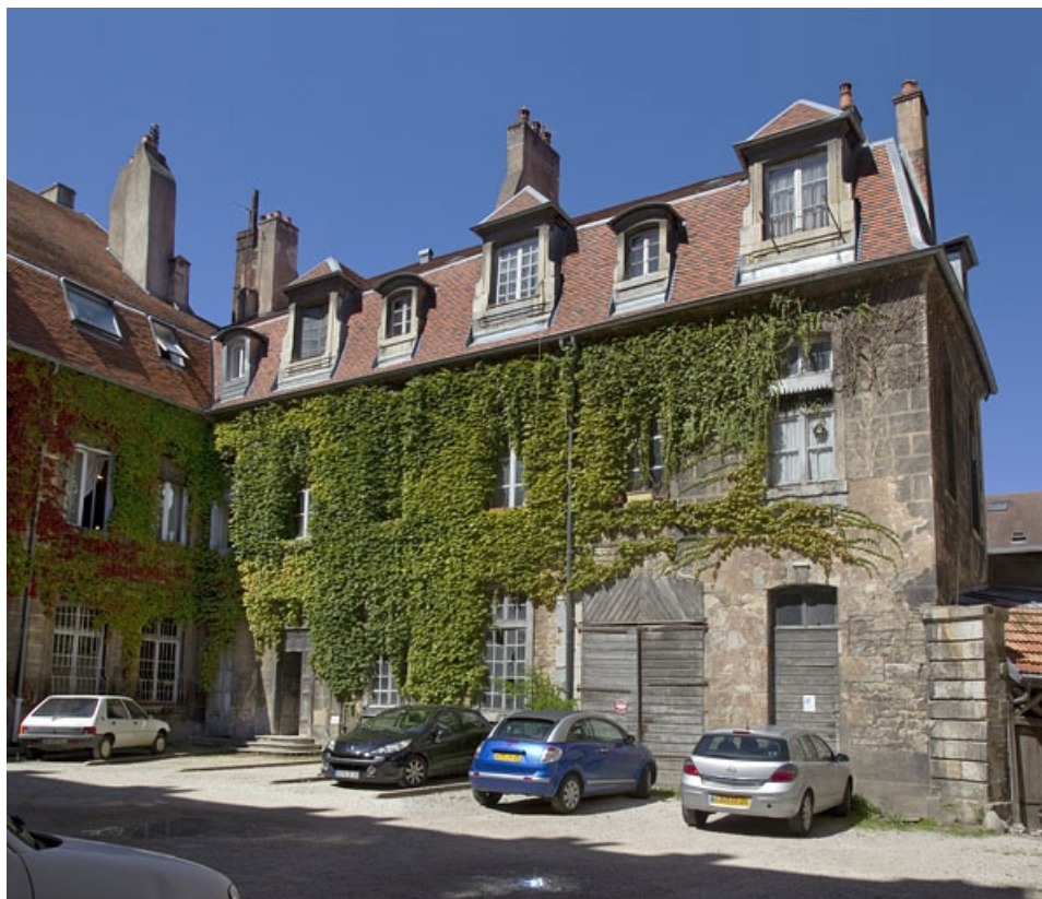
Logis secondaire, aile gauche dans la deuxième cour : vue d'ensemble, de trois quarts droit. 25, Besançon, 23 rue des Granges, lieudit : îlot Poste