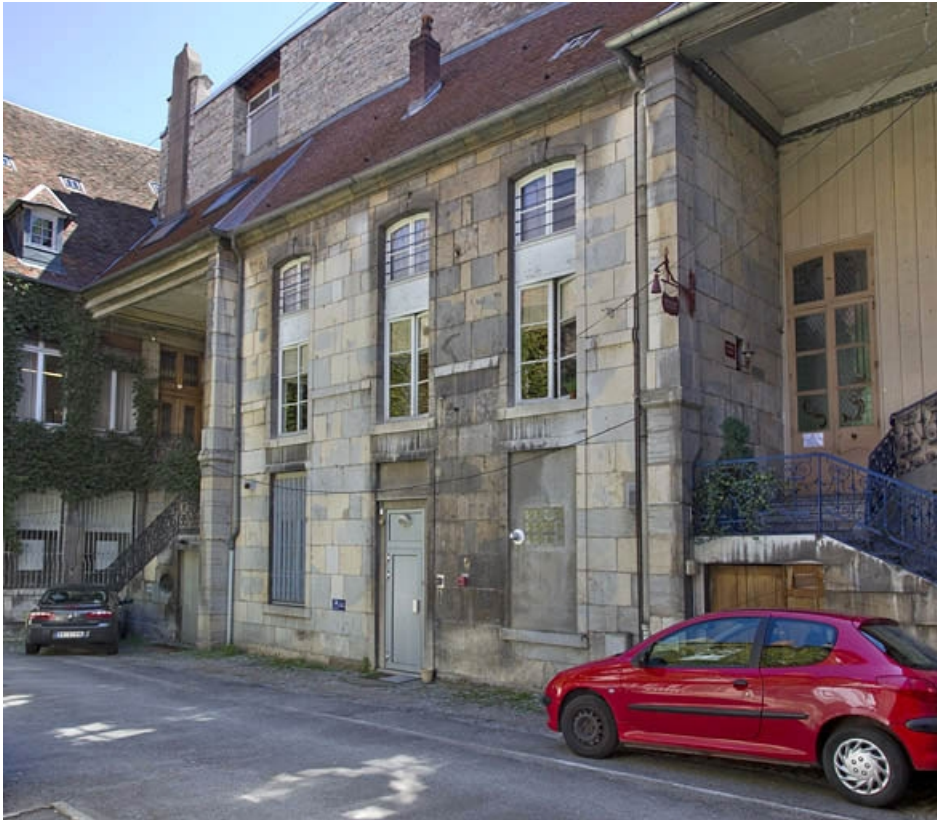
Première cour, aile droite : vue d'ensemble, de trois quarts droit.

25, Besançon, 23 rue des Granges, lieudit : îlot Poste