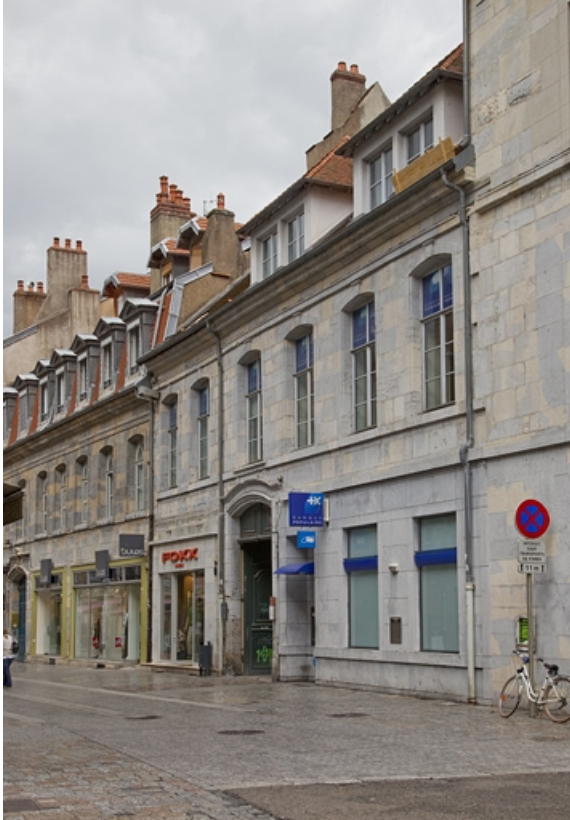
Vue d'ensemble depuis la rue : de trois quarts droit. 25, Besançon, 23 rue des Granges, lieudit : îlot Poste