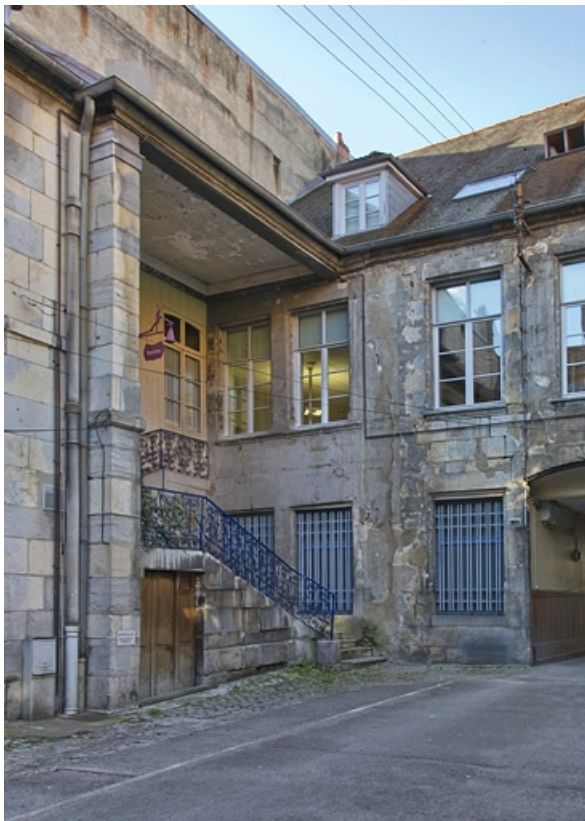
Première cour, aile droite : vue d'ensemble du premier escalier à cage ouverte, de trois quarts gauche. 25, Besançon, 23 rue des Granges, lieu-dit : îlot Poste