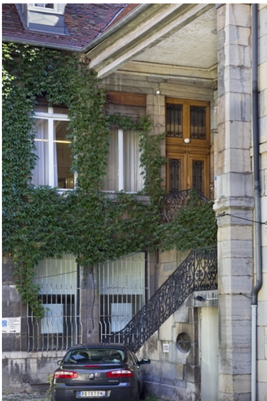
Aile droite, deuxième escalier à cage ouverte : vue d'ensemble de trois quarts droit. 25, Besançon, 23 rue des Granges, lieudit : îlot Poste