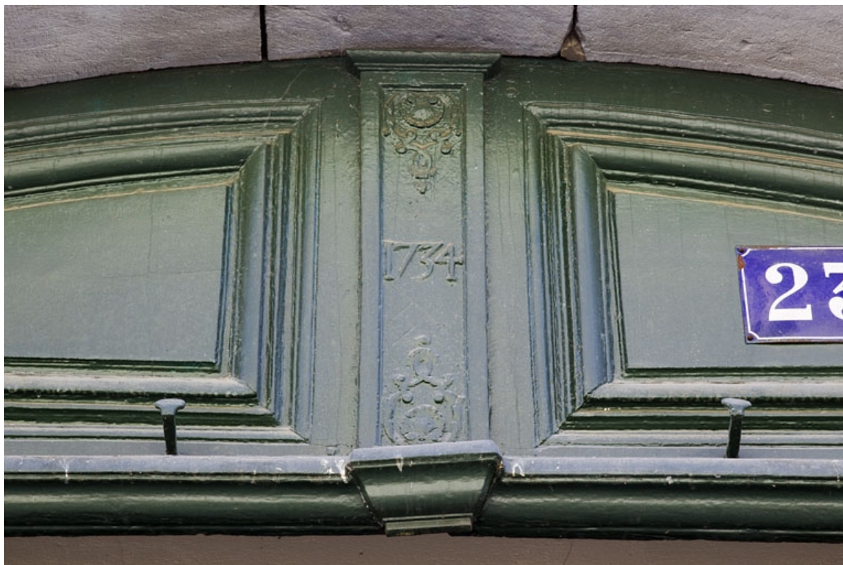
Logis principal, façade antérieure, portail d'entrée : détail du tympan de la porte.

25, Besançon, 23 rue des Granges, lieudit : îlot Poste