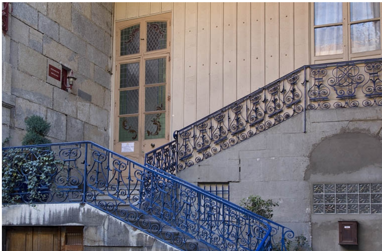
Première cour, aile droite, premier escalier à cage ouverte : détail de la rampe en fer forgé.

25, Besançon, 23 rue des Granges, lieudit : îlot Poste