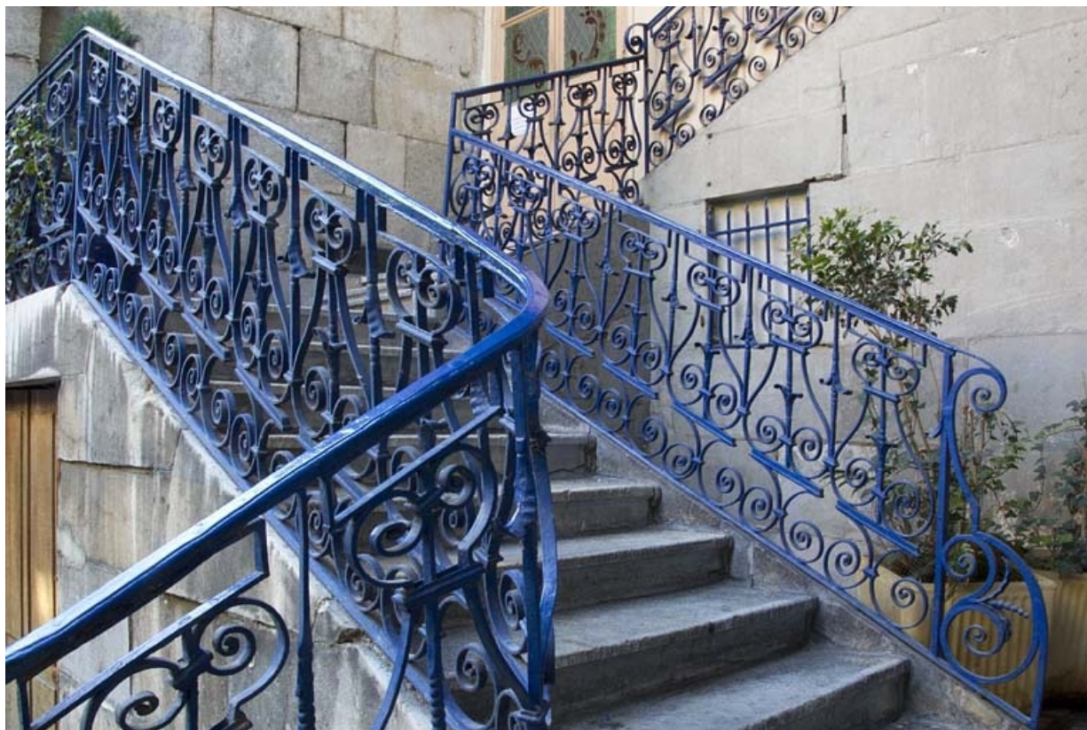
Aile droite, premier escalier à cage ouverte : vue d'ensemble depuis le départ de l'escalier.

25, Besançon, 23 rue des Granges, lieudit : îlot Poste