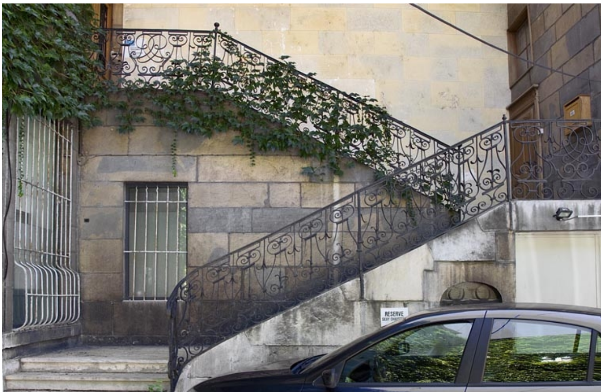
Aile droite, deuxième escalier à cage ouverte : vue d'ensemble de face. 25, Besançon, 23 rue des Granges, lieudit : îlot Poste