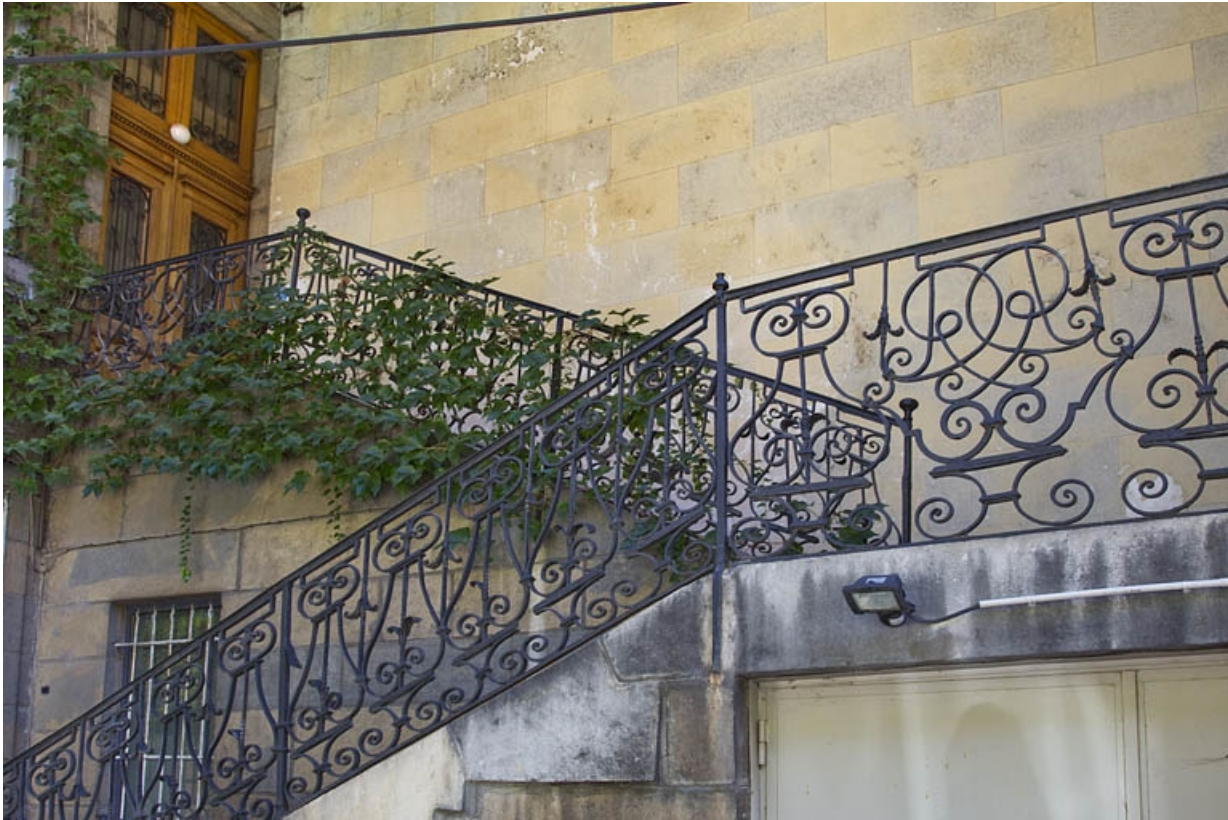
Aile droite, deuxième escalier à cage ouverte : détail de la rampe en fer forgé. 25, Besançon, 23 rue des Granges, lieudit : îlot Poste