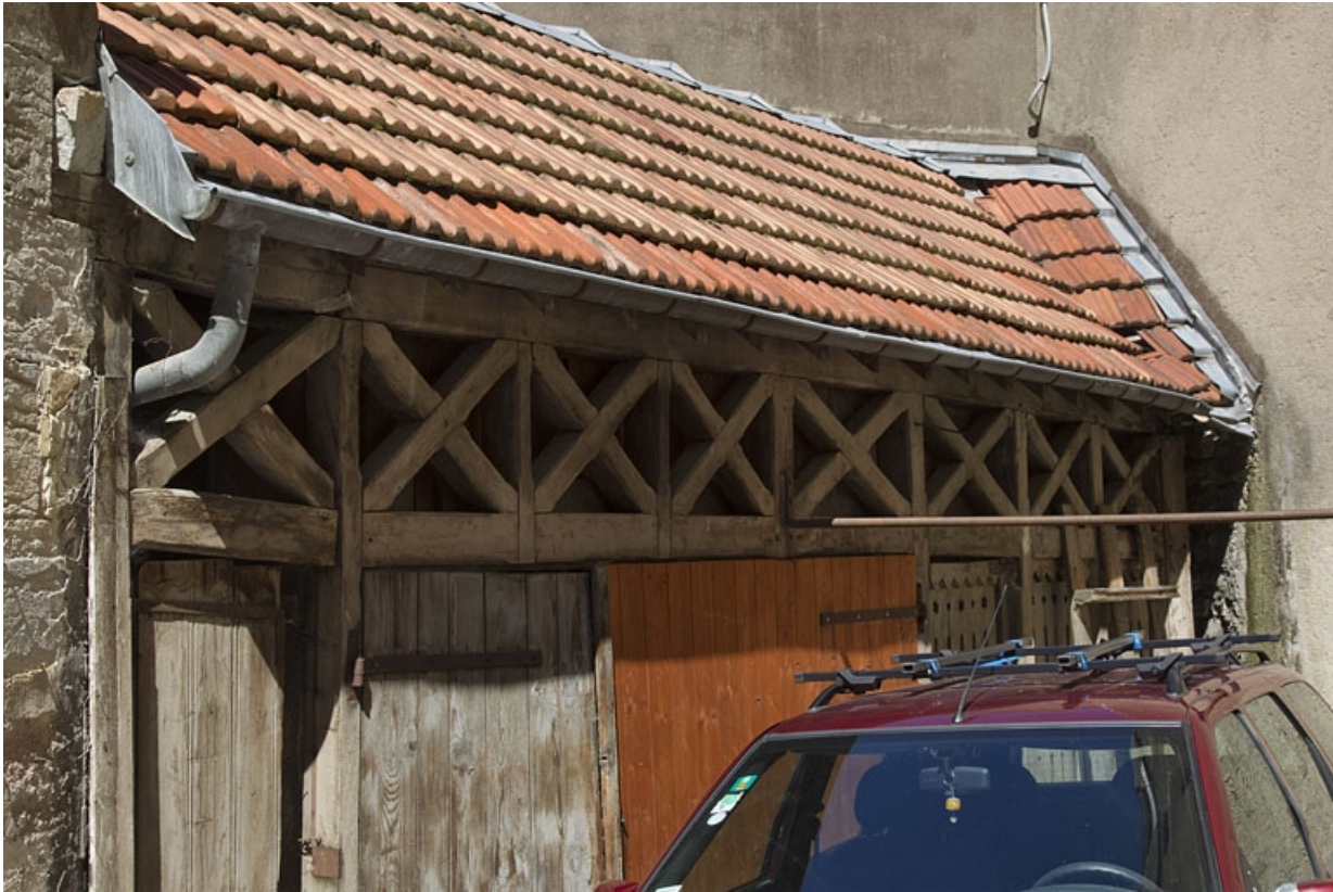
Deuxième cour, bûcher : vue rapprochée, de trois quarts gauche.

25, Besançon, 23 rue des Granges, lieudit : îlot Poste