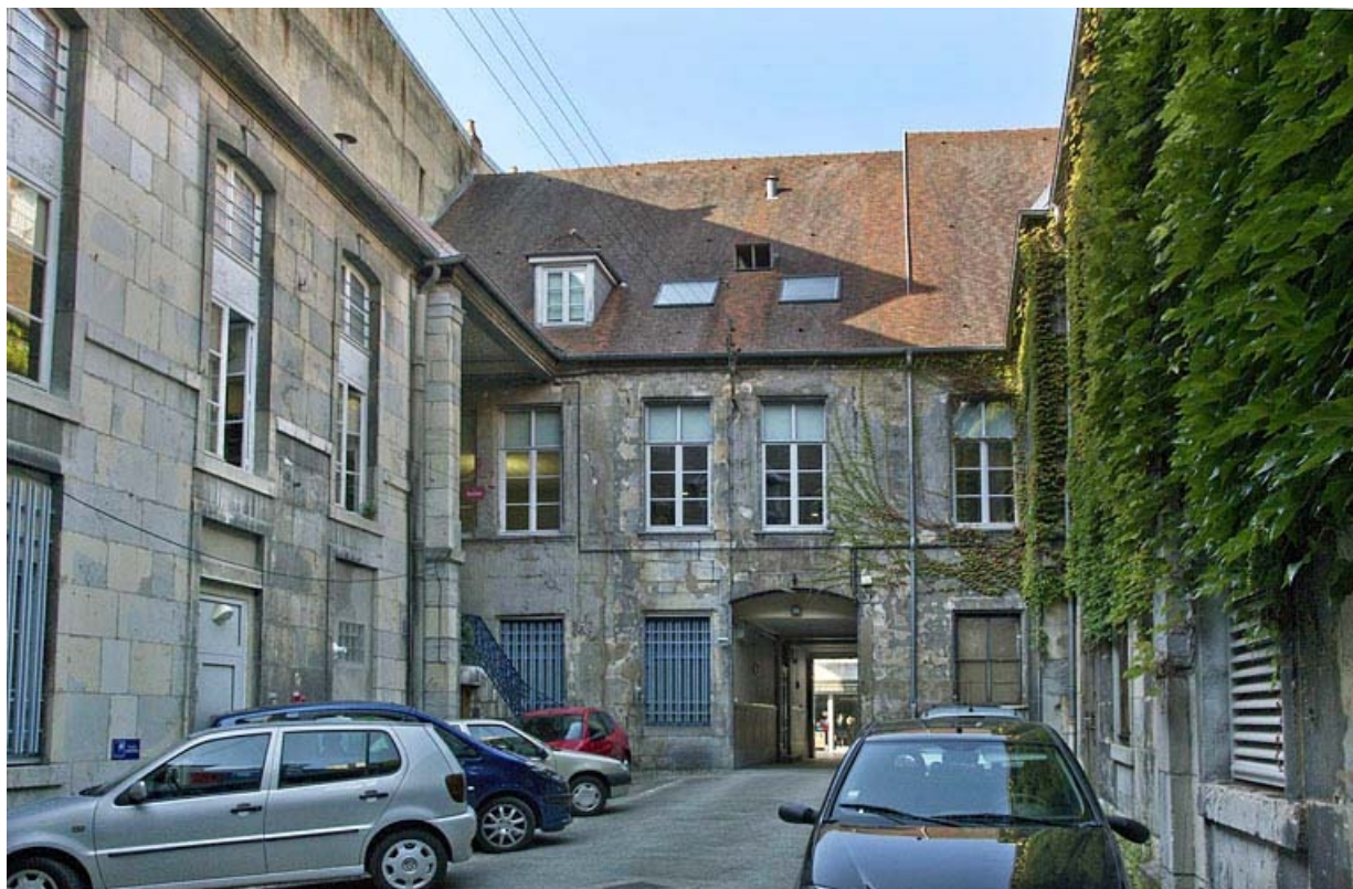
Vue d'ensemble de la première cour depuis le fond.

25, Besançon, 23 rue des Granges, lieudit : îlot Poste