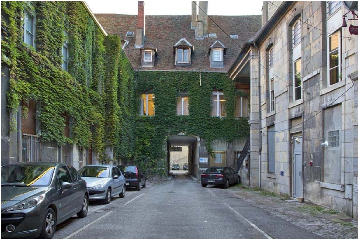
Vue d'ensemble de la première cour depuis l'entrée.

25, Besançon, 23 rue des Granges, lieudit : îlot Poste