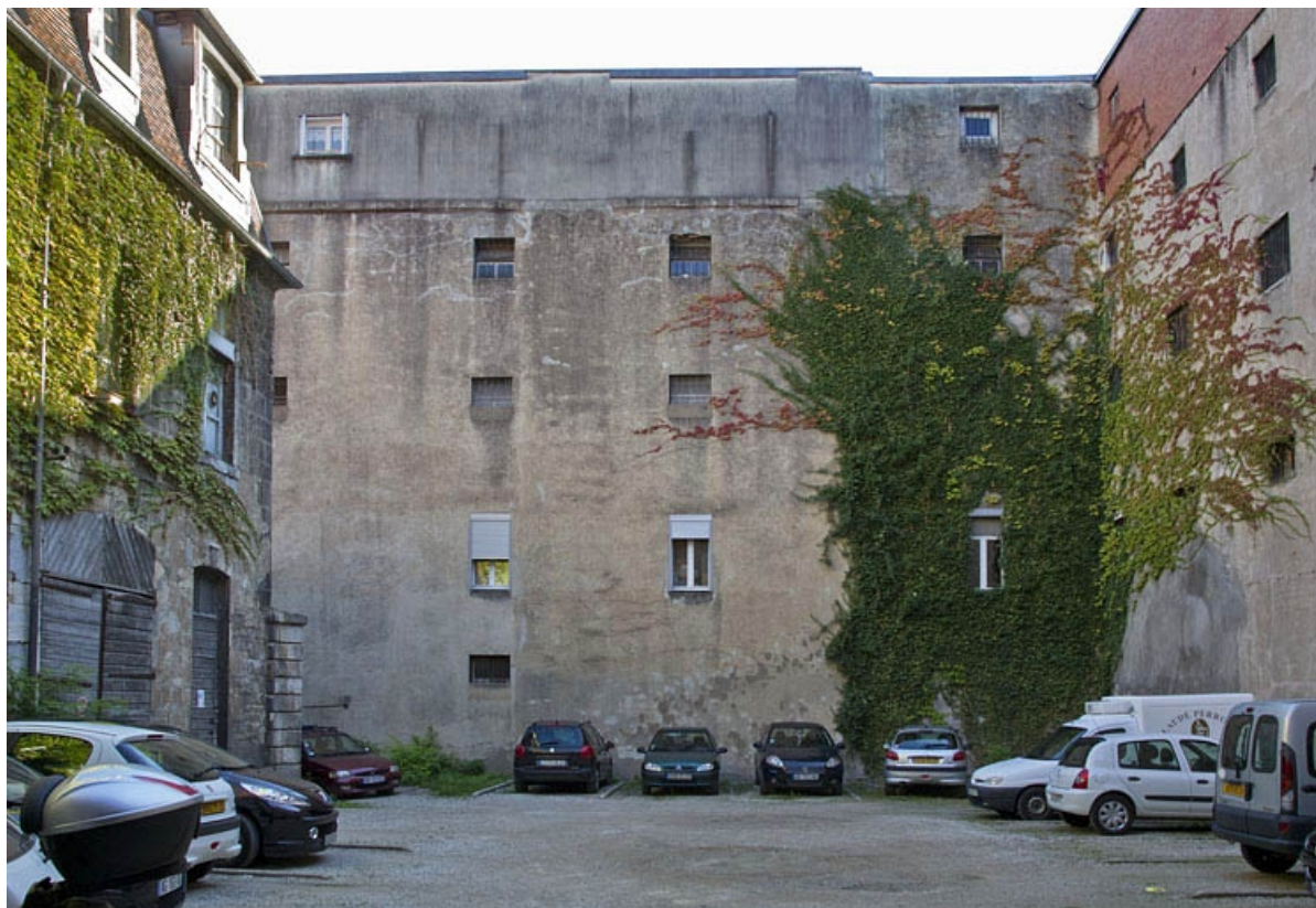
vue d'ensemble de la deuxième cour depuis l'entrée.

25, Besançon, 23 rue des Granges, lieudit : îlot Poste