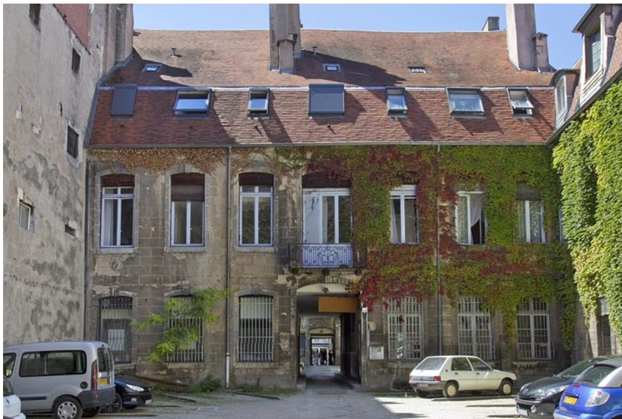
Logis secondaire : vue d'ensemble de la façade postérieure, de face. 25, Besançon, 23 rue des Granges, lieudit : îlot Poste