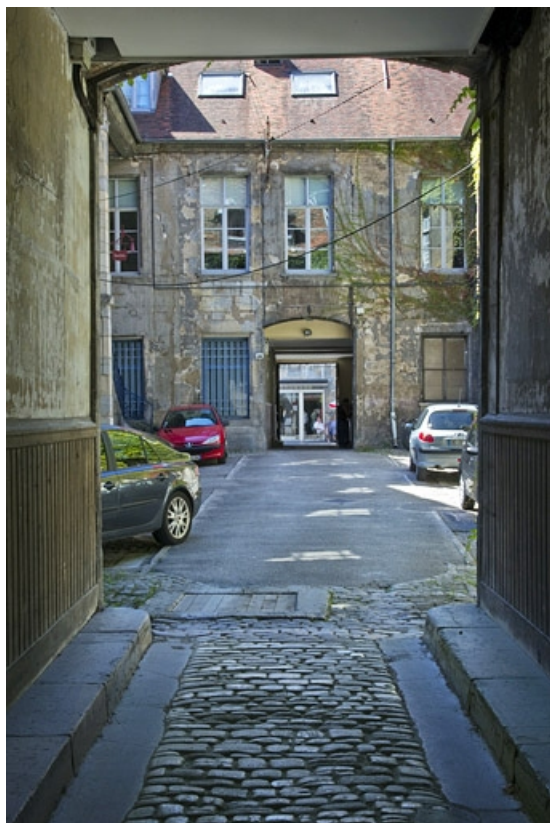
Logis principal : façade postérieure, depuis le passage cocher du premier logis secondaire. 25, Besançon, 23 rue des Granges, lieudit : îlot Poste