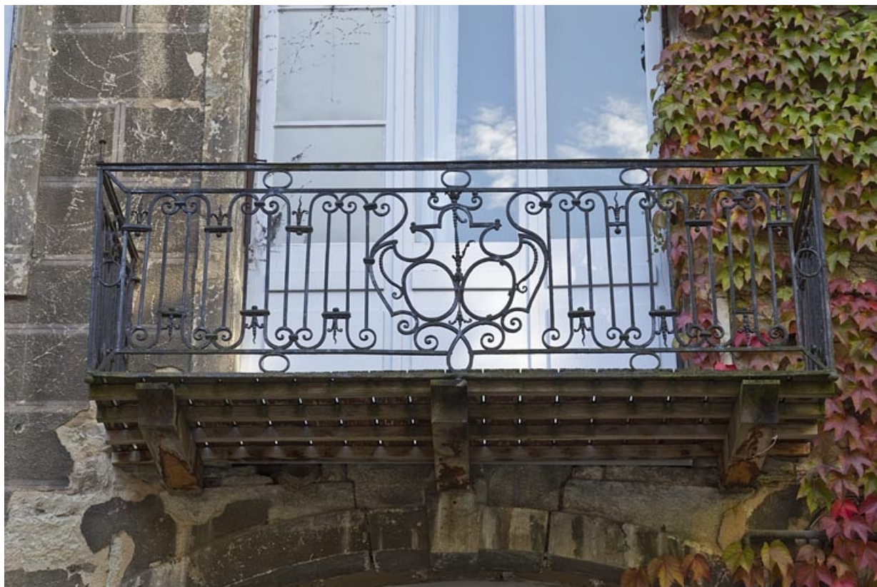
Logis secondaire, façade postérieure : détail du balcon en ferronnerie.

25, Besançon, 23 rue des Granges, lieu-dit : îlot Poste