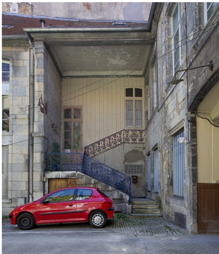
Première cour, aile droite : vue d'ensemble du premier escalier à cage ouverte, de face. 25, Besançon, 23 rue des Granges, lieudit : îlot Poste