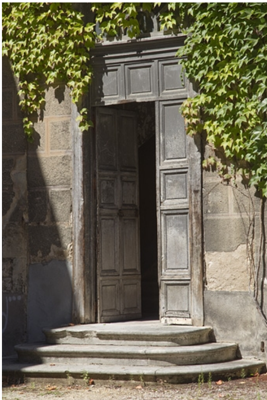
Logis secondaire, aile gauche dans la deuxième cour : détail d'une porte d'entrée.

25, Besançon, 23 rue des Granges, lieudit : îlot Poste