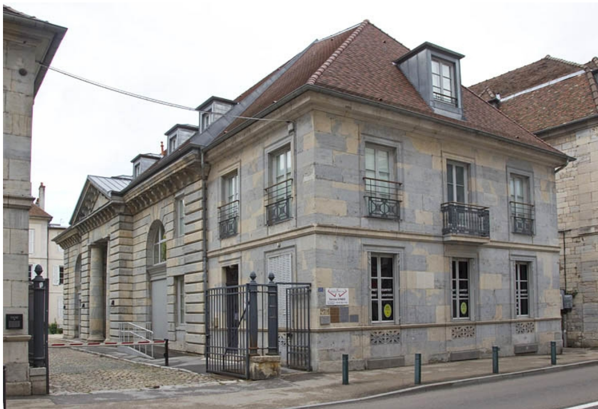
Orangerie : vue d'ensemble de trois quarts gauche depuis la rue.

25, Besançon, 23 rue des Granges, lieudit : îlot Poste