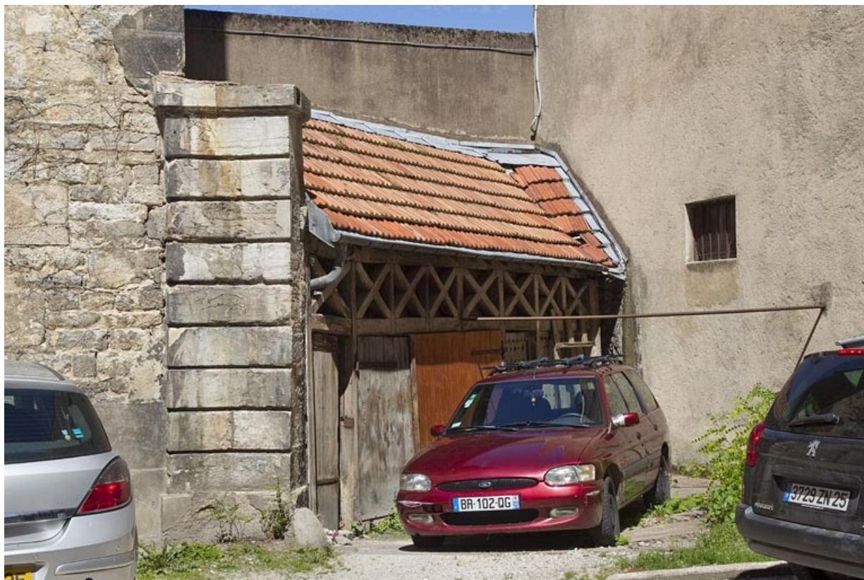
Deuxième cour : vue d'ensemble du bûcher, de trois quarts gauche.

25, Besançon, 23 rue des Granges, lieudit : îlot Poste