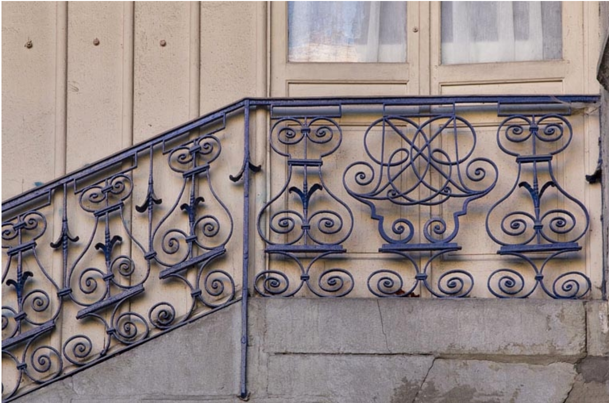
Aile droite, premier escalier à cage ouverte : détail rapproché de la rampe en fer forgé. 25, Besançon, 23 rue des Granges, lieudit : îlot Poste