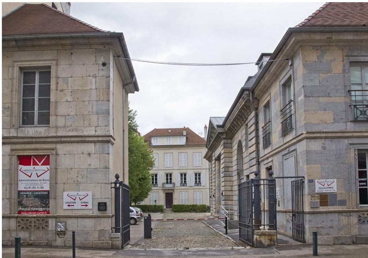
Orangerie : vue d'ensemble de face depuis la rue. 25, Besançon, 23 rue des Granges, lieu-dit : îlot Poste