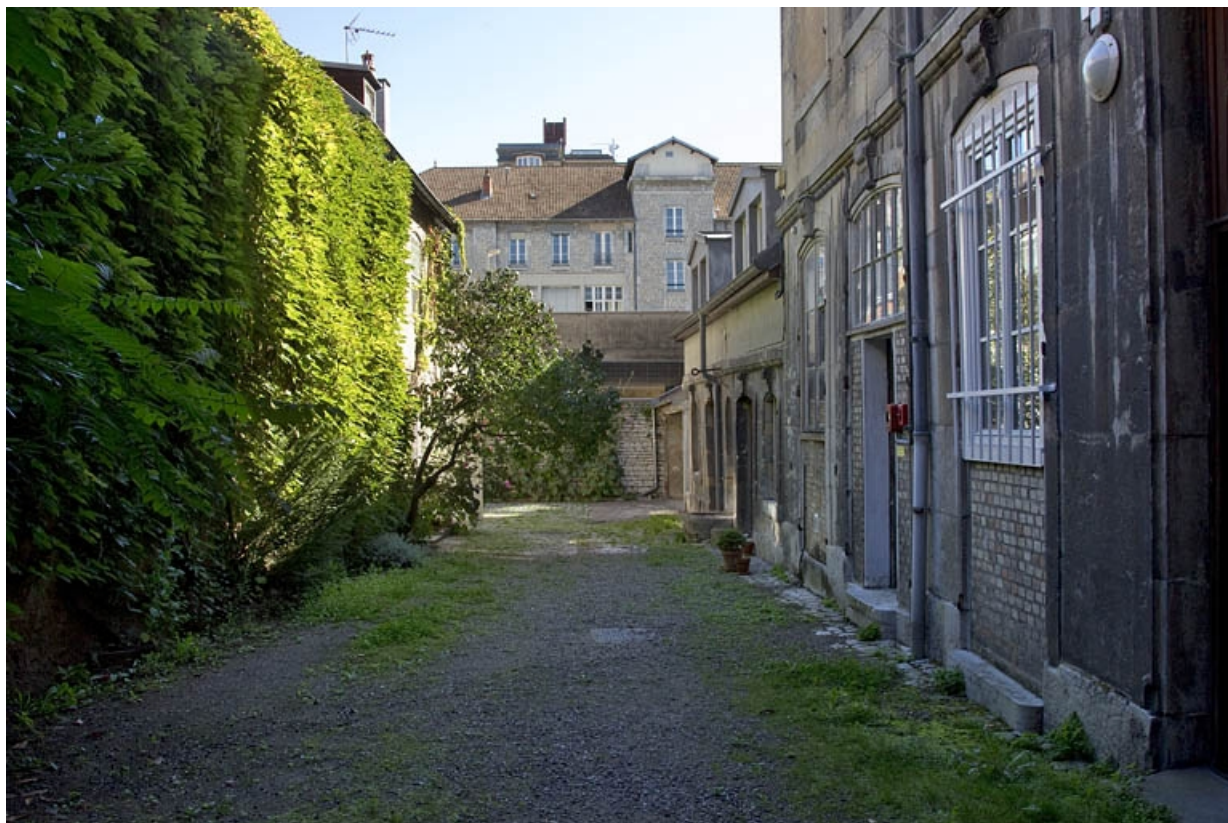
Deuxième cour : vue d'ensemble depuis l'entrée.

25, Besançon, 17 rue des Granges, lieudit : îlot Poste