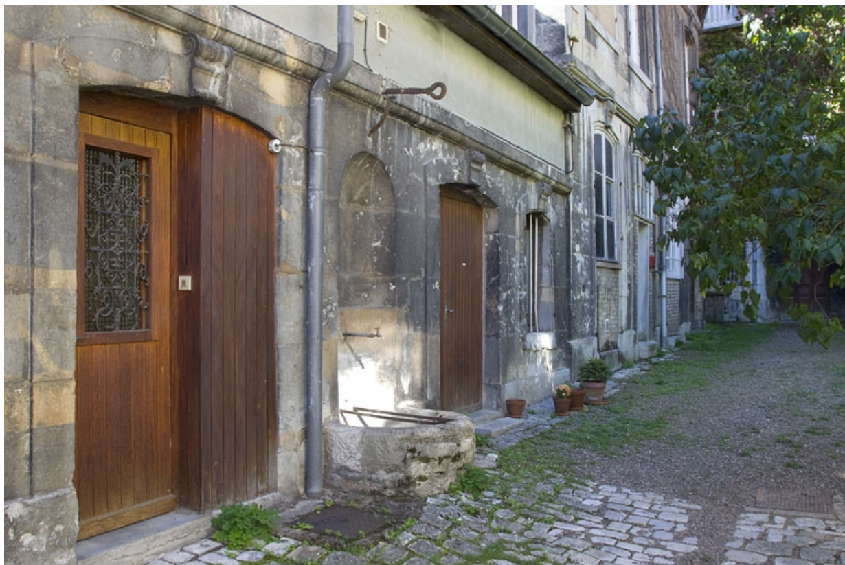
Deuxième cour : détail du puits dans le mur des communs.

25, Besançon, 17 rue des Granges, lieudit : îlot Poste