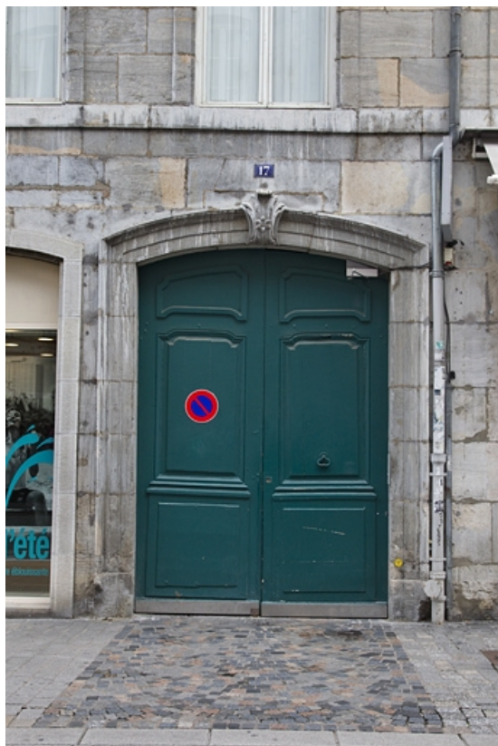
Logis principal, façade antérieure : détail du portail d'entrée, de face.

25, Besançon, 17 rue des Granges, lieudit : îlot Poste