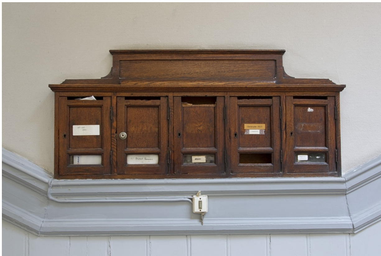
Escalier à cage ouverte : détail des boîtes à lettres.

25, Besançon, 17 rue des Granges, lieudit : îlot Poste