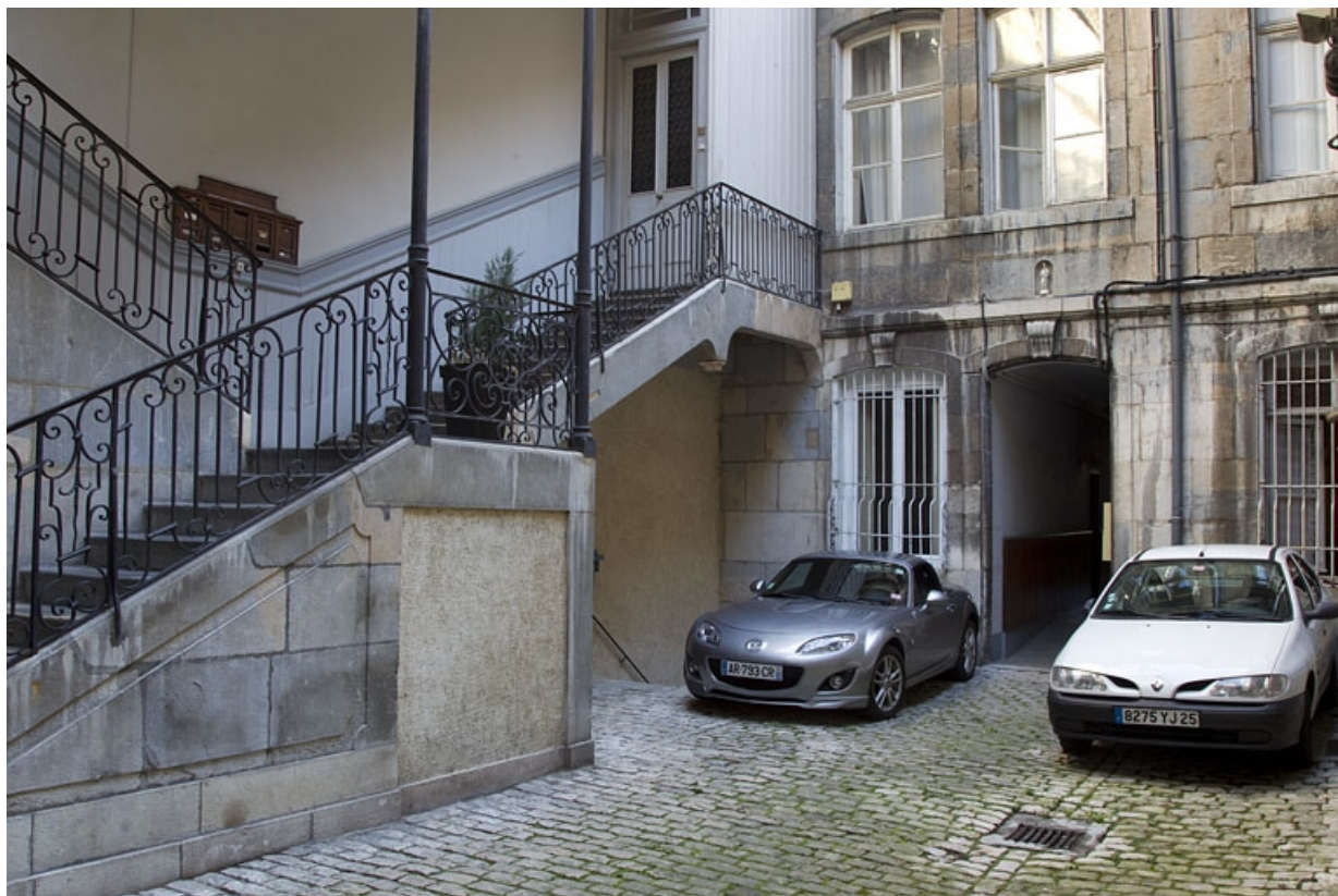
Départ de l'escalier à cage ouverte : de trois quarts gauche.

25, Besançon, 17 rue des Granges, lieudit : îlot Poste