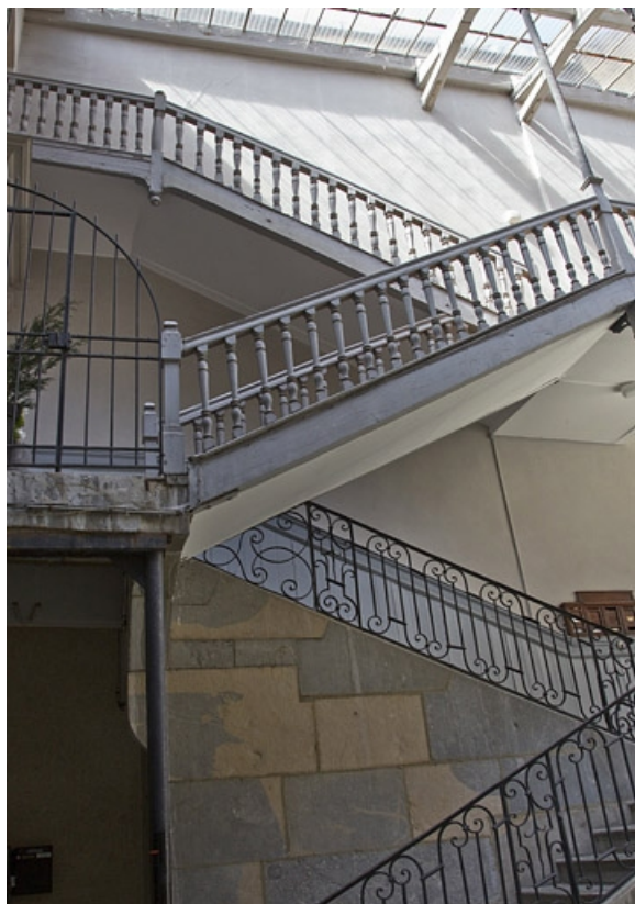
Vue d'ensemble de l'escalier à cage ouverte : de face.

25, Besançon, 17 rue des Granges, lieudit : îlot Poste