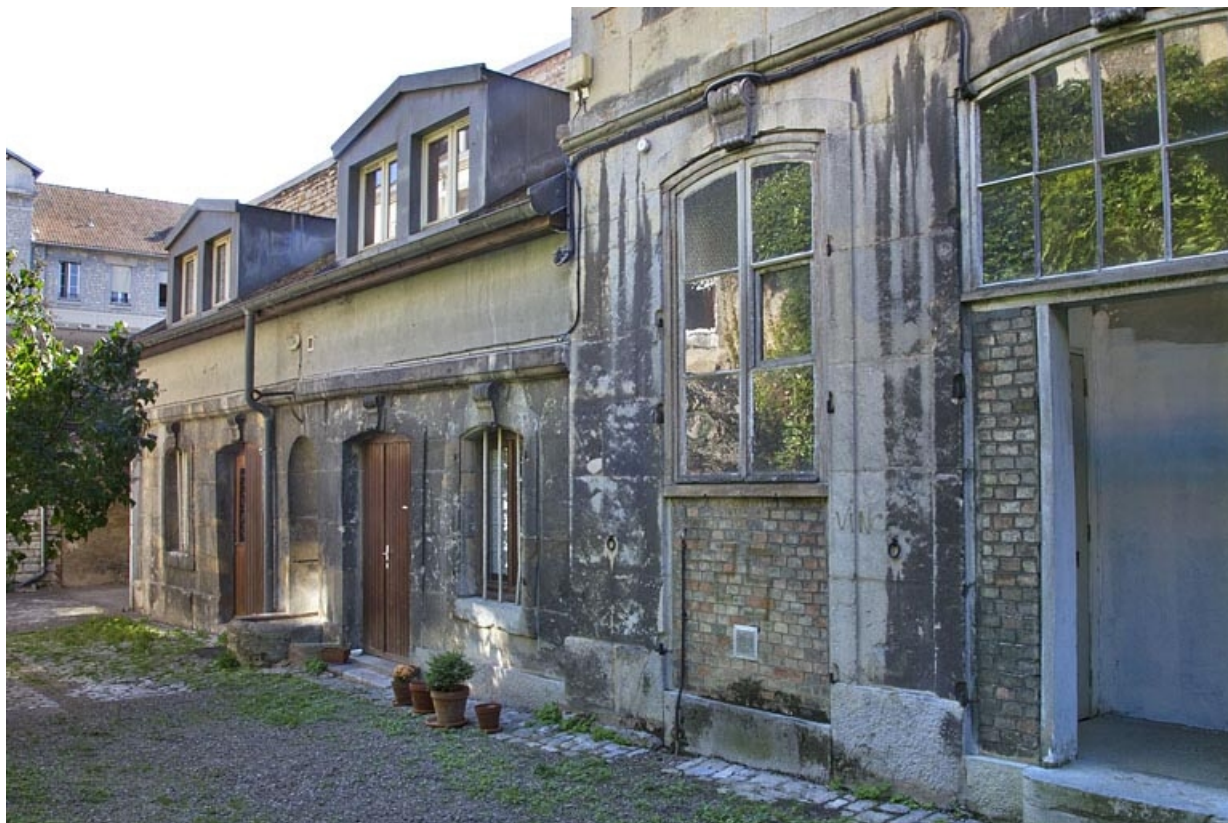
Deuxième cour : vue d'ensemble des communs, de trois quarts droit.

25, Besançon, 17 rue des Granges, lieudit : îlot Poste