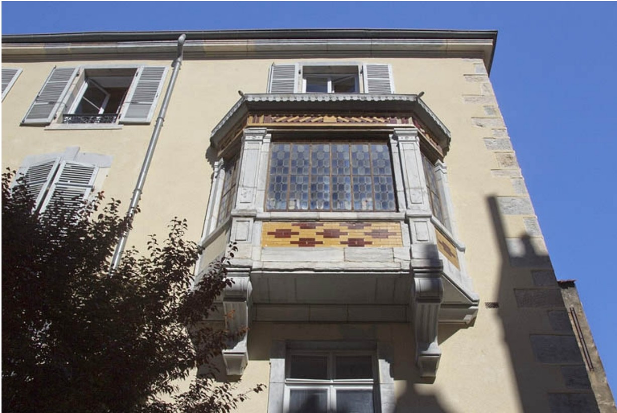
Premier logis secondaire : détail du bow window, de face.

25, Besançon, 21 rue des Granges, lieudit : îlot Poste