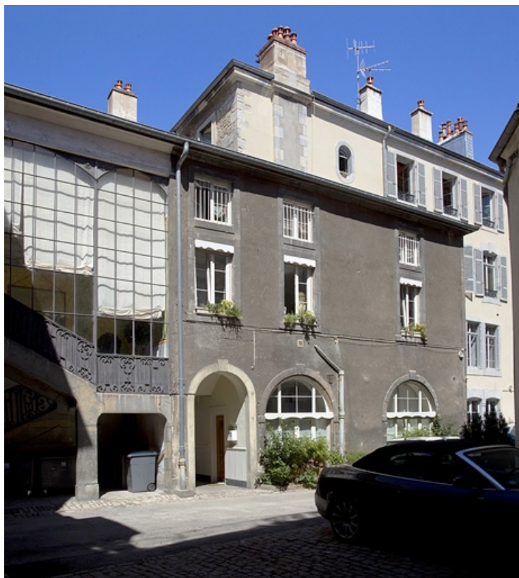
Aile des remises : de trois quarts gauche.

25, Besançon, 21 rue des Granges, lieudit : îlot Poste