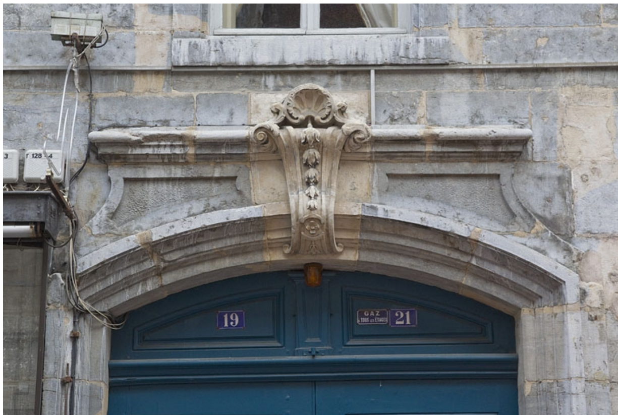
Logis principal, façade antérieure : détail de l'arc couvrant le portail d'entrée. 25, Besançon, 21 rue des Granges, lieudit : îlot Poste