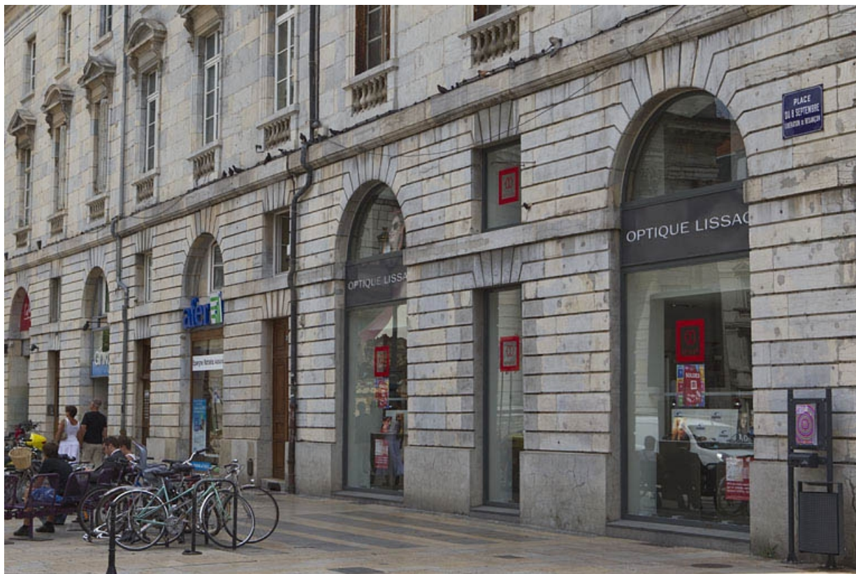
Détail du rez-de-chaussée de la façade antérieure, de trois quarts droit.

25, Besançon, 2 place du Huit-Septembre, lieudit : îlot Saint-Pierre