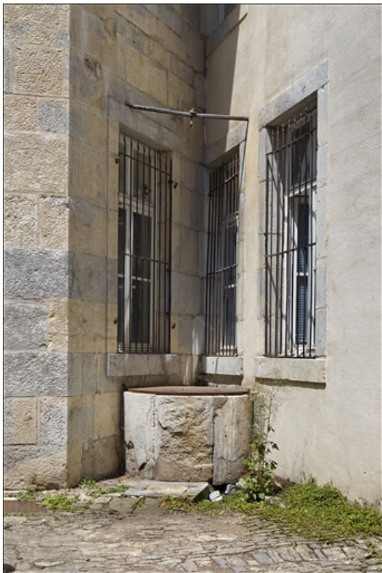
Deuxième cour : détail du puits.

25, Besançon, 50 rue des Granges, lieudit : îlot Saint-Pierre