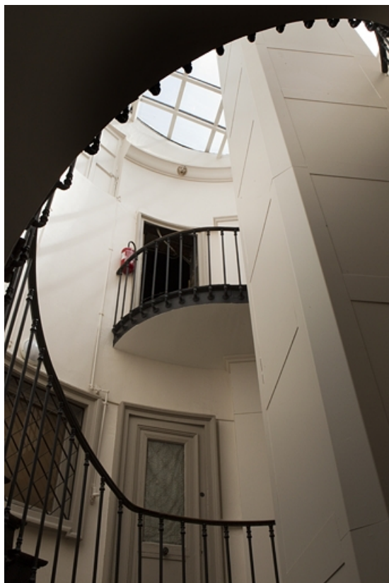
Intérieur : détail de la partie supérieure de l'escalier. 25, Besançon, 11 rue Moncey, lieudit : îlot Saint-Pierre