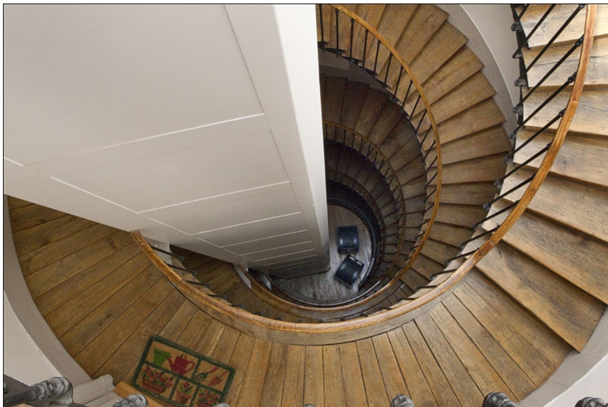
Intérieur : vue plongeante de l'escalier.

25, Besançon, 11 rue Moncey, lieudit : îlot Saint-Pierre