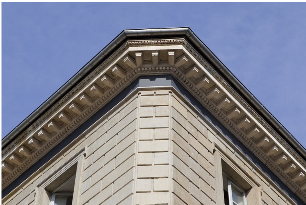
Détail de la corniche de toit à l'angle de l'édifice.

25, Besançon, 11 rue Moncey, lieudit : îlot Saint-Pierre