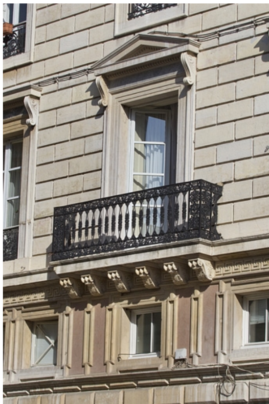
Façade latérale droite : détail du balcon.

25, Besançon, 11 rue Moncey, lieudit : îlot Saint-Pierre