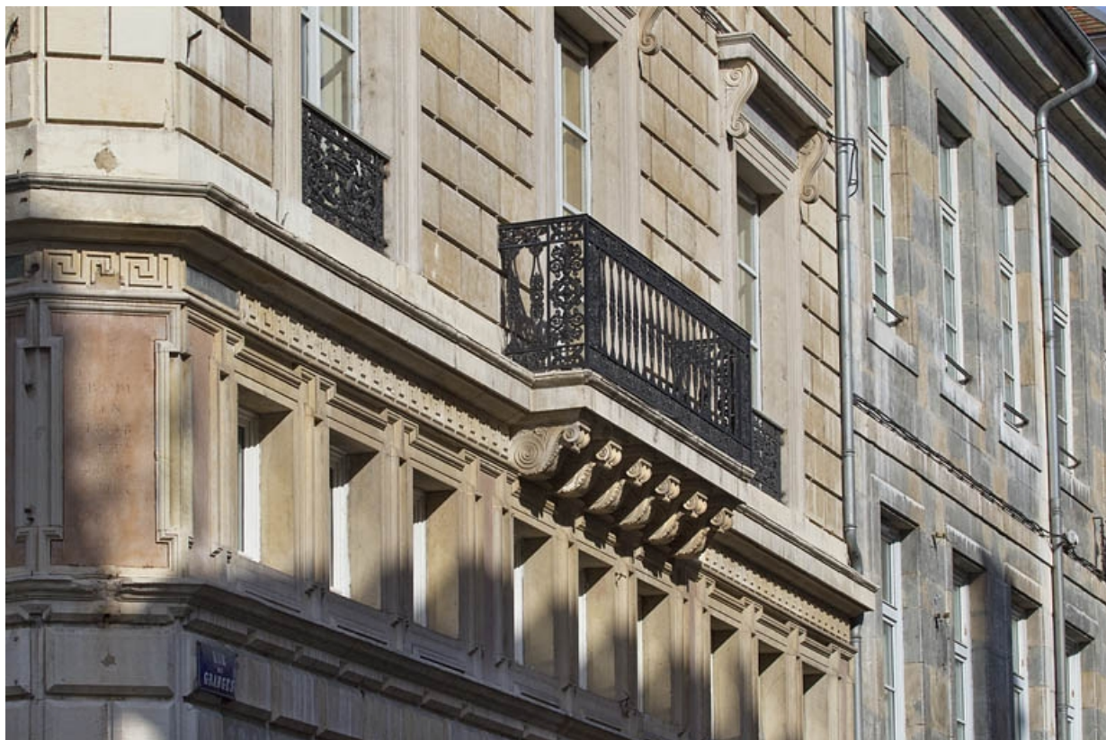
Façade latérale droite : détail de l'entresol et du balcon.

25, Besançon, 11 rue Moncey, lieudit : îlot Saint-Pierre