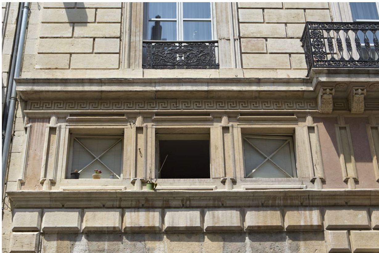
Façade antérieure : détail de l'entresol.

25, Besançon, 11 rue Moncey, lieudit : îlot Saint-Pierre