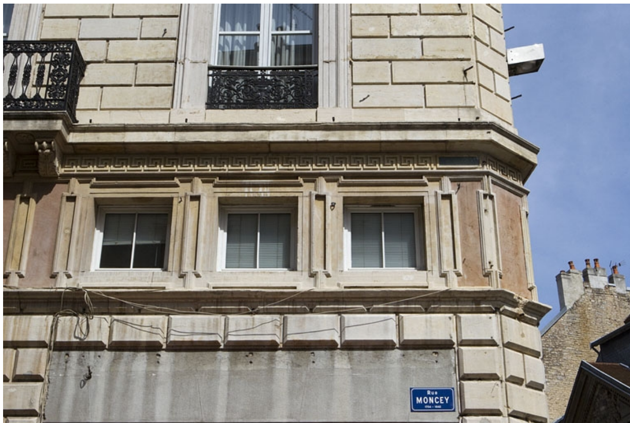
Façade antérieure, partie droite : détail de l'entresol.

25, Besançon, 11 rue Moncey, lieudit : îlot Saint-Pierre