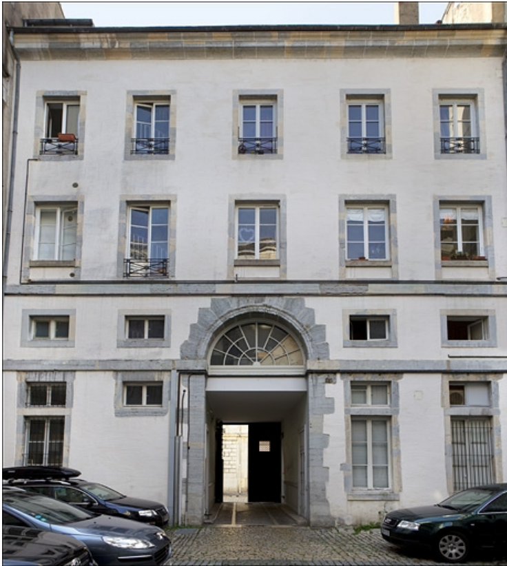
Façade postérieure, de face.

25, Besançon, 9 rue Moncey, lieudit : îlot Saint-Pierre