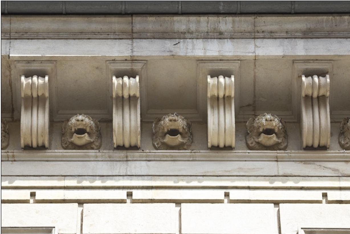
Façade antérieure : détail de la corniche de toit.

25, Besançon, 9 rue Moncey, lieudit : îlot Saint-Pierre