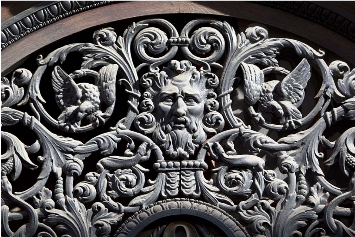
Portail d'entrée : détail du décor en fonte du tympan.

25, Besançon, 9 rue Moncey, lieudit : îlot Saint-Pierre