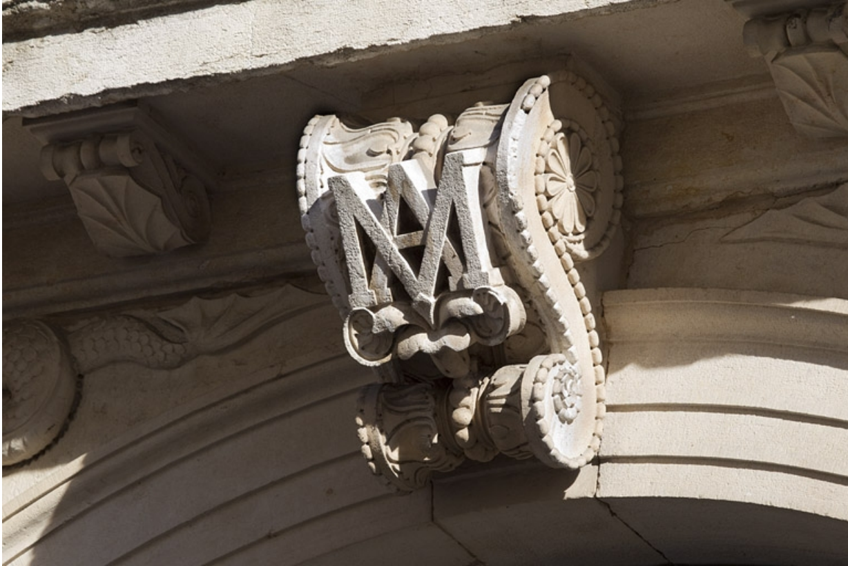
Portail d'entrée : détail du monogramme sur la clé de l'arc.

25, Besançon, 9 rue Moncey, lieudit : îlot Saint-Pierre