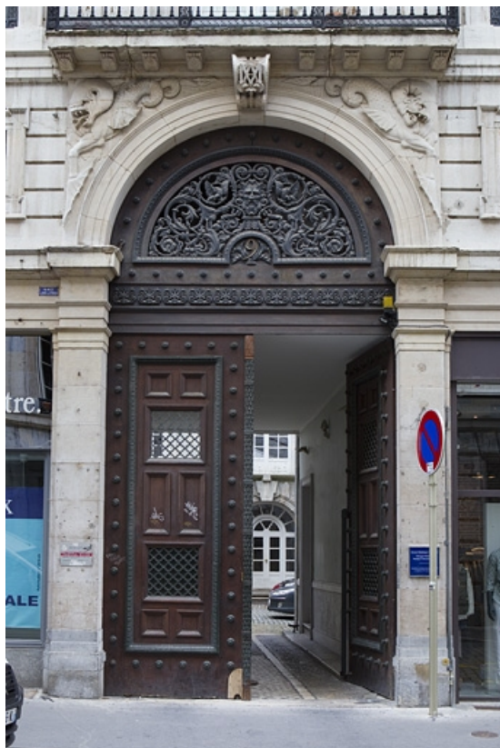
Portail d'entrée : vue d'ensemble.

25, Besançon, 9 rue Moncey, lieudit : îlot Saint-Pierre