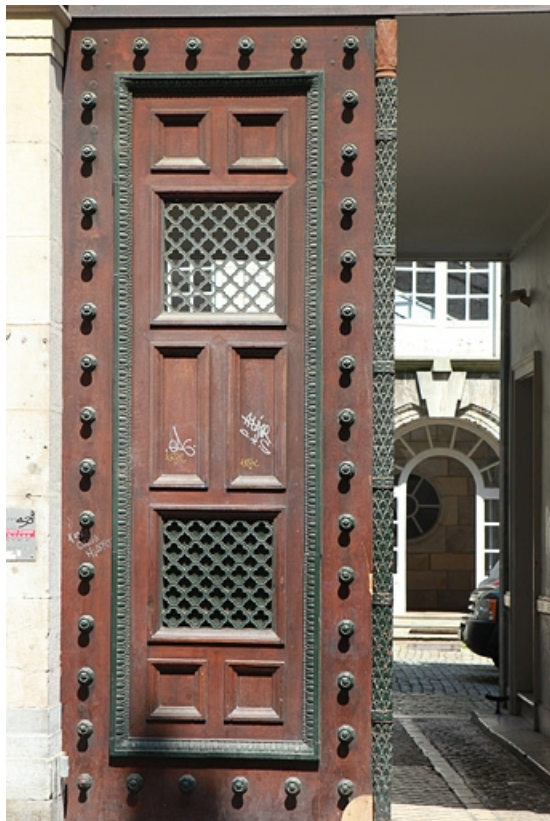
Détail d'un vantail du portail d'entrée.

25, Besançon, 9 rue Moncey, lieudit : îlot Saint-Pierre