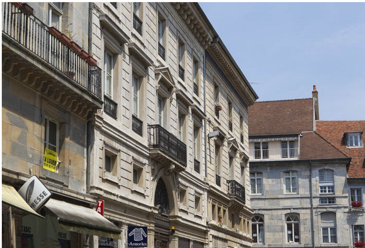
Vue d'ensemble depuis la rue de trois quarts gauche.

25, Besançon, 9 rue Moncey, lieudit : îlot Saint-Pierre