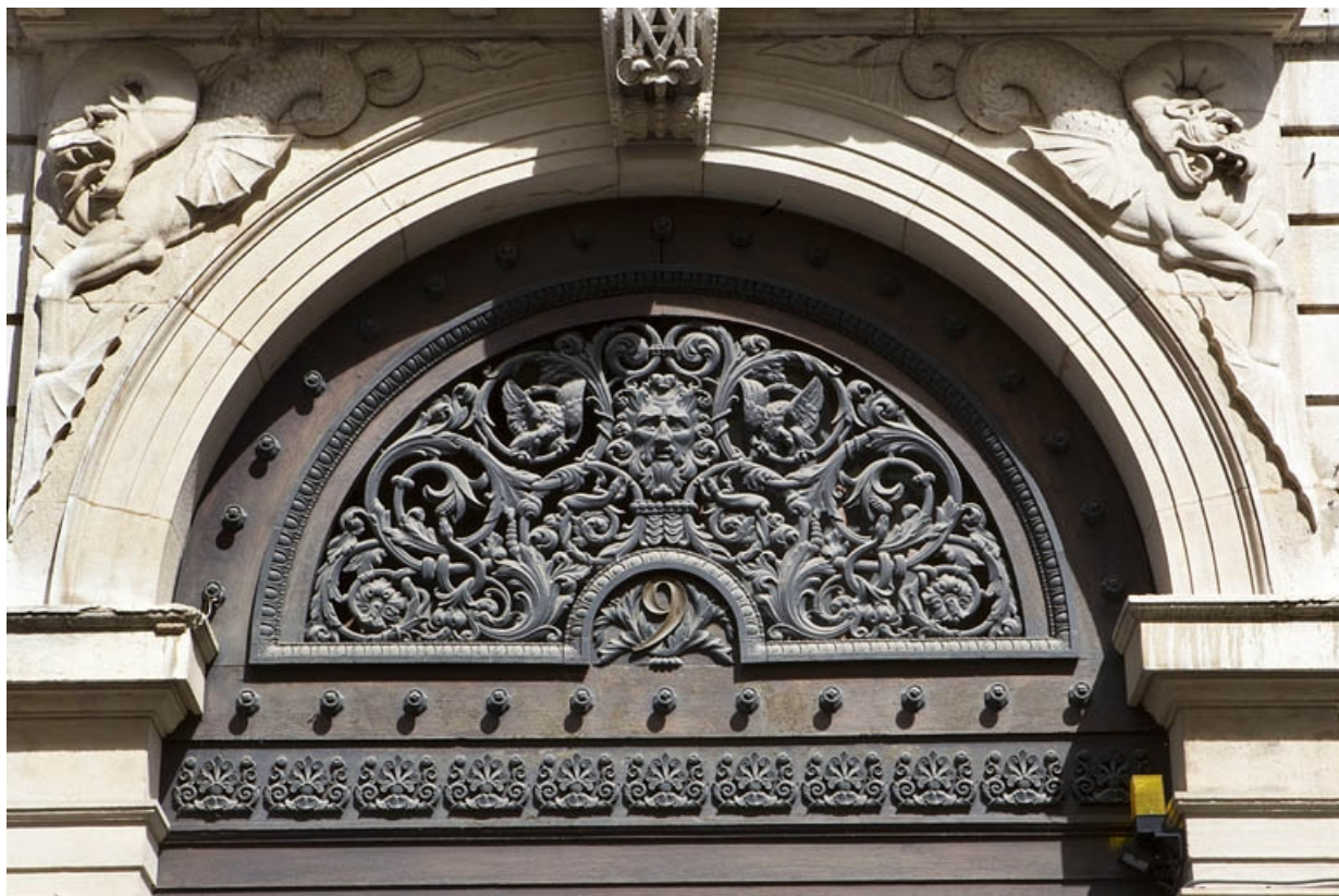
Portail d'entrée : détail du tympan.

25, Besançon, 9 rue Moncey, lieudit : îlot Saint-Pierre