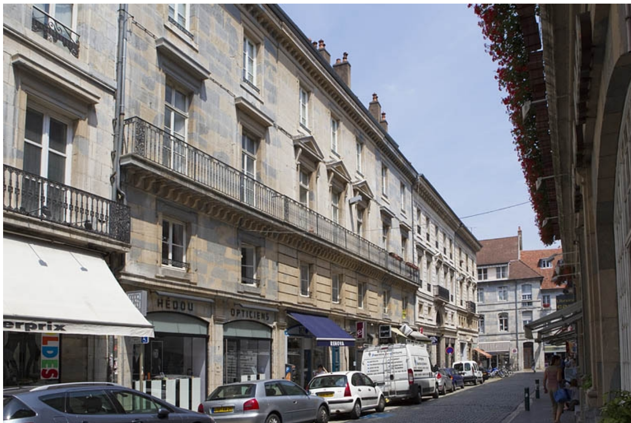
Vue d'ensemble depuis la rue, de trois quarts gauche.

25, Besançon, 7 rue Moncey, lieudit : îlot Saint-Pierre