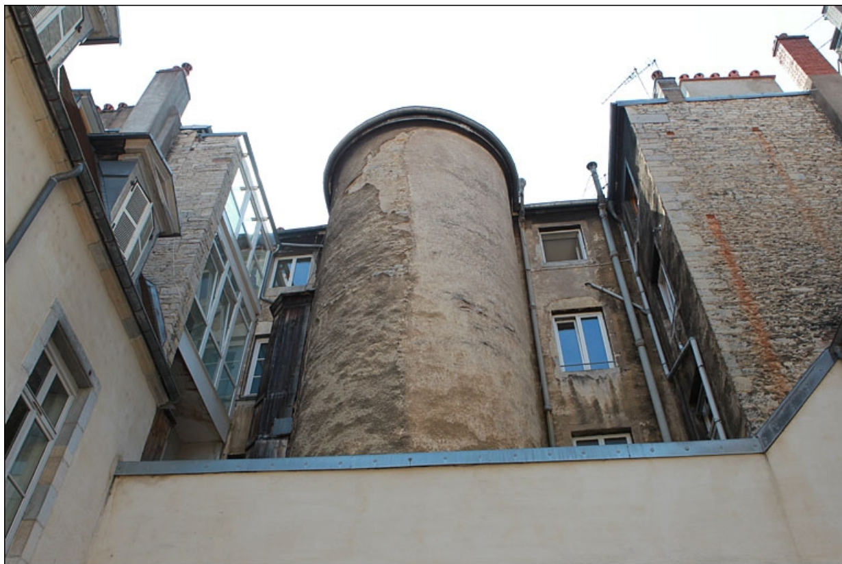
Façade postérieure : vue d'ensemble de la tour d'escalier.

25, Besançon, 7 rue Moncey, lieudit : îlot Saint-Pierre