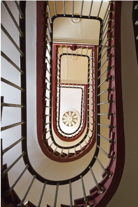
Vue d'ensemble de l'escalier depuis le rez-de-chaussée.

25, Besançon, 7 rue Moncey, lieudit : îlot Saint-Pierre