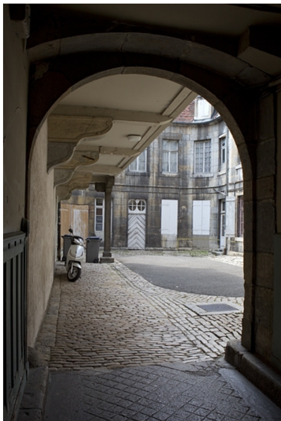
Vue d'ensemble de la cour depuis le passage cochier.

25, Besançon, 46 rue des Granges, lieudit : îlot Saint-Pierre