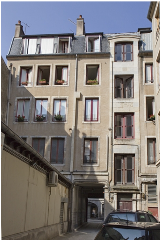
Vue d'ensemble de la façade postérieure du logis principal dans la première cour.

25, Besançon Grande Rue 73, lieudit : îlot Saint-Pierre