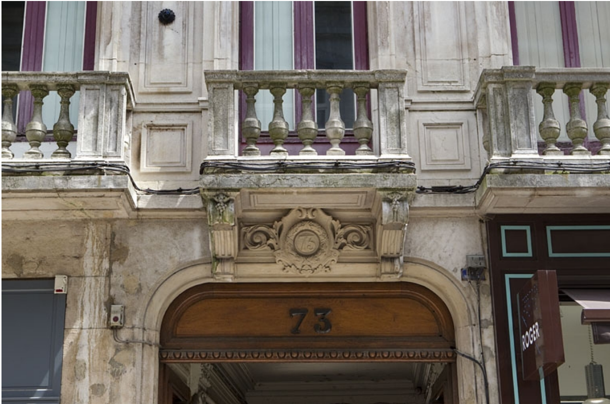
Logis principal, façade sur rue : détail du décor sur l'arc du portail d'entrée. 25, Besançon Grande Rue 73, lieudit : îlot Saint-Pierre