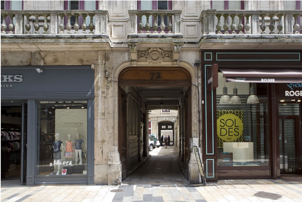
Logis principal, façade sur rue : détail du portail d'entrée.

25, Besançon Grande Rue 73, lieudit : îlot Saint-Pierre