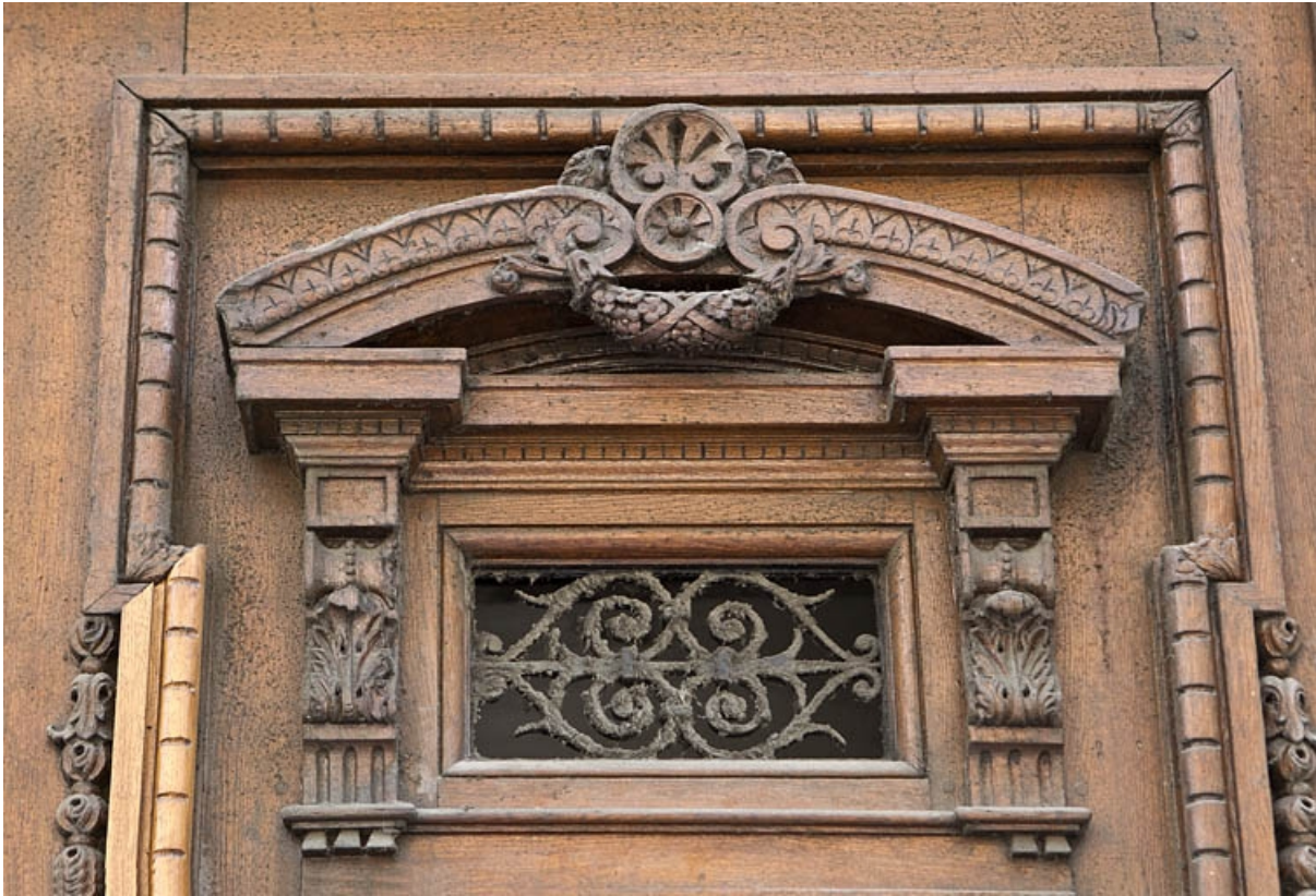
Vantaux du portail d'entrée : détail d'un décor.

25, Besançon Grande Rue 73, lieudit : îlot Saint-Pierre