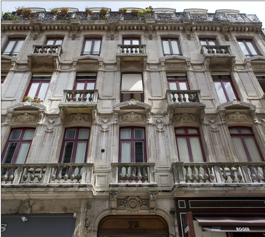
Façade sur rue : détail du premier au troisième étage.

25, Besançon Grande Rue 73, lieudit : îlot Saint-Pierre