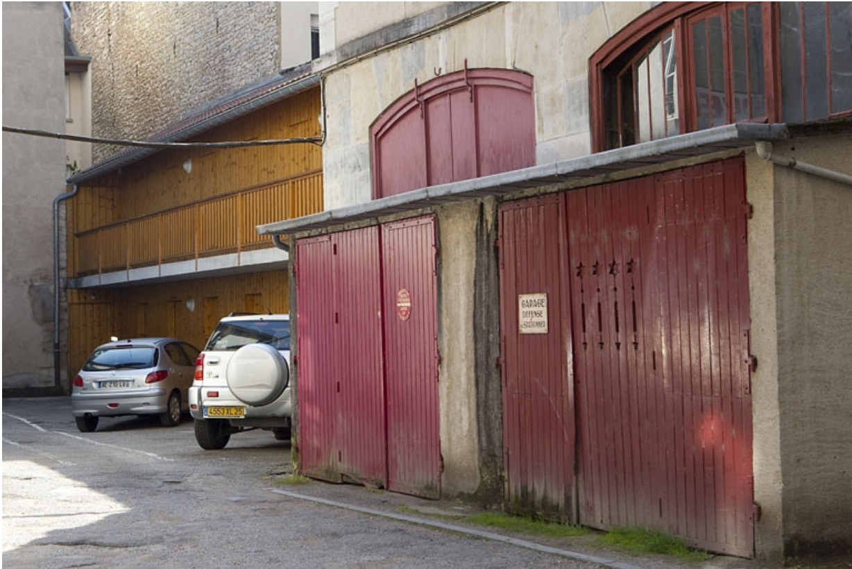
Détail des bûchers dans la deuxième cour, de trois quarts droit.

25, Besançon Grande Rue 73, lieudit : îlot Saint-Pierre