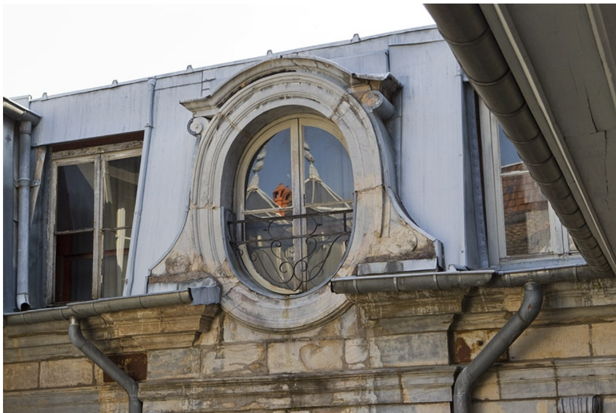
Façade en fond de cour : détail de la lucarne centrale, vue rapprochée.

25, Besançon Grande Rue 67, lieudit : îlot Saint-Pierre