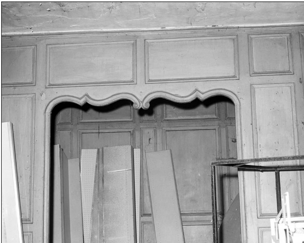
Intérieur : détail d'une alcôve.

25, Besançon Grande Rue 67, lieudit : îlot Saint-Pierre