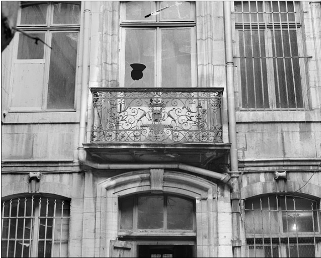
Logis en fond de cour : détail du balcon en ferronnerie, vue éloignée.

25, Besançon Grande Rue 67, lieudit : îlot Saint-Pierre