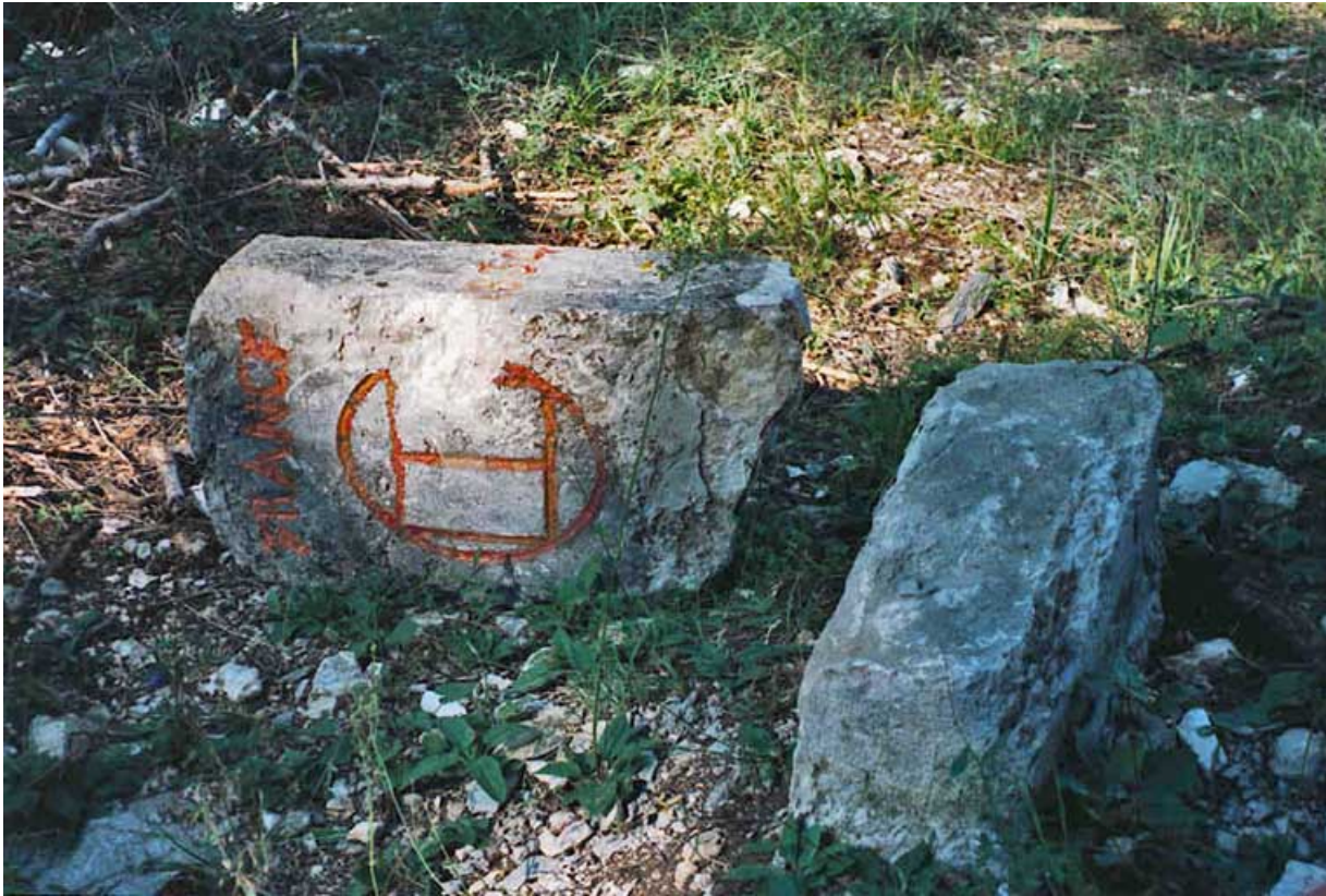
Borne cassée : décor au livre ouvert, côté France. 25, Jougne