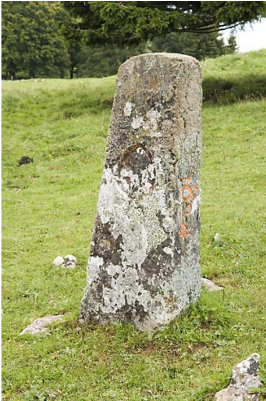
Borne n° 44 : fleur de lys côté France. 25, Jougne