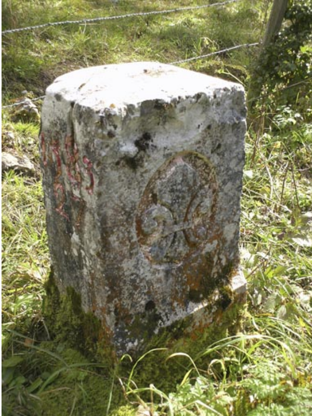
Borne n° 27 : fleur de lys côté France. 25, Jougne