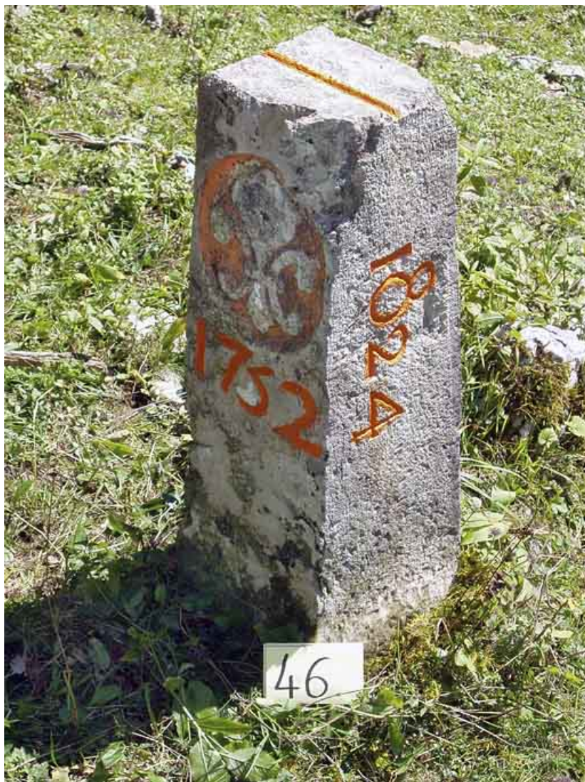
Borne n° 46 : fleur de lys côté France. 25, Jougne