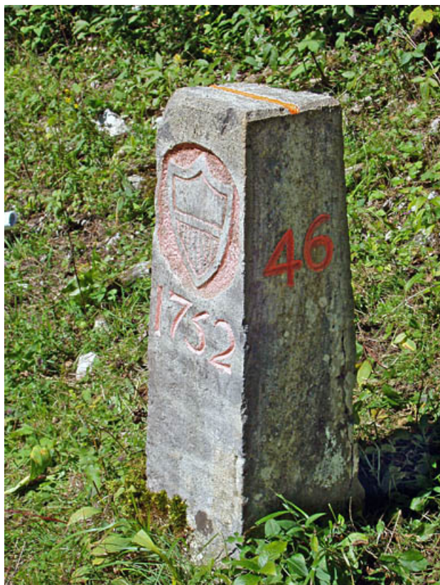
Borne n° 46 : écu du canton de Vaud côté Suisse. 25, Jougne