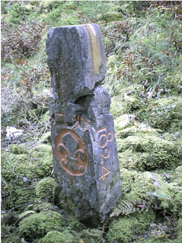
Borne n° 31 : fleur de lys côté France. 25, Jougne