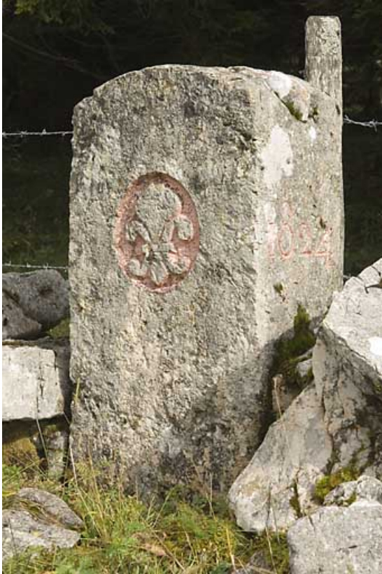
Borne n° 42 : fleur de lys côté France. 25, Jougne