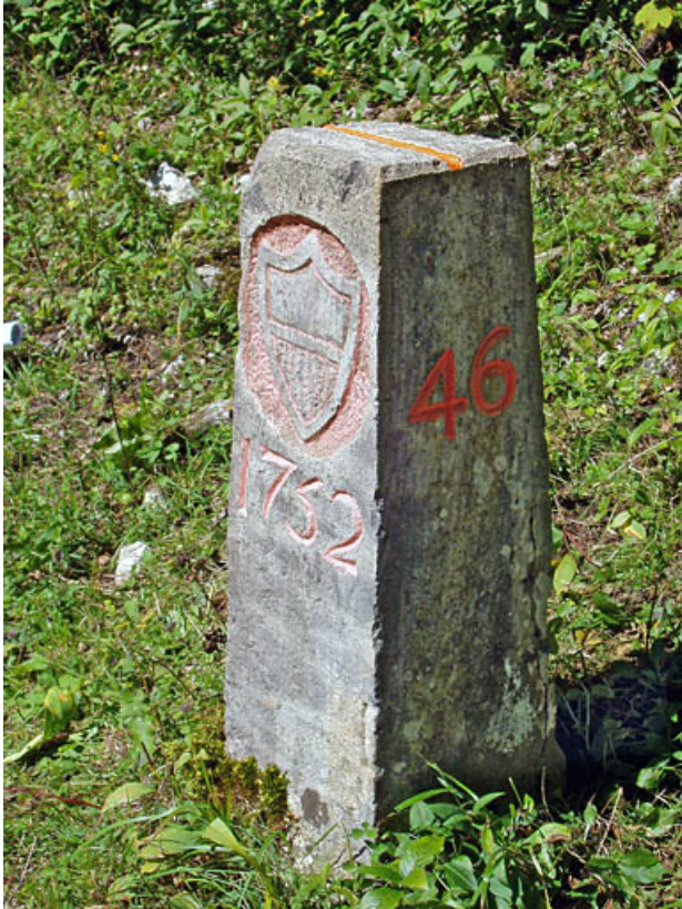
Borne n° 46 : écu du canton de Vaud côté Suisse. 25, Jougne