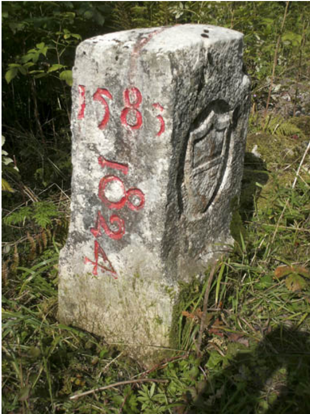
Borne n° 27 : écu du canton de Vaud côté Suisse. 25, Jougne