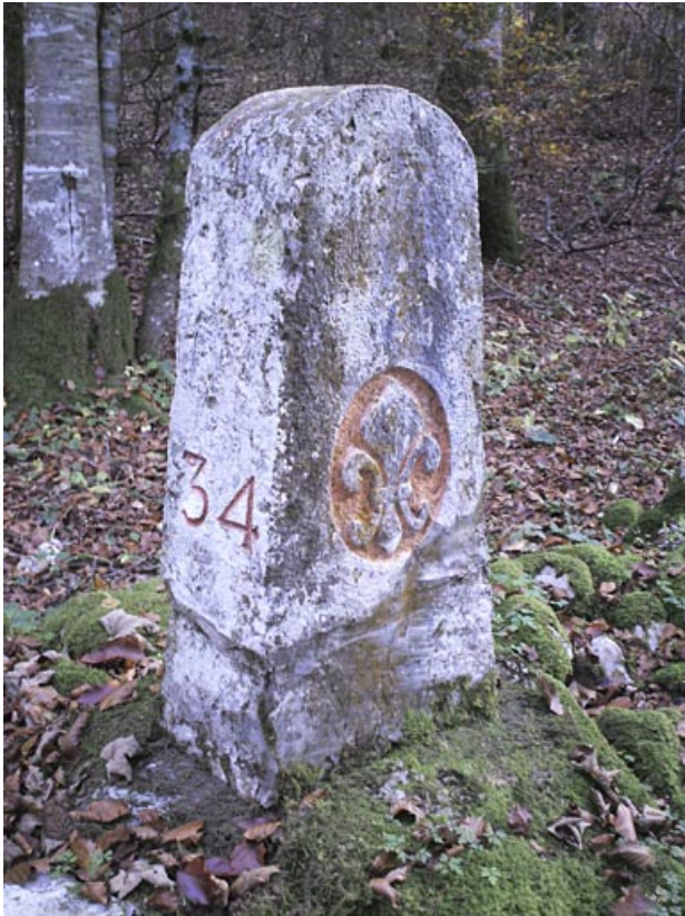
Borne n° 34 : fleur de lys côté France. 25, Jougne