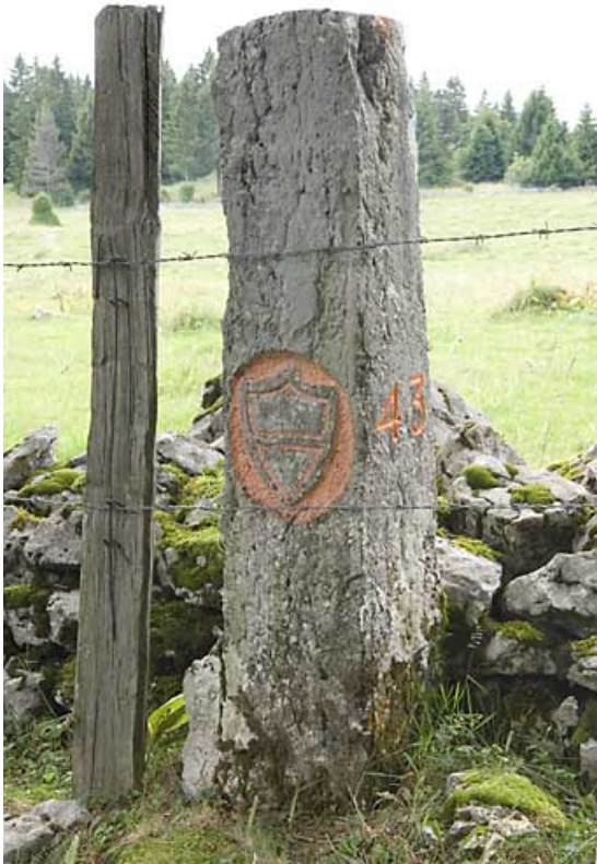
Borne n° 43 : écu du canton de Vaud côté Suisse. 25, Jougne