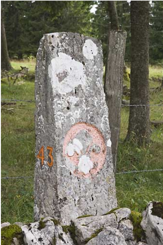
Borne n° 43 : fleur de lys côté France. 25, Jougne