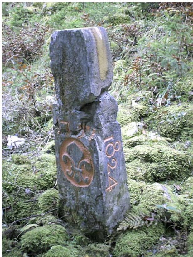
Borne n° 31 : fleur de lys côté France. 25, Jougne