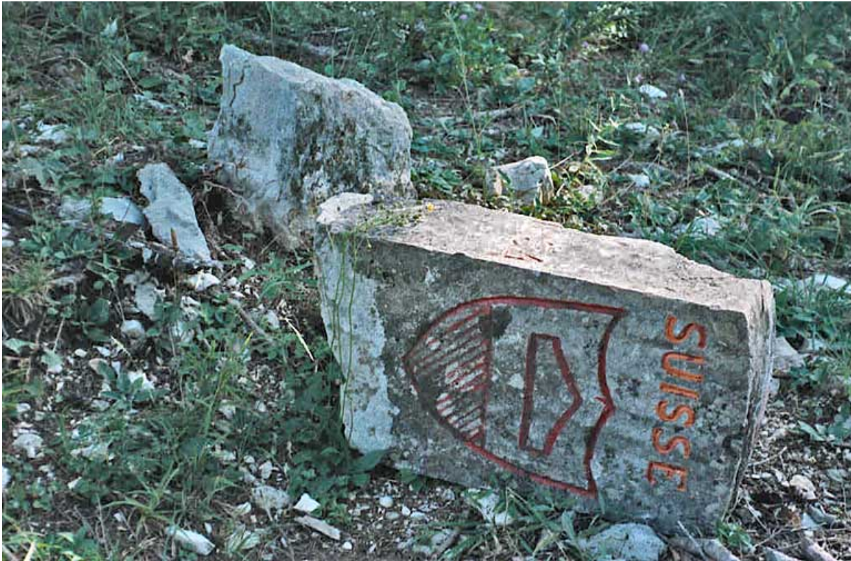
Borne cassée : écu côté Suisse.