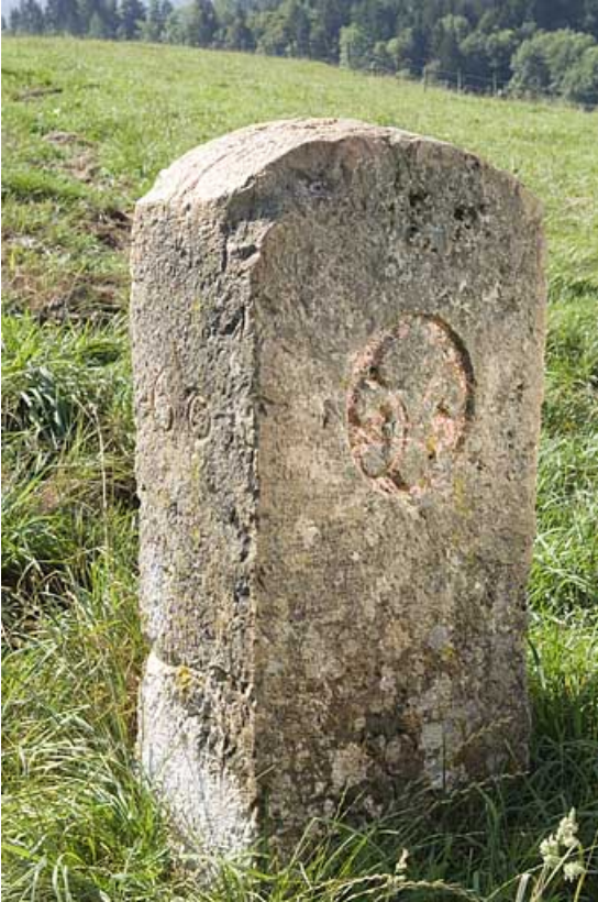
Borne n° 60 : fleur de lys côté France. 25, Jougne