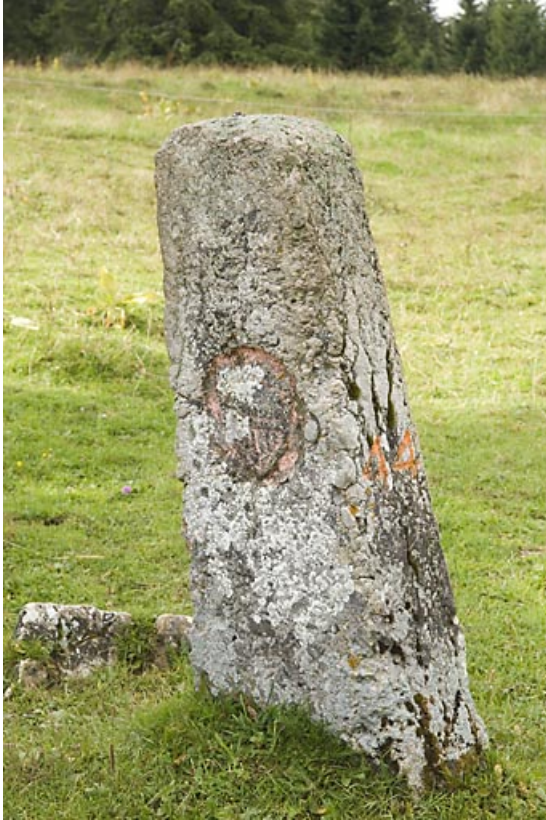
Borne n° 44 : écu du canton de Vaud côté Suisse. 25, Jougne