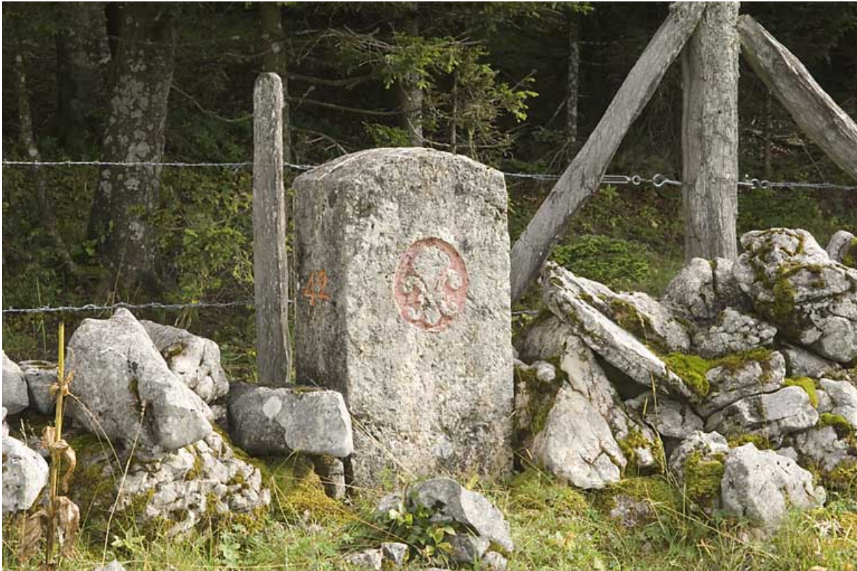
Borne n° 42 : fleur de lys côté France. 25, Jougne