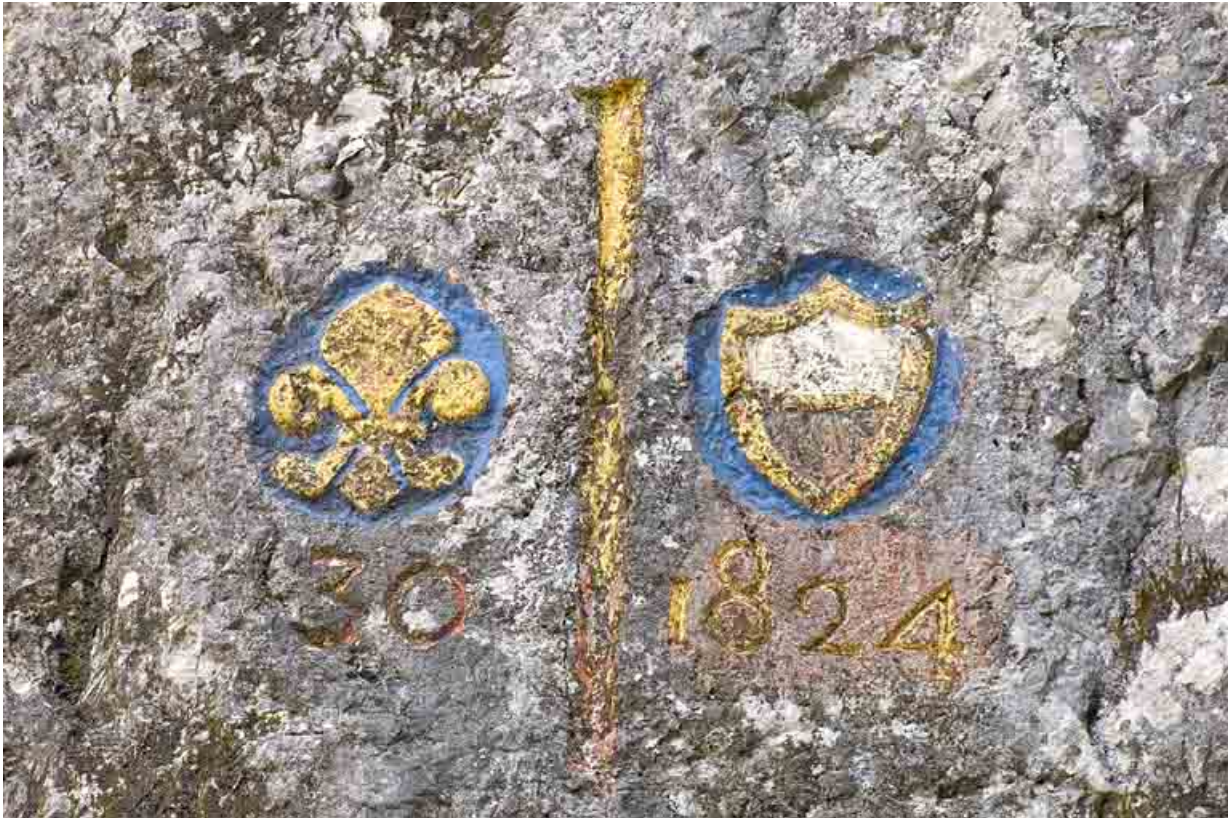
Borne frontalière n° 30.