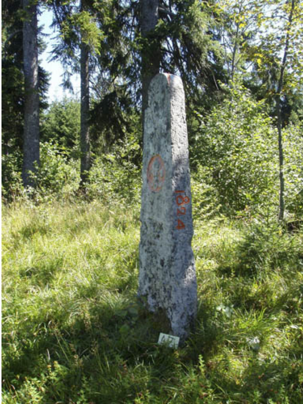
Borne n° 47 : fleur de lys côté France. 25, Jougne