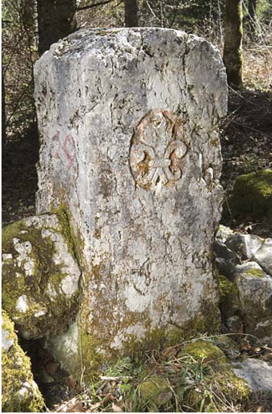
Borne frontalière n°19 ornée de la fleur de lys, côté France. 25, Jougne