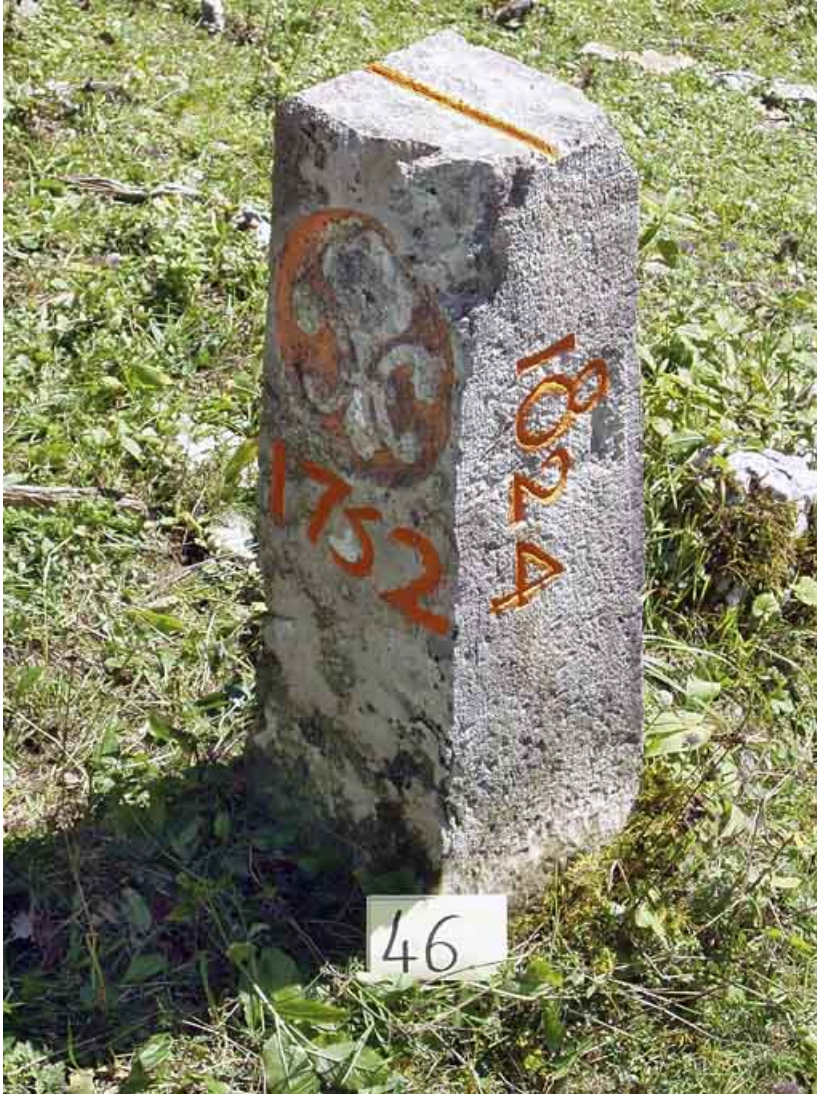
Borne n° 46 : fleur de lys côté France. 25, Jougne