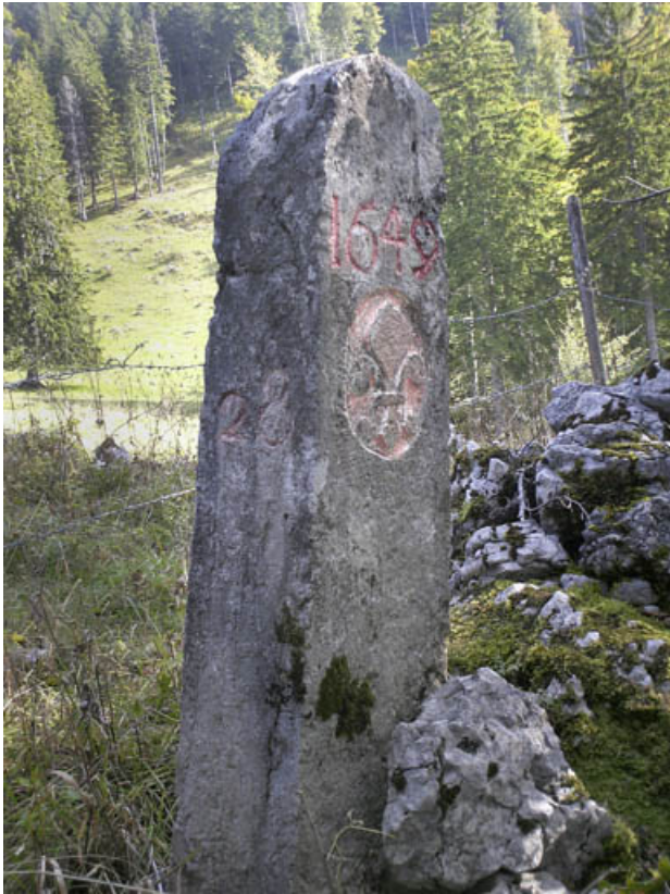
Borne n° 28 : fleur de lys côté France. 25, Jougne