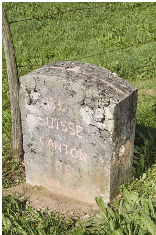
Borne n° 59 : inscription côté Suisse. 25, Jougne