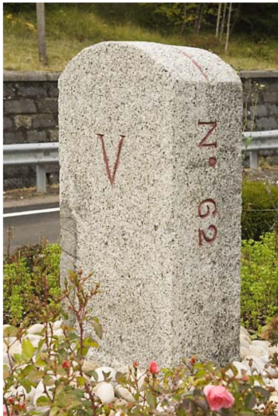
Borne n° 62, en granite : côté Suisse. 25, Jougne