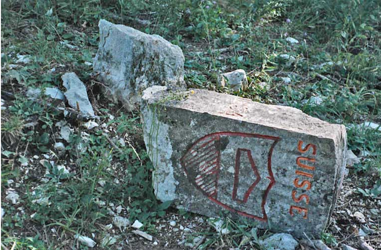
Borne cassée : écu côté Suisse.