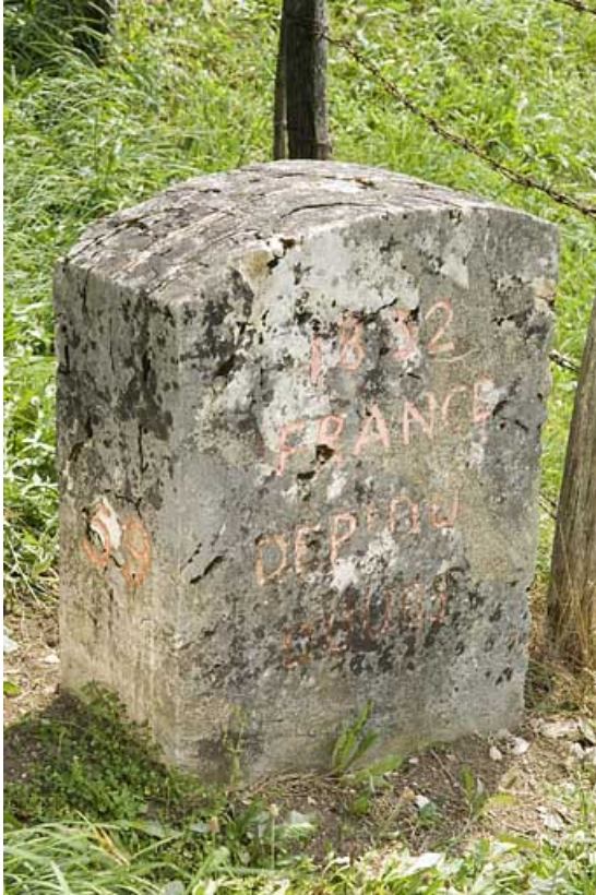
Borne n° 59 : inscription côté France. 25, Jougne