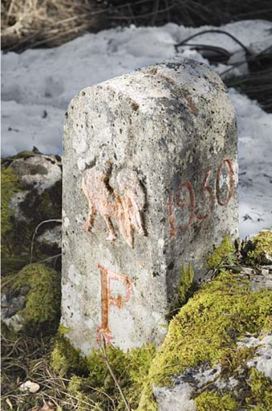
borne frontalière n° 20.