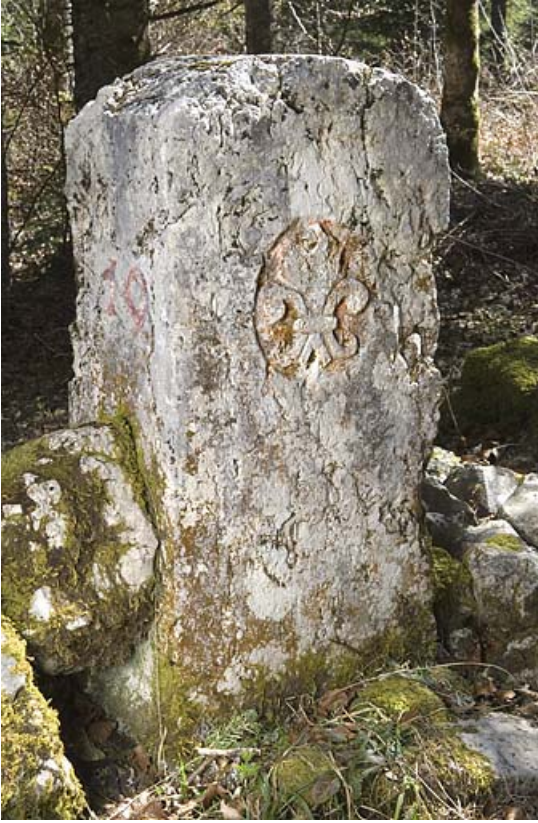
Borne frontalière n°19 ornée de la fleur de lys, côté France. 25, Jougne