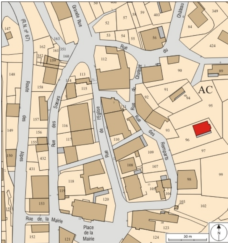
Plan masse et de situation. Extrait du plan cadastral, 2008, section AC, échelle 1:1 000. 25, Jougne, 6 rue des Remparts