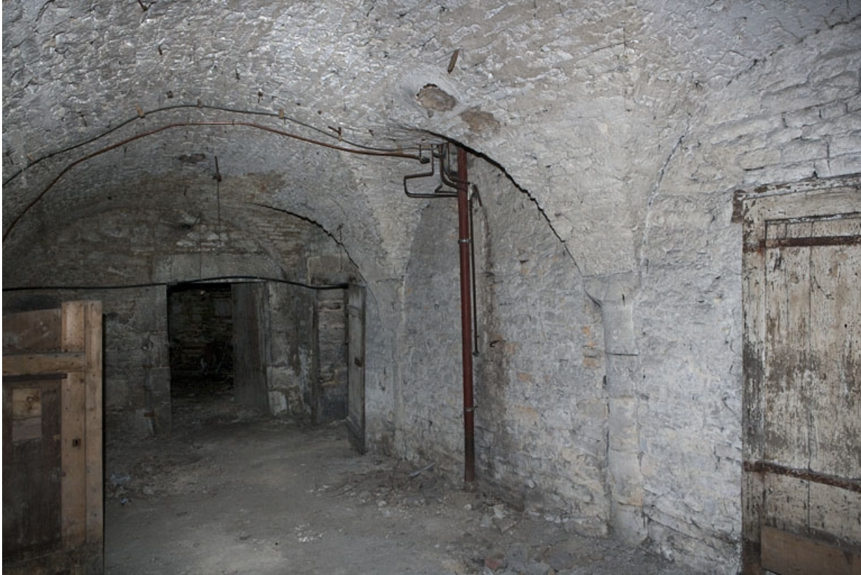
Logis principal, sous-sol : cave C.

25, Besançon Grande Rue 53, lieudit : îlot Bouteiller