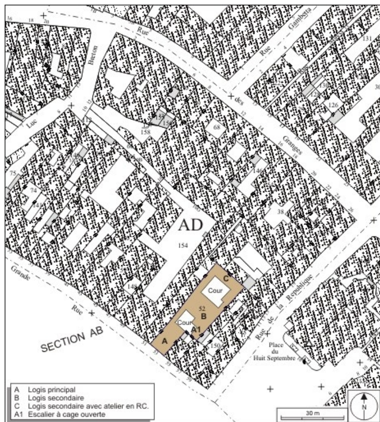
Plan masse et de situation. Extrait du plan cadastral, 1974, section AD. 25, Besançon Grande Rue 53, lieudit : îlot Bouteiller