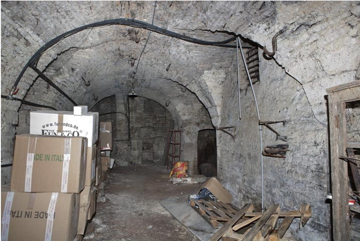
Logis principal, sous-sol : cave A depuis l'entrée.

25, Besançon Grande Rue 53, lieudit : îlot Bouteiller