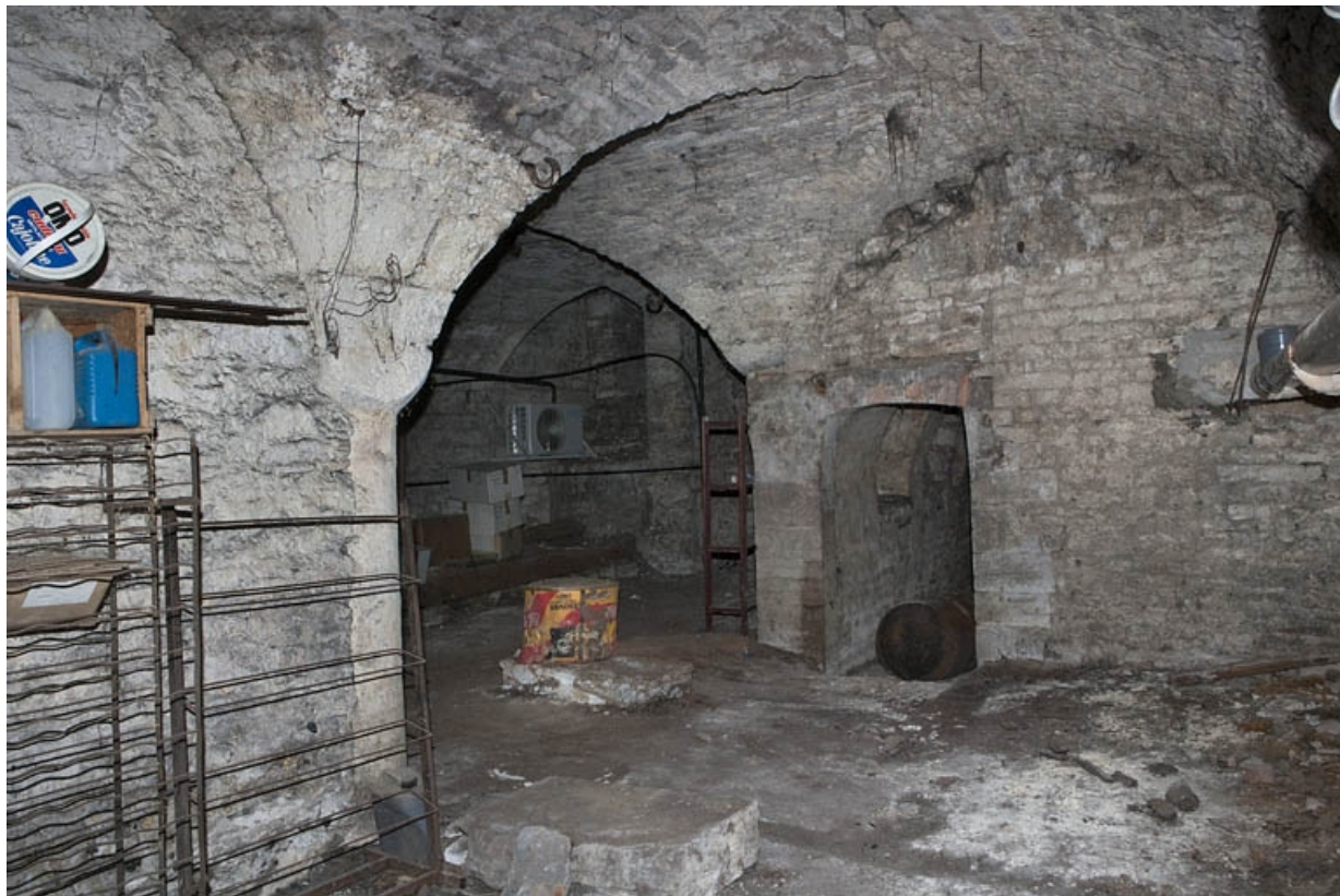
Logis principal, sous-sol : cave A, vue d'ensemble.

25, Besançon Grande Rue 53, lieudit : îlot Bouteiller