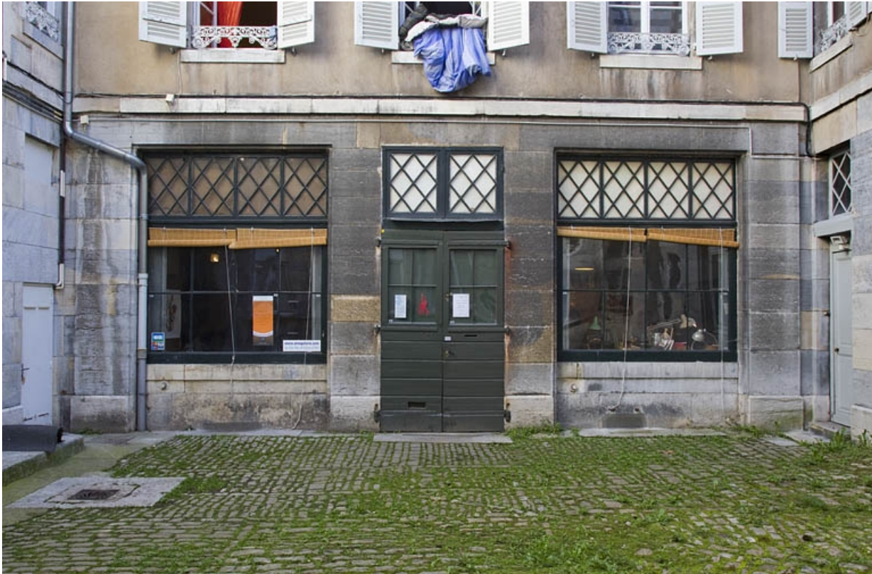
Façade antérieure du deuxième logis secondaire : détail du rez-de-chaussée.

25, Besançon Grande Rue 53, lieudit : îlot Bouteiller