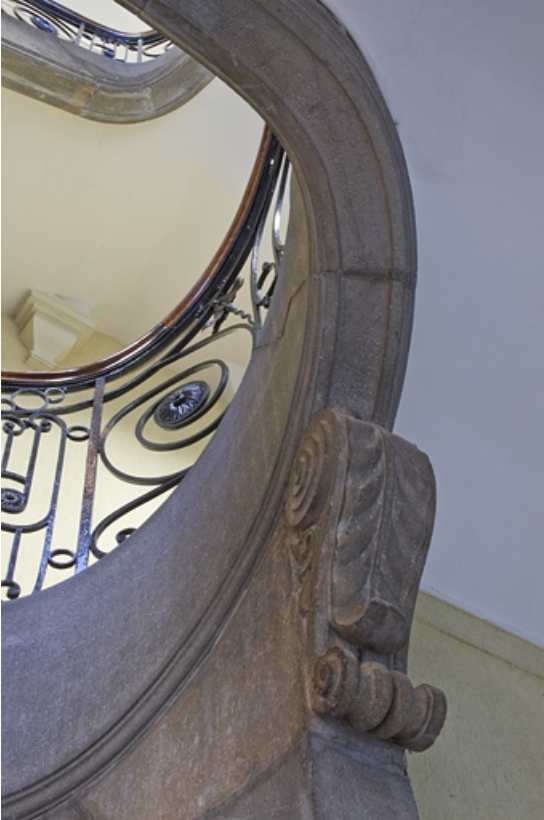
Aile droite, escalier : détail d'un modillon du limon.

25, Besançon Grande Rue 49, lieudit : îlot Bouteiller