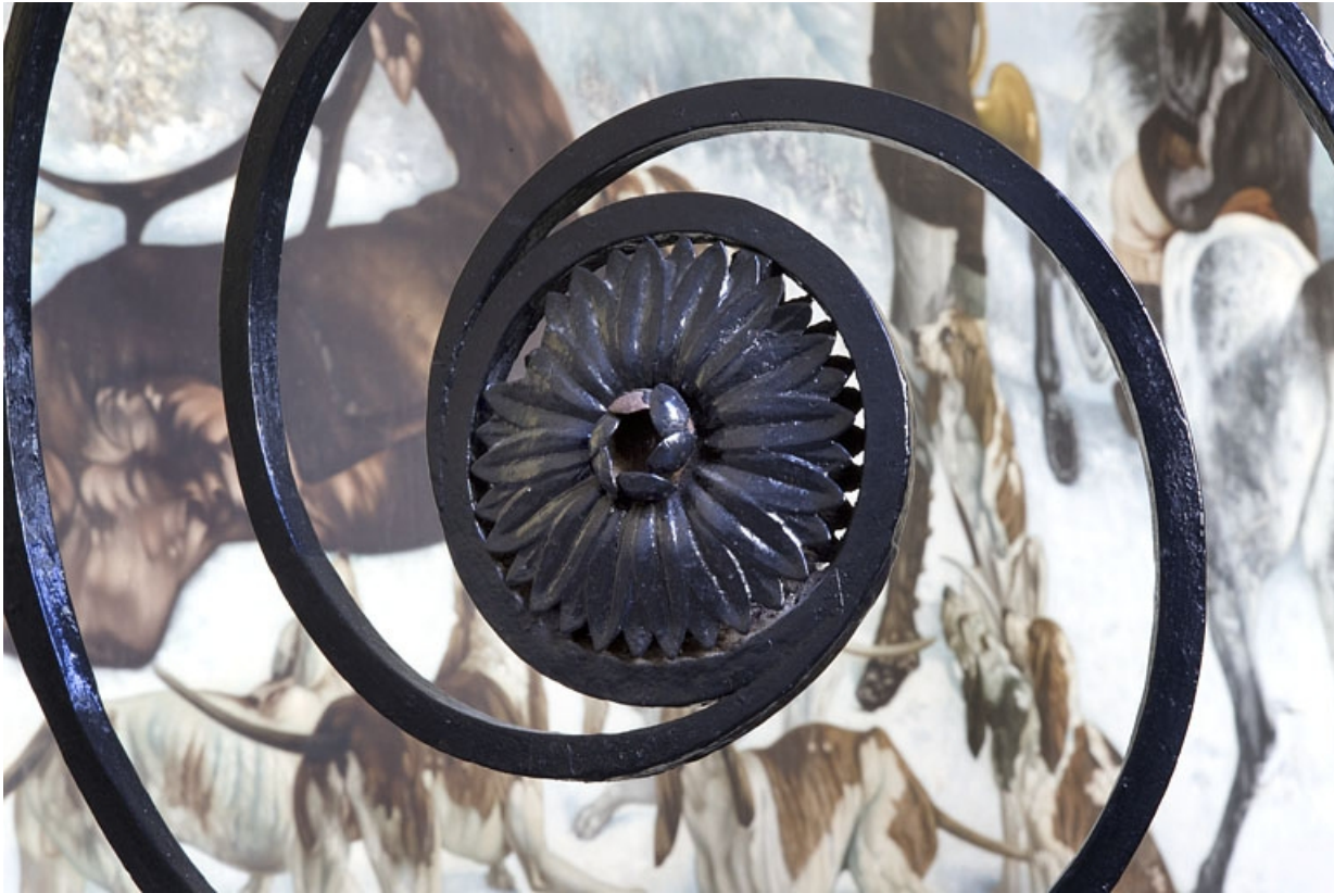
Aile droite, escalier : détail d'un mascaron de la rampe en fer forgé.

25, Besançon Grande Rue 49, lieudit : îlot Bouteiller