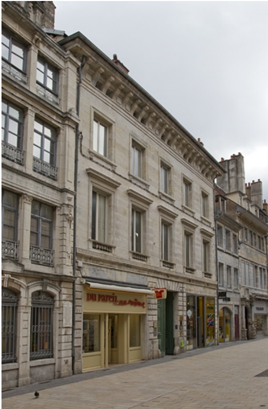
Logis principal : vue d'ensemble depuis la rue, de trois quarts gauche.

25, Besançon Grande Rue 49, lieudit : îlot Bouteiller