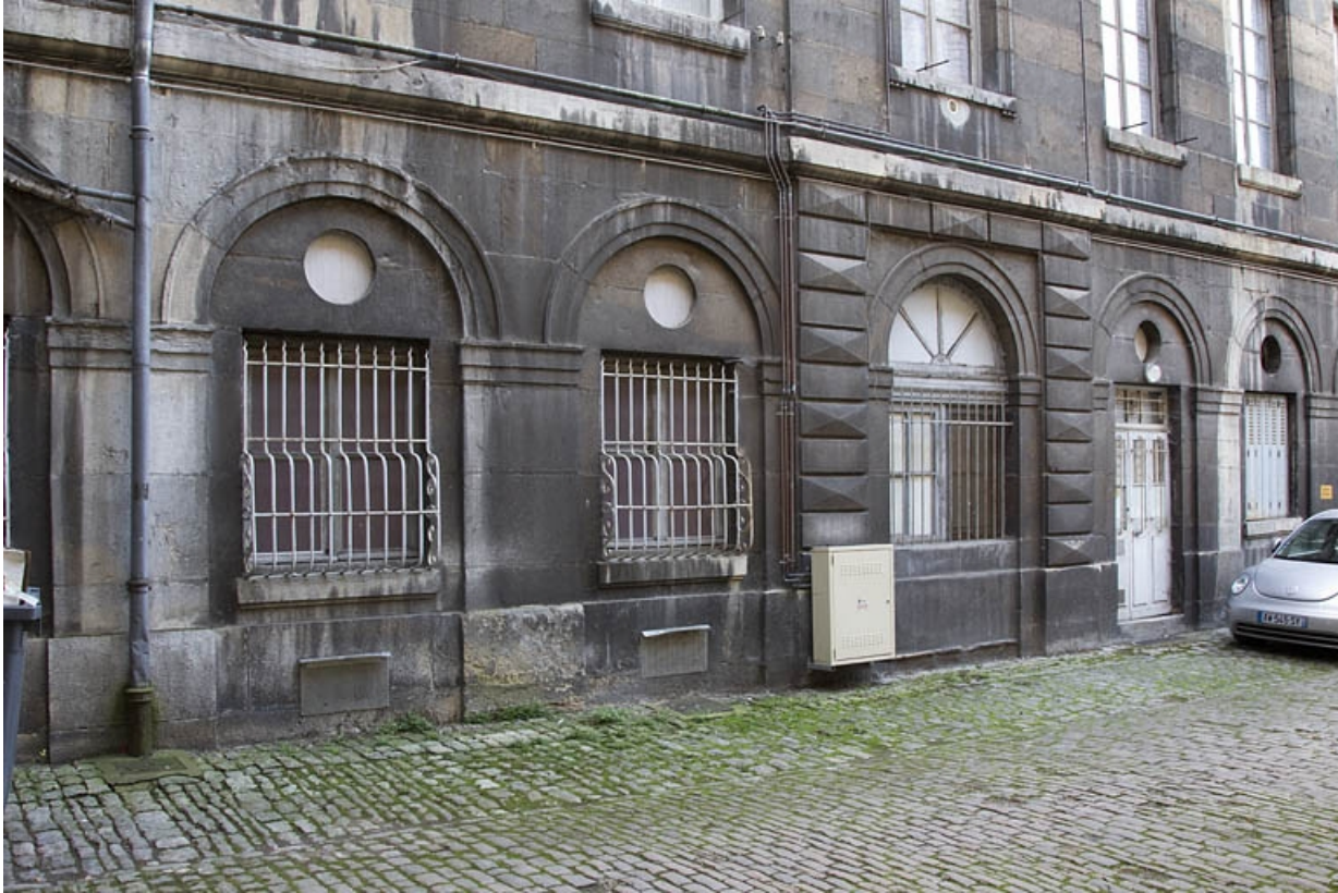
Aile gauche : détail du rez-de-chaussée, de trois quarts droit.

25, Besançon Grande Rue 49, lieudit : îlot Bouteiller