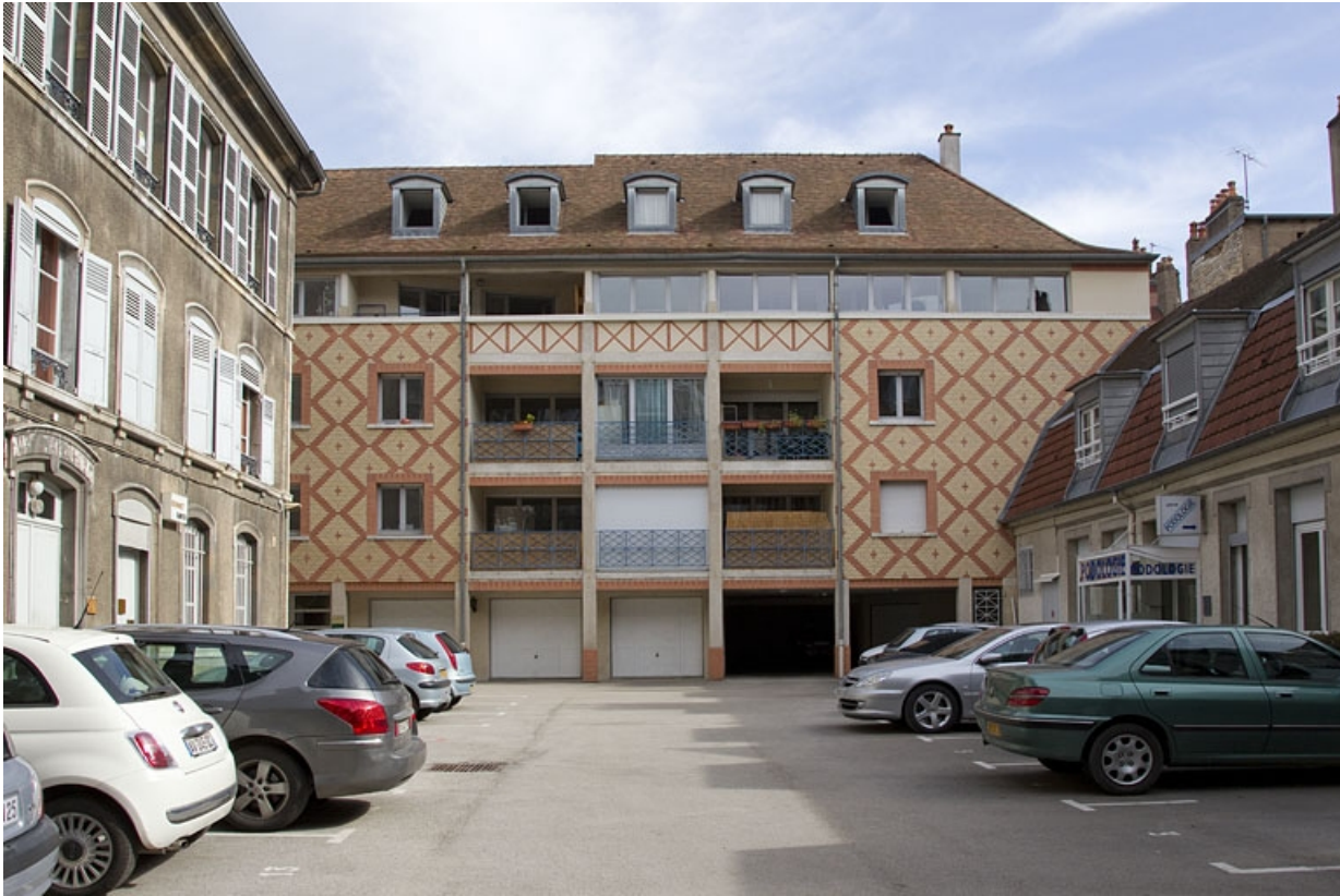
Vue d'ensemble d'immeuble récent en fond de parcelle.

25, Besançon Grande Rue 49, lieudit : îlot Bouteiller