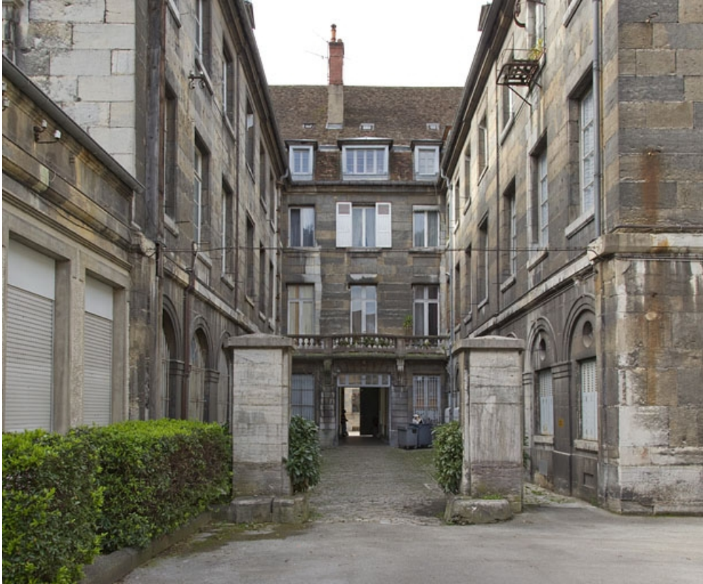
Logis principal : vue d'ensemble de la façade postérieure et des deux ailes sur cour.

25, Besançon Grande Rue 49, lieudit : îlot Bouteiller