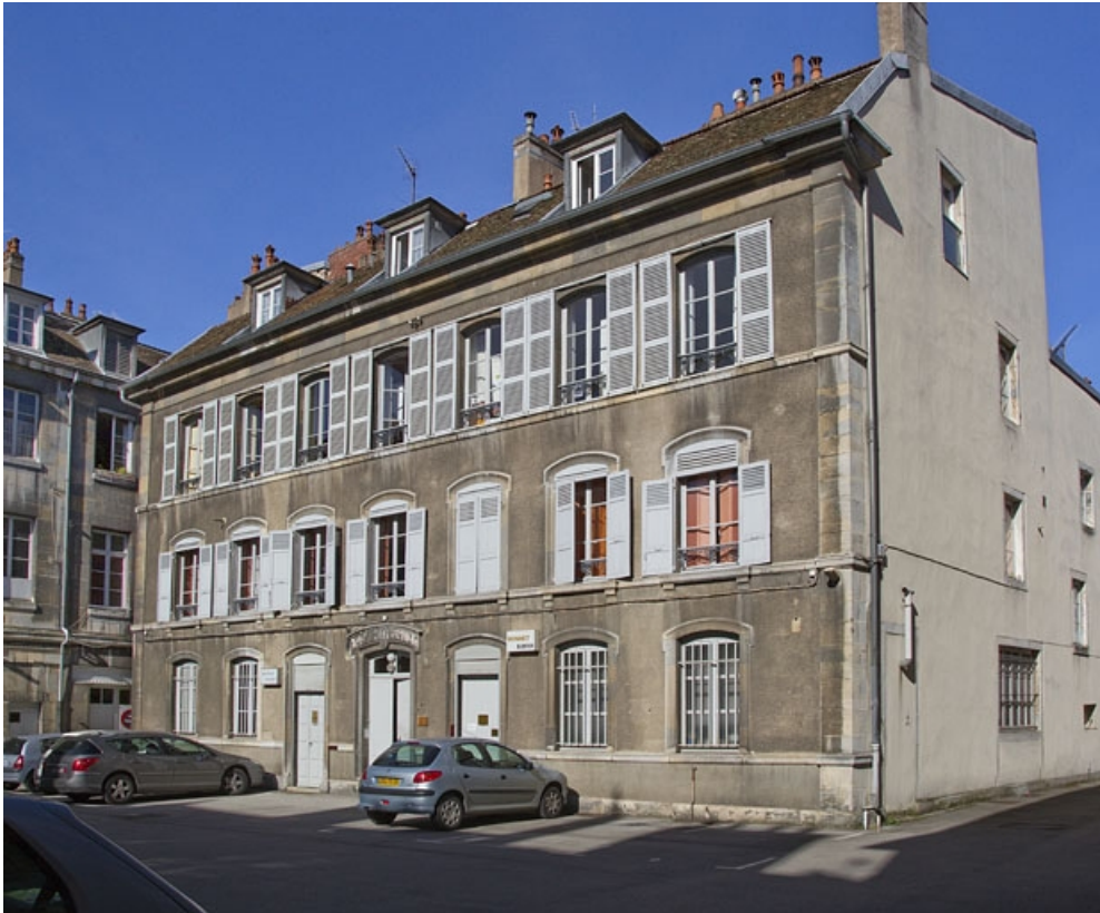
Maison à gauche de la deuxième cour : vue d'ensemble, de trois quarts droit.

25, Besançon Grande Rue 49, lieudit : îlot Bouteiller