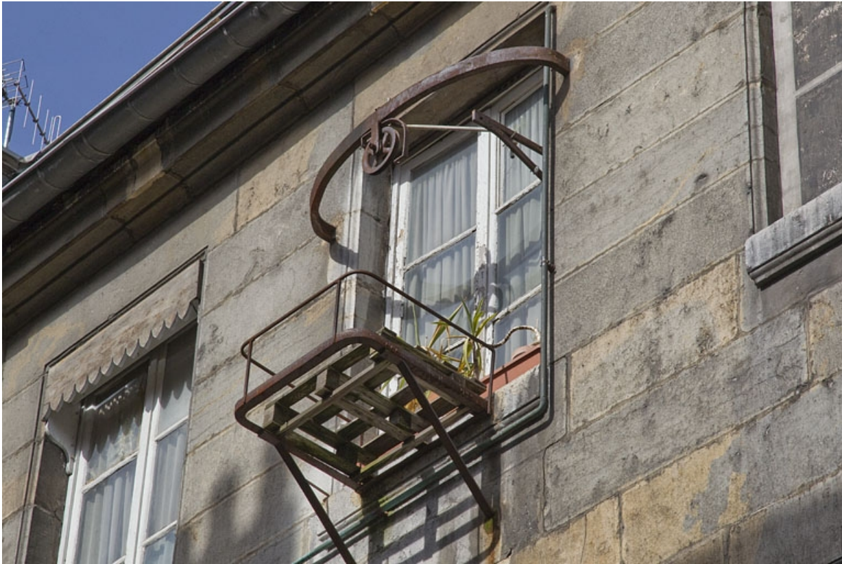
Aile gauche : détail d'un monte-charge.

25, Besançon Grande Rue 49, lieudit : îlot Bouteiller