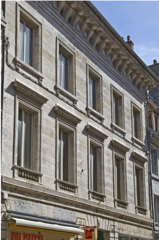
Façade antérieure, de trois quarts gauche : détail des premier et deuxième étages. 25, Besançon Grande Rue 49, lieudit : îlot Bouteiller