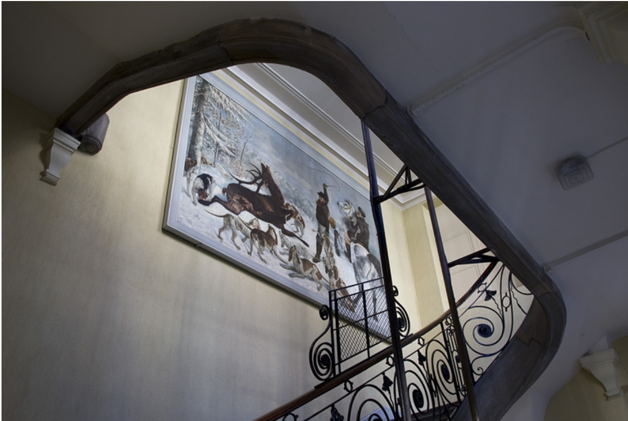
Aile droite, cage de l'escalier : détail de la partie supérieure, avec la reproduction d'un tableau de Courbet.

25, Besançon Grande Rue 49, lieudit : îlot Bouteiller