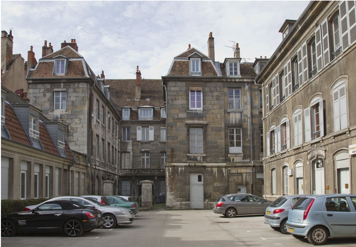
Logis principal : vue d'ensemble depuis le fond de la cour, de face.

25, Besançon Grande Rue 49, lieudit : îlot Bouteiller