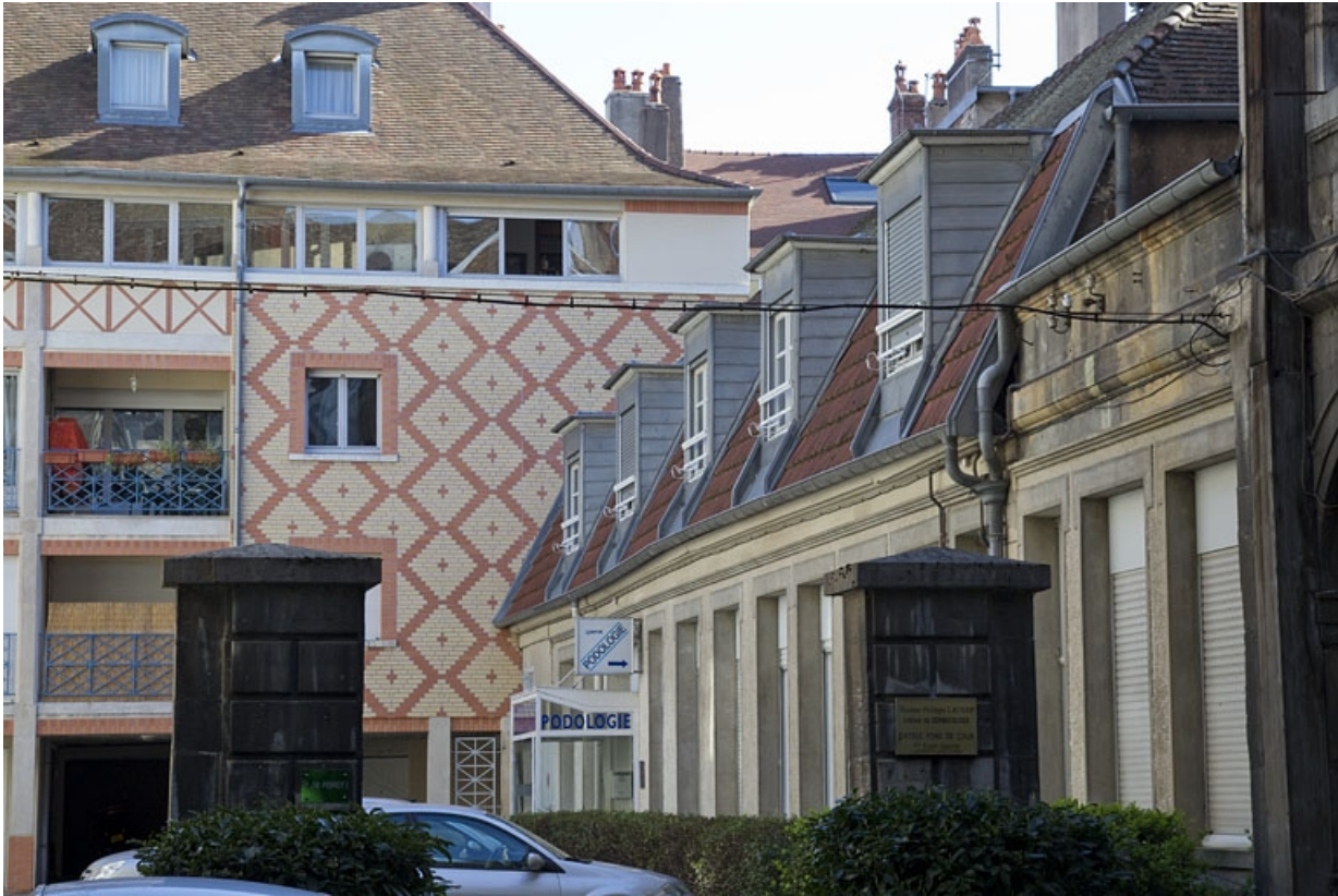
Bâtiment à droite de la deuxième cour : vue d'ensemble.

25, Besançon Grande Rue 49, lieudit : îlot Bouteiller