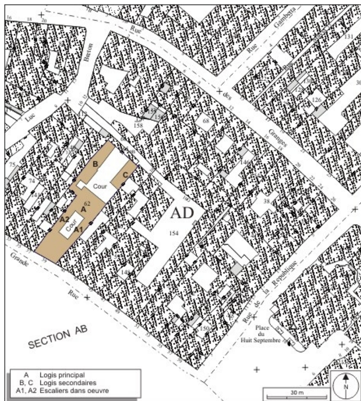
Plan masse et de situation. Extrait du plan cadastral, 1974, section AD. 25, Besançon Grande Rue 39, lieudit : îlot Bouteiller