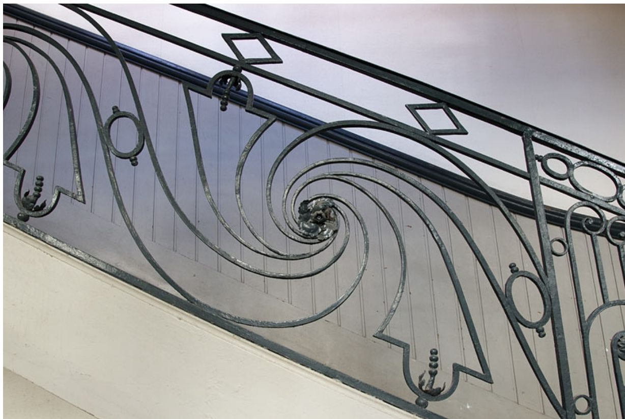
Logis principal, escalier : détail d'une partie de la rampe en fer forgé.

25, Besançon Grande Rue 39, lieudit : îlot Bouteiller