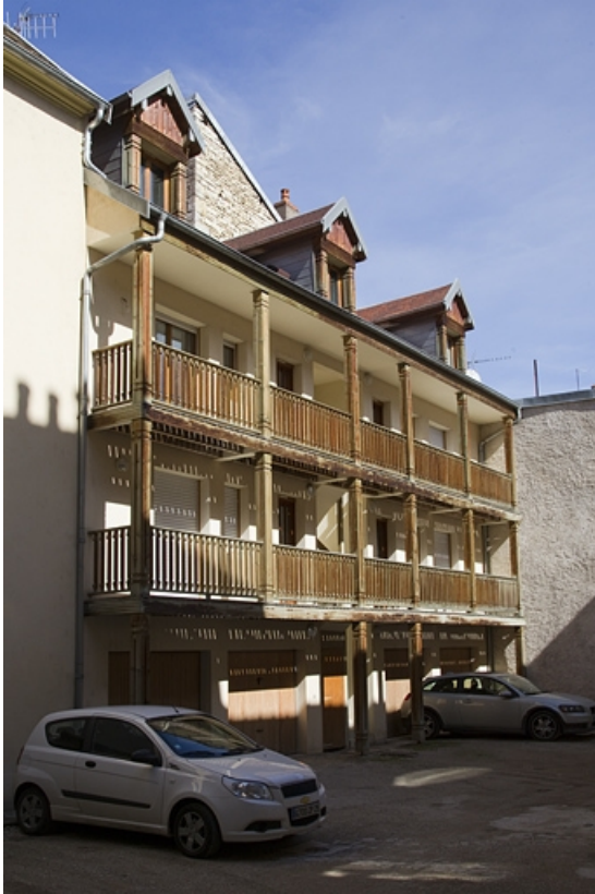
Deuxième cour : vue d'ensemble du logis secondaire gauche, de trois quarts gauche. 25, Besançon Grande Rue 39, lieudit : îlot Bouteiller