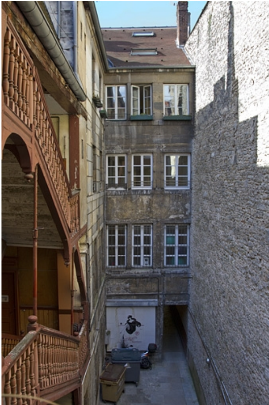
Logis principal : vue d'ensemble de la façade postérieure depuis l'escalier à cage ouverte.

25, Besançon, 41 Grande Rue, lieudit : îlot Bouteiller