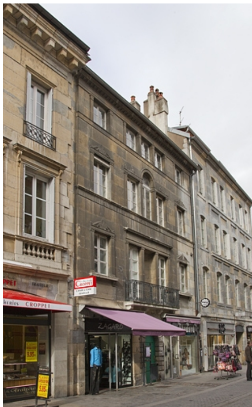
Vue d'ensemble de la façade antérieure : de tois quarts gauche.

25, Besançon, 16 rue des Granges, lieudit : îlot Bouteiller