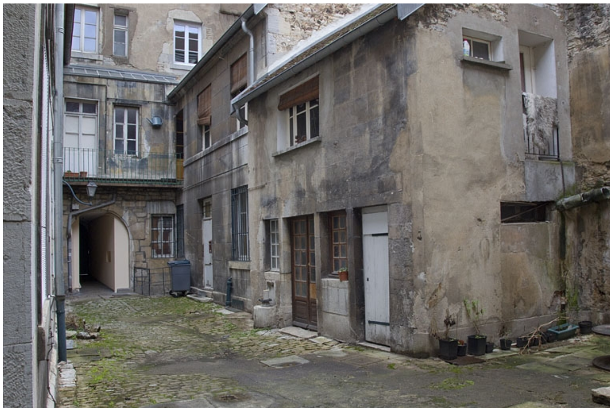
Vue d'ensemble des bâtiments à gauche de la cour.

25, Besançon, 16 rue des Granges, lieudit : îlot Bouteiller