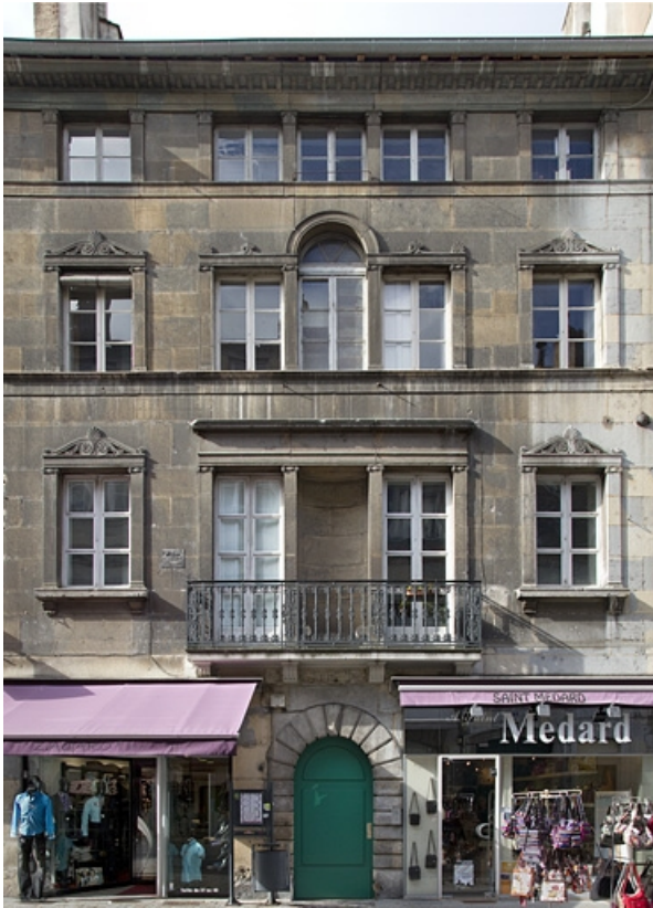
Vue d'ensemble de la façade antérieure : de face.

25, Besançon, 16 rue des Granges, lieudit : îlot Bouteiller