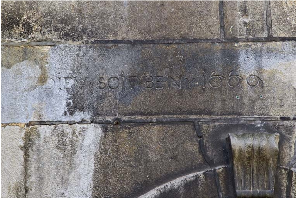
Logis secondaire en fond de cour : détail de l'inscription et de la date.

25, Besançon, 16 rue des Granges, lieudit : îlot Bouteiller