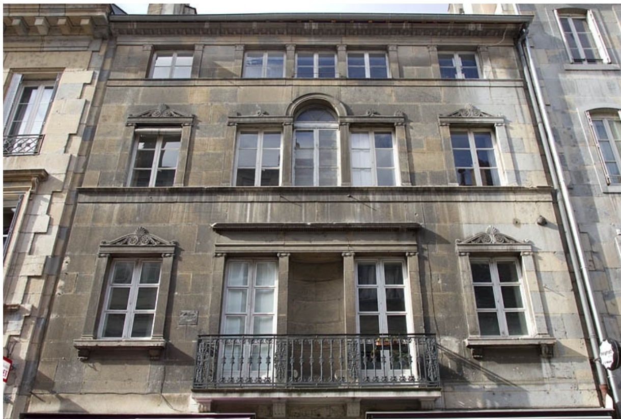
Logis principal : détail de la façade sur rue, à partir de premier étage.

25, Besançon, 16 rue des Granges, lieudit : îlot Bouteiller