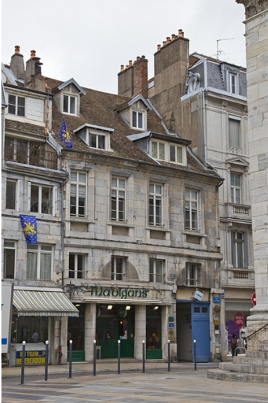
Logis principal gauche : vue d'ensemble depuis la rue, de trois quarts gauche. 25, Besançon, 17, 19 place du Huit Septembre, lieudit : îlot Bouteiller