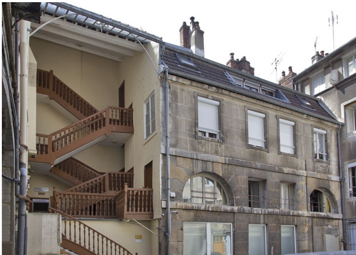
Vue d'ensemble du logis secondaire, à gauche de la cour.

25, Besançon, 17, 19 place du Huit Septembre, lieudit : îlot Bouteiller