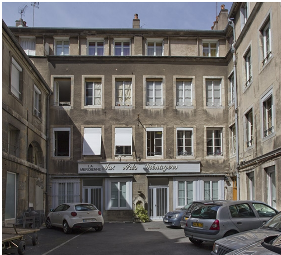
Vue d'ensemble des logis sur cour depuis l'entrée.

25, Besançon, 17, 19 place du Huit Septembre, lieudit : îlot Bouteiller