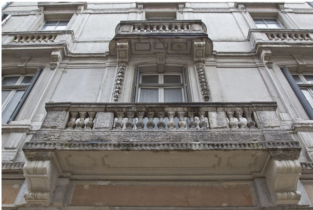
Logis principal droit : détail des balcons en pierre de la façade sur rue, en contre-plongée.

25, Besançon, 17, 19 place du Huit Septembre, lieudit : îlot Bouteiller