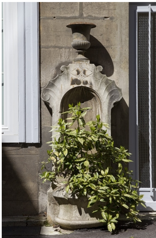
Détail de la borne-fontaine située au fond de la cour.

25, Besançon, 17, 19 place du Huit Septembre, lieudit : îlot Bouteiller