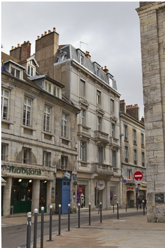
Vue d'ensemble des deux logis principaux depuis la rue, de trois quarts gauche.

25, Besançon, 17, 19 place du Huit Septembre, lieudit : îlot Bouteiller