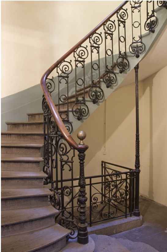
Logis principal droit : détail du départ de l'escalier.

25, Besançon, 17, 19 place du Huit Septembre, lieudit : îlot Bouteiller