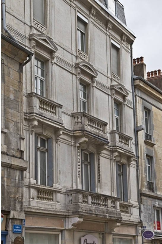
Logis principal droit : détail de la façade sur rue, de trois quarts gauche.

25, Besançon, 17, 19 place du Huit Septembre, lieudit : îlot Bouteiller