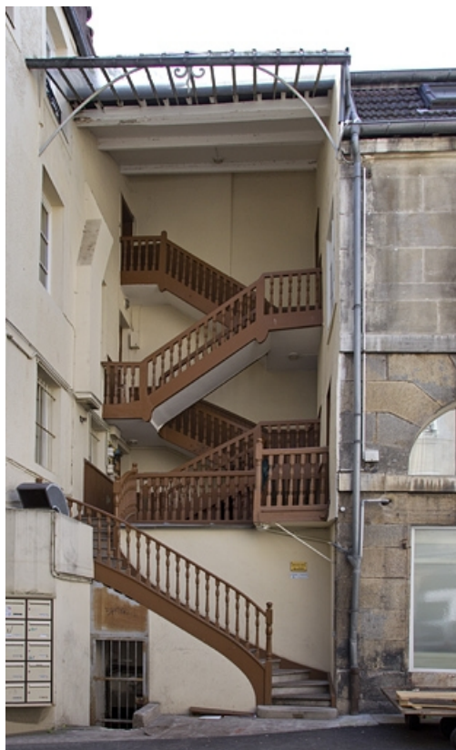
Détail de l'escalier à cage ouverte à gauche de la cour.

25, Besançon, 17, 19 place du Huit Septembre, lieudit : îlot Bouteiller