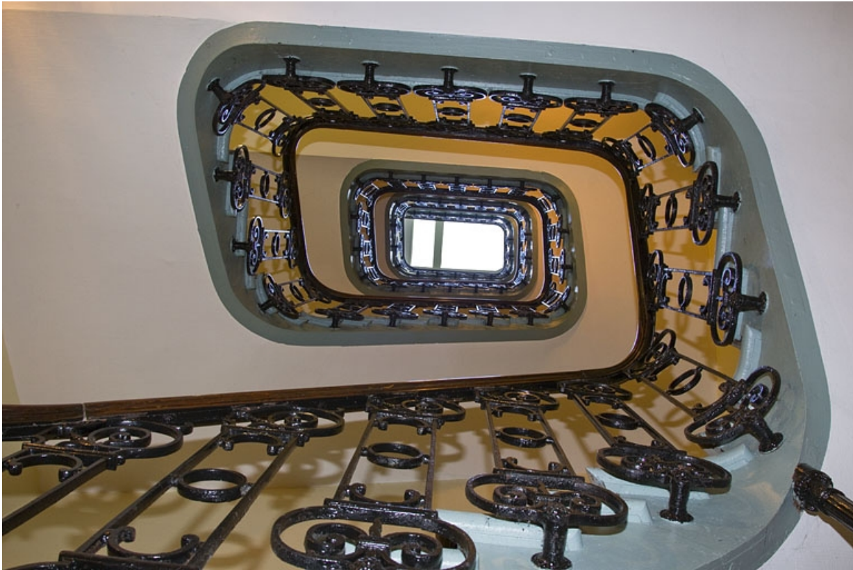
Logis principal droit : vue d'ensemble de l'escalier, en contre-plongée.

25, Besançon, 17, 19 place du Huit Septembre, lieudit : îlot Bouteiller