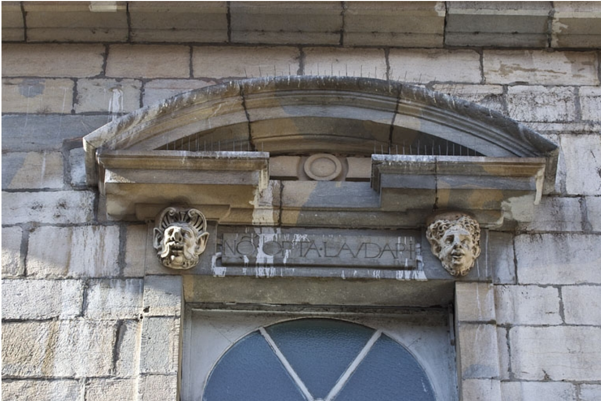
Façade antérieure, partie droite, sixième fenêtre de l'étage à partir de la droite : détail du fronton triangulaire. 25, Besançon, 2, 4 rue des Granges, lieudit : îlot Bouteiller