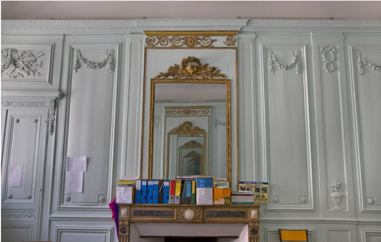
Intérieur, salon : détail de la glace sur la cheminée.

25, Besançon, 2, 4 rue des Granges, lieudit : îlot Bouteiller