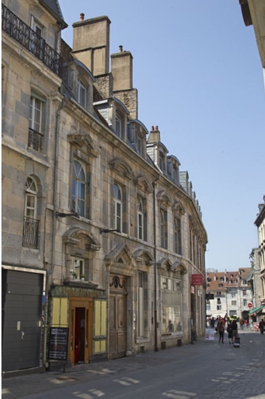
Vue d'ensemble de trois quarts gauche.

25, Besançon, 2, 4 rue des Granges, lieudit : îlot Bouteiller