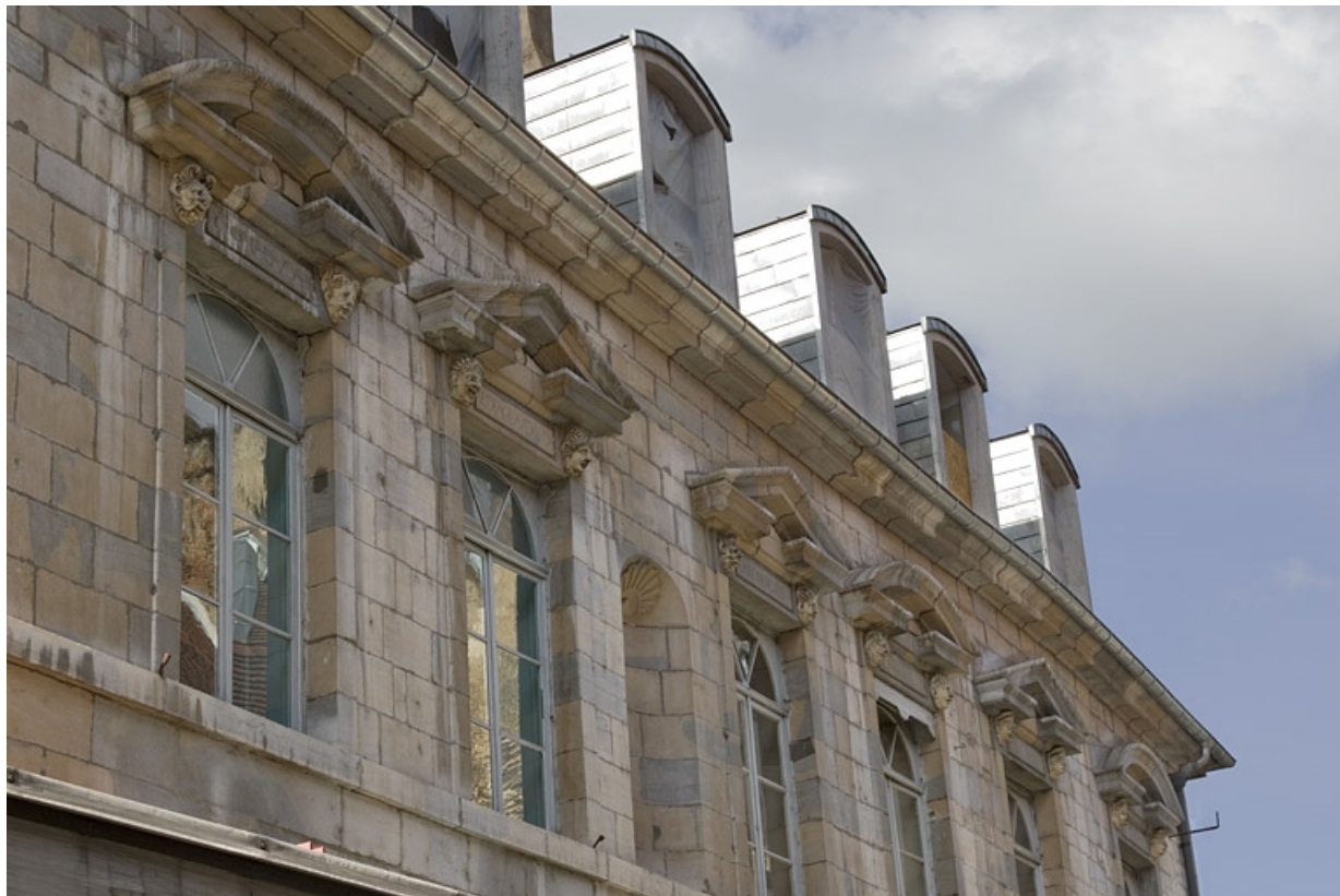
Façade antérieure, partie droite, premier étage : vue d'ensemble des fenêtres.

25, Besançon, 2, 4 rue des Granges, lieudit : îlot Bouteiller