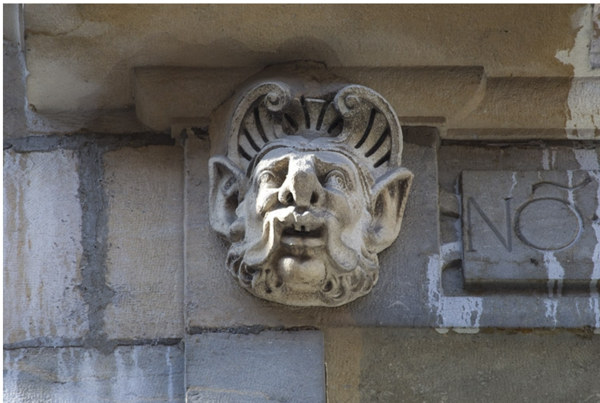
Façade antérieure, partie droite, sixième fenêtre de l'étage à partir de la droite : détail du mascaron gauche. 25, Besançon, 2, 4 rue des Granges, lieudit : îlot Bouteiller