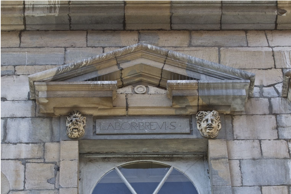
Façade antérieure, partie droite, quatrième fenêtre de l'étage à partir de la droite : détail du fronton triangulaire. 25, Besançon, 2, 4 rue des Granges, lieudit : îlot Bouteiller