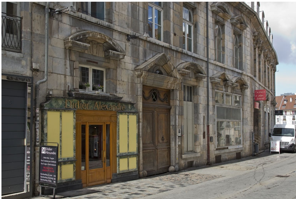
Façade antérieure : détail de la partie gauche.

25, Besançon, 2, 4 rue des Granges, lieudit : îlot Bouteiller