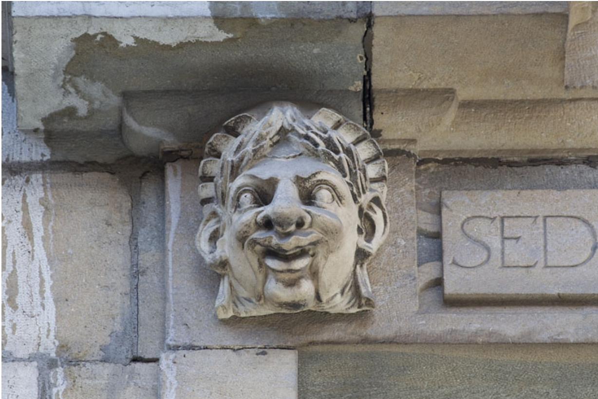
Façade antérieure, partie droite, cinquième fenêtre de l'étage à partir de la droite : détail du mascaroon gauche. 25, Besançon, 2, 4 rue des Granges, lieudit : îlot Bouteiller