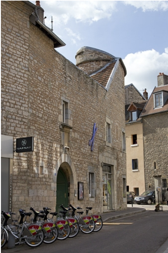
Façade latérale droite : de trois quarts gauche.

25, Besançon, 2, 4 rue des Granges, lieudit : îlot Bouteiller