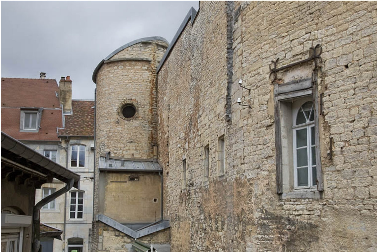
Partie droite : détail de la partie supérieure du pigeonnier depuis l'impasse, de profil.

25, Besançon, 2, 4 rue des Granges, lieudit : îlot Bouteiller