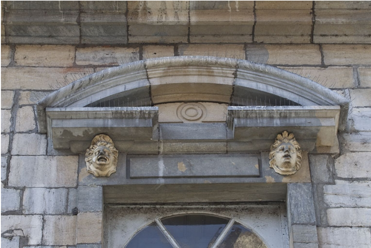
Façade antérieure, partie droite, première fenêtre de l'étage à partir de la droite : détail du fronton cintré.

25, Besançon, 2, 4 rue des Granges, lieudit : îlot Bouteiller