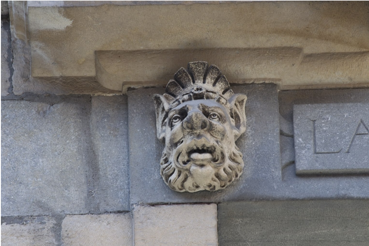
Façade antérieure, partie droite, quatrième fenêtre de l'étage à partir de la droite : détail du mascaroon gauche. 25, Besançon, 2, 4 rue des Granges, lieudit : îlot Bouteiller