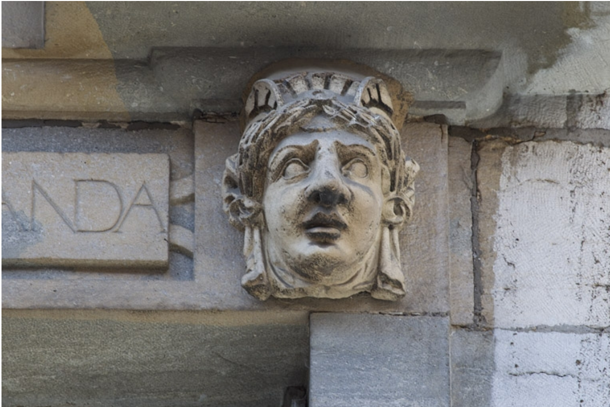
Façade antérieure, partie droite, cinquième fenêtre de l'étage à partir de la droite : détail du mascaroon droit. 25, Besançon, 2, 4 rue des Granges, lieudit : îlot Bouteiller