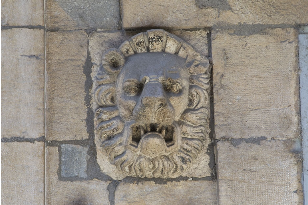
Façade antérieure, partie droite, rez-de-chaussée : détail du mascaron, troisième fenêtre à partir de la droite. 25, Besançon, 2, 4 rue des Granges, lieudit : îlot Bouteiller