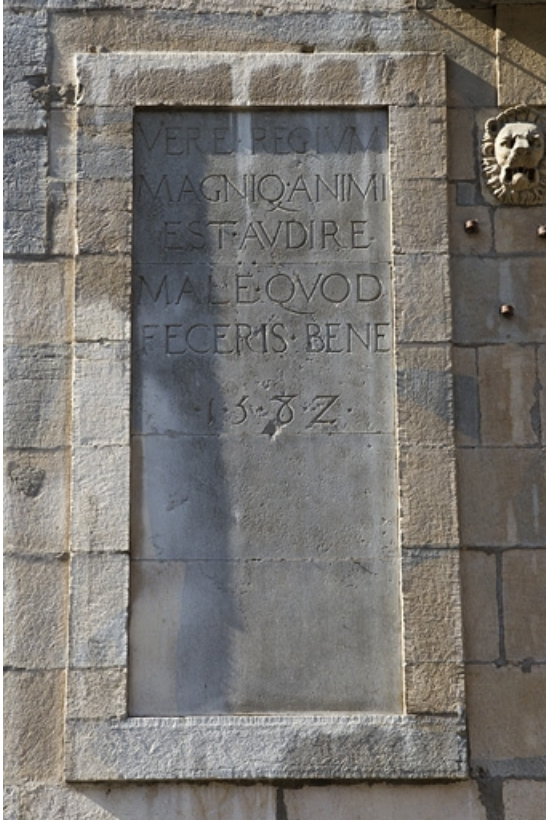
Façade antérieure, partie droite, rez-de-chaussée : vue d'ensemble de l'inscription.

25, Besançon, 2, 4 rue des Granges, lieudit : îlot Bouteiller