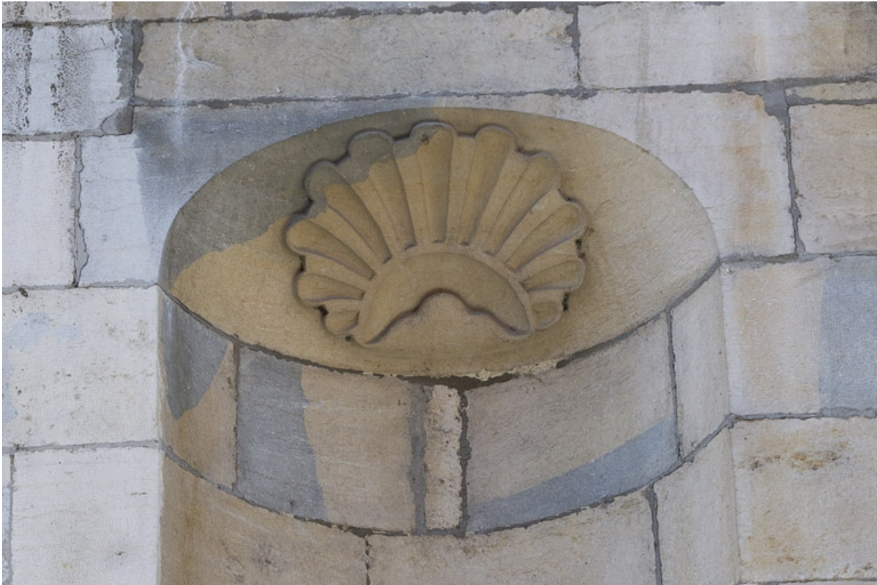
Façade antérieure, partie droite, premier étage : détail de la coquille de la niche.

25, Besançon, 2, 4 rue des Granges, lieudit : îlot Bouteiller