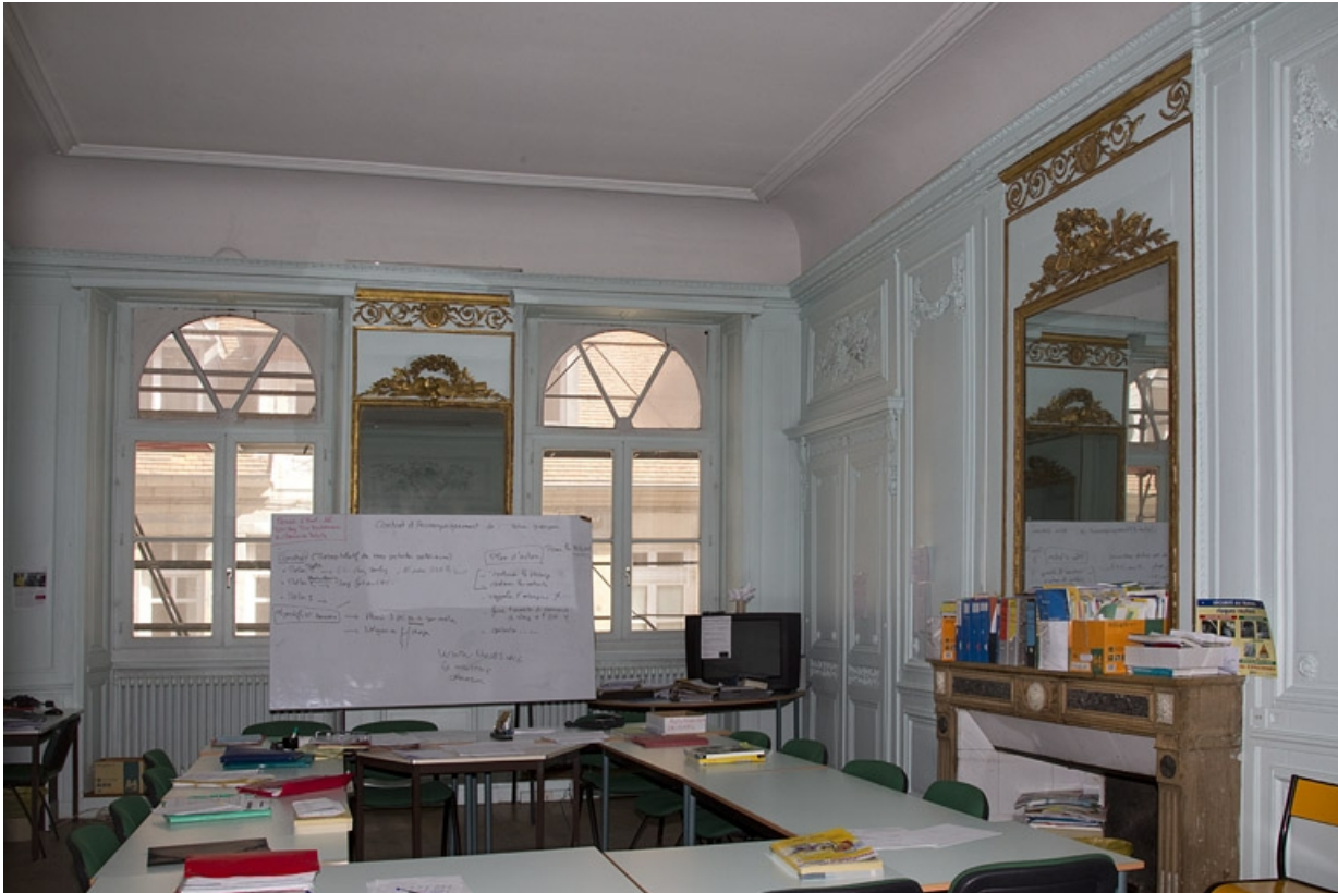
Intérieur, salon : vue d'ensemble depuis le fond de la pièce.

25, Besançon, 2, 4 rue des Granges, lieudit : îlot Bouteiller