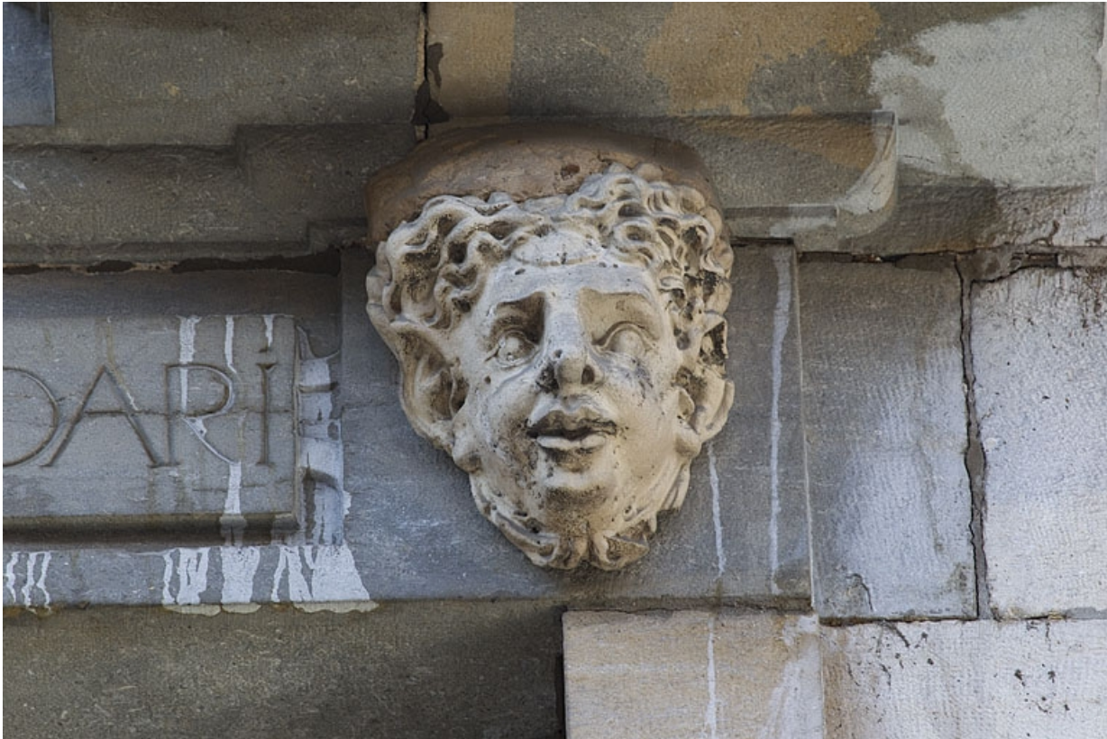
Façade antérieure, partie droite, sixième fenêtre de l'étage à partir de la droite : détail du mascaroon droit.

25, Besançon, 2, 4 rue des Granges, lieudit : îlot Bouteiller