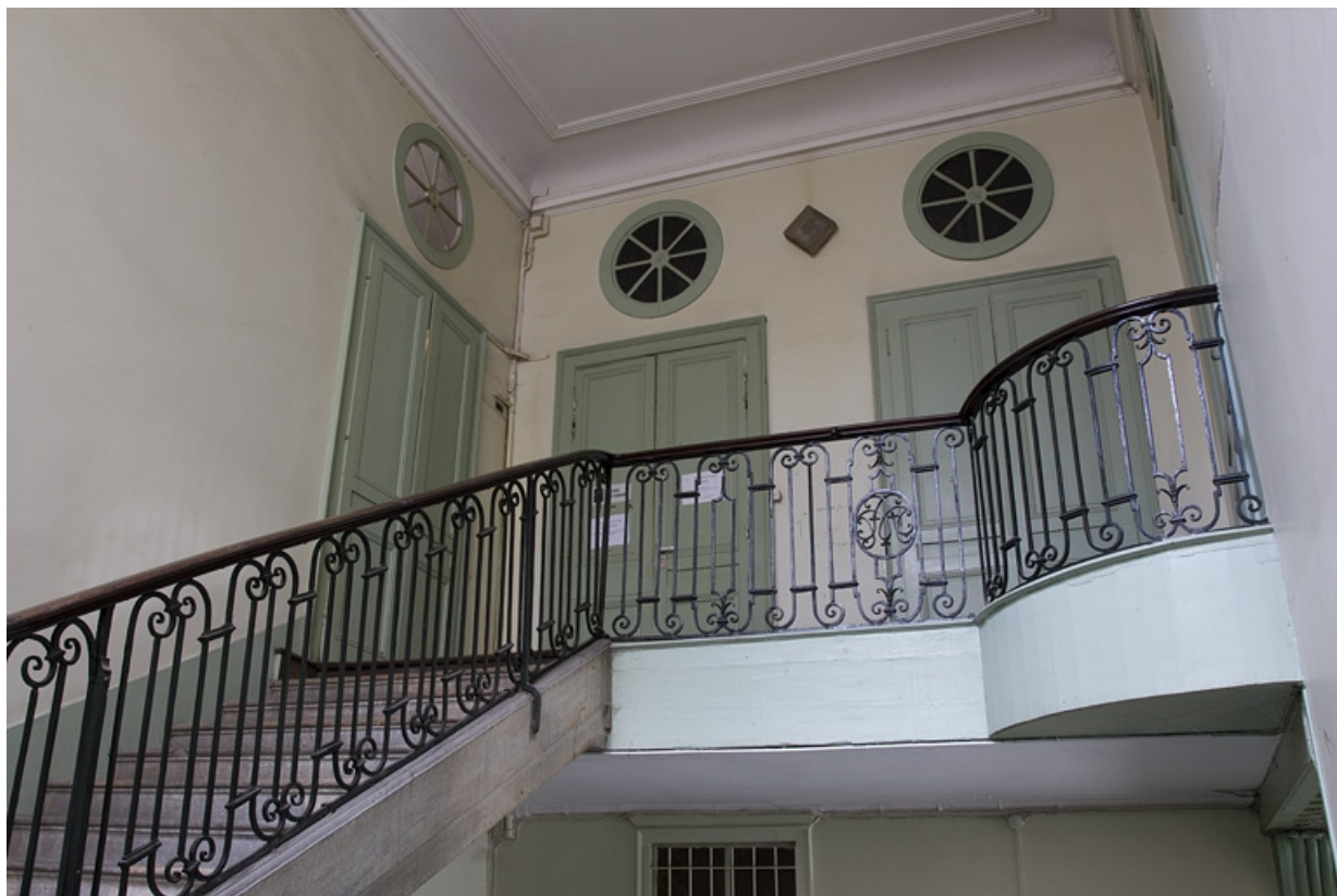
Intérieur, escalier d'honneur : détail de la partie supérieure.

25, Besançon, 2, 4 rue des Granges, lieudit : îlot Bouteiller