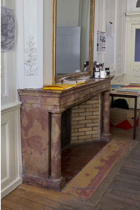
Intérieur, chambre à gauche du salon : détail de la cheminée.

25, Besançon, 2, 4 rue des Granges, lieudit : îlot Bouteiller