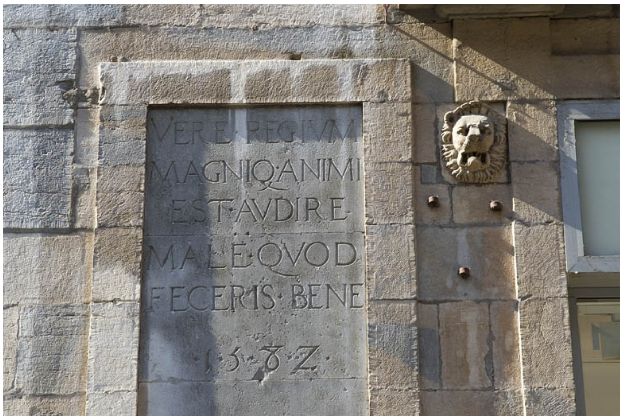
Façade antérieure, partie droite, rez-de-chaussée : détail de l'inscription.

25, Besançon, 2, 4 rue des Granges, lieudit : îlot Bouteiller