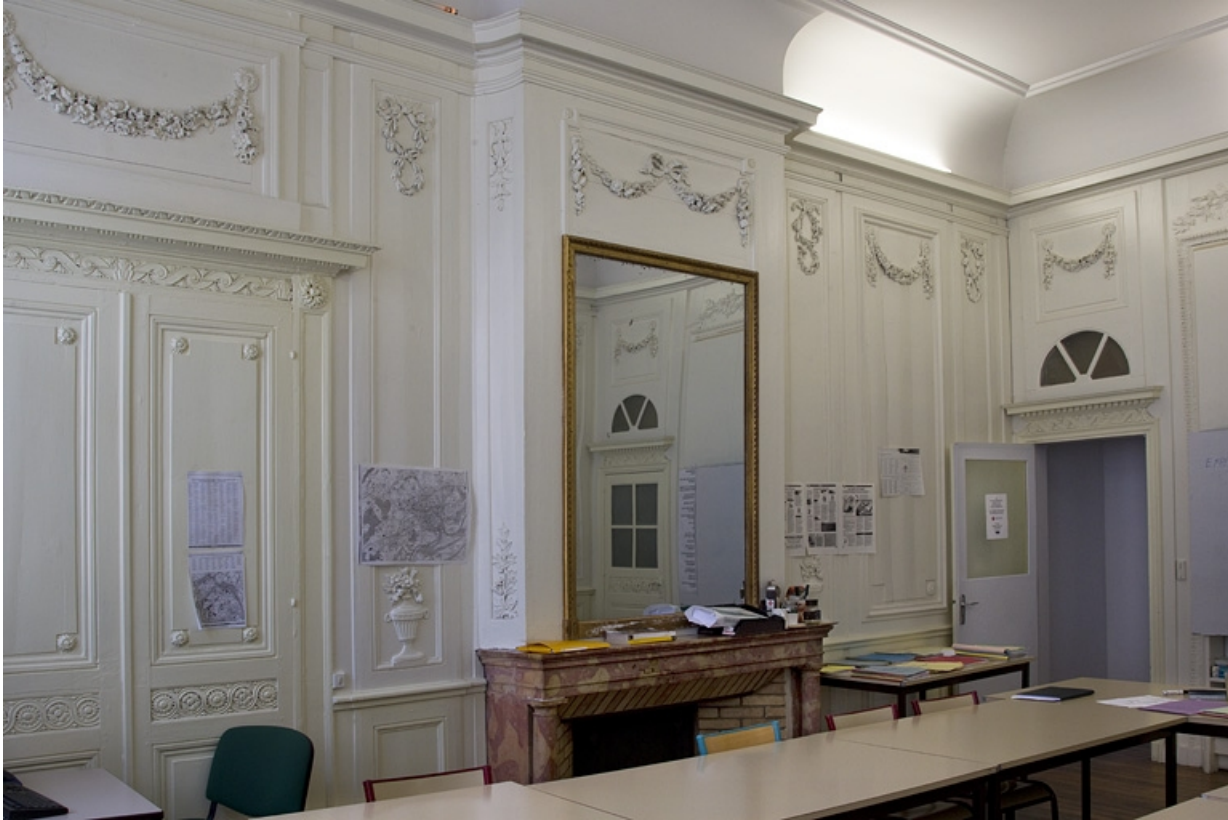
Intérieur, chambre à gauche du salon : lambris et cheminée.

25, Besançon, 2, 4 rue des Granges, lieudit : îlot Bouteiller