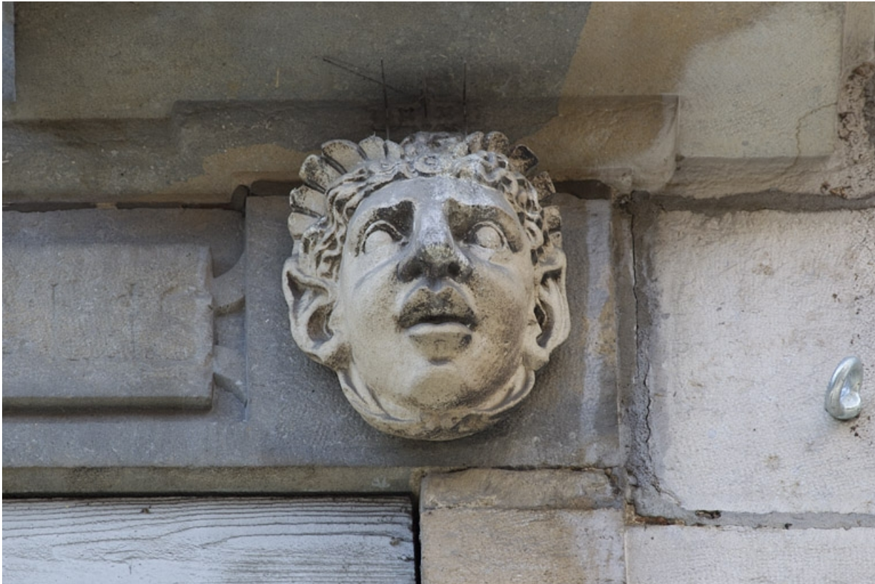
Façade antérieure, partie droite, troisième fenêtre de l'étage à partir de la droite : détail du mascaroon droit. 25, Besançon, 2, 4 rue des Granges, lieudit : îlot Bouteiller