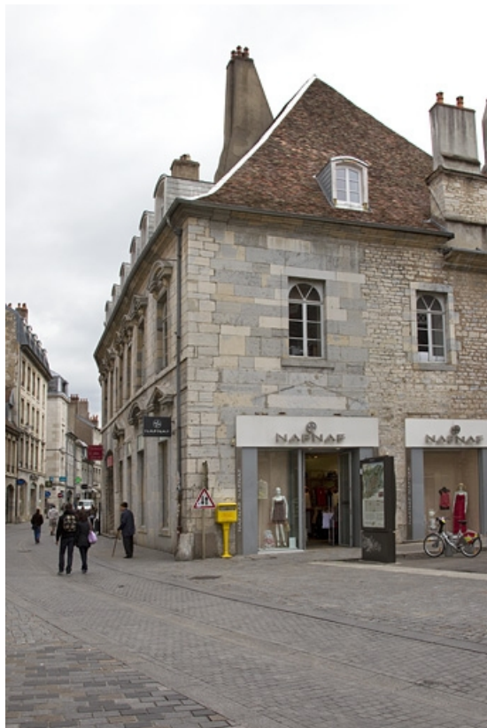
Vue d'ensemble, de trois quarts droit.

25, Besançon, 2, 4 rue des Granges, lieudit : îlot Bouteiller