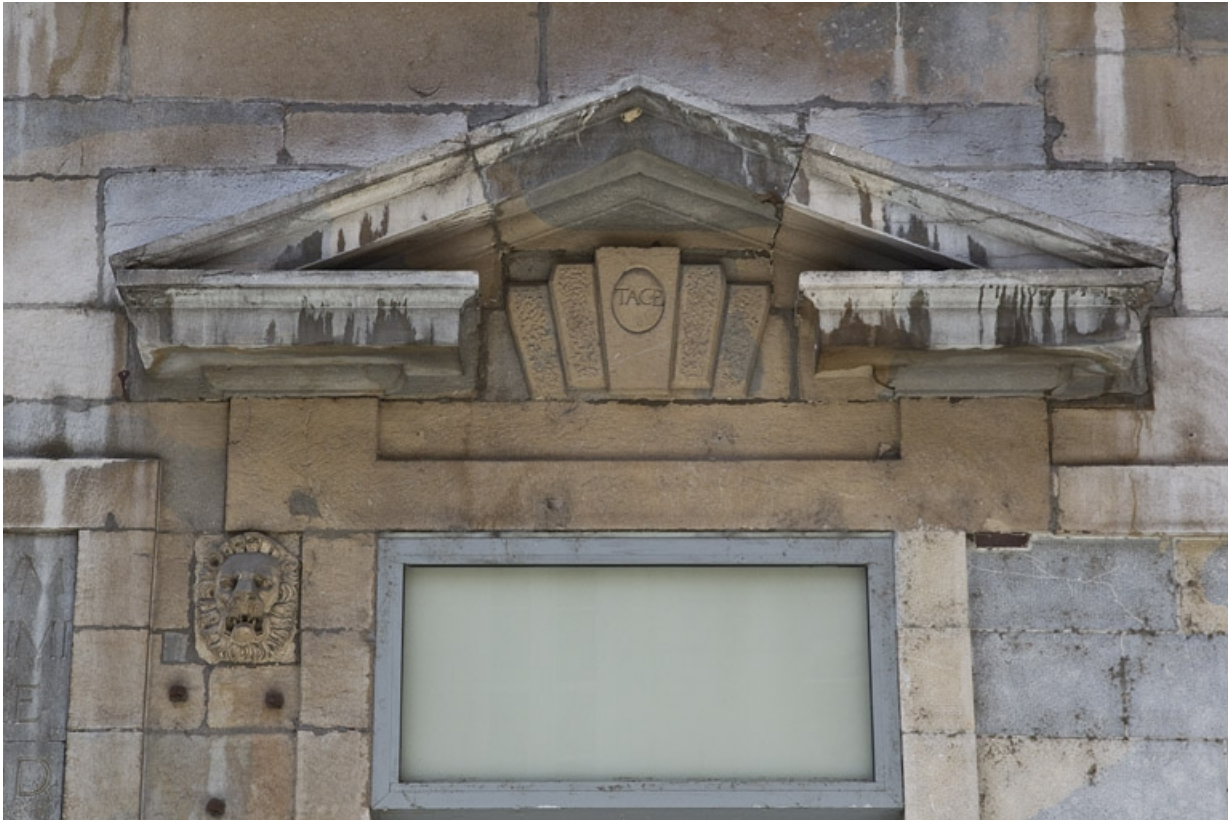
Façade antérieure, partie droite, rez-de-chaussée : détail du fronton de la troisième fenêtres à partir de la droite. 25, Besançon, 2, 4 rue des Granges, lieudit : îlot Bouteiller