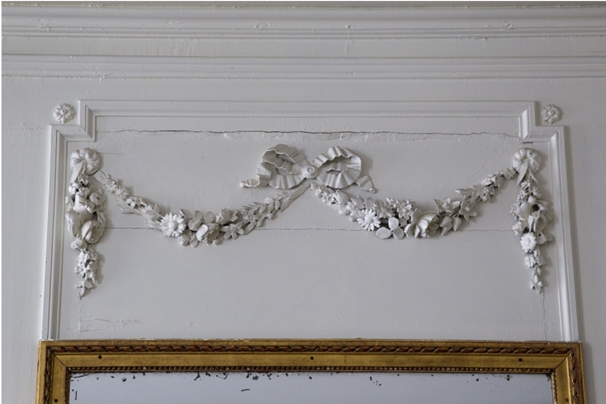
Intérieur, chambre à gauche du salon : partie supérieure d'un lambris, détail d'une guirlande de fleurs.

25, Besançon, 2, 4 rue des Granges, lieudit : îlot Bouteiller