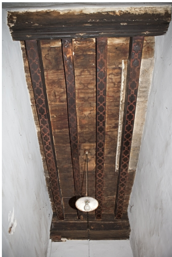
Galerie sur cour, partie à droite de l'entrée, rez-de-chaussée : détail d'un plafond peint. 25, Besançon, 2, 4 rue des Granges, lieudit : îlot Bouteiller