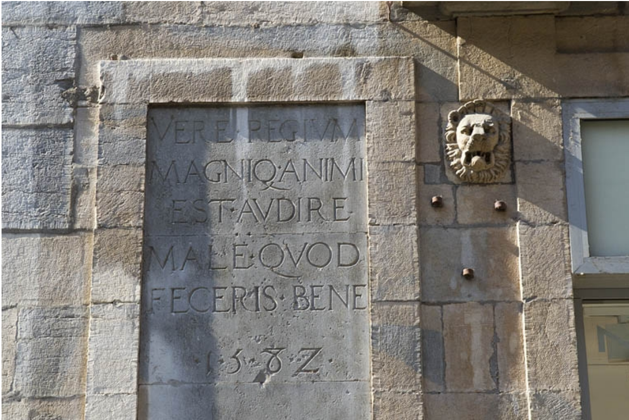
Façade antérieure, partie droite, rez-de-chaussée : détail de l'inscription.

25, Besançon, 2, 4 rue des Granges, lieudit : îlot Bouteiller