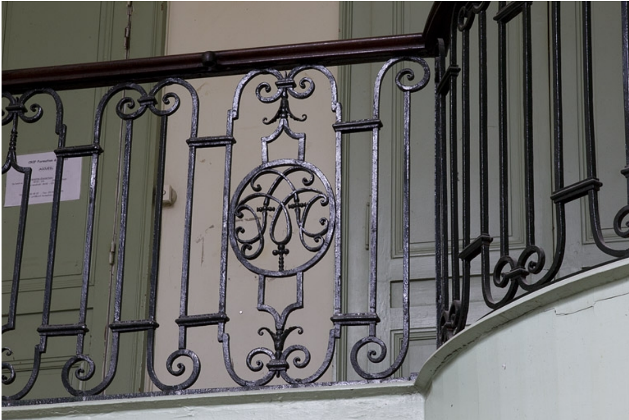
Intérieur, escalier d'honneur : détail du monogramme sur la rampe en fer forgé.

25, Besançon, 2, 4 rue des Granges, lieudit : îlot Bouteiller