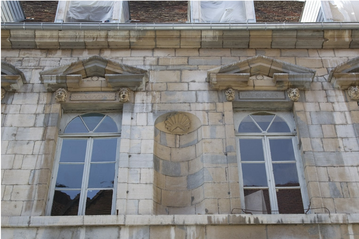
Façade antérieure, partie droite, premier étage : vue d'ensemble de la quatrième et cinquième fenêtres à partir de la droite. 25, Besançon, 2, 4 rue des Granges, lieudit : îlot Bouteiller