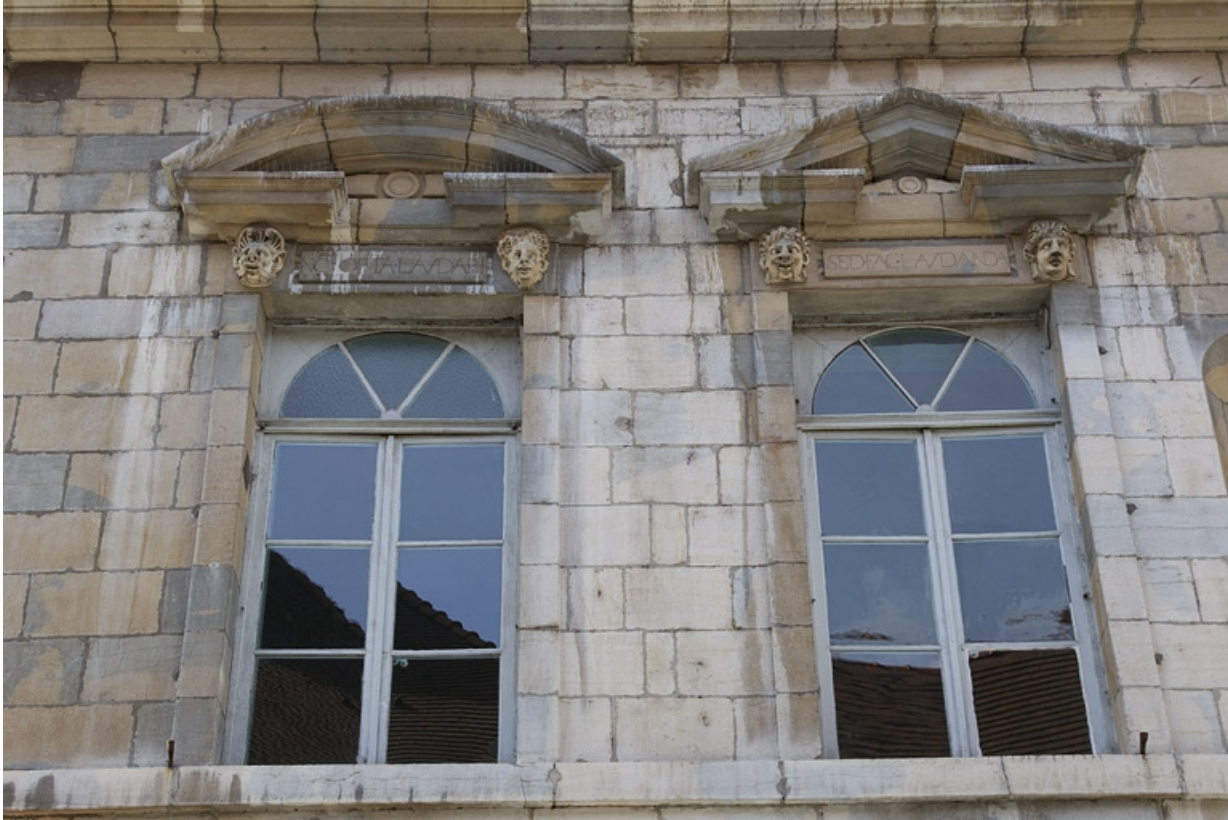
Façade antérieure, partie droite, premier étage : vue d'ensemble de la cinquième et sixième fenêtres à partir de la droite. 25, Besançon, 2, 4 rue des Granges, lieudit : îlot Bouteiller