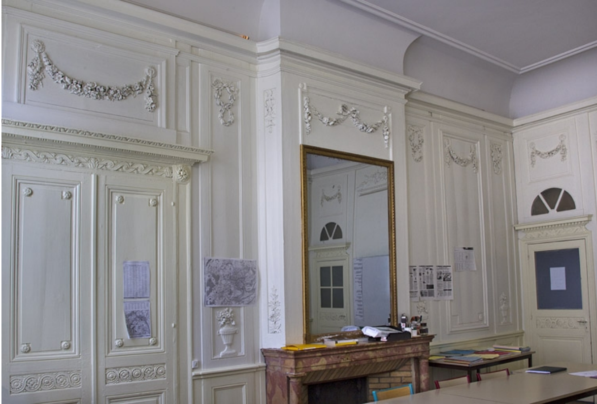
Intérieur, chambre à gauche du salon : lambris et cheminée, vue rapprochée.

25, Besançon, 2, 4 rue des Granges, lieudit : îlot Bouteiller