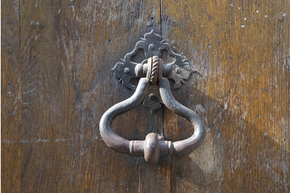
Façade antérieure, partie gauche, portail d'entrée : détail du heurtoir.

25, Besançon, 2, 4 rue des Granges, lieudit : îlot Bouteiller