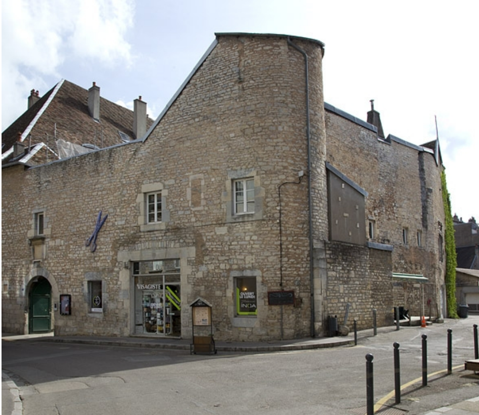
Façade latérale droite : de trois quarts droit.

25, Besançon, 2, 4 rue des Granges, lieudit : îlot Bouteiller