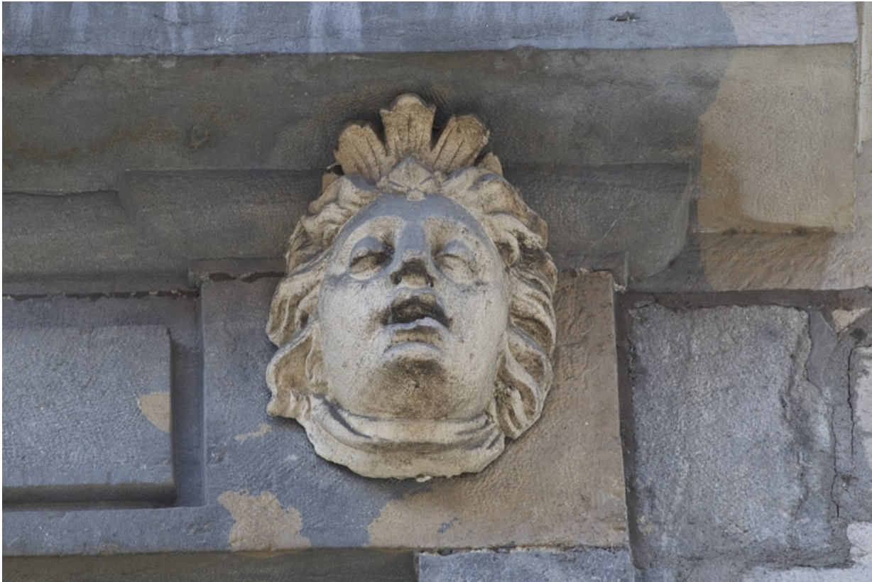
Façade antérieure, partie droite, première fenêtre de l'étage à partir de la droite : détail du mascaroon droit. 25, Besançon, 2, 4 rue des Granges, lieudit : îlot Bouteiller