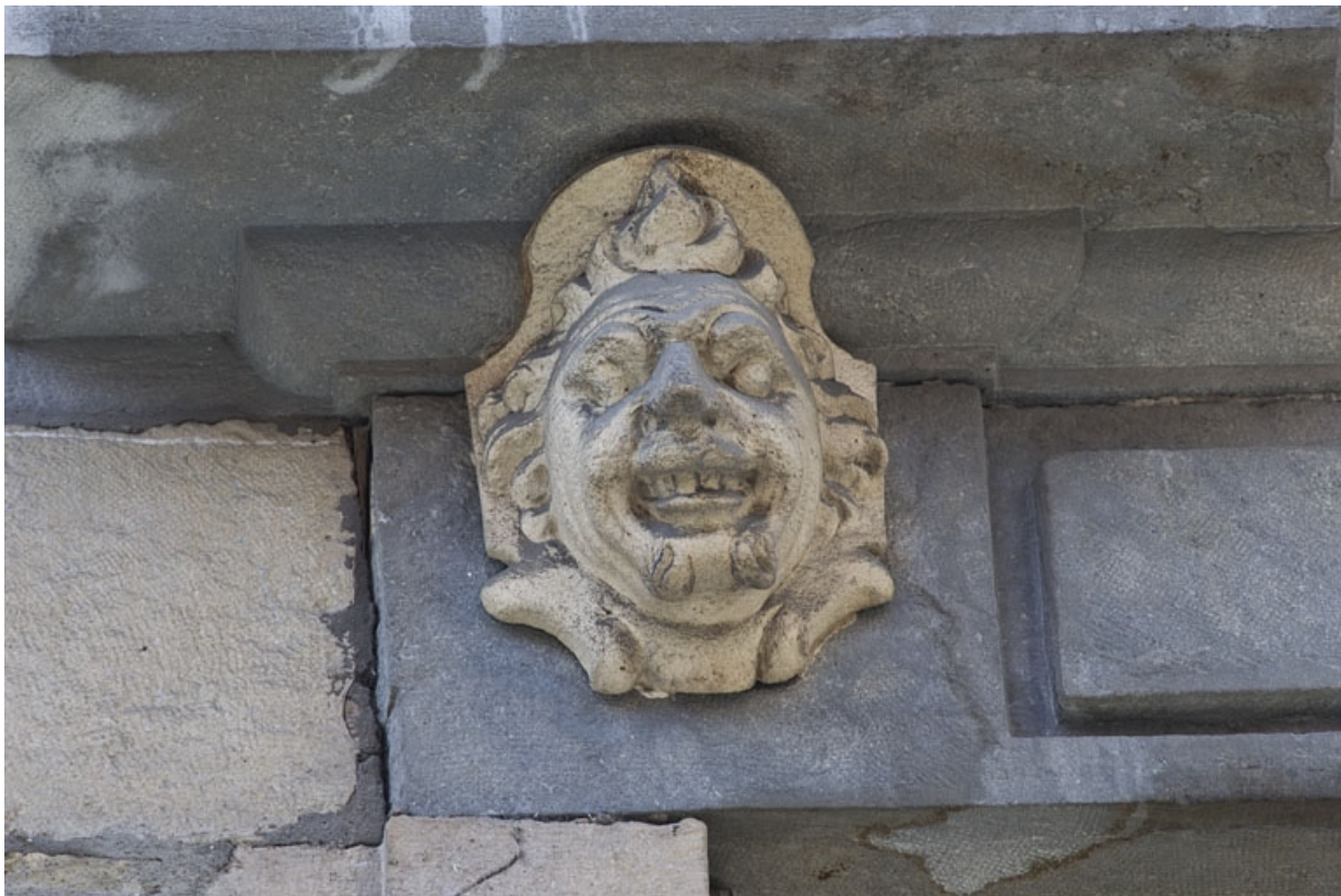
Façade antérieure, partie droite, deuxième fenêtre de l'étage à partir de la droite : détail du mascaroon gauche. 25, Besançon, 2, 4 rue des Granges, lieudit : îlot Bouteiller