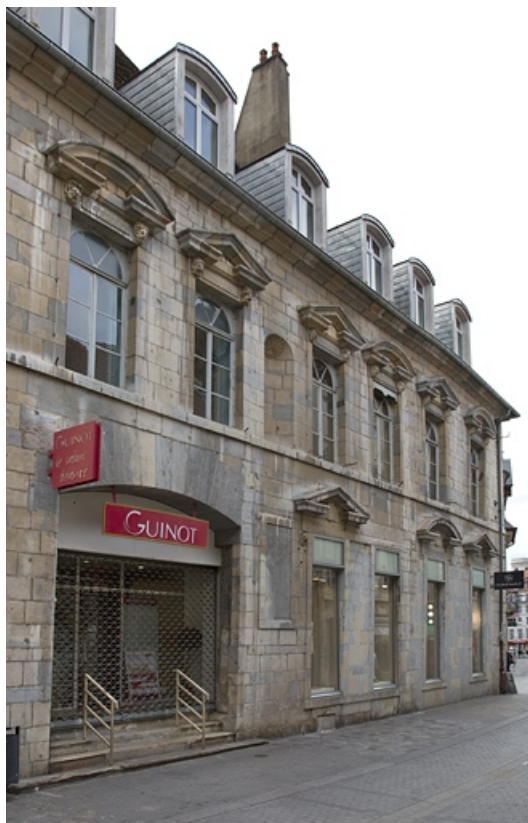
Façade antérieure : détail de la partie droite.

25, Besançon, 2, 4 rue des Granges, lieudit : îlot Bouteiller