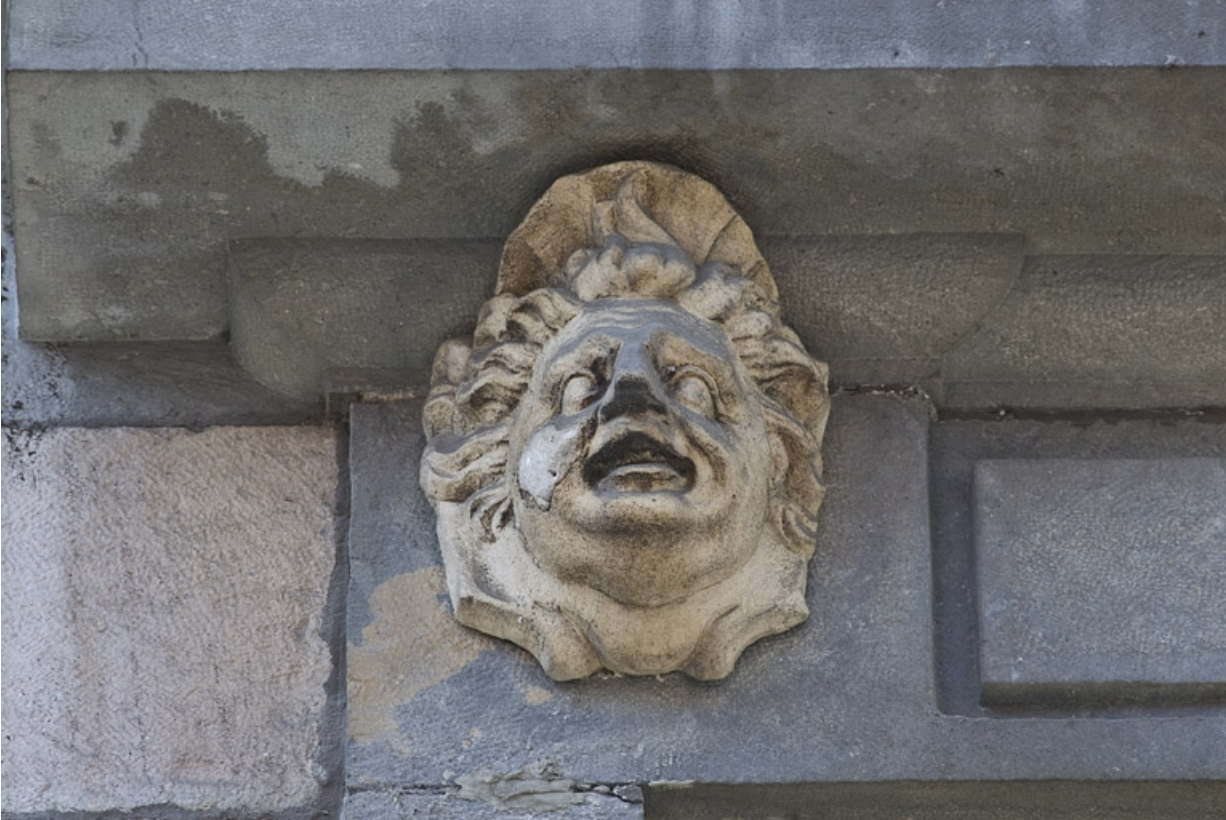
Façade antérieure, partie droite, première fenêtre de l'étage à partir de la droite : détail du mascaroon gauche. 25, Besançon, 2, 4 rue des Granges, lieudit : îlot Bouteiller