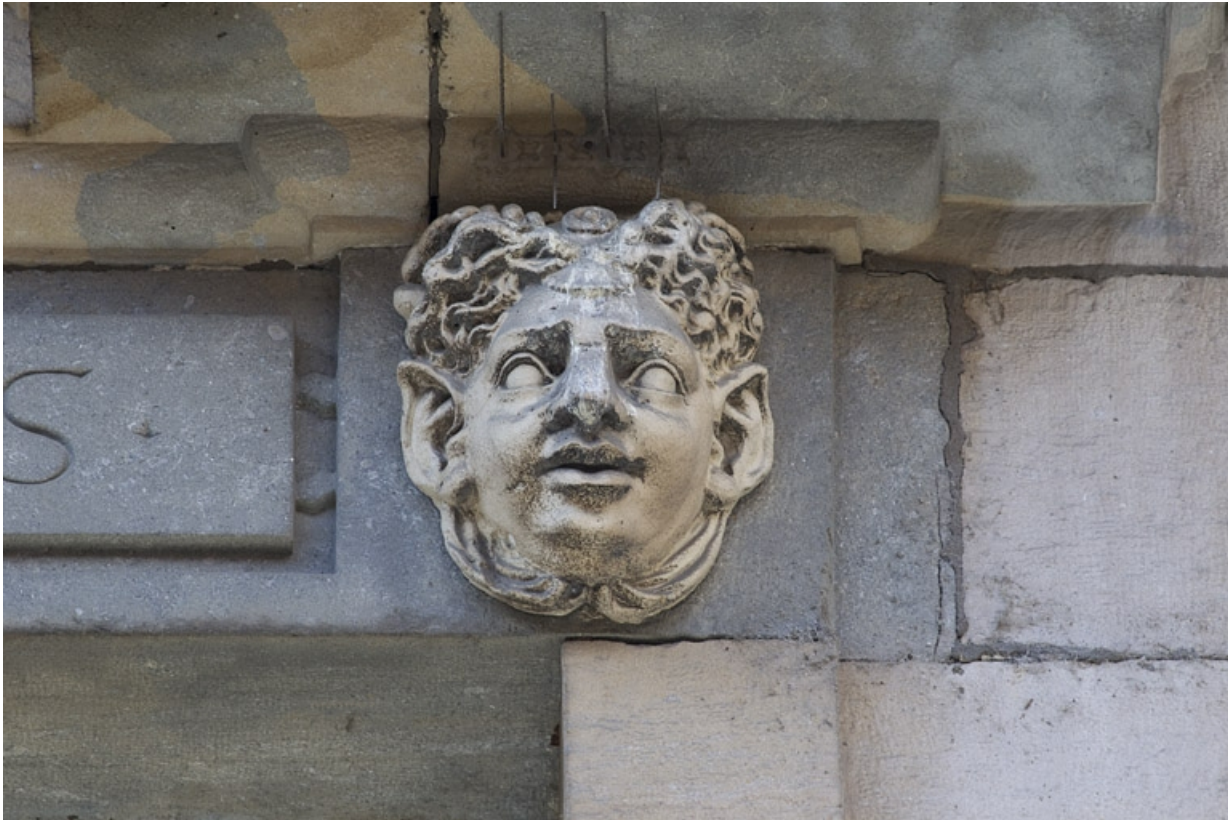
Façade antérieure, partie droite, quatrième fenêtre de l'étage à partir de la droite : détail du mascaroon droit. 25, Besançon, 2, 4 rue des Granges, lieudit : îlot Bouteiller