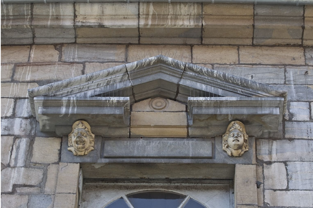
Façade antérieure, partie droite, deuxième fenêtre de l'étage à partir de la droite : détail du fronton triangulaire. 25, Besançon, 2, 4 rue des Granges, lieudit : îlot Bouteiller