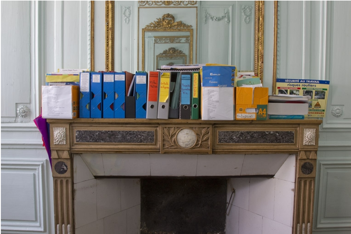
Intérieur, salon : détail de la cheminée.

25, Besançon, 2, 4 rue des Granges, lieudit : îlot Bouteiller