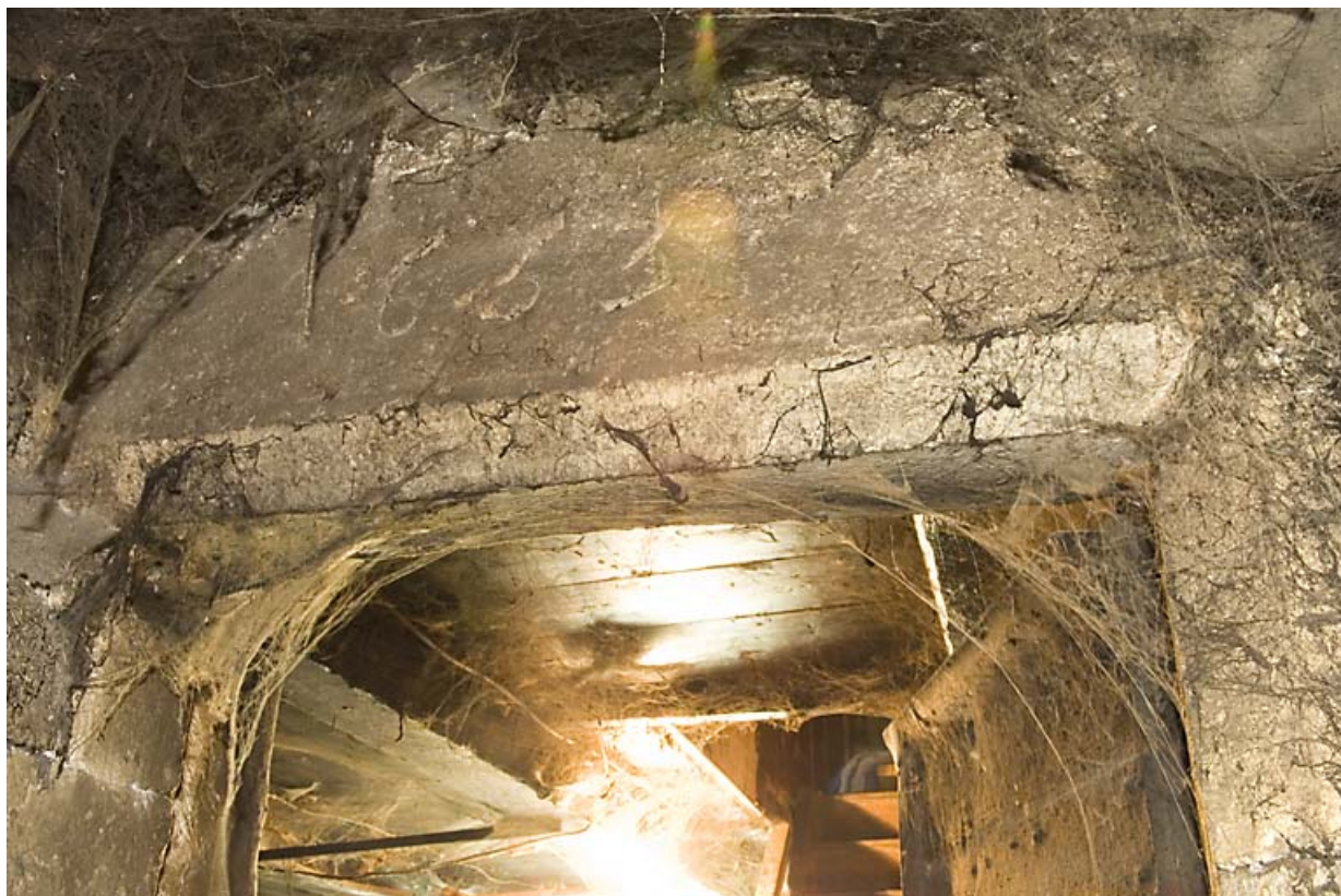
Linteau de porte daté 1653.

25, Jougne, 8 rue du Bois, lieudit : les Maillots