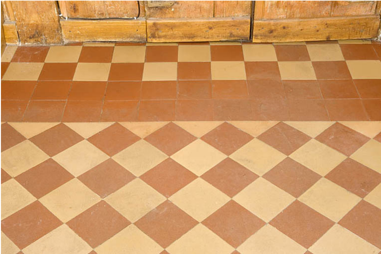
Cuisine du rez-de-chaussée : carreaux au sol. 25, Jougne, 12 route des Alpes