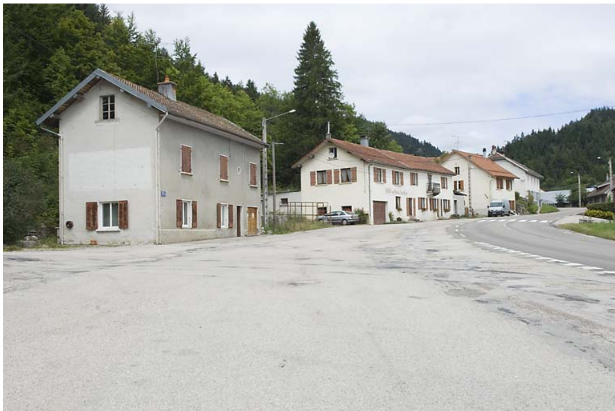
Vue générale, depuis le sud.

25, Jougne, 12 route de Vallorbe, lieudit : les Tavins