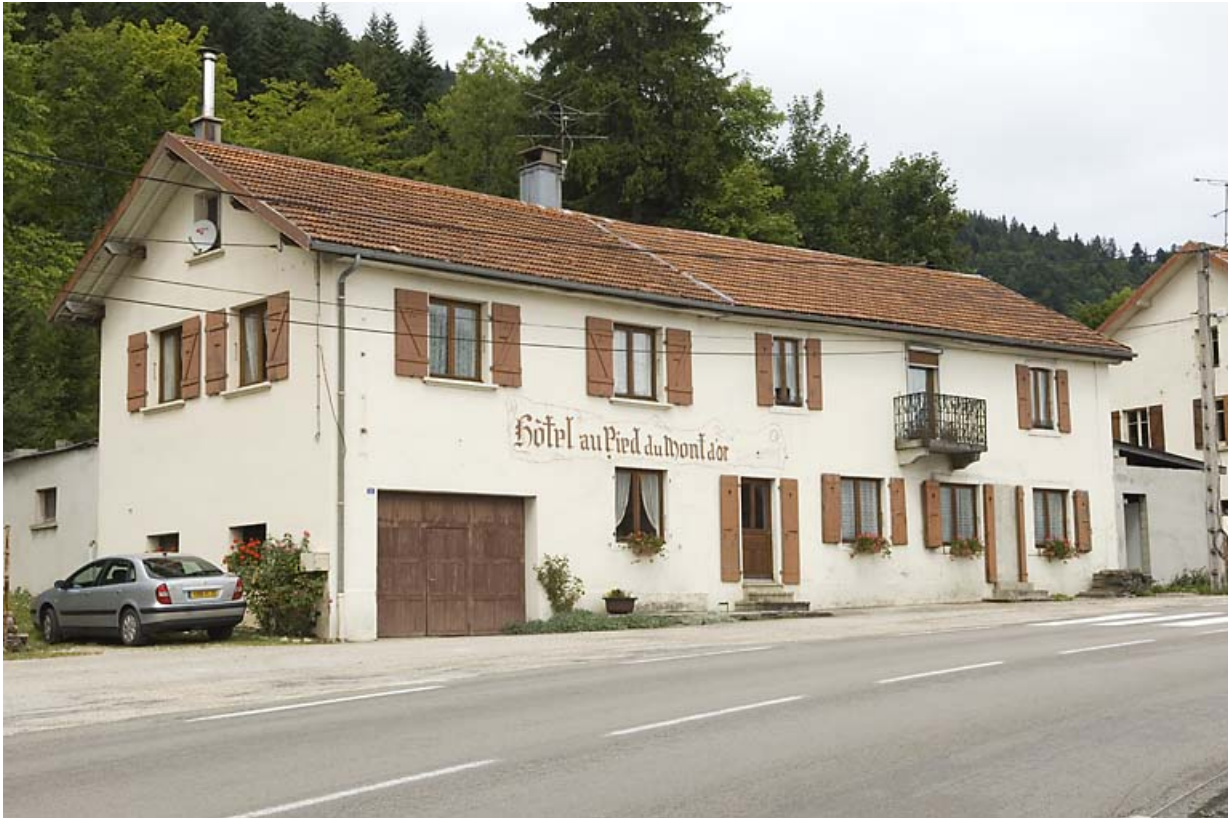
Façade antérieure, de trois quarts gauche.

25, Jougne, 12 route de Vallorbe, lieudit : les Tavins