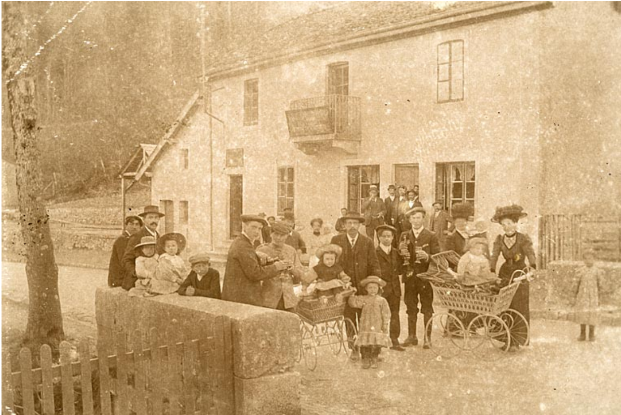
[Vue générale de l'hôtel de voyageurs]

25, Jougne, 12 route de Vallorbe, lieudit : les Tavins