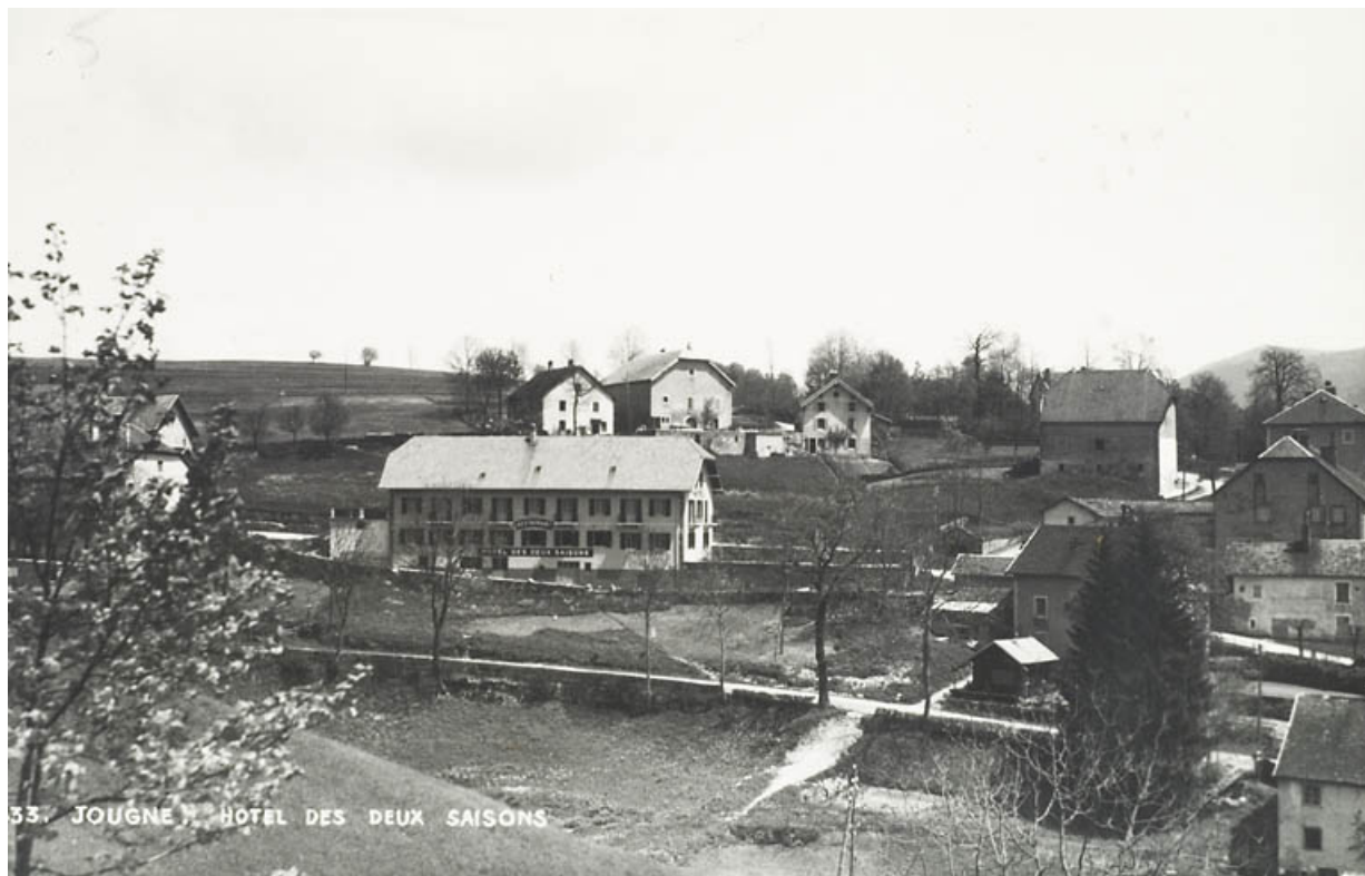
Jougne. Hôtel des Deux Saisons, [3e quart 20e siècle].