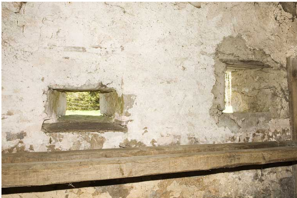
Intérieur, la chambre à lait ou "laitier" et deux baies fromagères. 25, Jougne, lieudit : la Bécasse